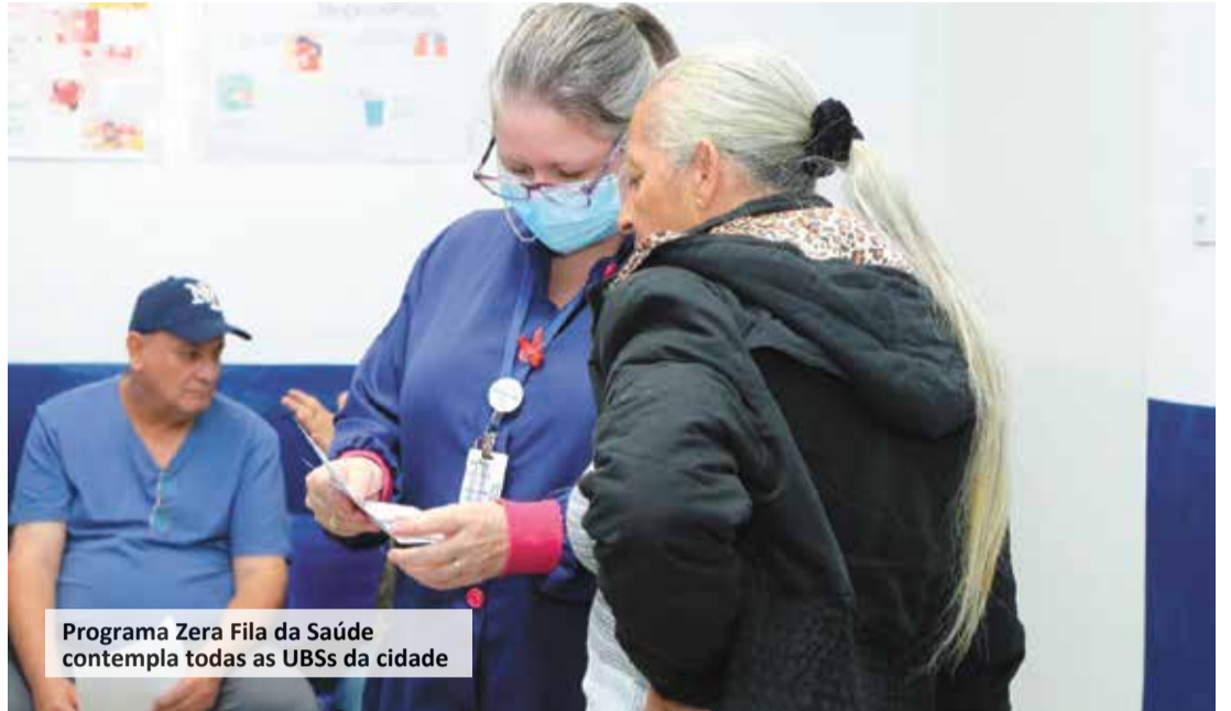
Programa Zera Fila da Saúde contempla todas as UBSs da cidade

O Zera Fila já atendeu 1387 pessoas somente na edição promovida nos meses de maio e junho deste ano.