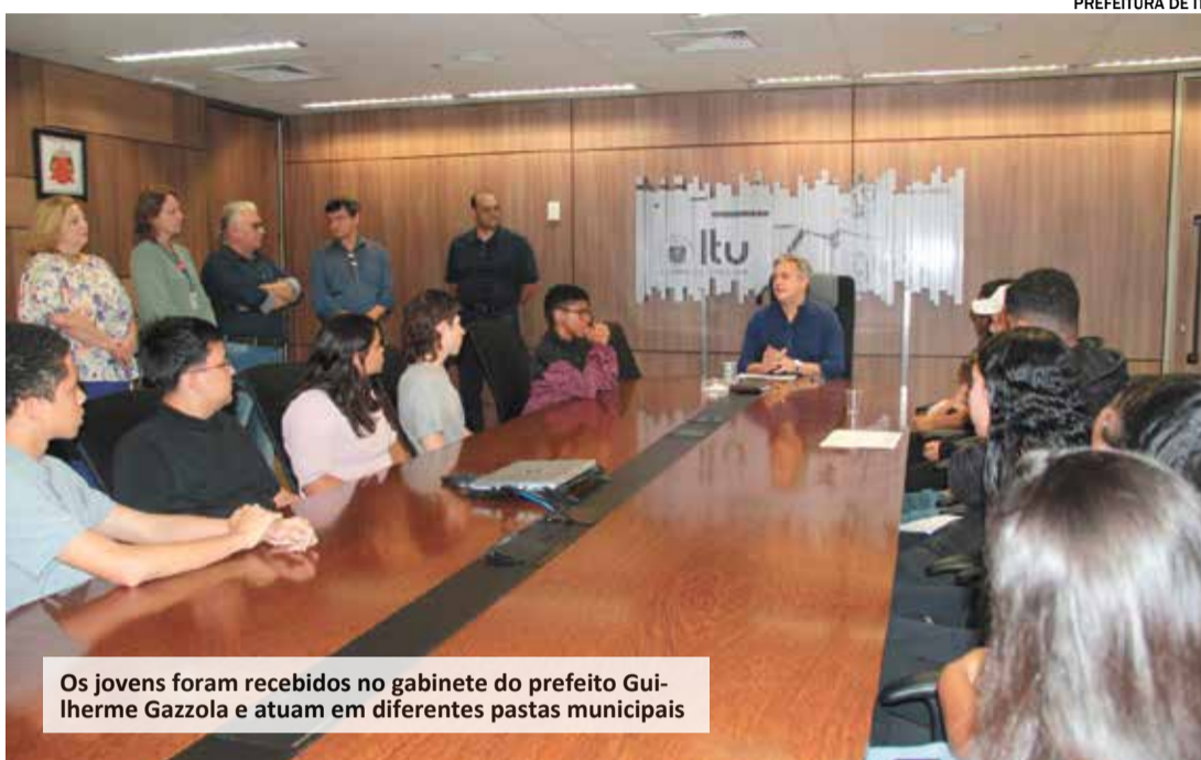
Os jovens foram recebidos no gabinete do prefeito Guilherme Gazzola e atuam em diferentes pastas municipais

A ação é uma parceria entre a Fundação Indaiatubana de Educação e Cultura (Fiec) e a Prefeitura de Itu, por meio do Programa Novotec Integrado, do Governo do Estado de São Paulo.