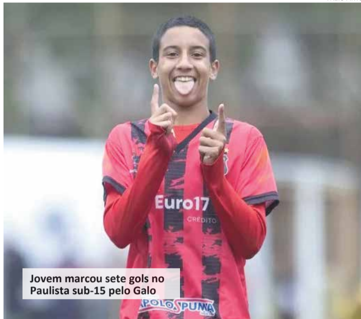
Jovem marcou sete gols no Paulista sub-15 pelo Galo

“A hora que recebi a notícia estava jantando. Um