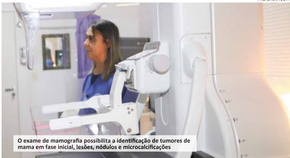
O exame de mamografia possibilita a identificação de tumores de mama em fase inicial, lesões, nódulos e microcalcificações

A Secretaria Municipal de Saúde realiza durante o mês de outubro atividades e atendimentos para o acolhimento às mulheres. São promovidas ações educativas para a população em virtude do Outubro Rosa. Além disso, diversas atividades serão realizadas pela pasta, em alusão ao tema.