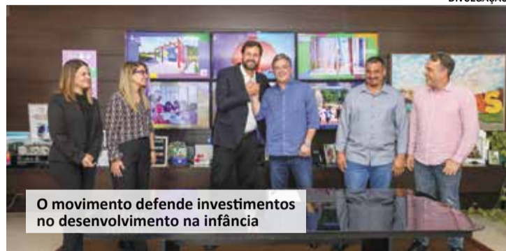
O movimento defende investimentos no desenvolvimento na infância