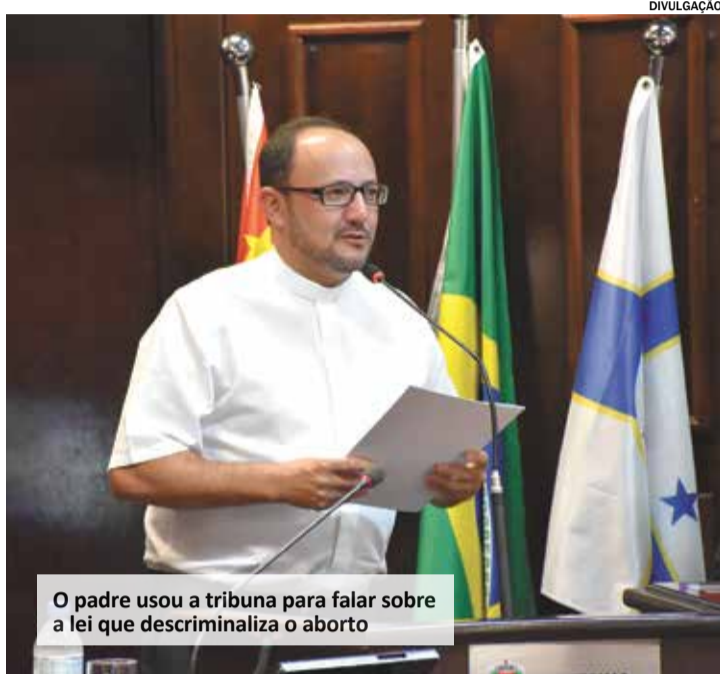
O padre usou a tribuna para falar sobre a lei que descriminaliza o aborto

uniram para promover o evento “Eu Abraço a Vida, realizado no dia 7 de outubro, na Praça Padre Miguel (Praça da Matriz). No evento, diversas pastorais, movimentos e instituições que atuam em defesa da vida, realizaram ações, com tendas temáticas que contavam com a participação de sacerdotes, diáconos, especialistas e voluntários.