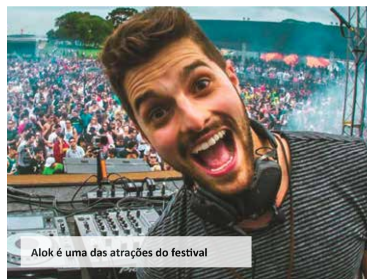
Alok é uma das atrações do festival