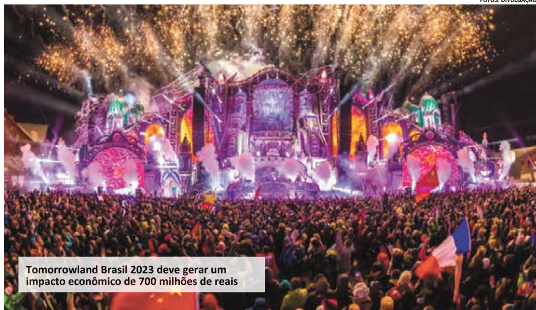
Tomorrowland Brasil 2023 deve gerar um impacto econômico de 700 milhões de reais

A segurança dos participantes também está garantida, segundo os organizadores. O Centro de Controle do Evento terá representantes de diversas áreas como a segurança, a mobilidade,