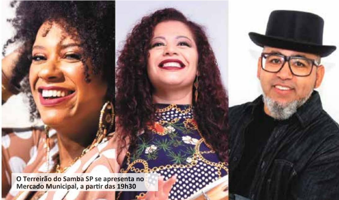
O Terreirão do Samba SP se apresenta no Mercado Municipal, a partir das 19h30

O Empório Cultural é uma realização da Prefeitura de Itu, por meio da Secretaria Municipal de Cultura e do Patrimônio Histórico, que busca resgatar a importância histórica do Mercado Municipal, promovendo ações culturais e artísticas em sua área interna. Além do show exclusivo, o público poderá aproveitar o melhor da gas-