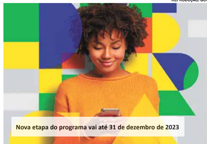
Nova etapa do programa vai até 31 de dezembro de 2023