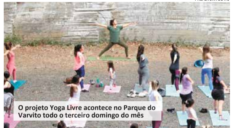
O projeto Yoga Livre acontece no Parque do Varvito todo o terceiro domingo do mês