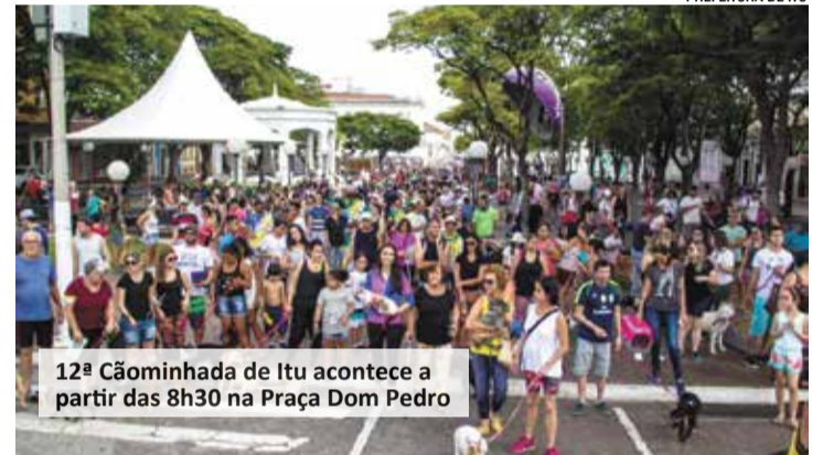
12ª Cãominhada de Itu acontece a partir das 8h30 na Praça Dom Pedro