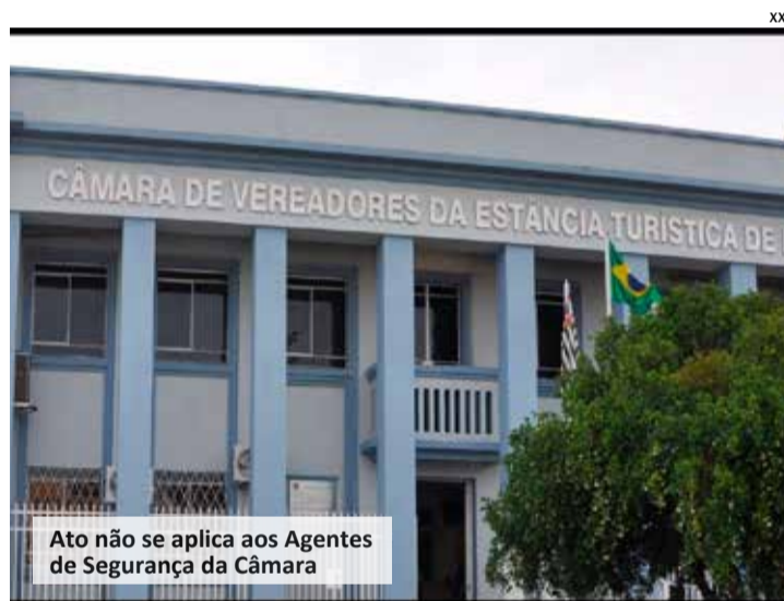
Ato não se aplica aos Agentes de Segurança da Câmara