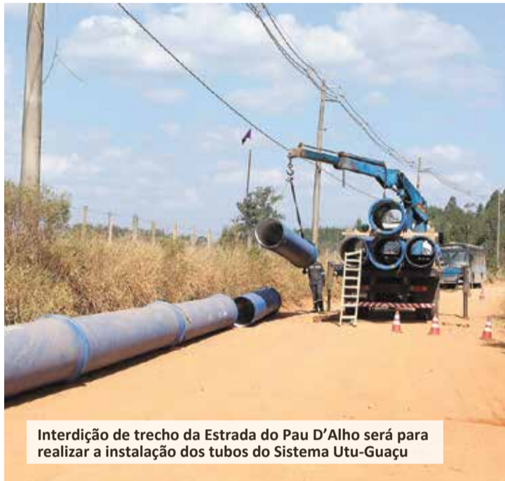
Interdição de trecho da Estrada do Pau D'Alho será para realizar a instalação dos tubos do Sistema Utu-Guaçu

O novo Sistema Utu-Guaçu fornecerá 600 litros de água por segundo, em qualquer época do ano, por