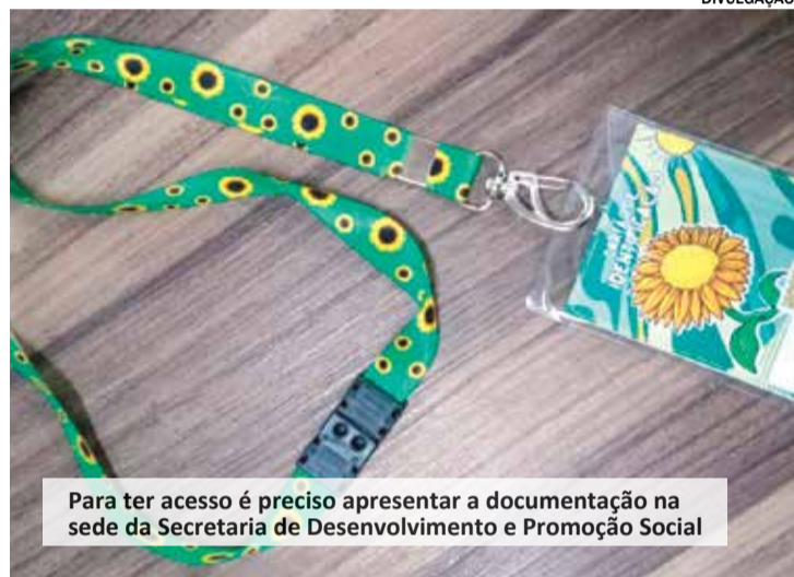
Para ter acesso é preciso apresentar a documentação na sede da Secretaria de Desenvolvimento e Promoção Social

Entre as doenças, deficiências e/ou transtornos ocultos é possível citar: TDAH; Doenças cognitivas; Doenças auditivas; Síndrome de Tourette; Doença de Chron; Visão monocular; Visão subnormal; pacientes ostomizados; Transtornos psiquiátricos, Deficiência intelectual; Fibrose cística; Asma; Câncer; Doenças cardíacas; Doença de Parkinson; Lúpus.