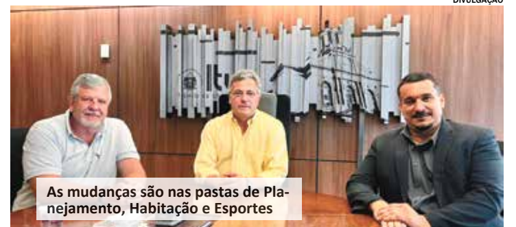
As mudanças são nas pastas de Planejamento, Habitação e Esportes