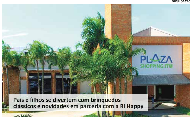
Pais e filhos se divertem com brinquedos clássicos e novidades em parceria com a Ri Happy

Nesta sexta, sábado e domingo, dias 29 e 30/9 e 1º/10, o Plaza Shopping Itu realiza uma nova edição do “Quintal do Plaza”, em parceria com a Ri Happy do Shopping Itu, com entrada gratuita.