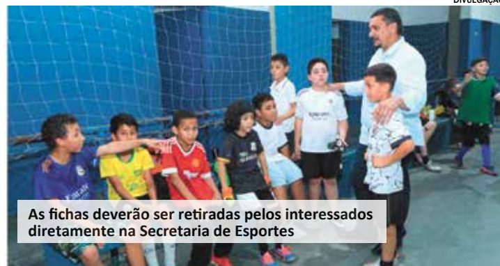
As fichas deverão ser retiradas pelos interessados diretamente na Secretaria de Esportes

letivo semelhante ao futebol de campo, mas possui suas peculiaridades. A modalidade tem regras específicas e diferencia-se, por exemplo, pelo número de jogadores, 5 em cada equipe, e pelas dimensões do espaço de jogo. Também chamado futebol de salão, é mais dinâmico e veloz que o futebol clássico. O objetivo é marcar gols. O time que tiver feito mais gols no tempo de jogo irá ganhar a partida.