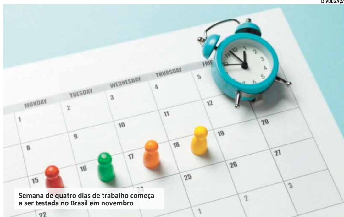
Semana de quatro dias de trabalho começa a ser testada no Brasil em novembro

Isso porque a proposta é reduzir a jornada de trabalho a 32 horas semanais, e o novo arranjo pode ser feito de três maneiras: tirar a segunda-feira; tirar a sexta-feira; ou reduzir a carga horária de todos os dias. O projeto tem como intenção utilizar a lógica do "100-80-100", ou seja, 100% do salário,