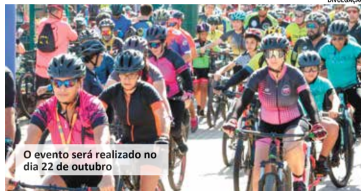
O evento será realizado no dia 22 de outubro

É importante ressaltar que é obrigatório o uso de equipamentos de segurança.