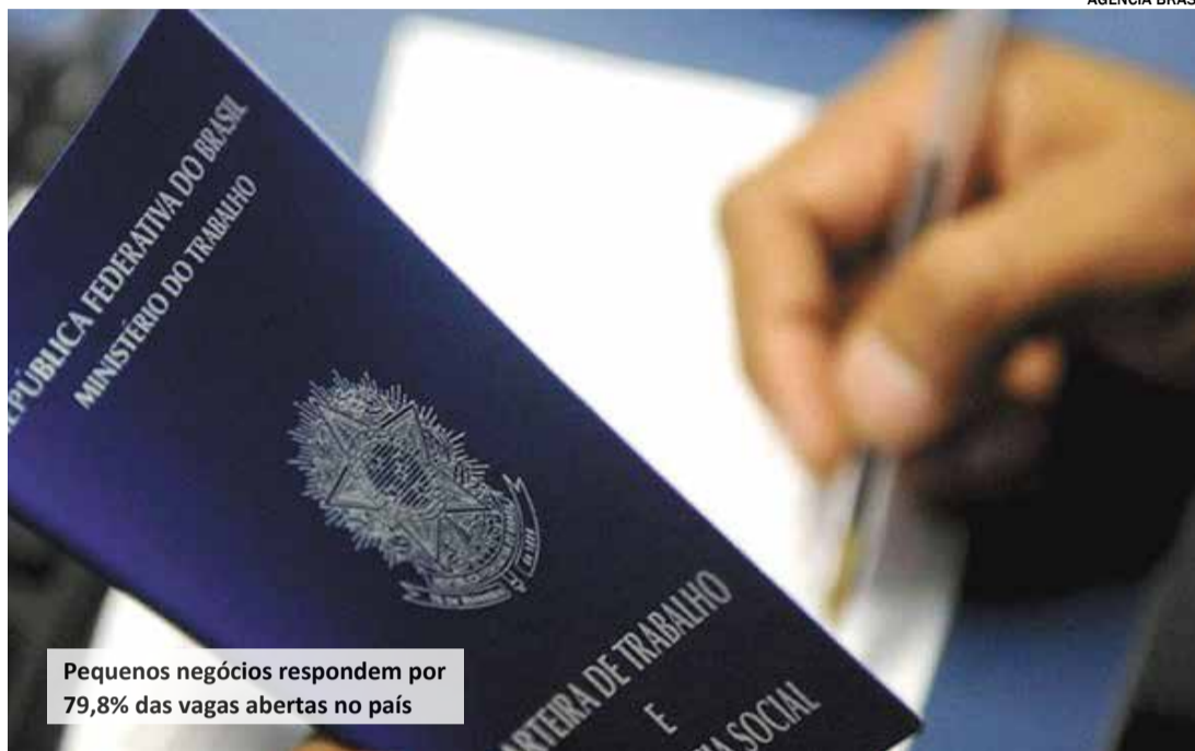
Pequenos negócios respondem por 79,8% das vagas abertas no país

No levantamento do Sebrae, são consideradas microempresas as firmas com até nove empregados (agropecuária, comércio e serviço) ou 19 funcionários (indústria e mineração). Pequenas empresas são as que têm até 49 trabalhadores (agropecuária, comércio e