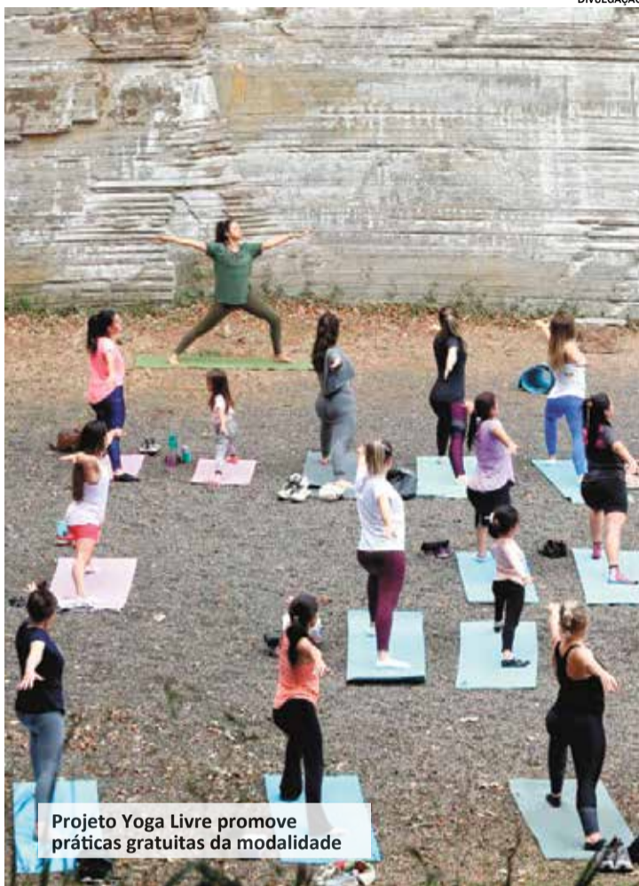
Projeto Yoga Livre promove práticas gratuitas da modalidade

O parque fica na Rua Parque do Varvito, 400, bairro Nossa Senhora Candelária.