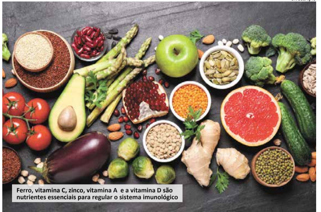
Ferro, vitamina C, zinco, vitamina A e a vitamina D são nutrientes essenciais para regular o sistema imunológico