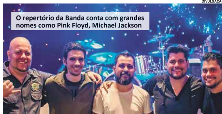
O repertório da Banda conta com grandes nomes como Pink Floyd, Michael Jackson