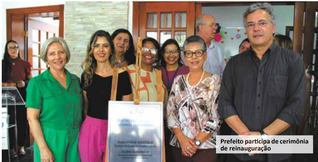
Prefeito participa de cerimônia de reinauguração

O Centro Dia para Idosos “Agenor Bernardini”, localizado na região central da cidade, e o Centro Dia para Idosos “Quero Vida”