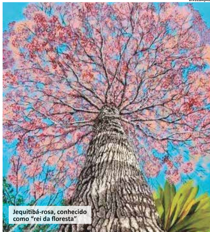
Jequitibá-rosa, conhecido como “rei da floresta”

A Fundação SOS Mata Atlântica promove manhã (16) das 9h às 13h, mais uma edição do tradicional Porteira Aberta. Realizado desde 2010, o evento convida o público a conhecer a sede da organização, o Centro de Experimentos Florestais SOS Mata Atlântica. Sob o tema “Árvores da Mata Atlântica”, este Porteira Aberta será uma oportunidade de os visitantes conhecerem mais sobre as árvores nativas do bioma e celebrar o Dia da Árvore, comemorado em 21 de setembro. A visita passará por diferentes espécies presentes no local, como o jequitibá-rosa, conhecido como “rei da floresta”, título conquistado por ser uma das árvores mais altas da flora brasileira, além de