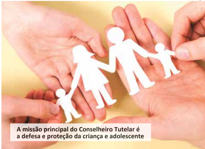
A missão principal do Conselheiro Tutelar é a defesa e proteção da criança e adolescente

Criado pelo Estatuto da Criança e do Adolescente (ECA), o Conselho Tutelar é um órgão permanente e autônomo que zela pelo cumprimento dos direitos da criança e do adolescente. A missão institucional consiste em representar a sociedade na defesa dos direitos da população infantojuvenil, como o direito à vida, à saúde, à educação, ao lazer, à liberdade, à cultura e à convivência familiar e comunitária. O Conselho Tutelar pode aplicar medidas tais como, orientação, apoio e acompanhamento temporários; matrícula em escolas próximas a casa do menor e acompanhamento da frequência obrigatória em unidades de ensino; inclusão em serviços e programas oficiais de renda e benefícios; requisição de tratamento médico, psicológico ou psiquiátrico, em regime hospitalar ou ambulatorial, atuar em caso de