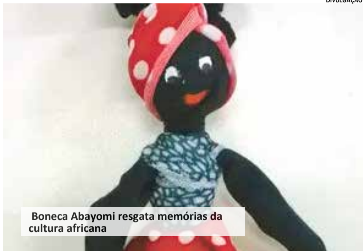
Boneca Abayomi resgata memórias da cultura africana

DA REDAÇÃO redacao@maiseexpressao.com.br