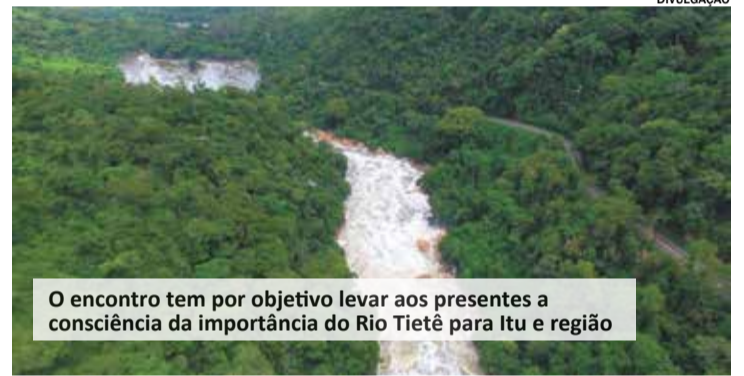
O encontro tem por objetivo levar aos presentes a consciência da importância do Rio Tietê para Itu e região