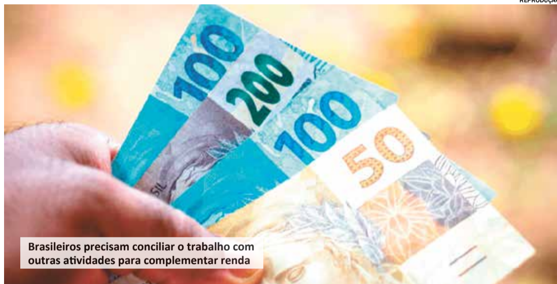
Brasileiros precisam conciliar o trabalho com outras atividades para complementar renda

Um estudo realizado pelo Instituto Cidades Sustentáveis em parceria com o Inteligência em Pesquisa