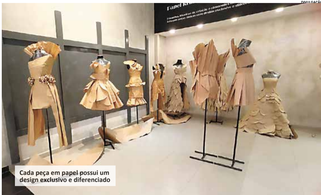
Cada peça em papel possui um design exclusivo e diferenciado

A exposição “Criação, Arte e Estilo - Roupas de Papel” é uma oportunidade