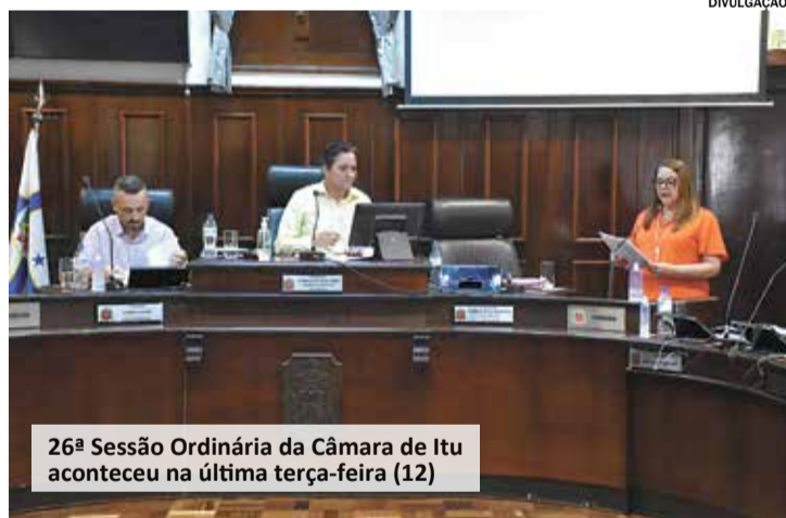
26ª Sessão Ordinária da Câmara de Itu aconteceu na última terça-feira (12)

A 26ª Sessão Ordinária de 2023 ocorreu na última terça-feira (12), com a presença de todos os vereadores