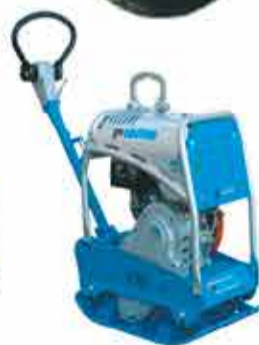
PLACA VIBRATÓRIA REVERSÍVEL