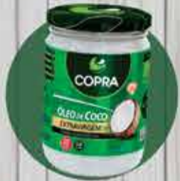
Óleo de coco Copra extravirgem R$ 32,00 - 500ml