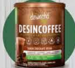
desinchofe 220gr de R$ 130,00 por R$ 99,00