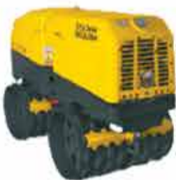
ROLO COMPACTADOR TELEGUIADO