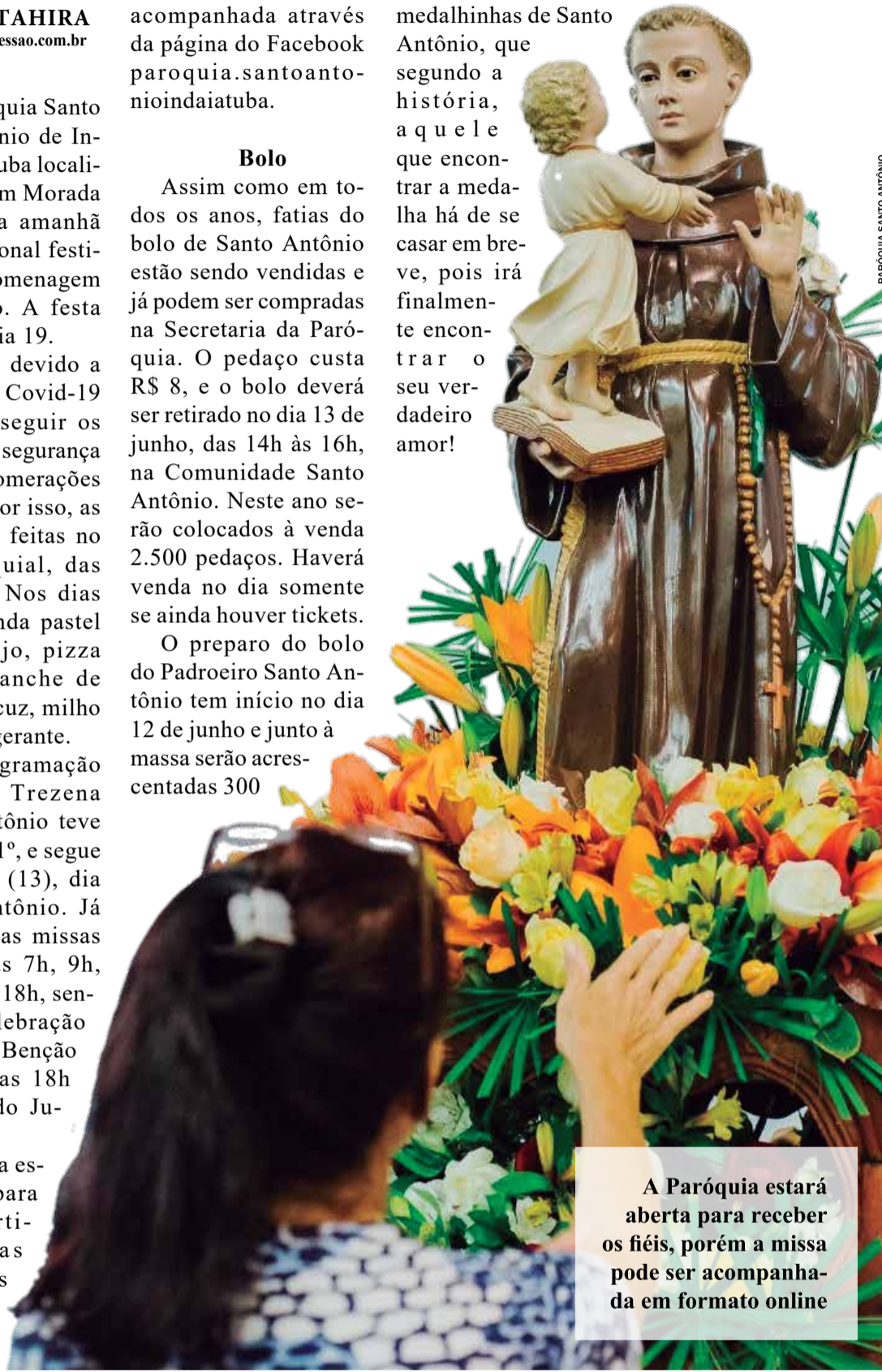
PARÓQUIA SANTO ANTÔNIO

medalhinhas de Santo Antônio, que segundo a história, aquele que encontrar a medalha há de se casar em breve, pois irá finalmente encontrar o seu verdadeiro amor!