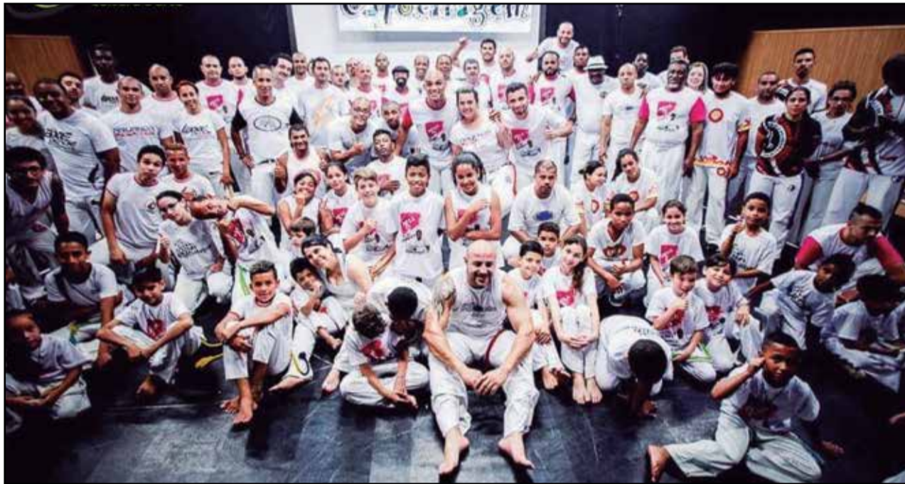
Artistas estrangeiros procuram o grupo Capoeiragem para se especializar na arte da Capoeira, que tem origem genuinamente brasileira

O grupo foi fundado em 2009 por Renato Mendonça