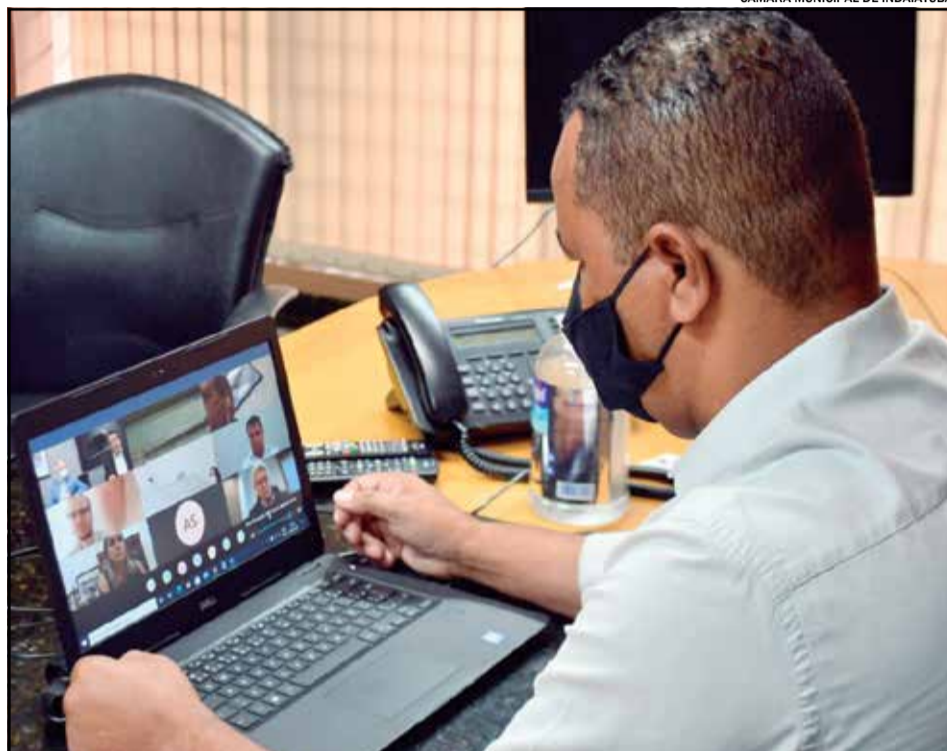
CÂMARA MUNICIPAL DE INDAIATUBA

Os participantes também abordaram a urgente