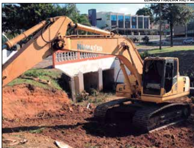
ELIANDO FIGUEIRA RIC/PMI

A obra também incluirá um reforço de galerias pluviais para melhorar a drenagem das águas de chuva