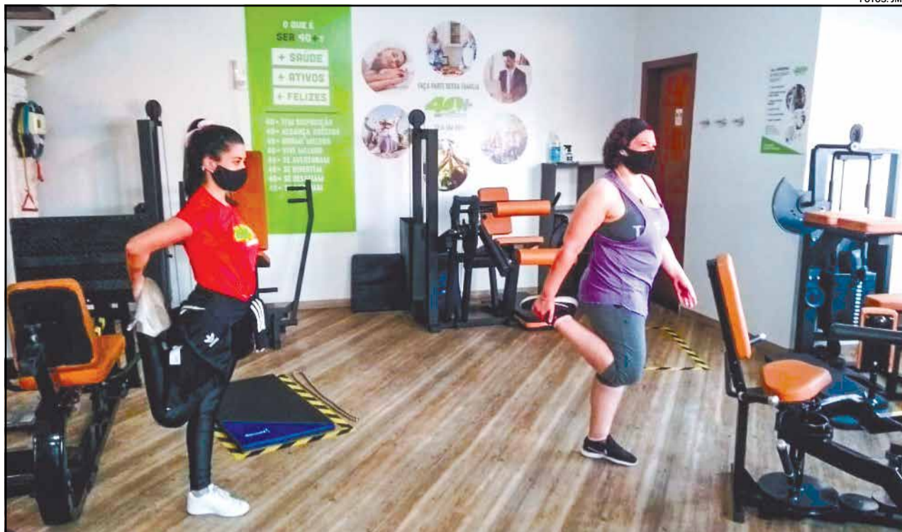
As atividades de musculação são praticadas com um tempo de duração definido e não por repetição de movimento