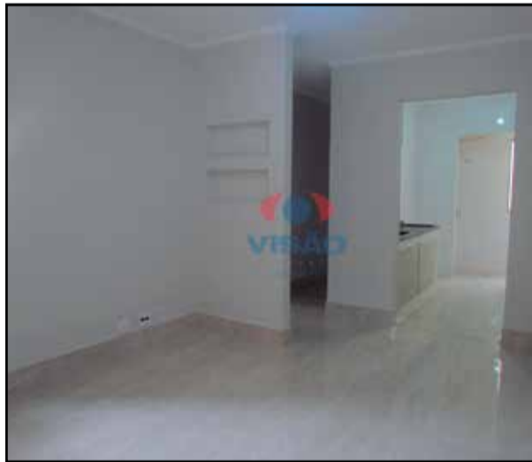
ref site 30767 - Apartamento Jardim Juliana - 3 dorm, sala, coz, banheiro 1 vaga R$ 1.600,00 + Cond + IPTU