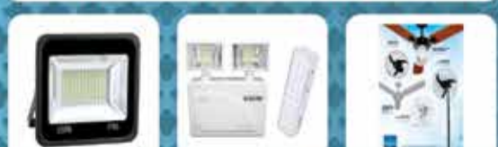
REFLETORES LUMINÁRIAS DE EMERGÊNCIA VENTILADORES