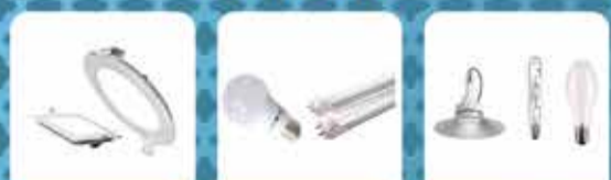
FLUOR DE ENFITE E BARRAS BARRAS E TUBULARES INDUSTRIAIS E COMERCIAIS