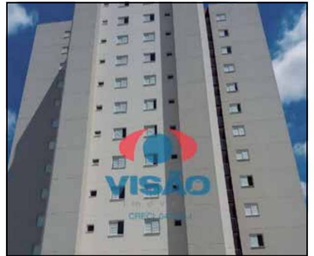
ref site 30719 - Apartamento Jardim Bela Vista - 3 dorm, 1 suíte, sala, coz, 2 vagas, área de lazer - R$ 2.000,00 + Cond + IPTU