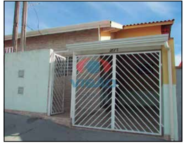
ref 9533 - Casa Jardim do Sol - 1 dorm, sala, coz, banheiro, área de serviço e garagem R$ 1.300,00 + IPTU