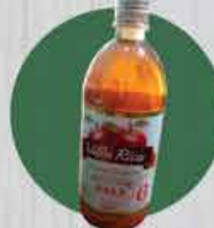
Vinagre de Maçã Villa Rica 750 ml (6% acidez) Imperdível De: 35,00 Por: 23,00