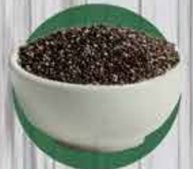
Semente de Chia R$ 1,45 - 100gr

*Promoção válida de 11/6 a 15/6 ou enquanto durar o estoque*