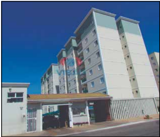
ref 30813 - Apartamento Vila Brizzola - 2 dorm, sala, coz, banheiro, área de serviço 1 vaga R$ 1.600,00 + Cond + IPTU