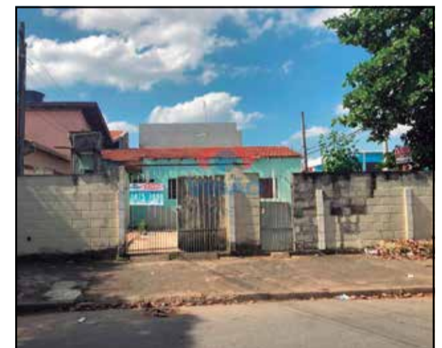
ref site 30650 - Terreno Jardim Nova Indaia- Lote de 155 m² comercial e residencial - R$ 250.000,00