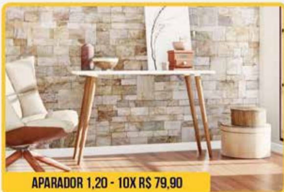
APARADOR 1,20 - 10X R$ 79,90

TUDO EM ATÉ 10X SEM JUROS NO CARTÃO (CARNE MEDIANTE À APROVAÇÃO)