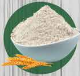
Farinha especial sem gluten R$2,70 - 100gr (granel)