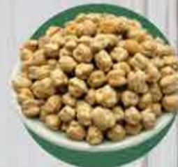
Grão de bico 12 mm importado R$ 1,45 - 100gr