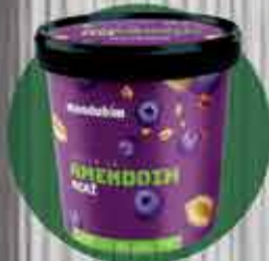
Pasta de amendoim Mandubim com açaí R$22,00 - 450gr