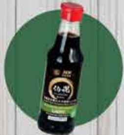
Molho Shoyu orgânico Light com fermentação 100% natural com 40% menos Sódio R$19,50