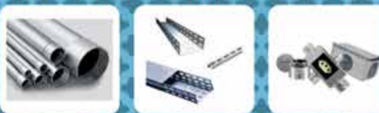
PERFILADO DE AÇO CURVAS E LINHAS PERILADO ESTRUCURAS E ACESSÓRIOS CONDULETES E ACESSÓRIOS