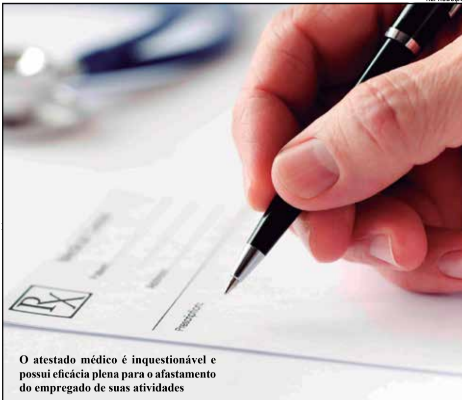
O atestado médico é inquestionável e possui eficácia plena para o afastamento do empregado de suas atividades

A dúvida surge de forma mais veemente quando, na mesma legislação, encontramos a previsão de que se o segurado empregado, por motivo de doença, afastar-se do trabalho durante quinze dias, retornando à atividade no décimo sexto dia, e se dela voltar a se afastar dentro de sessenta dias desse retorno em decorrência da mesma