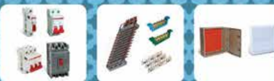
DISJUNTORES, DPS E DR BARRAMENTOS PERIL, TUBOS E PERILADO ESTRUCURAS DE MADEIRA QUADROS DE AÇO E PVC DE BARRAS E BARRAS