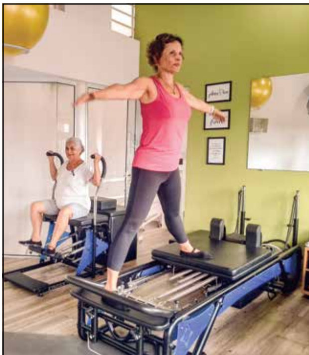
Pilates visa desenvolvimento de aptidões neuromotoras, cardiorrespiratórias e ainda as musculoesqueléticas

Condição prévia ou doença pré-existente são fatores de risco não apenas para a Covid-19