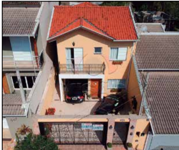
ref site 26264 - Casa Vila Verde- 04 dorm, sendo 1 suíte, sala, coz, banheiro e garagem para 3 carros R$ 530.000,00