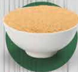
Açúcar Demerara R$ 0,60 - 100gr (granel)