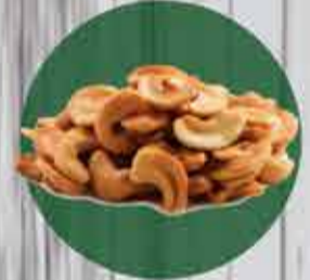
Castanha de Caju quebrada R$ 33,00 Pacote 500gr