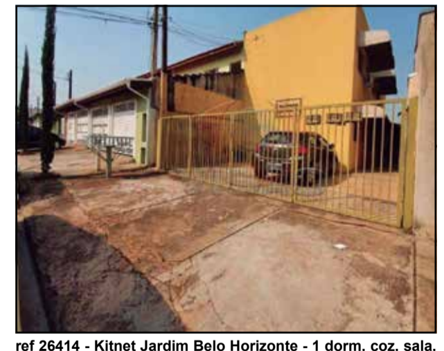
ref 26414 - Kitnet Jardim Belo Horizonte - 1 dorm, coz, sala, banheiro, lavanderia e 1 vaga de garagem - R$ 143.000,00 + IPTU

TODOS OS VALORES ACIMA ESTÃO SUJEITOS A ALTERAÇÕES