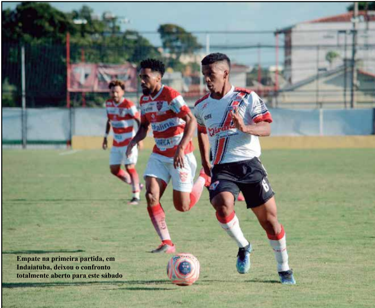
Empate na primeira partida, em Indaiatuba, deixou o confronto totalmente aberto para este sábado

"Será uma partida muito importante! Acho que a decisão está aberta, ambas as equipes têm plenas condições de conquistar o título. Creio que o segredo para a equipe chegar à decisão e conquistar o acesso - que era o principal