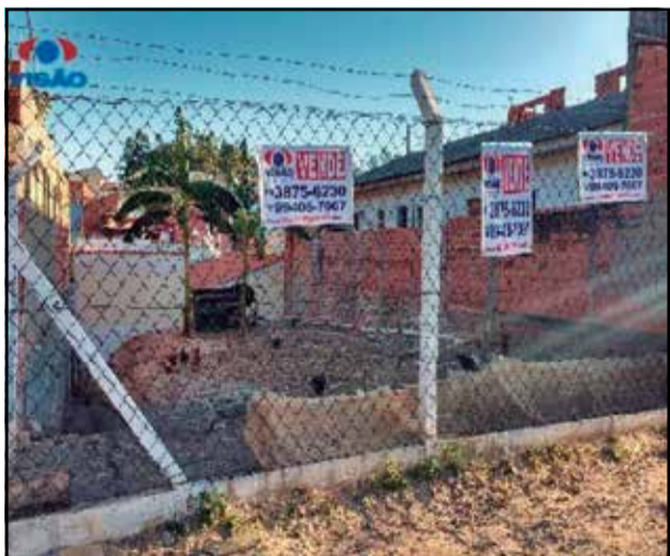
ref site 16086- Terreno Jardim Morumbi - Lote de 260 m² - R$ 160.000,00