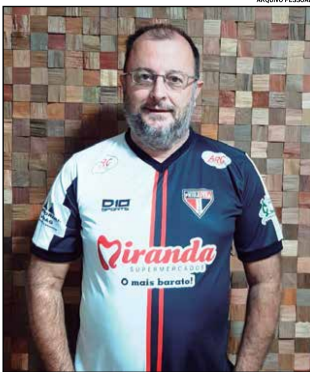
Apesar do acesso já conquistado, Barce diz que o título será a “cereja do bolo”

O último título ainda está na memória do torcedor primaverino. Foi contra o Comercial, em Ribeirão Preto, quando o Fantasma garantiu o “caneco” após virar o placar do jogo para 2 x 1, com dois gols no