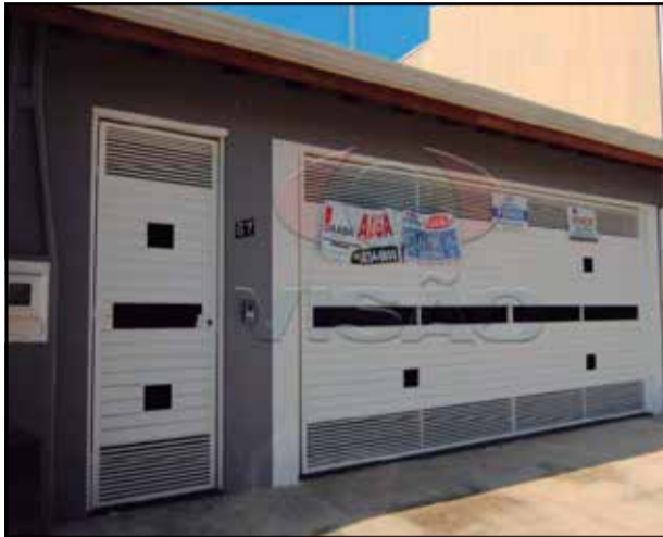
ref site 30798 - Casa no Parque Residencial Sábias - 3 dorm , sala, coz, banheiro, área de serviço e garagem com 2 vagas R$ 2.300,00 + IPTU