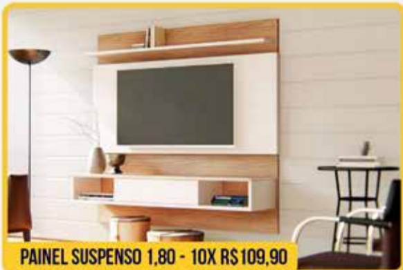
PAINEL SUSPENSO 1,80 - 10X R$109,90