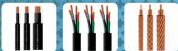
CABO DE COBRE 1KV - HEPR CABO DE COBRE 1KV - HEPR - PP CABO DE COBRE - 1KV