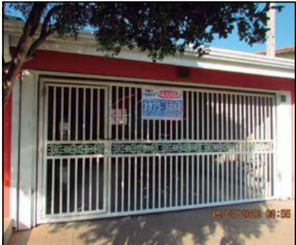
Ref 27863 - Casa Parque das Nações - 3 dorm, sala, coz, banheiro, área de serviço e garagem R$ 350.000,00