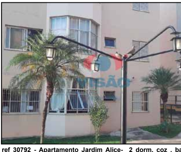
ref 30792 - Apartamento Jardim Alice- 2 dorm, coz, banheiro, área de serviço e 1 vaga de garagem coberta - R$ 240.000,00 + IPTU