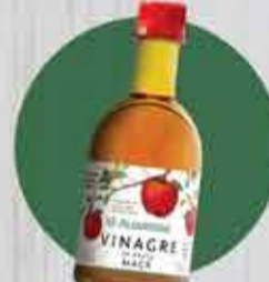
Vinagre de maçã Almaromi R$ 3,80 - 400ml