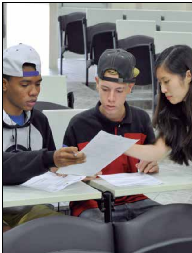
Vagas são para os cursos de Administração e Edificações

A Fiec (Fundação Indaiatubana de Educação e Cultura) vai abrir inscrições abertas para vagas remanescentes dos cursos técnicos que realiza em parceria com o Programa Pronatec.