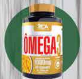
Omega3 ADA 60 capsulas de R$ 29,50 por R$ 21,00