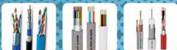
CABO DE FIBRA ÓPTICA COM 24 FIBRAS MONOMODAL TELEFONIA - ALARME CTV - COAXIAL - ESCUDO