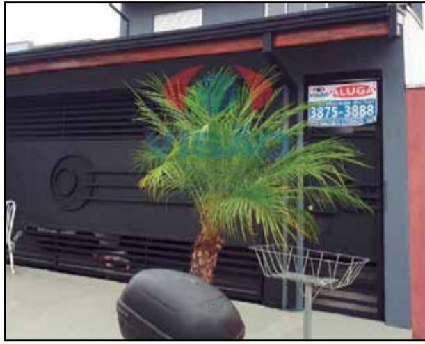
ref site 30761 - Casa Jardim Monte Carlo - 1 dorm , sala , coz , banheiro e área de serviço - R$ 1.100,00