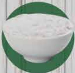
Fecula de Batata R$0,82 - 100gr (granel)

Pasta de Amendoim integral Mandubim 1kg R$ 18,50