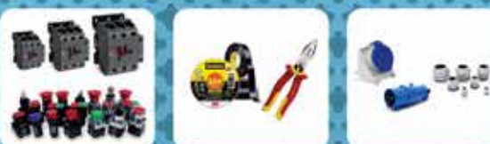
AUTOMAÇÃO E PROTEÇÃO RECAL SOLANTES E PREENCHIMENTOS TUBOS PERIL CABOS E BARRAS