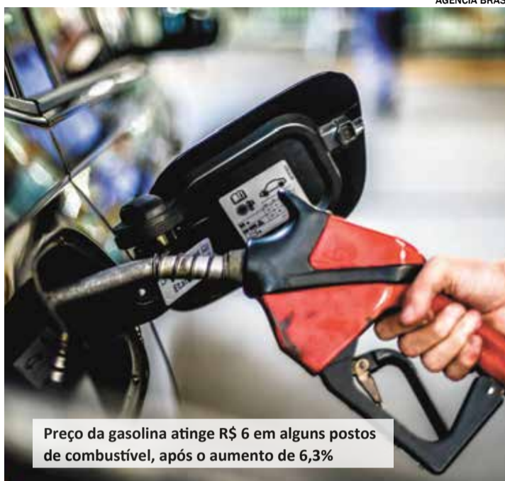
Preço da gasolina atinge R$ 6 em alguns postos de combustível, após o aumento de 6,3%

O professor ainda enfatiza que além do funcionamento do motor, o sistema de injeção eletrônica pode ser corroído pelos solventes e peças podem ficar ressecadas. "Se o automóvel apresentar falhas ao longo do tempo, dificuldades para ligar ou ficar 'engasgando', podem ser sinais de que o combustível utilizado estava adulterado. A gasolina adulterada também deixa o motor