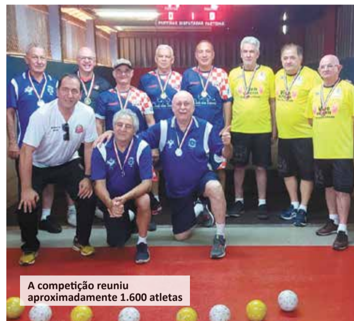
A competição reuniu aproximadamente 1.600 atletas

Os atletas ituanos participaram dos jogos da Melhor Idade nas seguintes modalidades: Atletismo, Bocha, Coreografia, Damas, Dança de Salão, Dominó, Malha, Natação, Tênis, Tênis de Mesa, Truco, Vôlei Adaptado e Xadrez. A competição, promovida pelo Governo Estadual, reuniu aproximadamente 1.600 atletas com idade mínima de 60 anos de