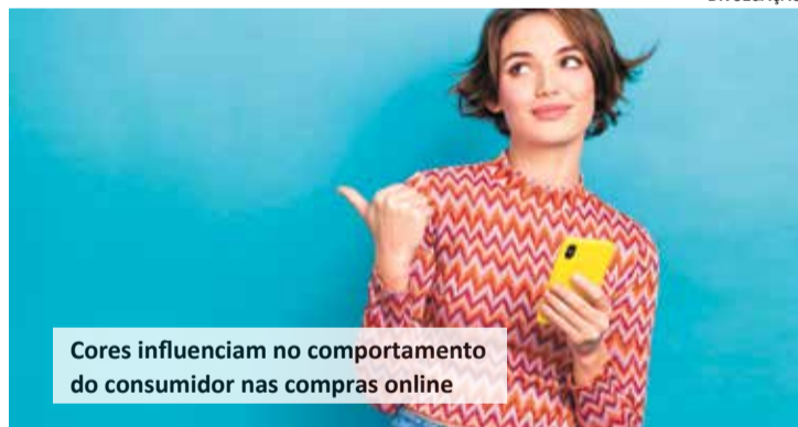
Cores influenciam no comportamento do consumidor nas compras online

Uma pesquisa do Centro Universitário de Brasília (CEUB), sugere que as cores desempenham um papel significativo no ato de comprar. O estudo intitulado "Variáveis de Atmosfera: Efeito da Cor do Ambiente em Padrões de Comportamento do Consumidor na Avaliação de Produtos", se