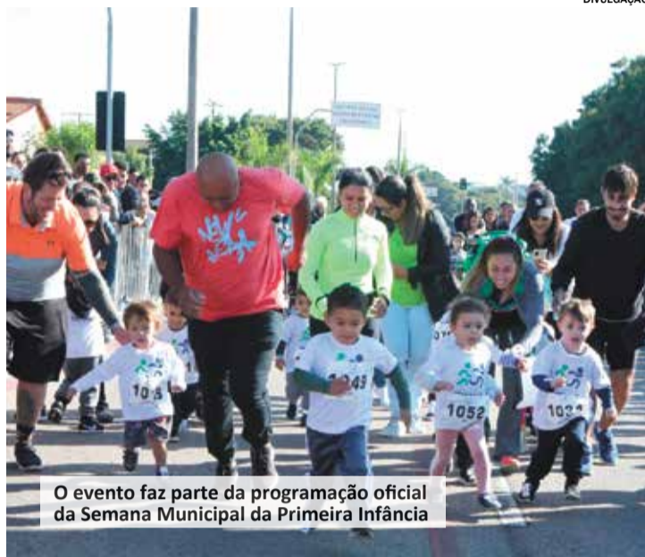
O evento faz parte da programação oficial da Semana Municipal da Primeira Infância

No dia 3 de setembro (domingo), a avenida Galileu Bicudo recebe a Corrida das Crianças. O evento gratuito, que já está com as inscrições abertas, faz parte da programação oficial da Semana Municipal da Primeira Infância. O evento esportivo, voltado para o incentivo da prática de atividades físicas pela criança, terá início às 9h, com as largadas acontecendo de forma escalonada, do menor para o maior. Os participantes deverão no local com pelo menos 45 minutos de antecedência ao seu horário de largada. Pais de crianças com até 4 anos de idade, deverão acompanhar seus filhos no trajeto. Os kits de participação serão entregues, exclusivamente, no dia anterior a realização da prova (sábado, 02/09), das 09 às 16h, na Prefeitura de Itu. O kit será composto de camiseta, número de peito e