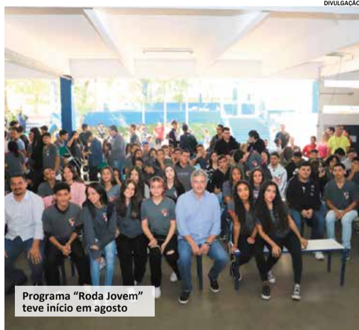
Programa “Roda Jovem” teve início em agosto

Durante o primeiro encontro, os estudantes abordaram questões relativas, por exemplo, ao sistema educacional no município, escolinhas de esportes mantidas pela Prefeitura, investimentos em infraestrutura hídrica, Itu Cartão Cidadão, programas destinados a pessoas em situação de rua, pavimentação asfáltica, empregabilidade, taxa de lixo, atendimento de urgência e emergência na saúde, transporte público, iluminação pública.