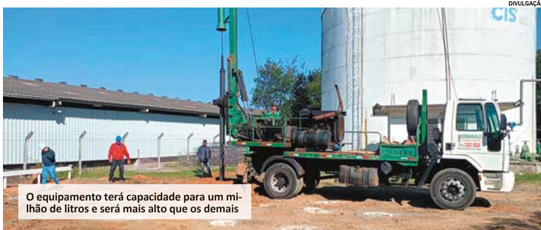
O equipamento terá capacidade para um milhão de litros e será mais alto que os demais

Desta forma, a CIS terá mais respaldo para o abastecimento dos bairros Jardim dos Ipês, Itaim I e II, Itaim Guaçu, Jardim São José, Vila São José, Veneto, Vila Lívia, Vila das Hortências, Vila Gabbai, Nossa Senhora da Candelária, Presidente Médici, Jardim Santa Tereza, Jardim Convenção, Jardim Alberto Gomes, Vila Esperança, Parque do Varvito, Portal da Vila Rica, Jardim Porto Seguro, Mayard, Nossa Senhora Aparecida, Jardim Fragnani, Vila Ianni, Vila Mariah e Residencial Oiti. A obra beneficia quase