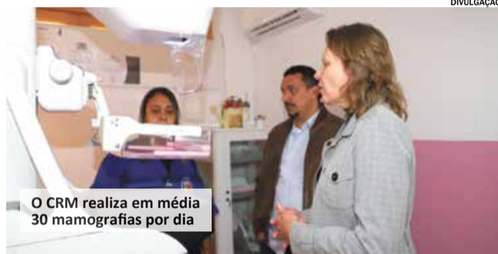
O CRM realiza em média 30 mamografias por dia

O CRM funciona de segunda a sexta-feira e realiza, em média, 30 mamografias por dia. Para se submeter ao exame é preciso ter indicação de médico da rede municipal de saúde.