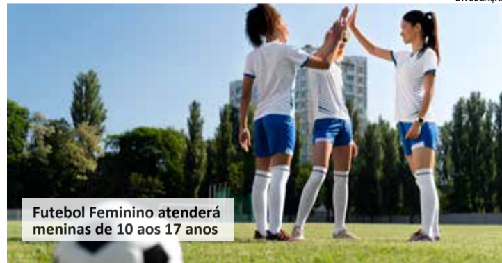
Futebol Feminino atenderá meninas de 10 aos 17 anos