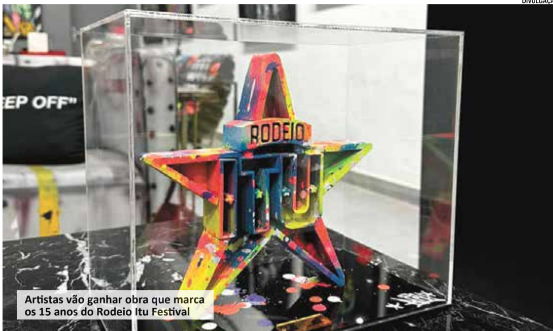
Artistas vão ganhar obra que marca os 15 anos do Rodeio Itu Festival

Um total de 12 esculturas serão entregues a todos os