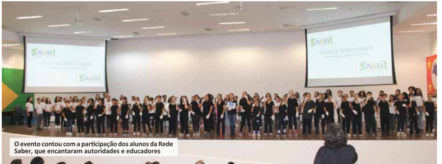
O evento contou com a participação dos alunos da Rede Saber, que encantaram autoridades e educadores

O evento contou com a participação dos alunos das unidades da Rede Saber, que encantaram autoridades e educadores com apresentações de música em Inglês (Rede Saber VI), do Projeto