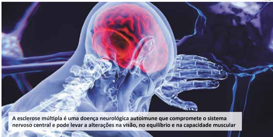
A esclerose múltipla é uma doença neurológica autoimune que compromete o sistema nervoso central e pode levar a alterações na visão, no equilíbrio e na capacidade muscular

A esclerose múltipla é uma doença neurológica autoimune que compromete o sistema nervoso central e pode levar a alterações na visão, no equilíbrio e na capacidade muscular. Por motivos genéticos ou ambientais o sistema imunológico começa a agredir a bainha de mielina (camada de gordura que envolve as fibras nervosas na substância branca do cérebro e na medula espinhal), comprometendo a função do sistema nervoso (cérebro e medula) ao atingir diversas funções ligadas ao trânsito de informações dos neurônios para o resto do corpo. Quando esse caminho é