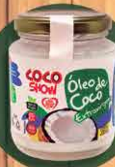
Óleo de Coco Coco Show Extra virgem R$14,80 - 200ml