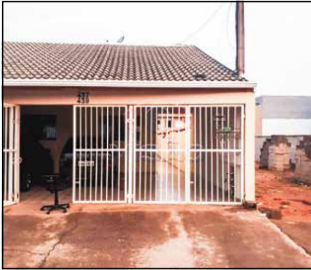
1. ref site 416012 - Casa Jardim Paulista II - 1 dormt/ sala/ coz/ WC / gar R$ 850,00