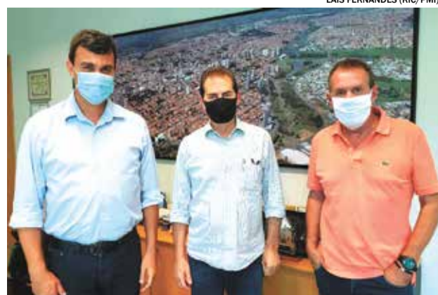
Desde 2018, Paulinho da Força já destinou mais de R$ 10 milhões em verbas para Indaiatuba

lhões para custeio de ações e serviços da média e alta complexidade; R$ 100 mil para a compra de equipamento para a Atenção Básica; R$ 400 mil para custeio de ações e serviços da Atenção Básica. Para a Educação foram R$ 2,8 milhões para construção de creche para 188 alunos e outra de R$ 2,2 milhões para construção de mais uma creche com capacidade para atender 92 alunos.