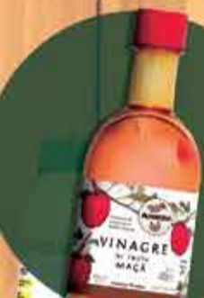
Vinagre de Maçã Almaromi R$2,85 - 400ml