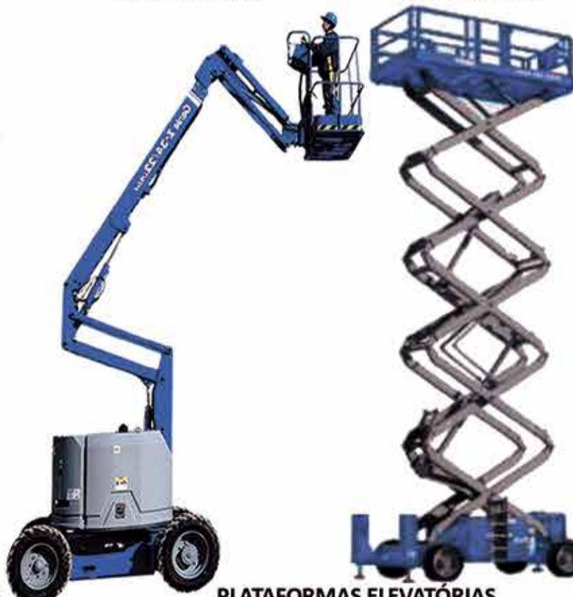
PLATAFORMAS ELEVATÓRIAS ARTICULADA E TESOURA