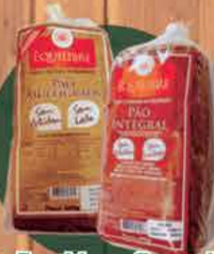
Pão Equilíbrio Sem glúten e Sem leite R$ 17,50

*Promoção válida de 20/11 até 24/11 ou enquanto durar o estoque