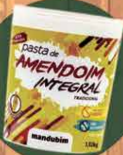
Pasta de Amendoim integral Mandubim R$17,50 - 1Kg