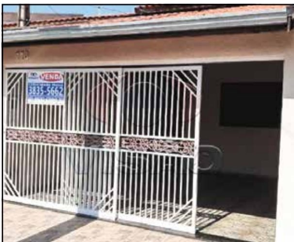
10 ref site 665012 - Casa Jardim Califórnia - 3 dormt/ 1 suíte/ sala/ coz/ WC / lavanderia / 2 gar R$ 270.000,00