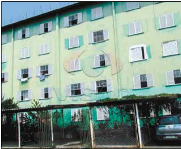
5 ref site 27501 - Apartamento CDHU - 2 dormt/ sala/ coz/ WC / lavanderia / gar R$ 750,00 + IPTU + COND.