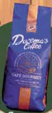
Café torrado gourmet em grão R$38,50 - 1Kg