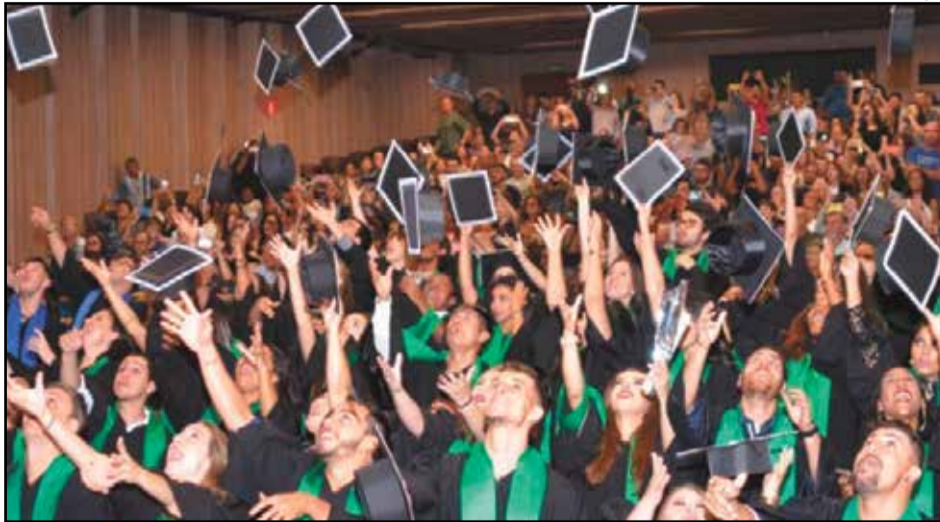
O Grupo UniEduK oferece mais de 25 opções de cursos diferentes nas áreas de Saúde, Humanas, Exatas, Tecnologia e Agronegócio

Outro ponto importante relacionado a conclusão do Ensino Superior foi levantado, recentemente pelo Instituto SEMESP (Sindicato das Entidades Mantenedoras de Estabelecimentos de