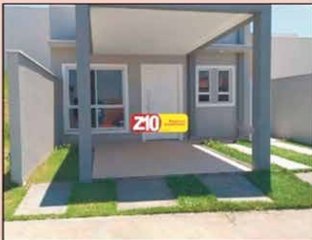
CA09050 - Jardim dos Impérios - Condomínio Villa de Ytu - AT. 150m 2 AC.105 m 2 Imóvel novo com acabamento excelente, ótima localização - Casa térrea 3 dormitórios (sendo 1 suíte), WC social, sala dois ambientes, cozinha tipo americana com teto rebaixado, lavanderia, Instalação para ar condicionado, água quente e fria nos chuveiros e preparação para aquecedor solar, garagem para 02 autos ( Sendo 01 coberta) Área de lazer completa - R$ 424.000,00