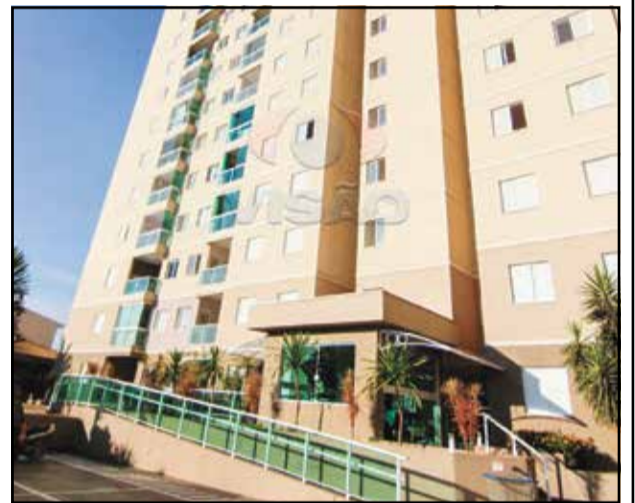
6 ref site 719702 Apartamento Duetto Di Mariah - 3 dormt/ 1 suíte/ sala/ coz/ WC / lavanderia / gar R$ 1.450,00 + IPTU + COND.