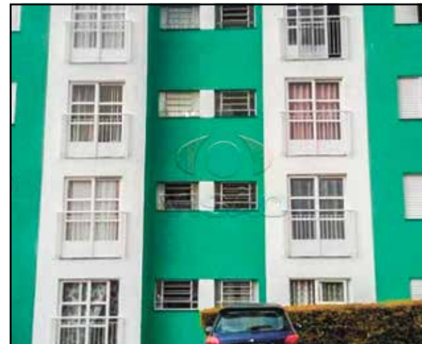
11 ref site 013391 - Apartamento Mirim - 3 dormt/ sala/ coz/ WC / lavanderia / 1 gar R$ 180.000,00