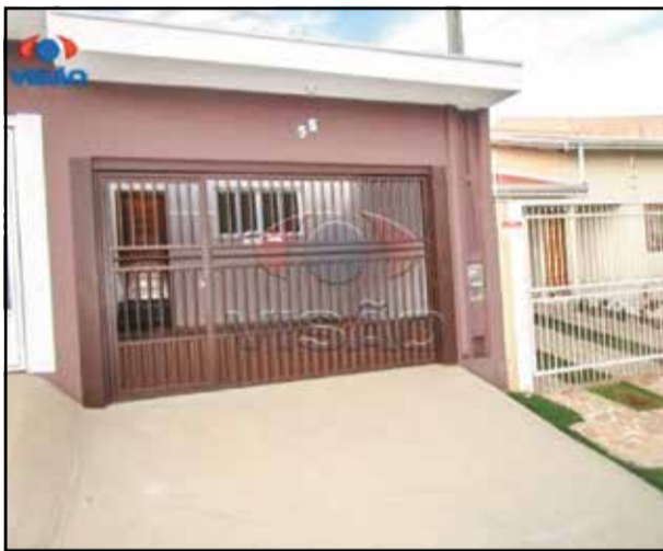
4 ref site 904091- Casa Jardim Regente- 3 dormt/ 1 suíte/ sala/ coz/ WC / lavanderia / 2 gar R$ 1.900,00 + IPTU