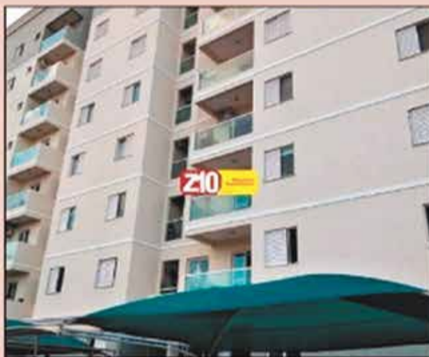
AP04893 - APARTAMENTO VILA BRIZZOLA - AU.72m 2 com 02 dormitórios, sala, cozinha, banheiro WC social, OBS ( Irá ficar no apto cooktop, armários de quarto e cozinha e móvel tipo buffet da sala). Condomínio com Área lazer: piscina, quadra, quiosque, salão de festa, de jogos e pet. R$ 1.300,00 + condomínio + IPTU.