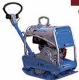
PLACA VIBRATÓRIA REVERSÍVEL