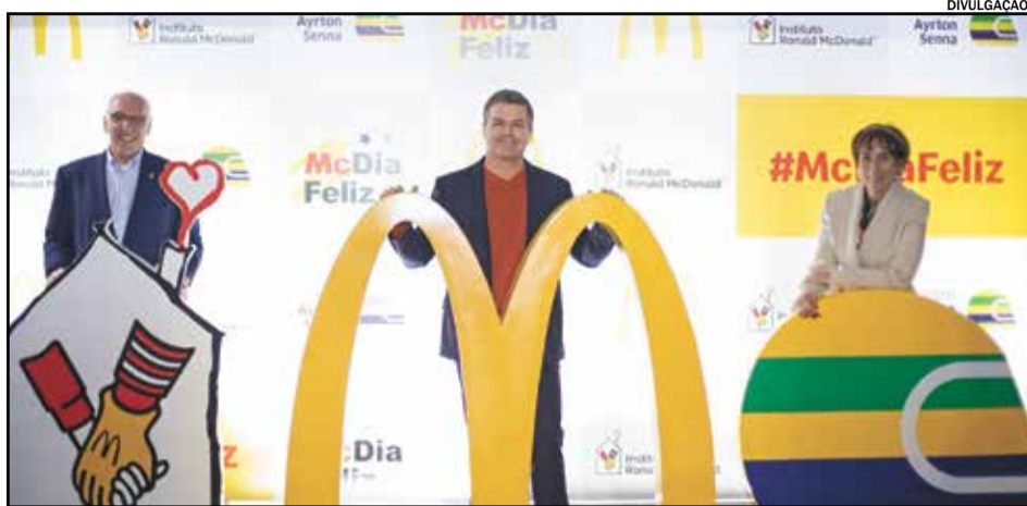
O McDia Feliz é uma das maiores mobilizações em prol de crianças e adolescentes no Brasil

tribuir com essas duas importantes causas, basta pedir um Big Mac por qualquer canal de venda do McDonald's, durante todo o sábado. Este ano, a rede orienta seus clientes a utilizarem preferencialmente os modelos com menor contato, como o Drive-Thru e Delivery, incluindo compras pelo app próprio da marca ou dos parceiros como o iFood.