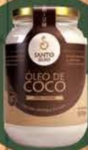
Óleo de Coco SANTO ÓLEO Extra virgem apenas R$26,00 - 500mg