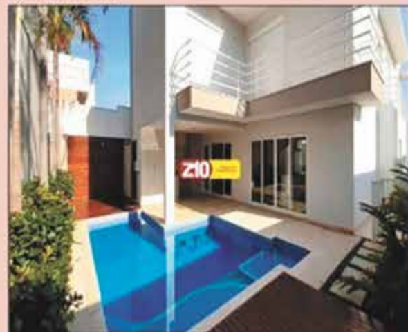
CA09071 - JARDIM VILA PARADISO - AT. 460 m 2 AC. 440 m 2 - lindo sobrado com 4 suítes (2 com closet e banheira e 2 com banheiro conjugado), cozinha planejada com ilha, sala de estar, sala de jantar, escritório, lavabo, lavanderia, área gourmet com churrasqueira e piscina e garagem para 4 autos. Imóvel com excelente acabamento! Condomínio com área de lazer completa e portaria 24 horas. Locação R$ 9.500,00 + COND + IPTU