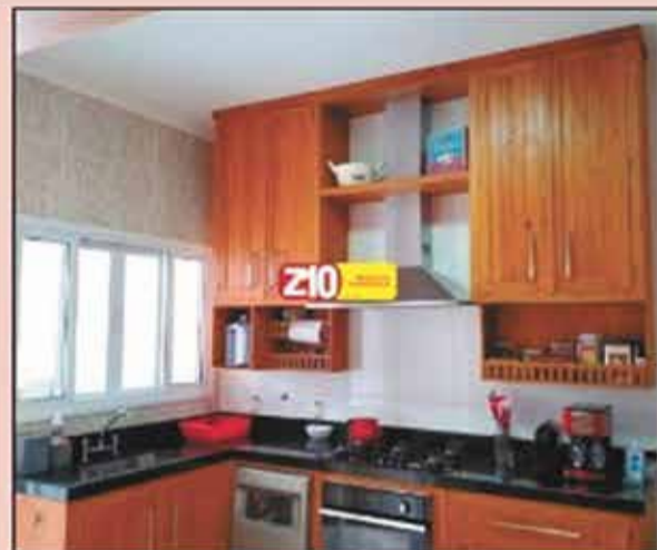
CA09056 - CASA TÉRREA EM CONDOMÍNIO VISTA VERDE - 03 dormitórios sendo (01 suíte) com armários planejados, cozinha planejada com (madeira de demolição), quintal com muro alto parte de paredes em vidro, placas de aquecimento solar, ar condicionado na marca inverter em todos os ambientes, garagem para 03 autos sendo (01 vagas) R$ 610.000,00.