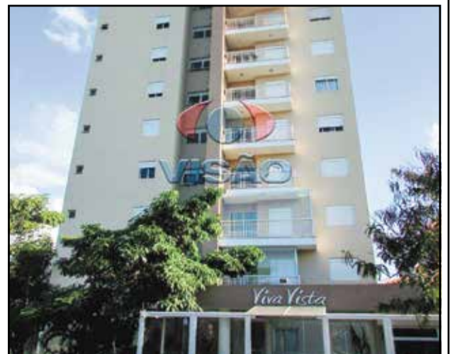
12 ref site 662012 - Apartamento Viva Vista - 3 dormt/ 1 suíte/ sala/ coz/ WC / lavanderia / 1 gar / área de lazer completa R$ 450.000,00

TODOS OS VALORES ACIMA ESTÃO SUJEITOS A ALTERAÇÕES