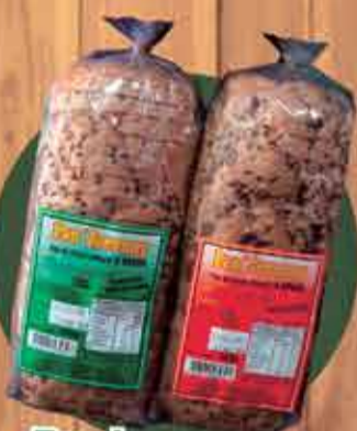
Pão Integral Pan' Jeronny R$ 7,90