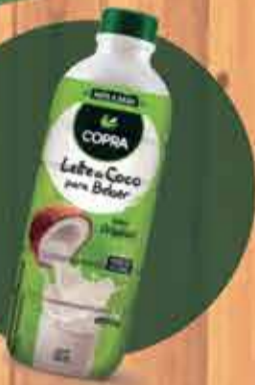
Leite de Coco para beber Copra R$ 15,00 - 900ml