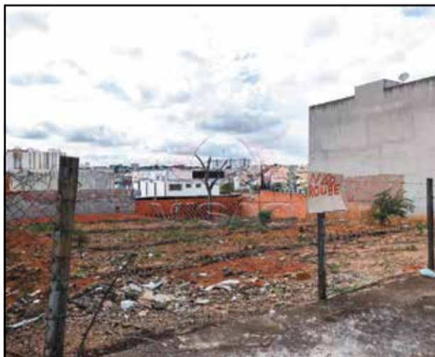
8 ref site 228902 - Terreno Jardim Regina - 264 m 2 R$ 225.000,00