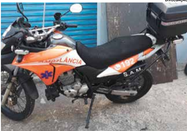
A Secretaria de Segurança destinou duas motocicletas para a implantação do projeto

A Prefeitura de Indaiatuba por meio da Central de Ambulância iniciou um projeto piloto para o atendimento de emergência rápido com motocicleta a finalidade é acelerar o primeiro atendimento já que a moto tem maior habilidade no