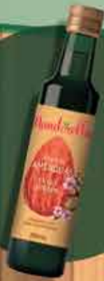
Óleo de Amêndoas R$ 32,00 - 250ml