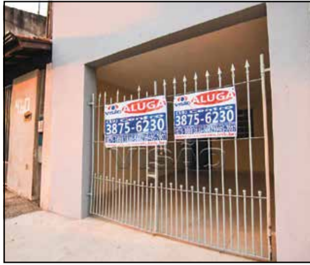
2. ref site 425012 - Casa Jardim Morada do Sol - 2 dormt/ sala/ coz/ WC / lavanderia / gar R$ 1.000,00 + IPTU