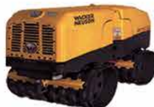
ROLO COMPACTADOR TELEGUIADO