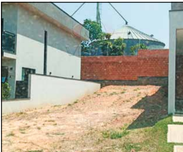
7 ref site 884012 - Terreno Montreal Residence - 150 m 2 - R$ 195.000,00