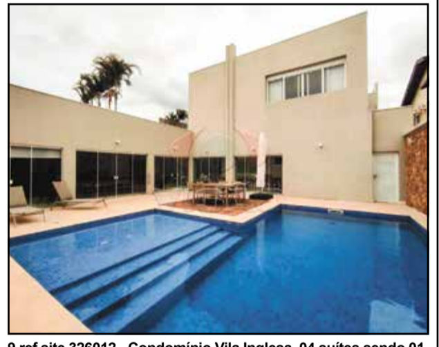
9 ref site 326012 - Condomínio Vila Inglesa 04 suítes sendo 01 master com closet e hidromassagem, 05 banheiros, cozinha, 02 salas, área gourmet completa com uma excelente piscina.