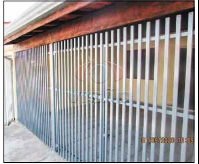
3 ref site 183281 - Casa Parque das Nações - 3 dormt/ sala/ coz/ WC / lavanderia / 2 gar R$ 1.450,00 + IPTU