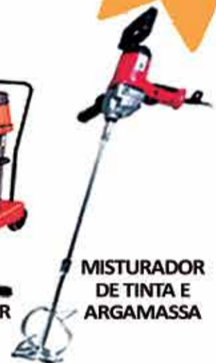
MISTURADOR DE TINTA E ARGAMASSA