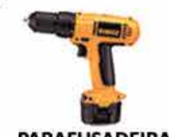
PARAFUSADEIRA A BATERIA