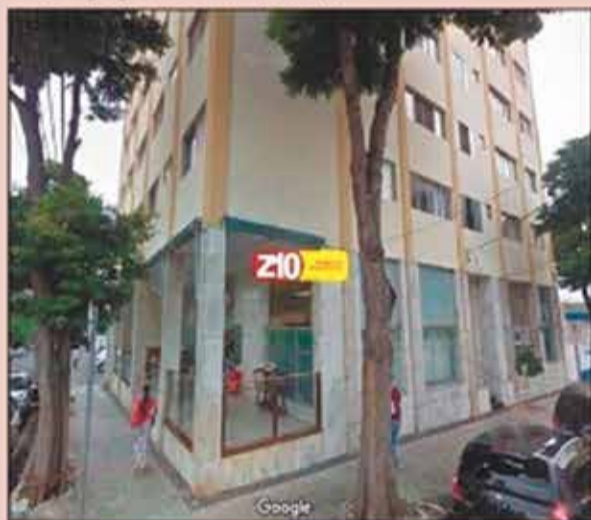
AP04831 CENTRO - AU 96 m 2 02 dormitórios, 01 sala 02 ambientes, cozinha, lavanderia, 2 banheiros. Apartamento amplo localizado no centro da cidade, próximo a bancos, restaurantes, farmácias, supermercado e lotérica. Edifício com elevador. R$ 900,00 + condomínio + IPTU.