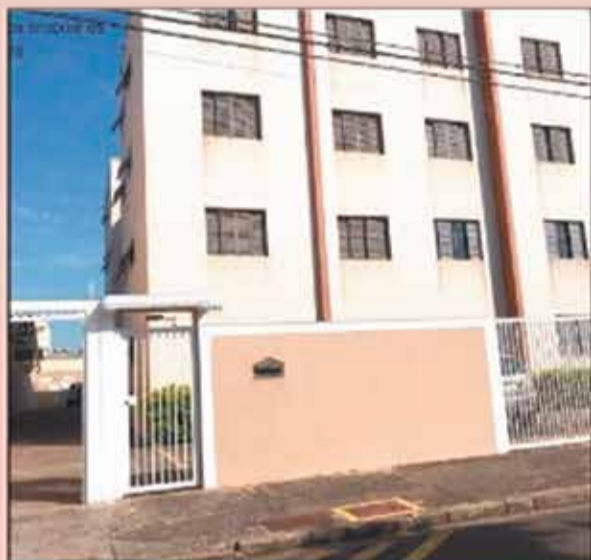
AP04681 - CIDADE NOVA AU.66 m 2 - 02 dormitórios, sala, cozinha, WC social, lavanderia a garagem para 1 auto. R$ 260.000,00

Rua XV de Novembro, 2118/2132 - Jd. Dom Bosco - Indaiatuba-SP