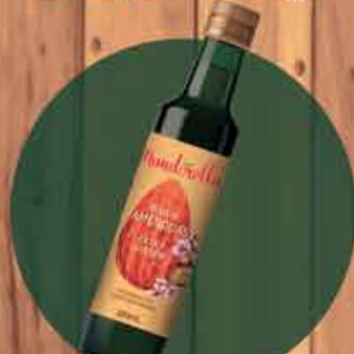
Óleo de Amêndoas R$ 32,00 - 250ml