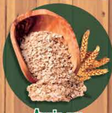
Aveia em flocos finos R$ 0,62 - 100gr