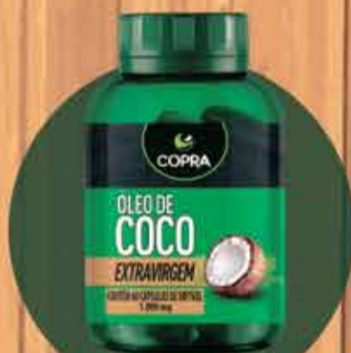
Óleo de coco em cápsulas COPRA 60 cápsulas R$21,50 - 1000mg