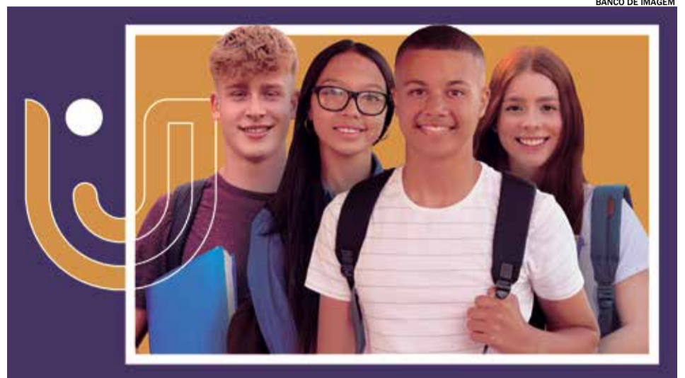
A metodologia de ensino aplicada será no mesmo formato das aulas dos cursos de graduação

Com mensalidades a partir de R$ 265,428*, os interessados já podem acessar o site da UniFAJ ( www.faj.br ) e realizar a inscrição. Para matrícula, não é necessário realizar qualquer tipo