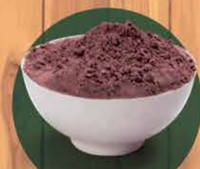
Farinha de uva Apenas R$2,00 - 100gr