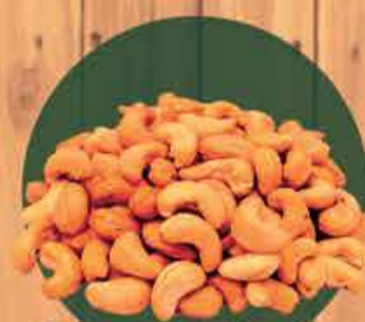
Castanha de caju quebrada R$5,30 - 100gr