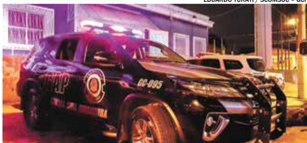
Homem foi flagrado com sacos cheios do material no Centro

A equipe do GAP 095 (Grupo de Ações de Policiamento Especial) prendeu um homem na noite de quarta-feira (26). Os agentes realizavam o patrulhamento preventivo da área central quando observaram um indivíduo carregando uma mochila e dois sacos pretos.