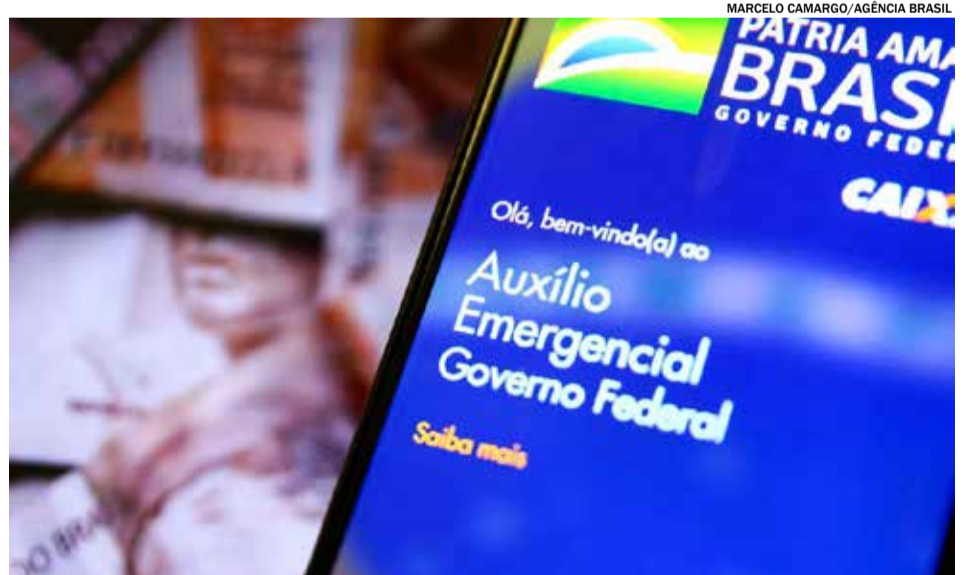
Apesar da prorrogação, alguns beneficiários serão excluídos

reito quem estiver preso em regime fechado e quem tiver menos de 18 anos, exceto em caso de mãe adolescente e pessoas com indicativo de óbito nas bases de dados do governo federal.