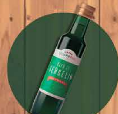
Óleo de Gergelim R$22,00 - 250ml

Promoção válida de 4/09 até 08/09 ou enquanto durar o estoque