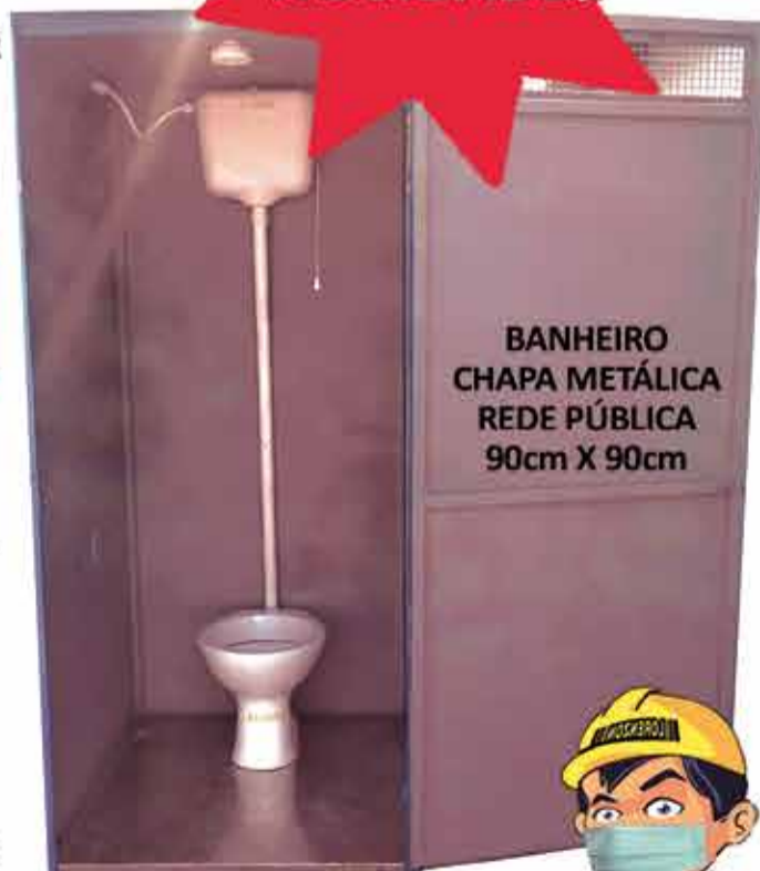
BANHEIRO CHAPA METÁLICA REDE PÚBLICA 90cm X 90cm

FAZEMOS ENTREGA, RETIRADA E MANUTENÇÃO NO PRAZO COMBINADO!