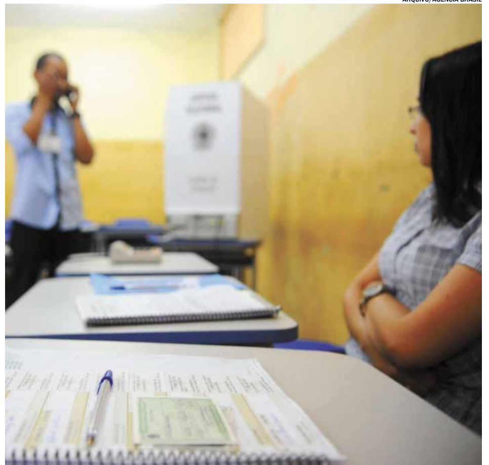
Eleitores de Indaiatuba aptos a participar do pleito poderão ir às urnas das 7h às 17h

De acordo com Barroso, cada mesário terá um frasco de 200 mililitros de álcool em gel,