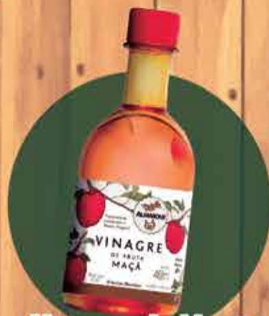
Vinagre de Maça Almaromi R$ 2,95 - 400ml