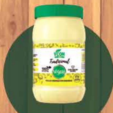
Maionese Vegana Tradicional R$10,00 - 250gr