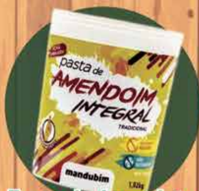
Pasta de Amendoim Integral R$ 16,50 - 1Kg