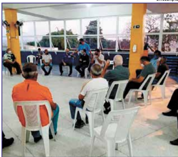
Em reunião, autoridades esportivas informam que as competições não retornam este mês

A decisão foi tomada na noite de segunda-feira (31), durante reunião entre a Associação Indaiatubana de Futebol Amador (Aifa) e a Liga Regional Desportiva Indaiatuba (Lidi). A prin-