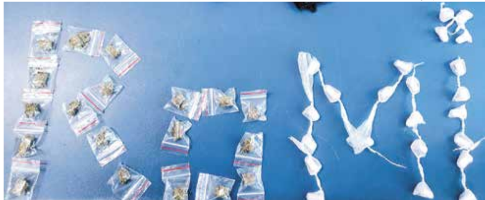
Denúncia anônima levou os agentes até o local onde a droga estava escondida

A Guarda Civil de Indaiatuba apreendeu 42 porções de drogas no Jardim Morada do Sol após receber uma denúncia anônima. A equipe do COI (Centro de Operações e Inteligência) recebeu uma ligação contando sobre um in-