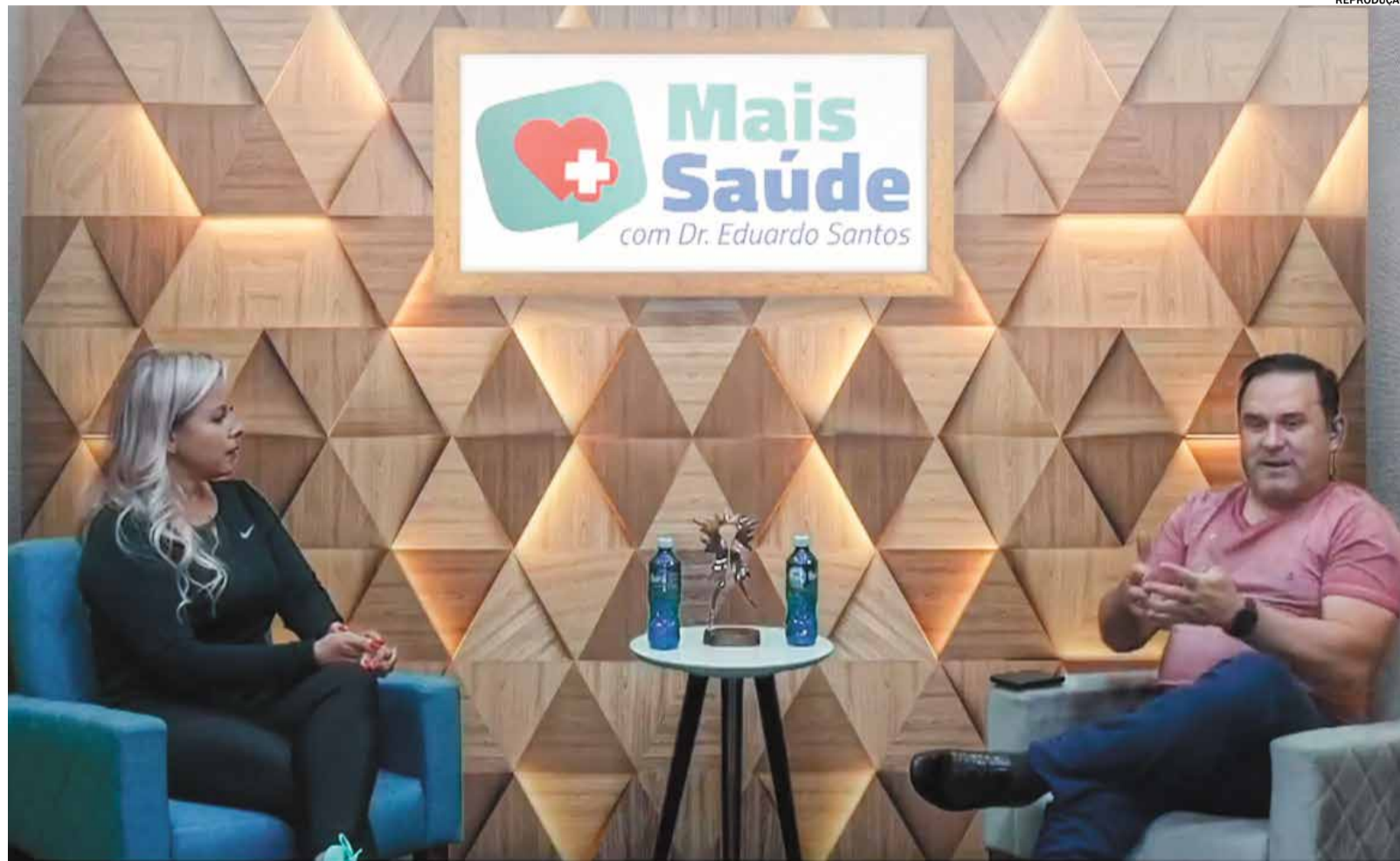
Ultramaratonista participou da meia maratona de Buenos Aires, Rio de Janeiro e Porto Alegre