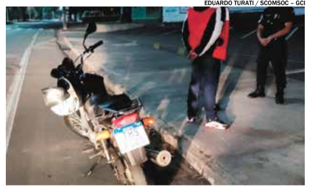
Motocicleta com placa Mercosul falsa é apreendida

Uma motocicleta com placa Mercosul falsa foi apreendida na madrugada de sábado (29) pela equipe do Canil da Guarda Civil. De acordo com informações, os guardas realizavam o patrulhamento preventivo do Bairro Tancredo Neves, quando vários indivíduos ao notarem presença da equipe evadiram-se com suas motocicletas em várias direções.