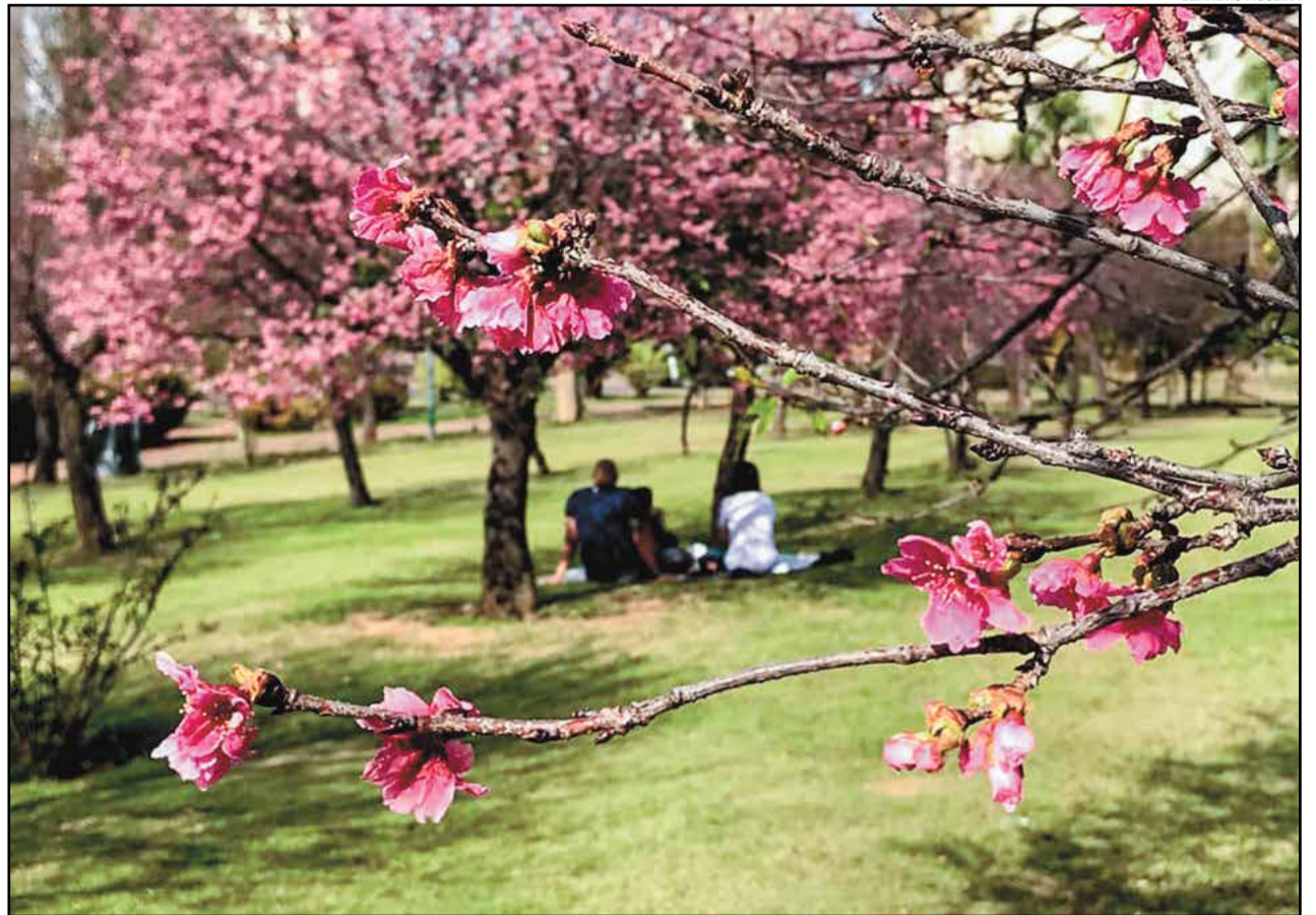
A praça das Cerejeiras, sem dúvidas, deve ser um dos pontos mais bonitos de Indaiatuba. As mudas da planta foram plantadas, em 2005, na praça Roque Torce Filho, por iniciativa de uma indústria de automóveis japonesa, e desde então todo inverno a praça se enche de flores e beleza

Esta foi uma semana de vergonha para todos os jornalistas que possuem um pingo de decência e primor ético. E para nós, enquanto humanidade, isso deveria valer como reflexão, pois, como disse o Mestre: “faça aos outros aquilo que gostaria que fizessem para ti”.