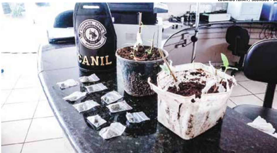
Apreensões foram resultados de três ocorrências registradas no fim de semana

cia foi registrada pela equipe do Canil 047 no Jardim Tancredo Neves.