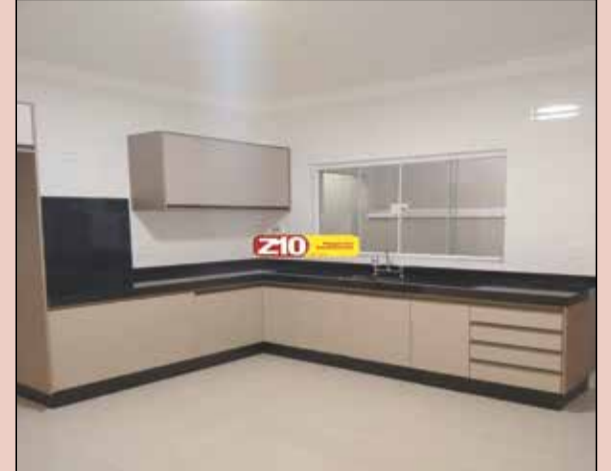
CA08869 - JARDIM PAU PRETO - AT 125 m 2 AC 110 m 2 - Excelente localização com 03 dormitórios sendo 01 suíte, 01 sala, WC social, cozinha planejada, lavanderia, imóvel com excelente acabamento, a poucos metros do Parque Ecológico e Poupatempo, próximo a bancos e supermercado. R$ 395.000,00