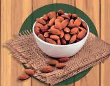
Amêndoas torrada ou crua R$ 6,80 - 100gr