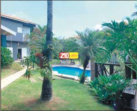
CH01782 - VALE DAS LARANJEIRAS - BELÍSSIMA CHÁCARA - AT 2.500m 2 , AC 540m 2 , 04 Dormitórios (Sendo 03 Suítes) todas com planejados, Sala de Estar, Sala de Jantar, Sala de TV, Lavabo, Cozinha Planejada, Despensa, Varanda Gourmet, Banheiro Auxiliar, Piscina, Jardim, Deck de Madeira Coberto C/ Quiosque de Sapê, Garagem P/03 Autos Cobertas e 04 Descobertas. R$ 2.120.000,00.