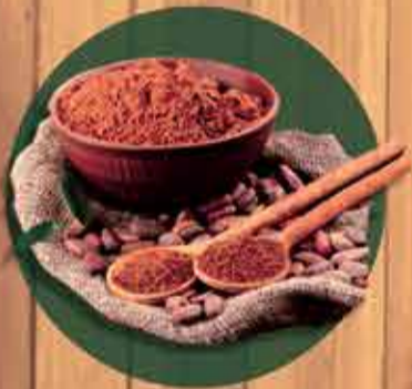
Cacau em pó alcalino 100% R$2,60 - 100gr