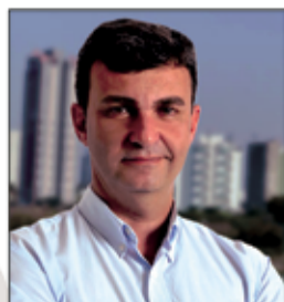
Nilson Alcides Gaspar Prefeito