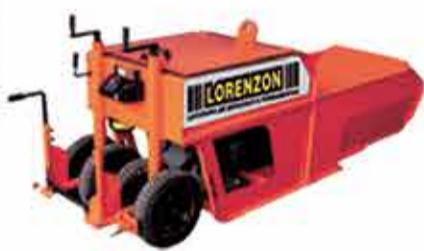
EXTRUSORA P/ GUIA E SARJETA