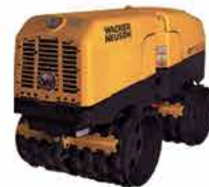
ROLO COMPACTADOR TELEGUIADO