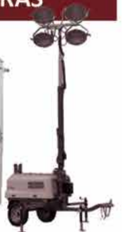
TORRE DE ILUMINAÇÃO