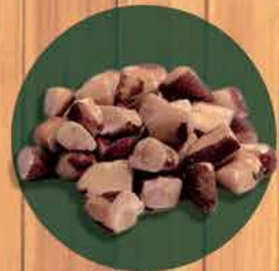
Castanha do Para quebrada R$ 3,50 - 100gr