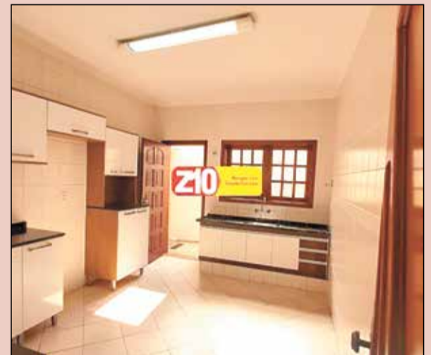
CA07342 - SOLAR DO ITAMARACÁ - AT 312m 2 , AC 205,80m 2 - Ampla casa com 03 dormitórios sendo 01 suíte, WC social, sala ampla de estar/TV, copa, cozinha, lavanderia, churrasqueira, edícula com WC, garagem para 04 autos cobertas. R$ 2.500,00 + IPTU.