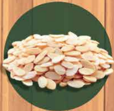
Amêndoa laminada R$ 8,99 - 100gr