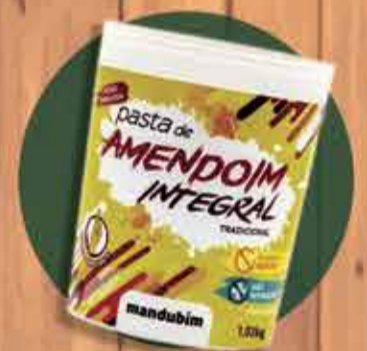
Pasta de Amendoim Integral R$ 19,50 - 1Kg

*Promoção válida de 10/07 até 14/07 ou enquanto durar o estoque*