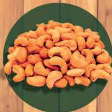
Castanha de Cajú quebrada R$ 5,30 - 100gr