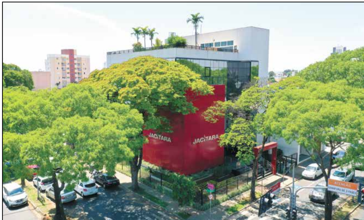
A Jacitara é a 22ª construtora no ranking ITC, e investe na comunicação digital, priorizando a vida e a saúde dos clientes

Jacitara oferece condições especiais para a compra da casa própria, com valores abaixo do aluguel