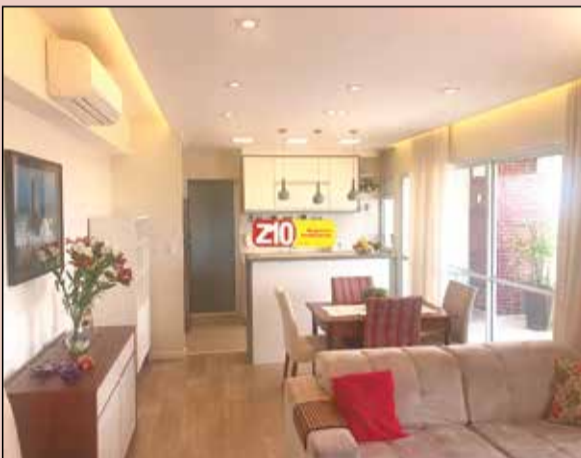
AP04776 - AU. 96 m 2 - JARDIM PAU PRETO - INDAIATUBA - 03 dormitórios sendo 01 suíte, WC social, lavabo, sala 02 ambientes, cozinha planejada, 02 vagas cobertas e com hobby box. Apartamento com armários planejados nos quartos, corredor, cozinha, banheiros e lavanderia, ar condicionado nos quartos e sala, iluminação LED e vista esplêndida. Localização em um dos melhores bairros da cidade em condomínio completo. R$ 2.800,00 + COND. + IPTU.