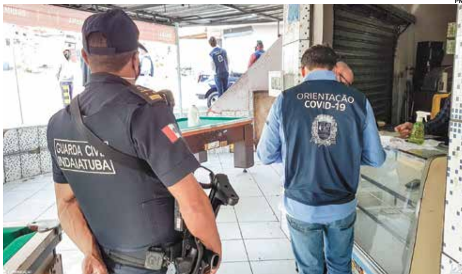
Comerciantes foram orientados a fechar as portas, por desrespeitarem as determinações do Plano São Paulo de retomada consciente

30/06 – Jardim Morada do Sol – 35 notificações 01/07 – Jardim Morada do Sol – 27 notificações 03/07 – Jardim Paulista, Campo Bonito, Jardim Morada do Sol e Centro – 34 notificações