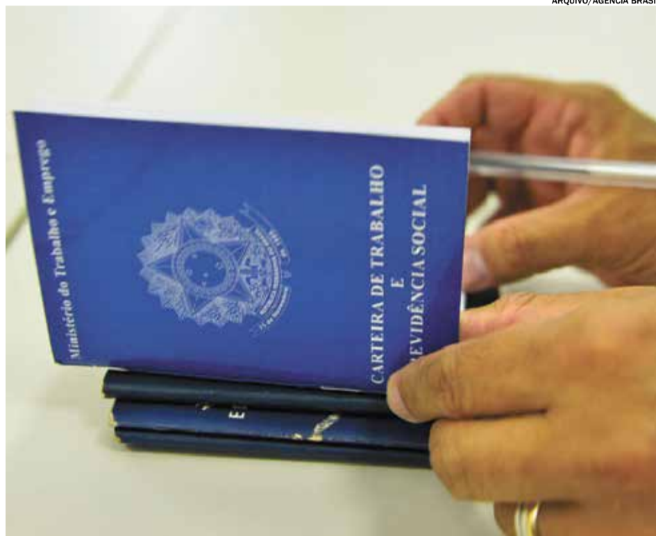
Dentre as cidades que compõe a RMC, Campinas é a cidade que possui maior número de desempregados

Dentre as 20 cidades que compõem a RMC, Campinas é a cidade que apresenta o maior número de desempregados 96.912. Engenheiro Coelho tem o menor número de desempregados (575) e a menor taxa de 5,65%. Se a análise considerar a taxa de desemprego e não a