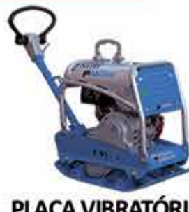
PLACA VIBRATÓRIA REVERSÍVEL