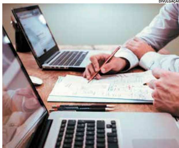
Pronampe já fechou quase 53 mil contratos

O lançamento da ferramenta foi anunciado, pelo Secretário Especial de Produtividade, Emprego e Competitividade do Ministério da Economia,