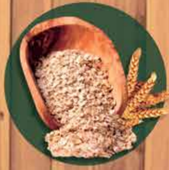
Aveia em flocos finos R$ 0,62 - 100gr