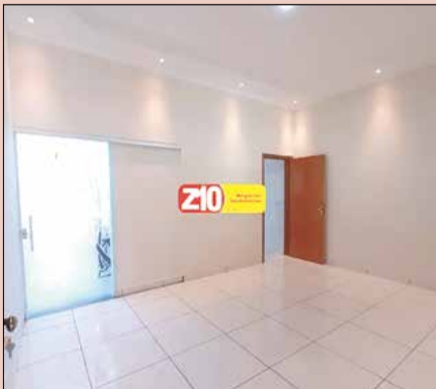
CA07952 - CIDADE NOVA II - AT. 125 m 2 AC. 100 m 2 - 3 dormitórios (1 suíte), wc social, sala ampla, cozinha, lavanderia e garagem para 2 autos coberta. R$ 1.800,00 + IPTU