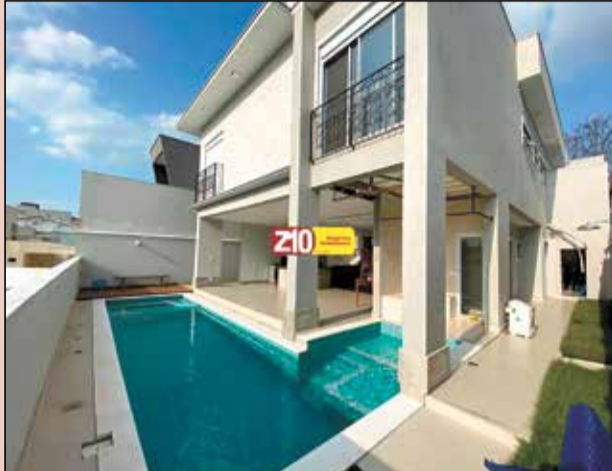
CA08850- TERRA MAGNA - LINDA CASA com 4 dormitórios (sendo 3 suítes na parte superior, 1 com closet), lavabo, cozinha, área gourmet, sala ampla, escritório, sala de jogos, 2 WC social, piscina com aquecimento solar e garagem para 4 autos. Casa com aquecimento solar e energia fotovoltaica (gasto mínimo de energia). Condomínio com área de lazer completa e portaria 24h. R$ 1.450.000,00.