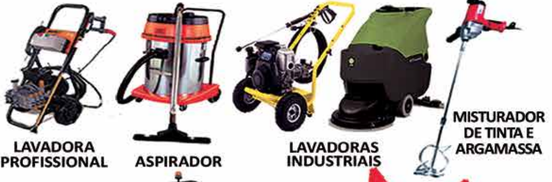
LAVADORA PROFISSIONAL ASPIRADOR LAVADORAS INDUSTRIAIS MISTURADOR DE TINTA E ARGAMASSA