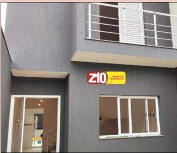
CA08803 - JARDIM ITAMARACÁ - AT. 125 m² AC .137 m² 03 dormitórios (sendo 01 suíte), sala, cozinha, WC social, lavanderia, área gourmet com churrasqueira e banheiro, ótimo acabamento, portão eletrônico, quintal, garagem para 02 autos, PISO PORCELANATO, LOUÇAS DECA, E GRANITOS, R$ 1.800,00 + IPTU