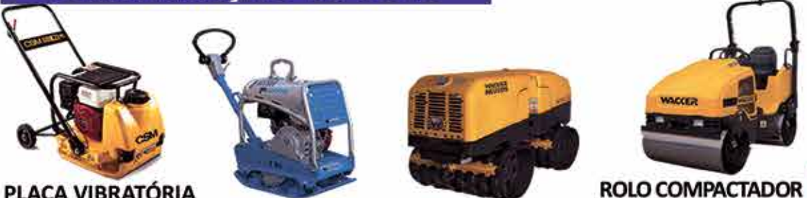
PLACA VIBRATÓRIA PLACA VIBRATÓRIA REVERSÍVEL ROLO COMPACTADOR TELEGUIADO ROLO COMPACTADOR