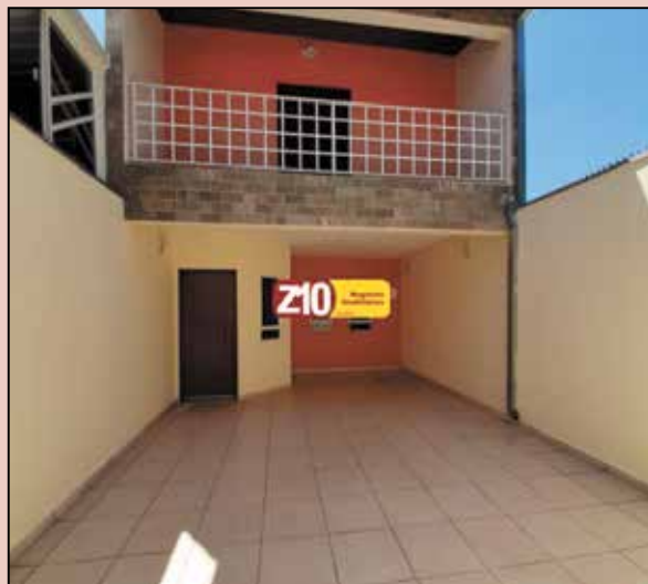
CA08749 - JARDIM CALIFÓRNIA - AT.125m² AC.161,50m² - 03 dormitórios (01 suíte), sala, cozinha, lavabo, lavanderia, churrasqueira, dormitório externo, vaga para 02 autos. R$ 2.200,00 + IPTU.