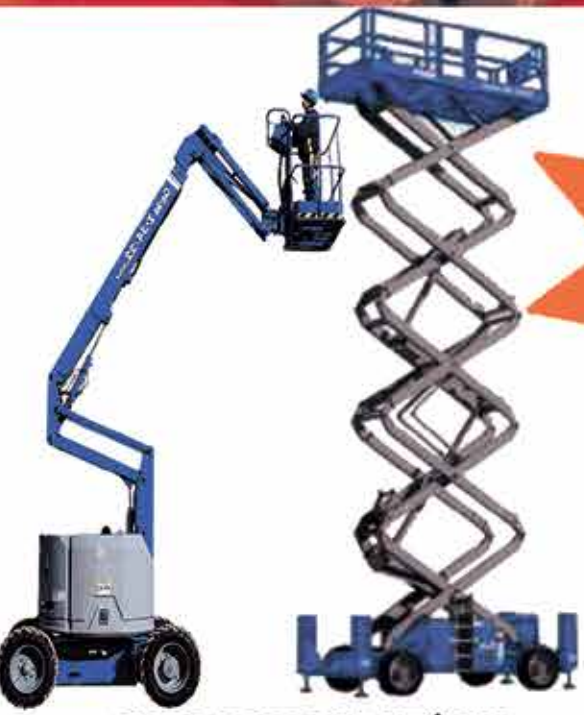
PLATAFORMAS ELEVATÓRIAS ARTICULADA E TESOURA