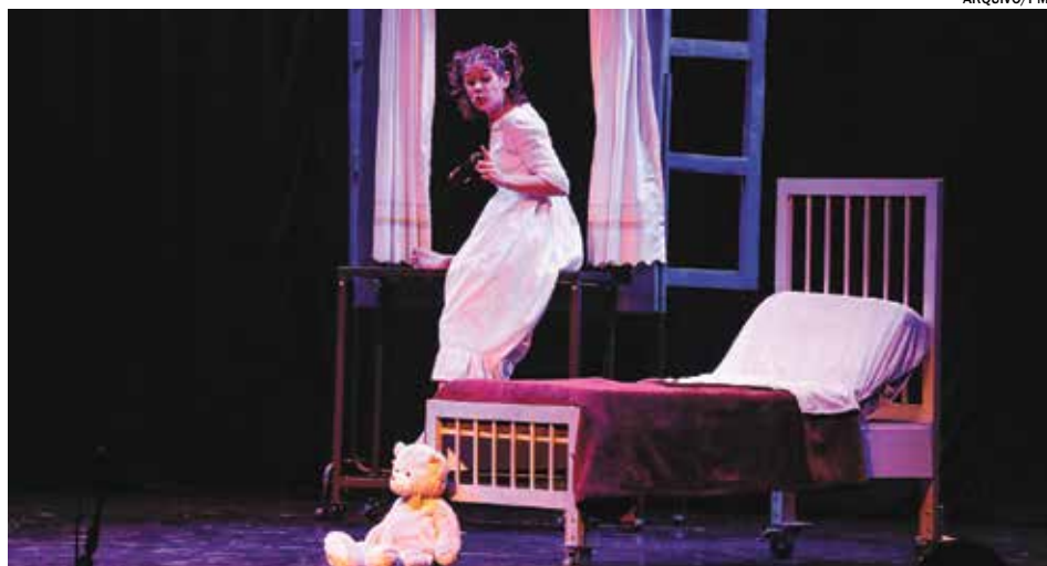
As apresentações poderão ocorrer com diversas formações, inéditas ou não, combinando artistas, desde que estejam de acordo com o edital da Mostra

As apresentações deverão ser enviadas exclusivamente no formato eletrônico através do link www.indaiatuba.sp.gov.br/cultura/concursos/mostra-virtual/ , no período de 11 de maio a 11 de junho de 2020. Os grupos podem, inclusive, utilizar materiais produzidos inicialmente, ou seja, anterior ao Decreto 13.928, de março de 2020, e que atendam a todas as solici-