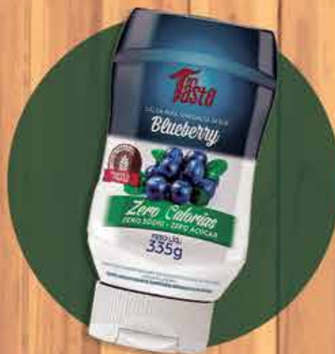
Cobertura para sobremesas zero calorías a partir de R$ 15,00