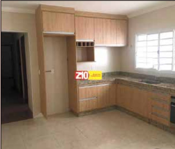
CA08763 - CASA TÉRREA - JARDIM ADRIANA - INDAIATUBA - AT 126,50m² AC 100,55m² 02 dormitórios, sala, cozinha planejada, lavanderia, piso laminado, garagem cobertas para 02 autos, em excelente localização, próximo ao parque ecológico, a poucos minutos do centro. R$ 270.000,00