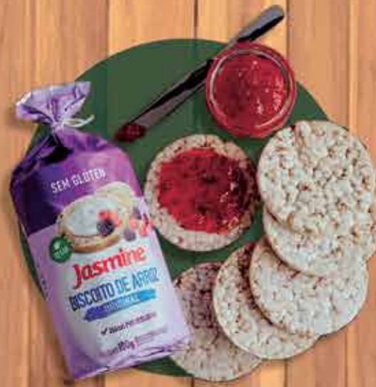
Biscoito de arroz Jasmini Vegan a partir de R$ 11,50

*Promoção válida de 15/05 até 21/05 ou enquanto durar o estoque*