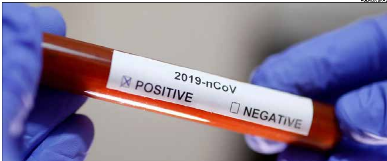
Até o momento, a cidade registra 12 mortes por Covid-19, e entre os 97 casos confirmados, 70 pacientes estão curados

“Peço para que a população indaiatubana colabore e não fiquem se aglomerando, pois o vírus se prolifera muito rápido, e a única maneira de con-