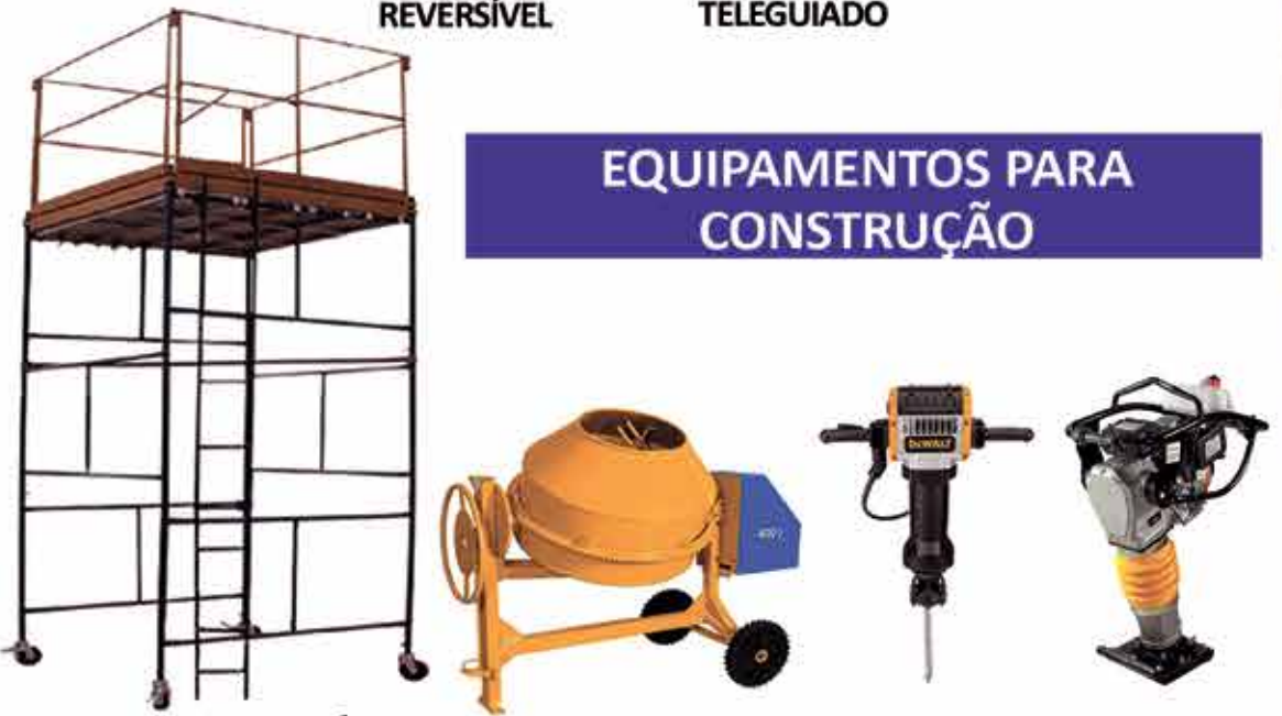
PAINEL METÁLICO BETONEIRA ROMPEDOR COMPACTADOR