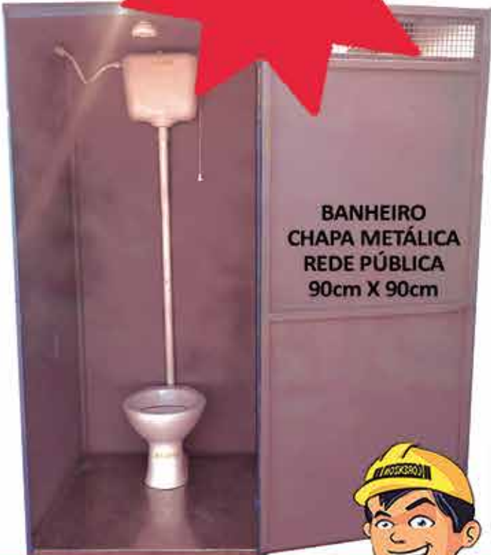
BANHEIRO CHAPA METÁLICA REDE PÚBLICA 90cm X 90cm