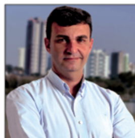
Nilson Alcides Gaspar Prefeito