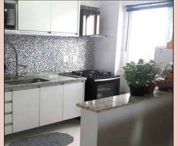
AP04719 - LOFT EKKO HOUSE - AU-98m² - 02 suítes, sala 02 ambientes, cozinha planejada, lavabo, lavanderia com armários, sacada com área gourmet de frente para o Parque, 02 vagas para autos. R$ 570.000,00