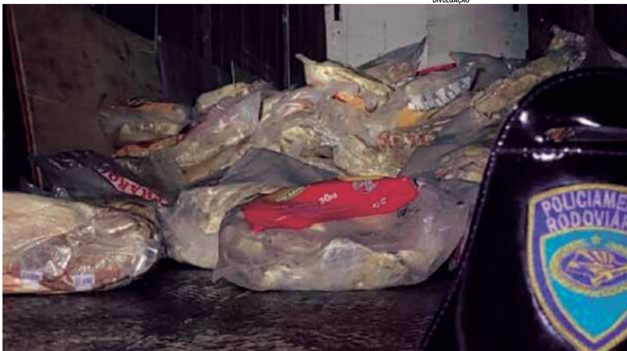
Os produtos estavam mal acondicionados, espalhados no baú do caminhão, e sem nota fiscal

O motorista do caminhão foi parado pela Polícia Militar Rodoviária na altura do km 60 da pista Sul da rodovia, em torno das 19h20. Segundo o registro da ocorrência, o homem demonstrou bastante nervosismo durante a abordagem.