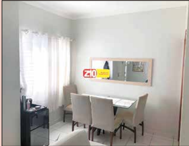
CA08767 - CONDOMÍNIO VILLAGGIO DI ITAICI COM LAZER COMPLETO - AT: 150,00 m² - AC: 90,00 m² - CASA TÉRREA com 3 dormitórios, sendo 1 suíte com planejados + 1 dormitório com planejado, WC social, Sala de estar, Cozinha planejada, Lavanderia com armários, Quintal feito jardim de inverno, 2 vagas de garagem sendo 1 coberta. R$ 450.000,00. aceita permuta.