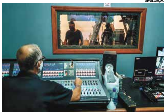
As apresentações foram gravadas em estúdio e podem ser conferidas no Cultura Online da Prefeitura

“Foi um processo bastante intenso readequar e colocar o 28º Maio Musical Virtual em prática. O objetivo é valorizar a produção artística do muni-