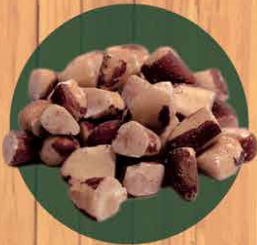
Castanha do Pará quebrada R$ 3,50 100 gr