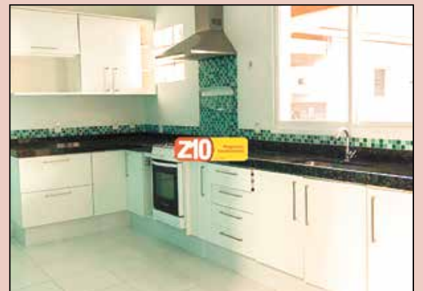
CA08802 - AT 300m² - AC 200m² EXCELENTE CASA TÉRREA 03 DORMITÓRIOS EM CONDOMÍNIO FECHADO - RESIDENCIAL GREEN VIEW - 03 dormitórios sendo 01 suíte (02 com armários), WC social com box e gabinete, sala 02 ambientes com estante, lavanderia planejada, cozinha planejada com armário | despensa, área gourmet com churrasqueira e amplo quintal, quarto despejo com prateleiras e WC, garagem para 04 autos sendo 02 cobertas. Condomínio fechado com infraestrutura de quadra poliesportiva, playground e portaria. R$ 3.000,00 + COND. + IPTU