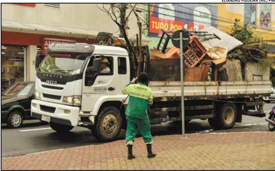
ELIANDRO FIGUEIRA (RIC/PMI)

No final de março foram acrescentados sete setores ao cronograma habitual da Operação Cata