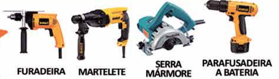
FURADEIRA MARTELETE SERRA MÁRMORE PARAFUSADEIRA A BATERIA