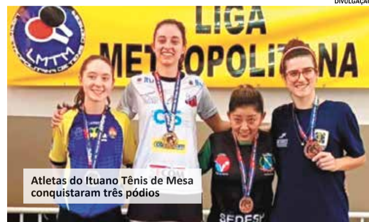
Atletas do Ituano Tênis de Mesa conquistaram três pódios

Agora o Ituano Tênis de Mesa volta a competir no próximo final de semana, em Mogi das Cruzes, pela quarta etapa da Liga Valeparaibana.