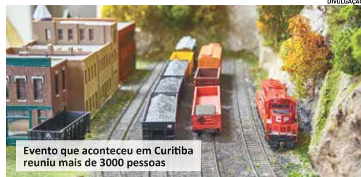
Evento que aconteceu em Curitiba reuniu mais de 3000 pessoas

Datas: 23, 24 e 25 de junho Local: Praça Washington Luís, em frente ao Estádio Novelli Jr. Horários: Sexta-feira das 19h às 22h, Sábado e Domingo das 12h às 22h