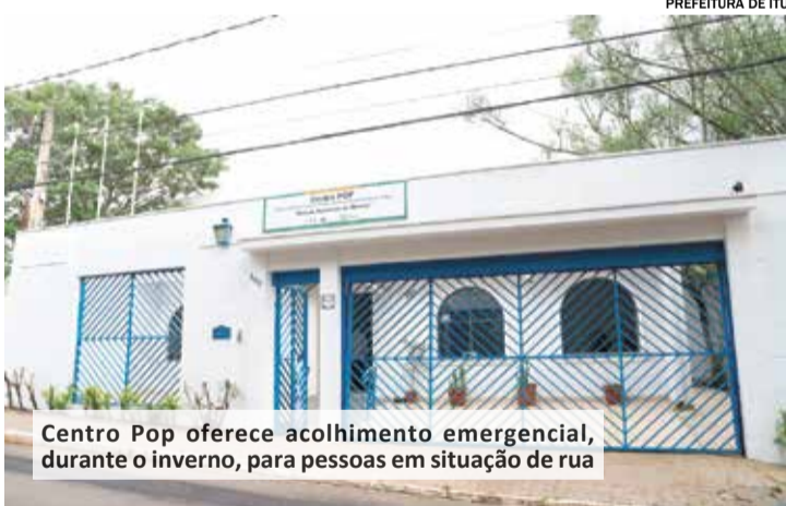
Centro Pop oferece acolhimento emergencial, durante o inverno, para pessoas em situação de rua