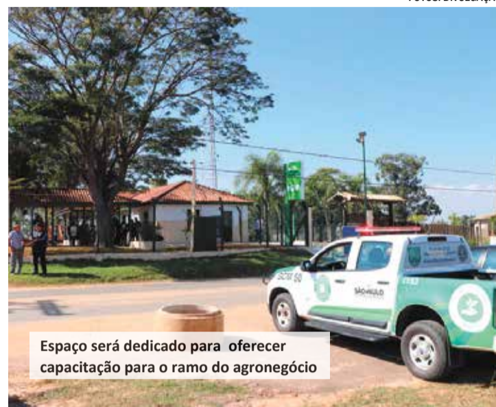
Espaço será dedicado para oferecer capacitação para o ramo do agronegócio

Por meio de parceria firmada com o Sindicato Rural de Itu, o Serviço Nacional de Aprendizagem Rural (SENAR) e com a Federação da Agricultura e Pecuária do Estado de São Paulo (FAESP), o prédio receberá diversos cursos e programas