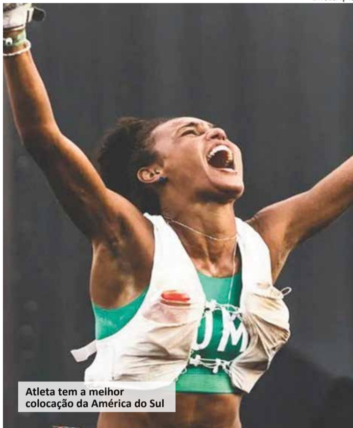
Atleta tem a melhor colocação da América do Sul

O WMTRC em resumo, são corridas organizadas em conjunto pela Associação Internacional de Ultrarunners (IAU), a Associação Internacional de Corrida de Trilha (ITRA) e a Associação Mundial de Corrida de Montanha (WMRA). Eles são coordenados pela Associação Internacional de Atletismo Mundial (WA). O evento reuniu mais de 1.200 atletas, de 68 países diferentes.