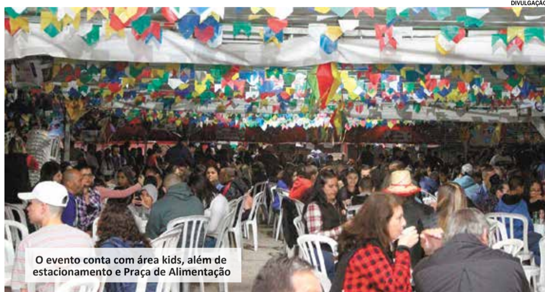
O evento conta com área kids, além de estacionamento e Praça de Alimentação