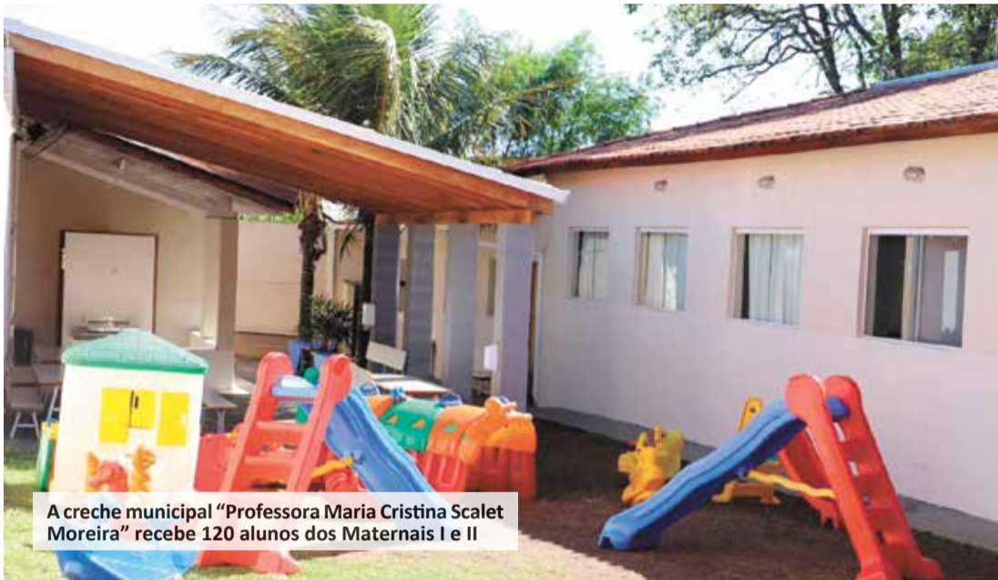
A creche municipal "Professora Maria Cristina Scalet Moreira" recebe 120 alunos dos Maternais I e II

A unidade, que vai atender crianças de 2 e 3 anos, possui seis salas, enfermaria e área de lazer