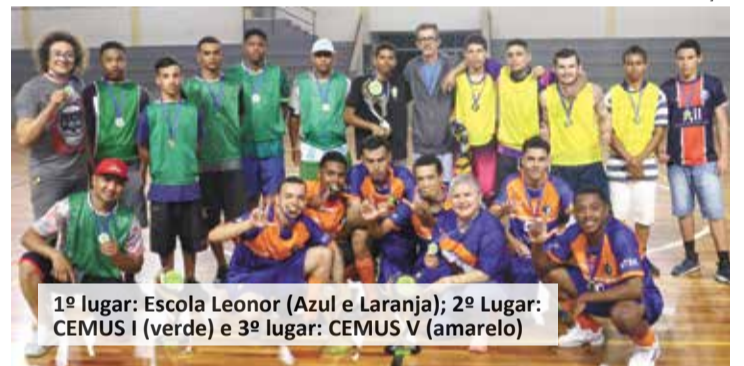
1º lugar: Escola Leonor (Azul e Laranja); 2º Lugar: CEMUS I (verde) e 3º lugar: CEMUS V (amarelo)