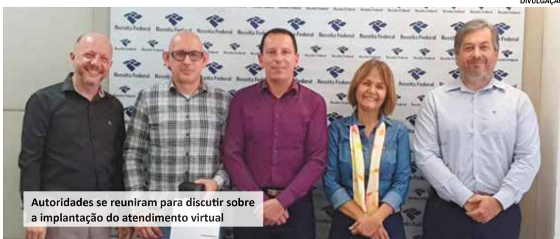
Autoridades se reuniram para discutir sobre a implantação do atendimento virtual

A Prefeitura de Salto, por meio da Secretaria de De-