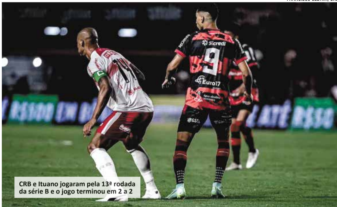
CRB e Ituano jogaram pela 13ª rodada da série B e o jogo terminou em 2 a 2

A próxima rodada do Ituano O CRB volta a jogar na próxima terça. Às 19h, visita o Criciúma no Estádio Heriberto Hulse. Quarta, o Ituano recebe a Ponte Preta no Estádio Novelli Júnior, às 21h30.