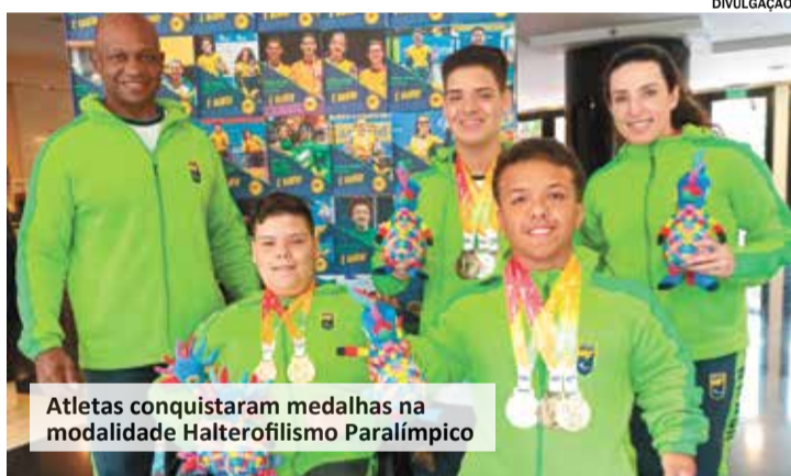
Atletas conquistaram medalhas na modalidade Halterofilismo Paralímpico