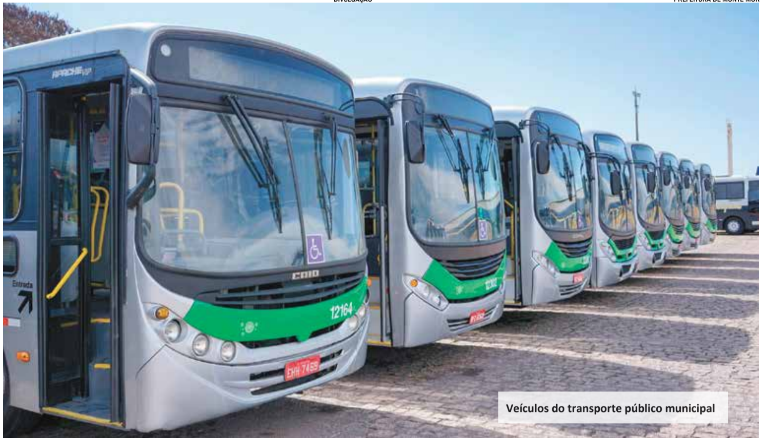
Veículos do transporte público municipal