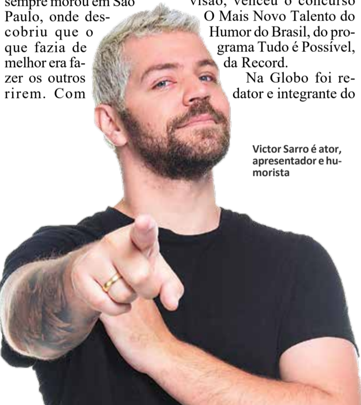
Victor Sarro é ator, apresentador e humorista

Os interessados podem encontrar os ingressos no site da Sympla, a partir de R$40. A classificação é 16 anos.