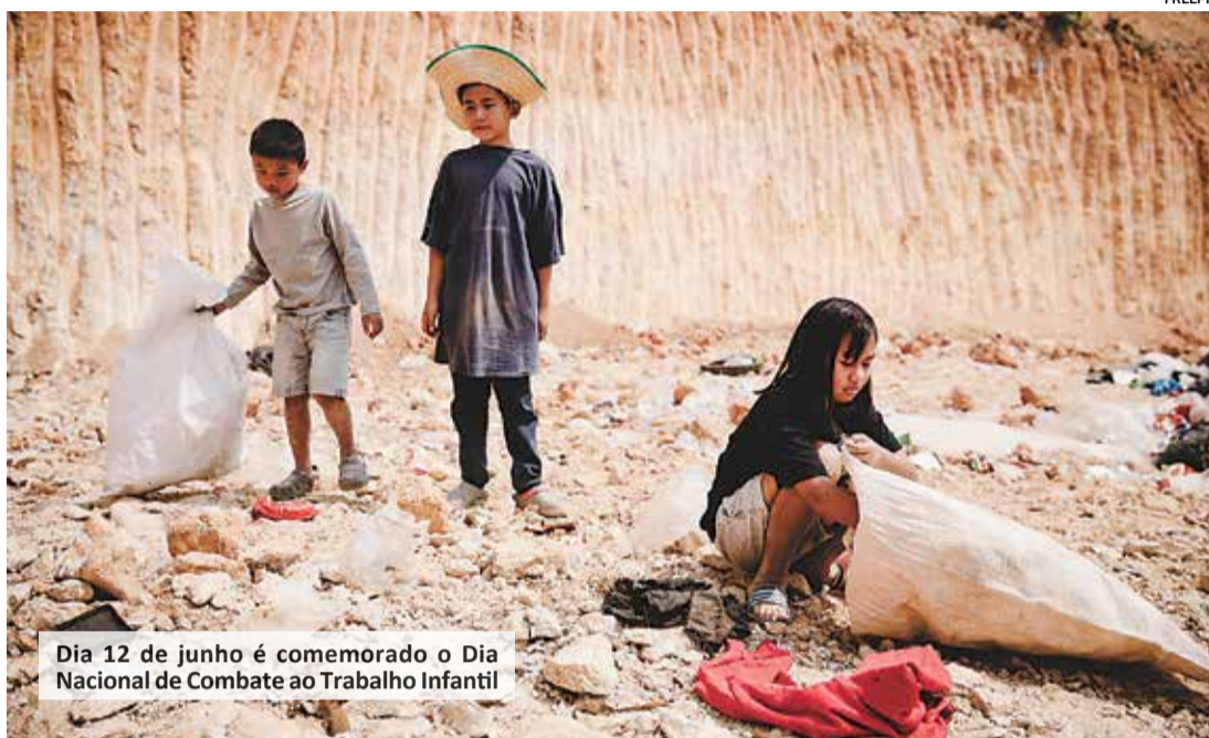
Dia 12 de junho é comemorado o Dia Nacional de Combate ao Trabalho Infantil

O objetivo da ação é informar a população sobre a importância de proteger o direito das crianças e adolescentes e orientar a como proceder quando se depararem com casos que os deixe em circunstâncias que afetem a saúde e o bem estar. Além disso, visa sen-