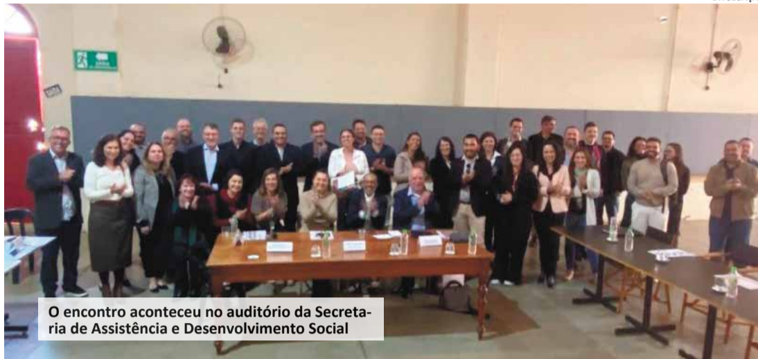
O encontro aconteceu no auditório da Secretaria de Assistência e Desenvolvimento Social

A Secretaria de Desenvolvimento Urbano e Habitação (SDUH) organizou na sexta-feira (2), às 9h, reunião com prefeitos e secretários de cidades que fazem parte da Região Metropolitana de Piracicaba. O encontro aconteceu no auditório da Secretaria de Assistência e Desenvolvimento Social da prefeitura piracicabana, teve grande adesão dos municípios e apresentou proposta concretas para o desenvolvimento regional. A iniciativa faz parte de uma rodada de diálogo com todas as nove metropolitanas estaduais. Elias Fausto esteve representada pelo