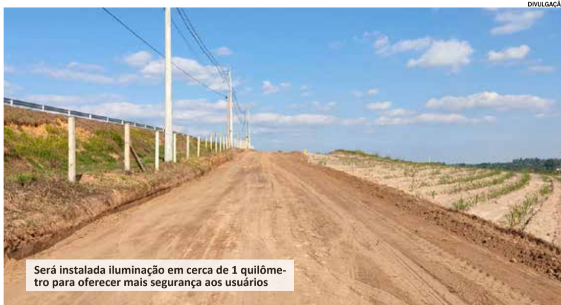
Será instalada iluminação em cerca de 1 quilômetro para oferecer mais segurança aos usuários