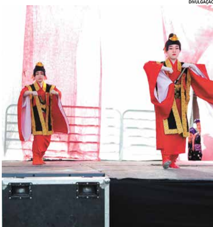
FESTA JAPONESA: 115 anos da imigração japonesa é comemorada com festa em Itu nos dias 17 e 18 de junho