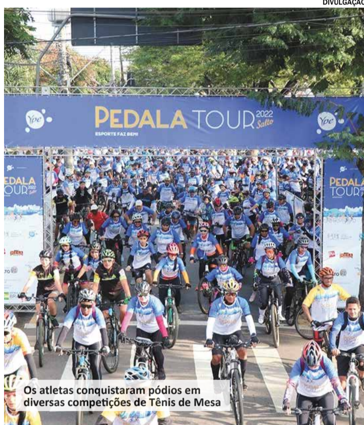
Os atletas conquistaram pódios em diversas competições de Tênis de Mesa

Os ciclistas farão um percurso de cerca de 10 quilômetros pelas ruas e avenidas da cidade. A concentração ocorrerá a partir das 6h, na Praça XV de Novembro. No local,