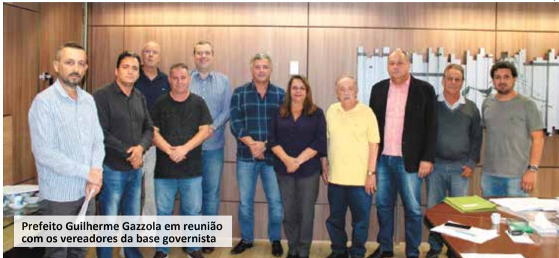
Prefeito Guilherme Gazzola em reunião com os vereadores da base governista

Durante o encontro no gabinete, o projeto foi debatido e bem visto pelos representantes do Legislativo, que receberão o texto final para ser submetido à votação ainda neste mês. A expectativa do governo municipal é a de que a redução vigore no