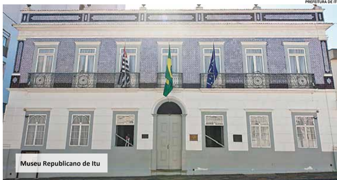
Museu Republicano de Itu

JOGO PASSA E REPASSA SOBRE RESÍDUOS – Das 11h às 17h.