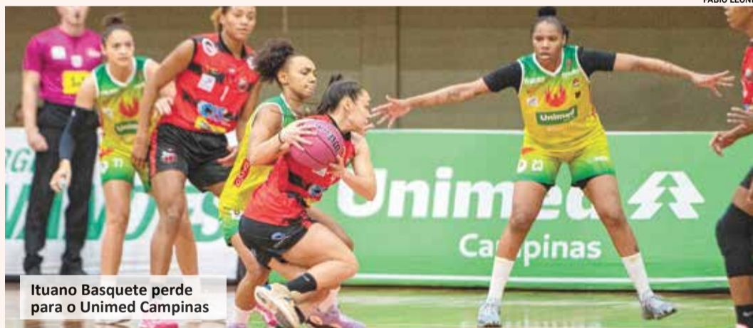
Ituano Basquete perde para o Unimed Campinas