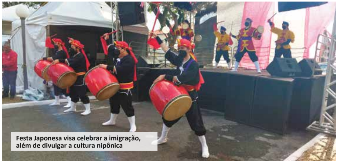
Festa Japonesa visa celebrar a imigração, além de divulgar a cultura nipônica