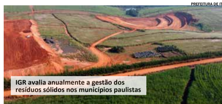
IGR avalia anualmente a gestão dos resíduos sólidos nos municípios paulistas

Entre as questões avaliadas, estão: Instrumentos de Gestão de Resíduos Sólidos, Coleta Regular e Limpeza Urbana e Reciclagem, Tratamento e Recuperação.