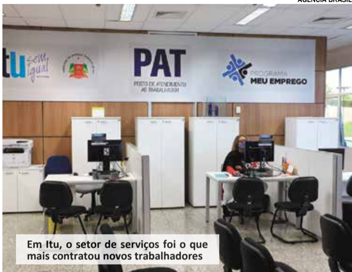
Em Itu, o setor de serviços foi o que mais contratou novos trabalhadores

dos últimos quatro meses se deve as ações realizadas aos empreendedores locais e a divulgação das vagas de emprego através do Posto de Atendimento ao Trabalhador (PAT).