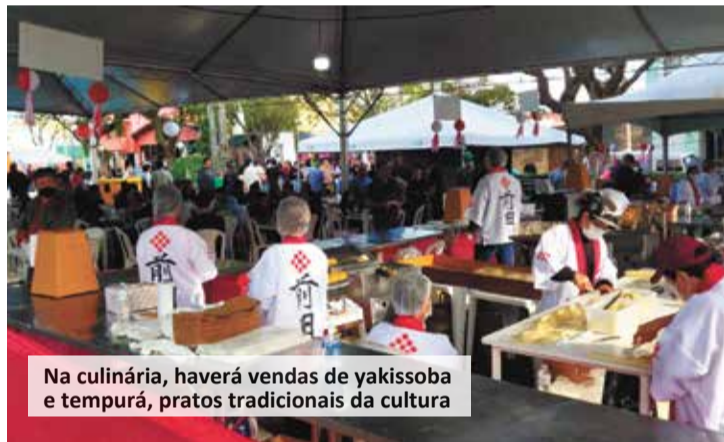
Na culinária, haverá vendas de yakissoba e tempurá, pratos tradicionais da cultura