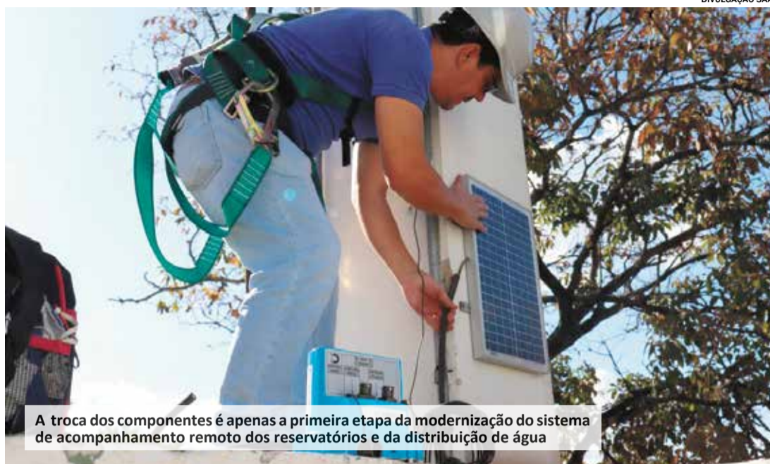
A troca dos componentes é apenas a primeira etapa da modernização do sistema de acompanhamento remoto dos reservatórios e da distribuição de água

zométrico, alimentado por energia solar, é composto por um sensor que mede as oscilações do nível da água e transmite essas informações através de um modem instalado na própria estrutura do reservatório para o centro de monitoramento da autarquia, a cada 5 minu-