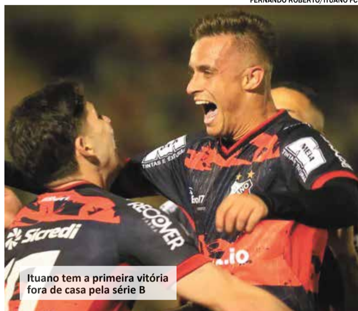
Ituano tem a primeira vitória fora de casa pela série B