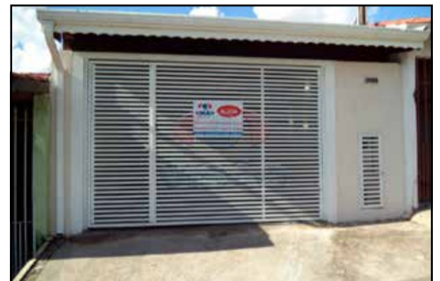
ref. site 301181 - Jardim Morada do Sol - 2 dormt/ sala/ coz/ WC/lavand /2 gar cobertas.R$1.250,00 + IPTU