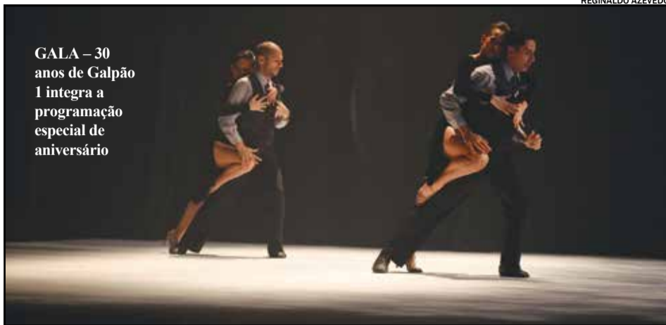
GALA – 30 anos de Galpão 1 integra a programação especial de aniversário

A noite será composta por trabalhos de jazz, balé clássico, hip hop e dança contemporânea, com coreografias de Erika