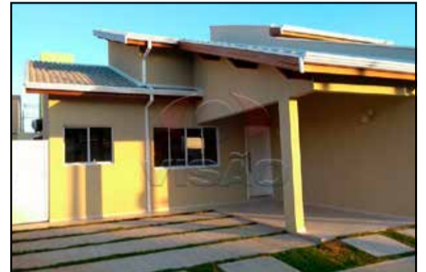
ref. site 662891 - Park Real - 3 dormt/ 1 suite/ sala 2 amb/ coz/ wc social/ churrasq/ 1 garagem coberta R$1.800,00 + COND + IPTU