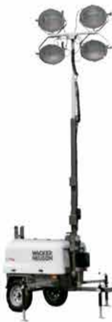
TORRE DE ILUMINAÇÃO