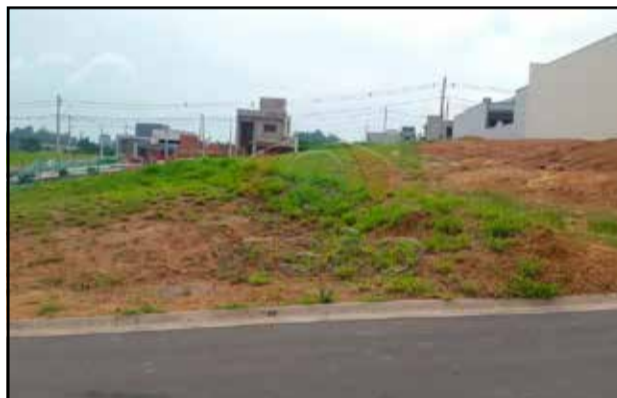
ref. site 808991 - Jardim Brésca - Terreno com 300 m 2 - R$155.000,00