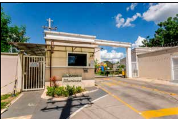
ref. site 360002 - Spazio Illuminare - 3 dormt/ 1 suite/ sala 2 amb/ cozinha planej/ lavand/ wc / 1 gar R$220.000,00