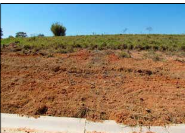
ref. site 461891 - Jardim Laguna - Terreno com 300 m 2 -R$175.000,00