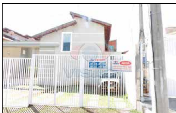
ref. site 134231 - Carlos androvandi - 2 dorm. / sala / coz. / wc / as / lavanderia / gar. R$ 162.000,00