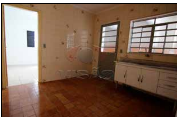
ref. site 316202 - 2 dormt / sala/coz / wc / lavand / quintal / 1 gar R$900,00 + IPTU