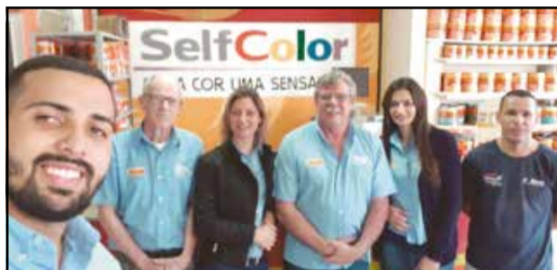
Equipe da Aquarela Tintas, sempre atendendo seus clientes com toda dedicação e carinho! Vá conferir as ofertas especiais!