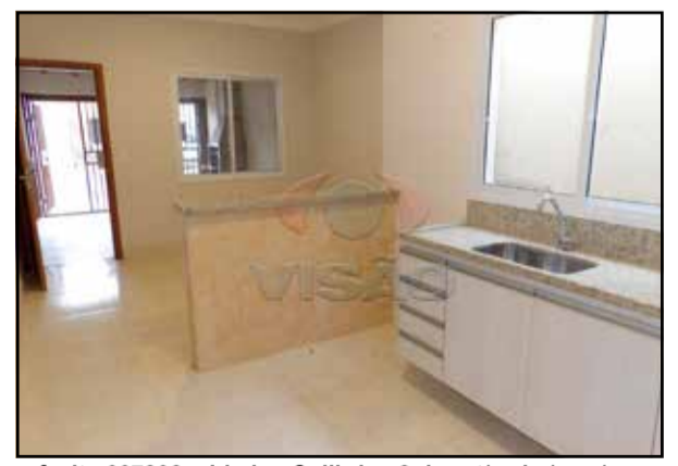
ref. site 667202 - Jd. dos Colibris - 2 dormt/ sala / coz/ wc /lavand / 1 gar/ portão eletrônico/ churrasq R$1.300,00 / R$250.000,00