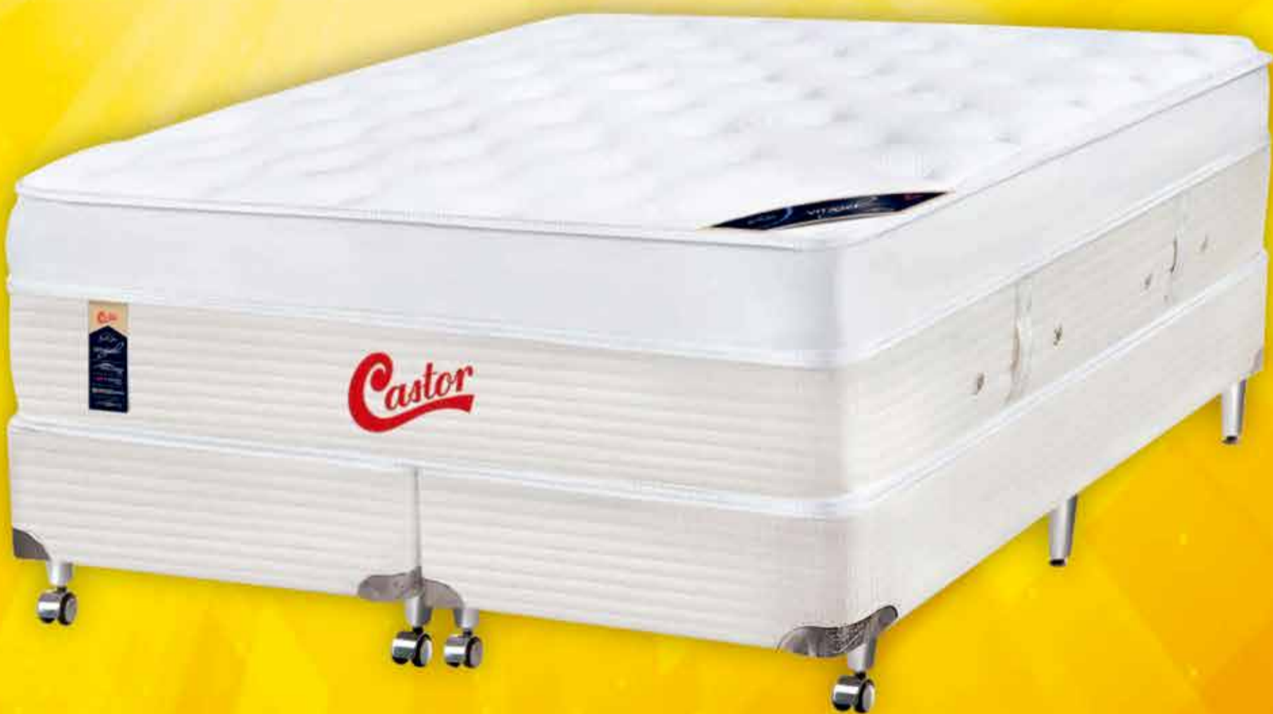
Imagem meramente ilustrativa. Descontos de até 50%. Descontos não cumulativos.