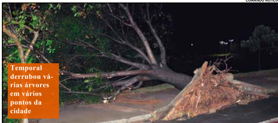
Temporal derrubou várias árvores em vários pontos da cidade