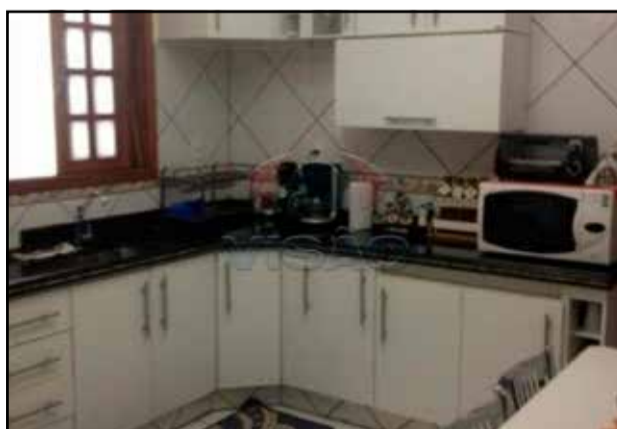
ref. site 657761 - Jd. do Valle- 3 dorm.(suite) / sala / coz. / wc / as / edicula / gar. 2 vagas / chur. / R$ 410.000,00