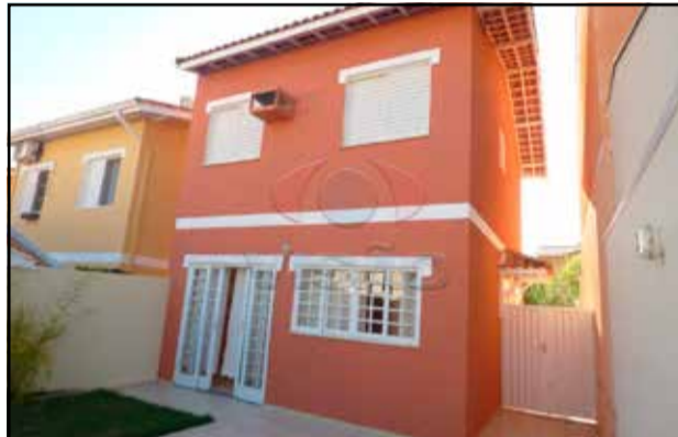
ref. site 37733 - Resid Flanboyant - 3D. (ste c/ armarios) sala/ lavabo/ coz planej/ wc c/ armário/ lav / wc emp/ quintal/ gar/ R$ 1900,00 + COND + IPTU