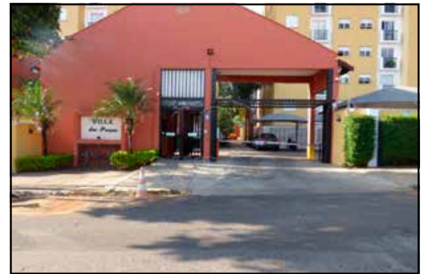
ref. site 265202 - Villa das Praças - 2 dormt planej/ sala/ coz planej/ wc / lavand/ 1 gar R$950,00 + COND + IPTU