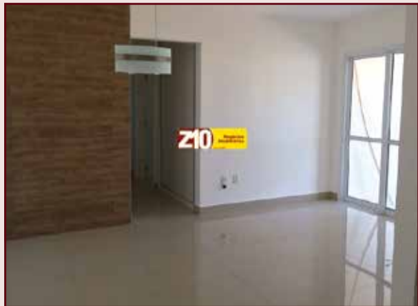
AP04273 - PÁTIO ANDALUZ - AU 83 m 2 - 03 dormitórios sendo 01 suíte com armário planejado, cozinha planejada, sala dois ambientes, WC social, lavanderia, garagem descoberta para 01 auto. R$ 410.000,00.