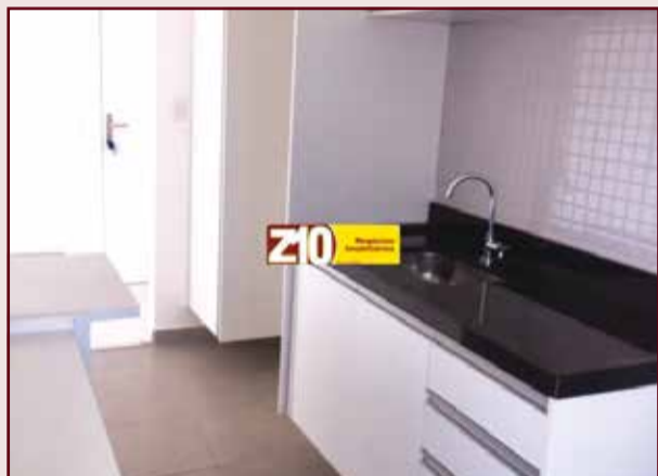
AP02309 - MAROC - AU 67,97m 2 02 dormitórios, sendo 01 suíte, WC social, sala de estar, sala de jantar, sala de banho, cozinha, área de serviço, espaço gourmet. Área de lazer completa. R$ 1.600,00 CONDOMÍNIO + IPTU.