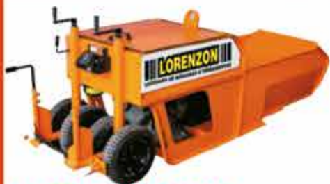
EXTRUSORA PARA GUIA E SARJETA