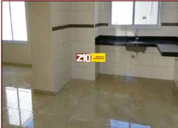
CA07032 - JARDIM RESIDENCIAL VENEZA - AT.150 m 2 AC.100 m 2 - 03 dormitórios sendo 01 suíte, sala, cozinha, lavanderia, WC social e garagem para 2 autos coberta. R$ 330.000,00