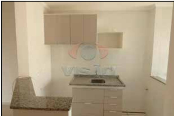
ref. site 592202 - Fonte de Trevi - 3 dormt / 1 suite/ sala 2 amb/ 2 wc / coz planej/ lavand/ 2 gar R$1.300,00 + COND + IPTU