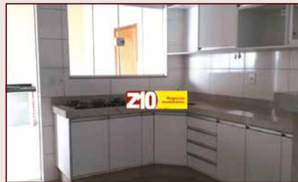
CA07914 - JARDIM ESPLANADA II - AT.300 m 2 AC.170 m 2 03 suítes planejadas, WC social, sala, cozinha planejada com cooktop, escritório planejado, área gourmet, banheiros com box e armários, garagem para 04 autos sendo 02 cobertas, jardim, área de luz, vídeo porteiro, portão eletrônico. R$ 3.000,00 + IPTU.