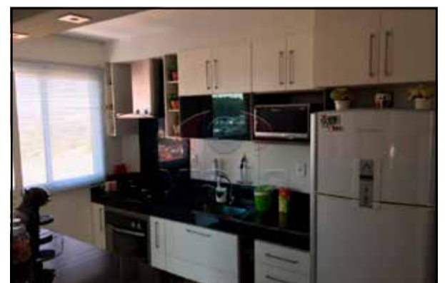
ref. site 181202 - Duetto Di Mariah - 3 dormt/ 1 suite / sala 2 amb/ coz planej/ lavand/wc /2 gar/ varanda gourmet/ R$390.000,00