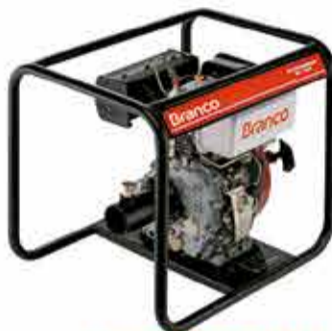
VIBRADOR DE CONCRETO A GASOLINA