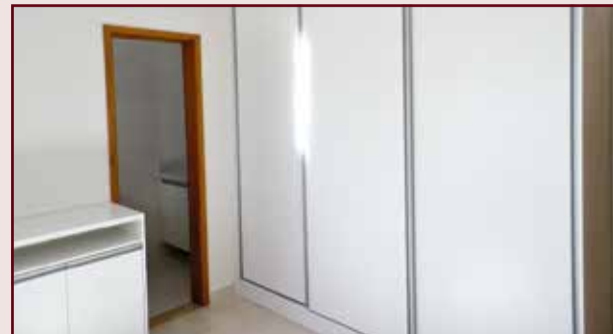
CA05980 - JARDIM REGENTE - JARDIM REGENTE - AT 125 m 2 / AC 85 m 2 - ótima casa térrea, fino acabamento, 3 dormitórios sendo 1 suíte, 1 banheiro social, sala 2 ambientes (estar e jantar) com pé direito alto, cozinha, área de serviço, churrasqueira coberta, quintal, garagem para 2 carros com portão automatizado. Casa com acabamento em piso porcelanato, mármores e granitos, moldura de gesso, esquadrias em alumínio e móveis planejados nos dormitórios e cozinha. R$ 347.000,00.