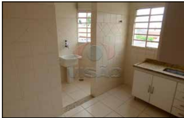
ref. site 11462 - Cidade Nova - 2 dorm.(suite) / sala 2 amb. / coz. / wc + arm. + box / as / gar. R$ 1.200,00 + COND + IPTU