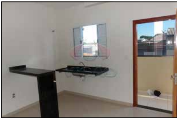
ref. site 017102 - Jd. Morada do Sol - 1 dormt/coz/ wc / lav/ Não possui garagem R$650,00 Incluso água, luz e IPTU