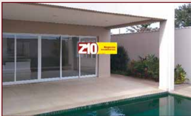
CA07868 - VILLE COUDERT - AT. 450 m 2 AC.296 m 2 - 4 suítes (todas com ar condicionado e armários planejados), lavabo, escritório, sala ampla para 2 ambientes com pé direito alto, cozinha, despensa com prateleiras, lavanderia planejada, piscina e garagem para 4 autos sendo 2 cobertas. Excelente acabamento. R$ 4.500,00 + CONDOMÍNIO + IPTU.