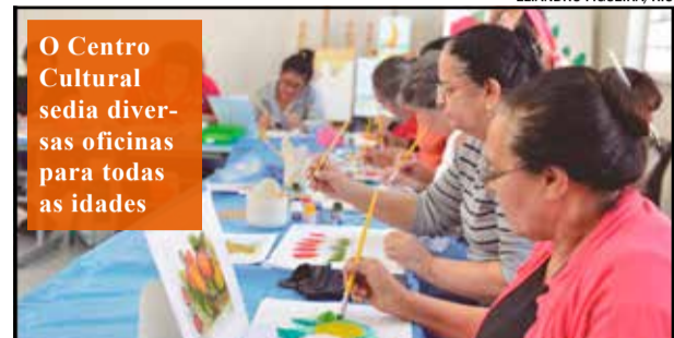
O Centro Cultural sedia diversas oficinas para todas as idades

Será inaugurado hoje, dia 21, às 19 horas o Centro Cultural “Hermenegildo Pinto”, conhecido como “Piano”, no Jardim Morada do Sol. O prédio passou por uma grande reforma durante as férias de julho.