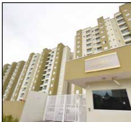
ref. site 179102 -Residencial Belvedere- 3 dormt/ 1 suite/ sala/ coz amer/ wc / lavand/ churrasq/ 1 gar R$900,00 + Cond + IPTU / R$310.000,00