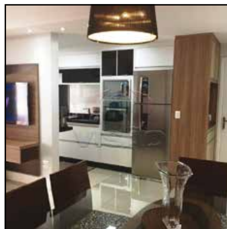
ref. site 490202 - Pátio Andaluz - 3 dormt / 1 suite / sala/ coz/ wc / lavand/2 gar R$455.000,00