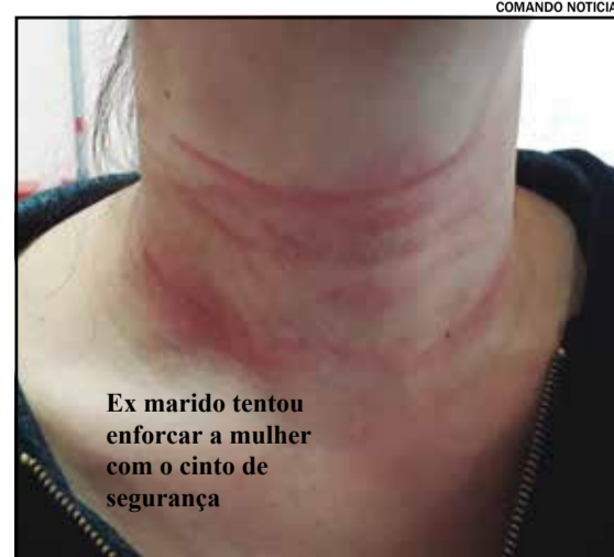
Ex marido tentou enforcar a mulher com o cinto de segurança