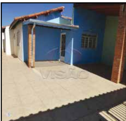
ref. site 095261 - João Pioli - 2 dorm.(suite) / sala / coz. / wc / as / gar. R$ 1.100,00 + IPTU