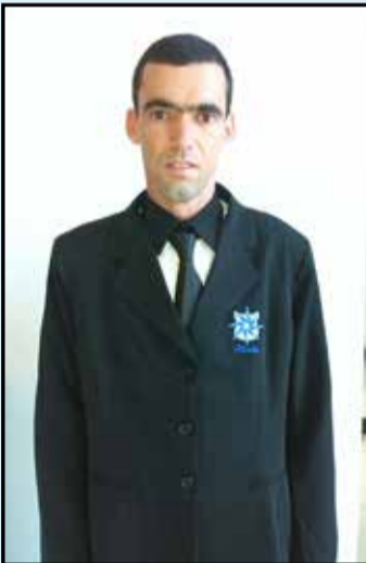
Juarez, dia 03/08