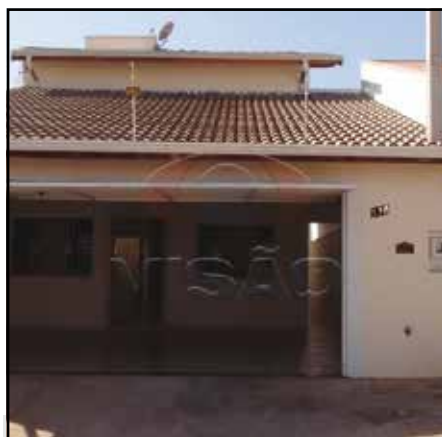
ref. site 811202 - Jardim União - 2 casas cada uma com 2 dormt/ 1 suite / sala / coz / lavanderia / 1 vaga de gar / portão eletrônico - R$420.000,00