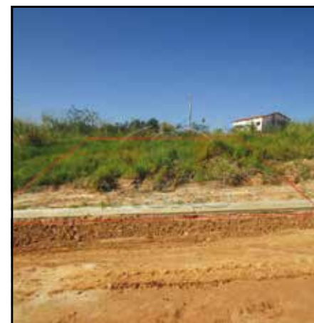
ref. site 762791 - Jardim Mantova - Terreno Residencial em condomínio fechado com 205 m 2 -R$120.000,00