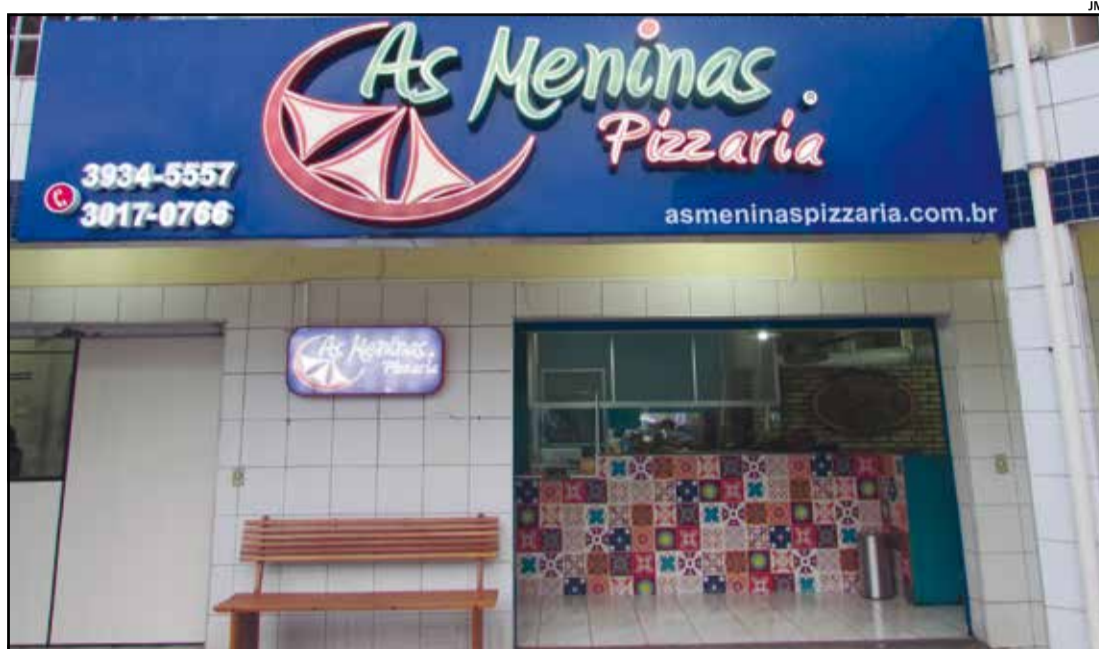
A pizzaria conta com 60 tipos de pizzas entre salgadas e doces