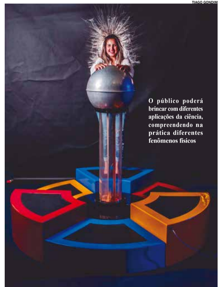
O público poderá brincar com diferentes aplicações da ciência, compreendendo na prática diferentes fenômenos físicos

- Bicicleta geradora: totalmente ecológica, quem pedalar esta bicicleta poderá fazer funcionar um rádio de carro, um painel de led e um ventilador somente com a energia gerada pelos pedais. E quem quer explorar o