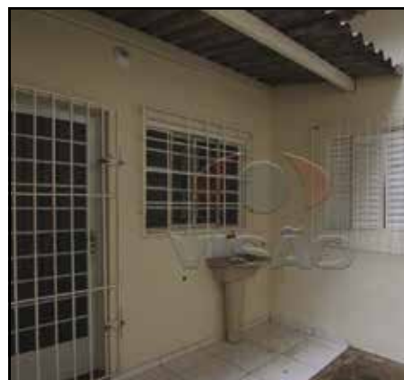
ref. site 306002 - Jardim Nely - 1 dormt/ sala/ coz/ wc / 1 gar R$700,00