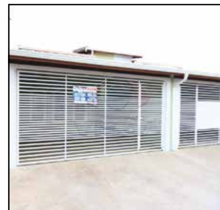
ref. site 933881 - Pq das Nações - 2 dormt / suite / wc / coz / sala / 2 gar / portão eletrônico - R$258.000,00