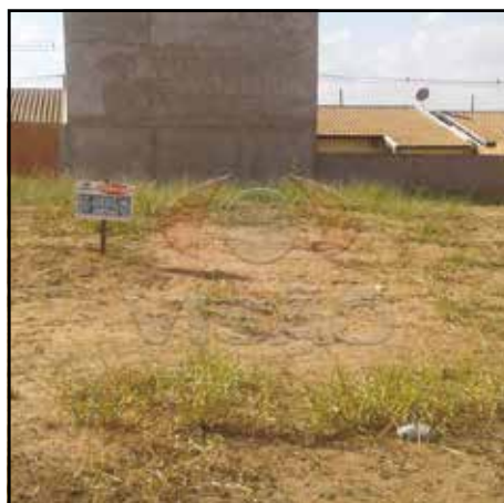
ref. site 370202 - Residencial Maria Dulce - Terreno com 150 m 2 - R$165.000,00