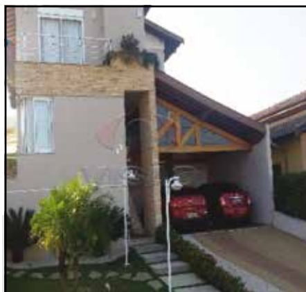
ref. site 983291 - Jd. Reserva Bom Viver de Indaiatuba - 4 dormt /4 suites / 3 salas / 6 wc / 2 vagas cobertas / 2 descoberta / R$1.060.000,00