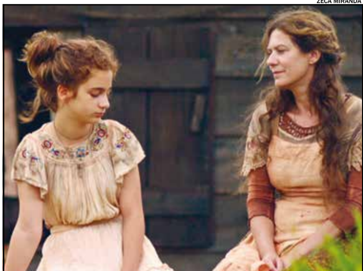
A história é uma adaptação de dois contos de Hilda Hilst, “O Unicórnio” e “Matamoros”