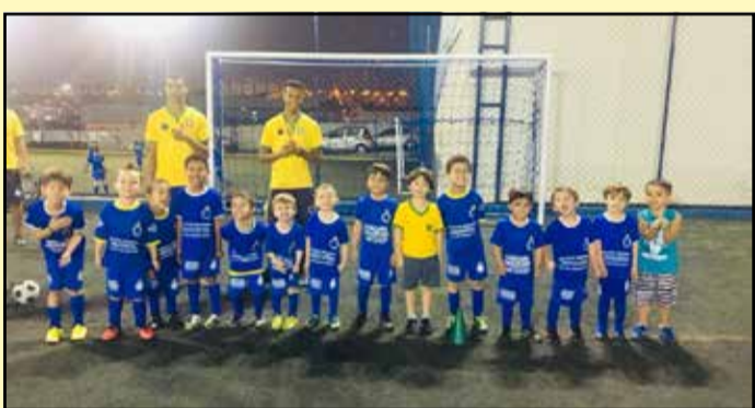
Equipe SUB 07 da Escola de Futebol Oficial do Cruzeiro em recente treino

Escola de Futebol Cruzeiro Indaiatuba: Onde nascem os campeões: treinos de manhã, tarde e noite, com professores capacitados para atender diversas idades entre 3 a 17 anos. Dê "bola" ao talento de seu filho!