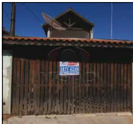
ref. site 658121 - Jd. Morada do Sol - 2 dorm.(suite) / sala / coz. / wc / as / gar.2 vagas. R$ 1.100,00 + IPTU