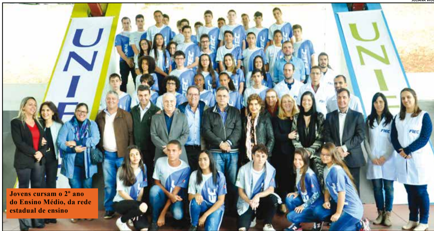
Jovens cursam o 2º ano do Ensino Médio, da rede estadual de ensino