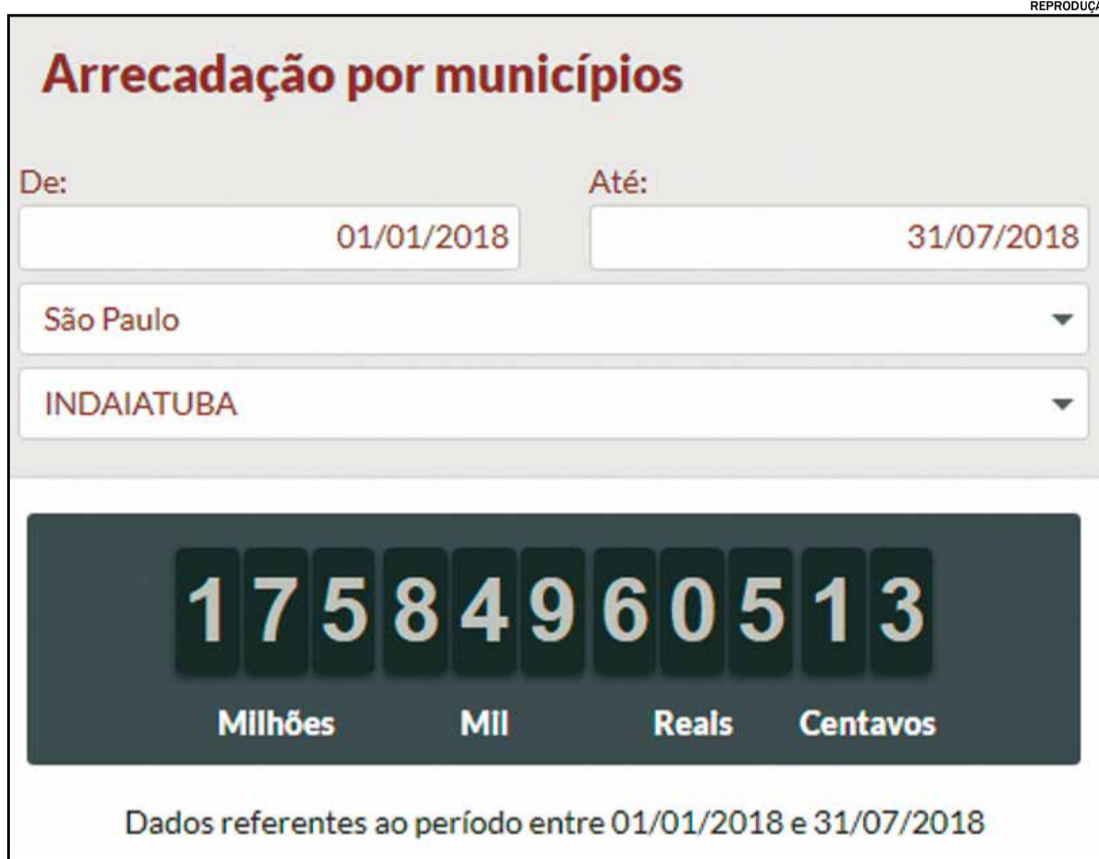
Cada cidadão indaiatubano pagou em média, R$ 733,92 de impostos, de janeiro a julho deste ano

Instituto Brasileiro de Geografia e Estatística (IBGE), a população de Indaiatuba em 2017 era de 239.602 pessoas. Levando