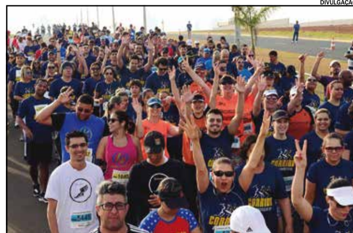
O evento é uma realização da AERIA e Secretaria de Esportes, Lazer e Juventude do Estado de São Paulo

No dia 30 de setembro, às 8 horas, Indaiatuba recebe a Corrida das Indústrias. A saída será na frente da Prefeitura Municipal. A prova fará parte das comemorações do outubro rosa.