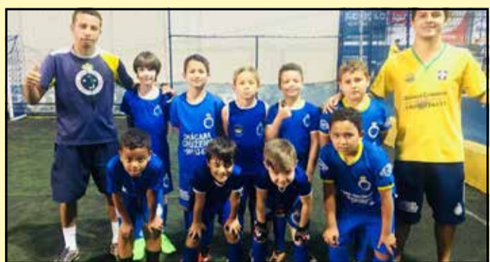
Equipe SUB 09 da Escola de Futebol Oficial do Cruzeiro em recente treino