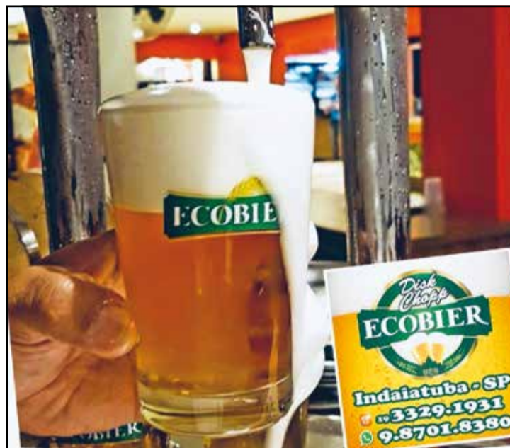
CHOPP ECOBIER PARA O DIA DOS PAIS - Kit com 30 lts de Chopp com a Chopeira Elétrica por apenas R$ 270,00 e ainda entrega na sua casa. Tel: 3329.1931 / 9.8701.8380

Chácara Cruzeiro para alugar com salão de festa, playground, 2 piscinas (adulto/infantil), deck, campo de futebol com grama sintética e estacionamento. "Onde Seus Momentos Se Tornam Inesquecíveis" F. 9.9112-6333