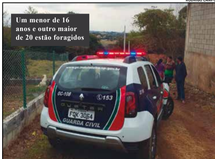
Um menor de 16 anos e outro maior de 20 estão foragidos