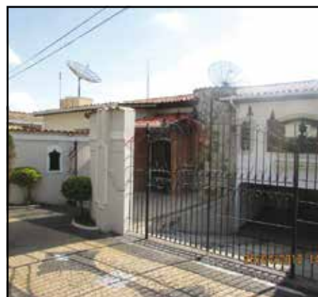
ref. site 81941 - Vila Sfeir- 3 dorm.(1 suite) / sala 2 amb. / coz. planej. / wc / as / chur / piscina / 4 gar/ portão eletrônico/R$ 3.000,00 + IPTU