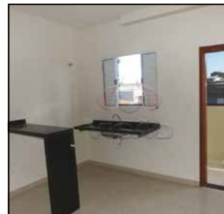
ref. site 017102 - Jardim Morada do Sol - 1 dorm/ coz/ wc / lavand/ não possui garagem R$650.00

TODOS OS VALORES ACIMA ESTÃO SUJEITO A ALTERAÇÕES