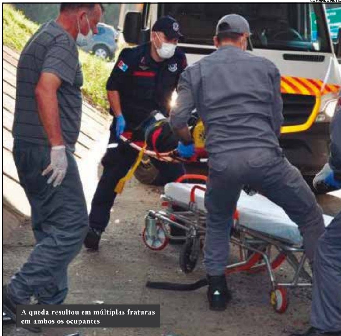
A queda resultou em múltiplas fraturas em ambos os ocupantes

A Polícia Científica esteve no local, devido à gravidade do acidente.