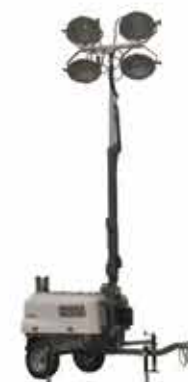
TORRE DE ILUMINAÇÃO

Imagens meramente ilustrativas Veiculação de 10-08 a 16-08