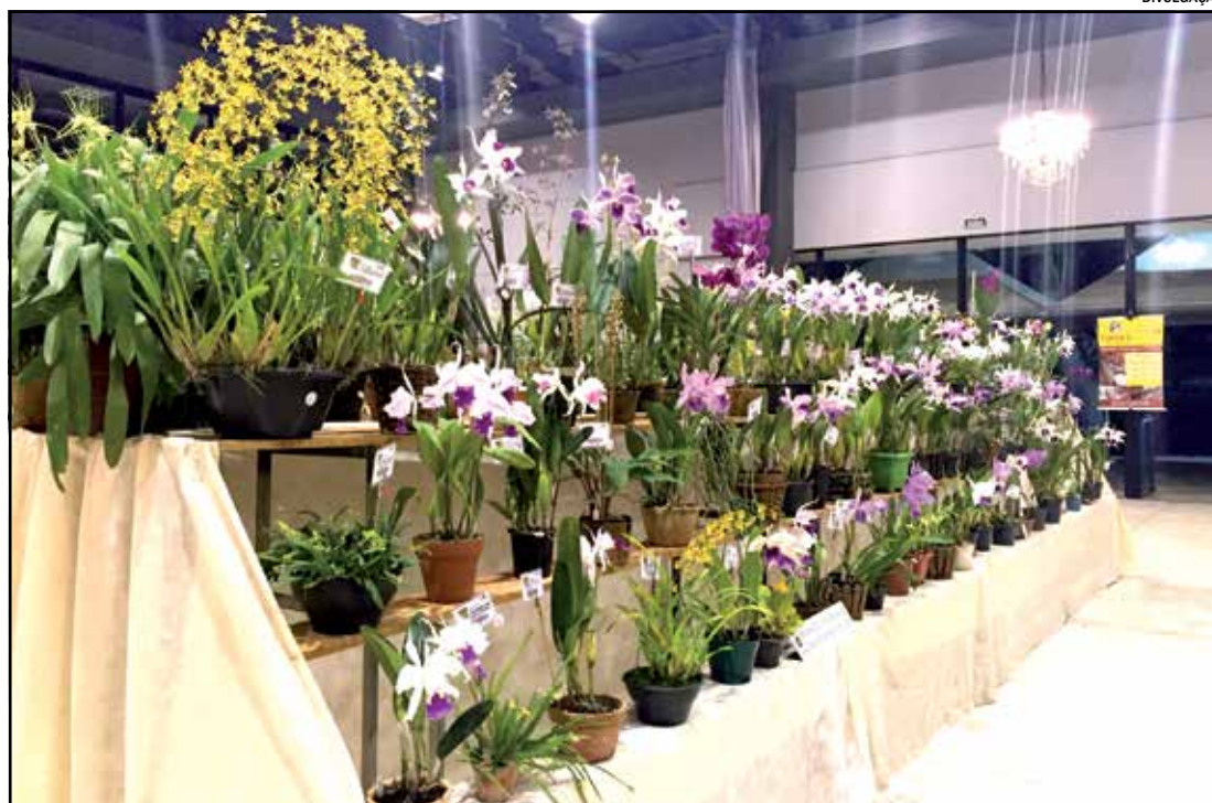
Diversas espécies de orquídeas estarão expostas e mudas da planta serão vendidas

Cerca de 4 mil mudas de orquídeas também estarão disponíveis para venda, com preços que variam de R$ 10 a R$ 50, mas com outras que podem chegar até R$ 300.