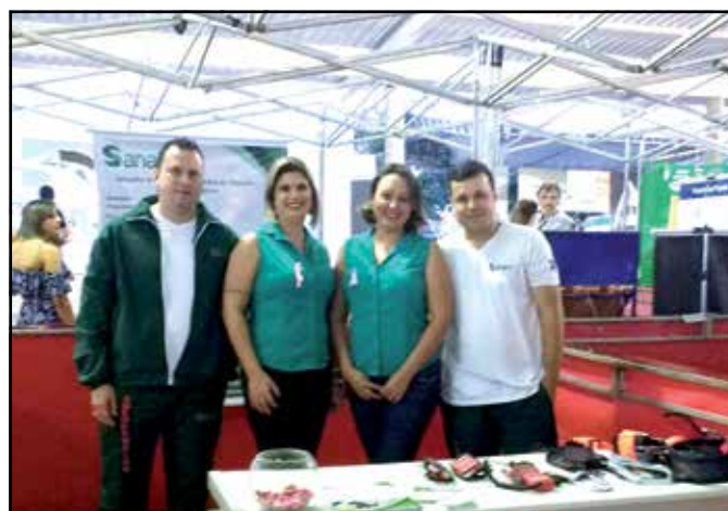
Equipe Sanare participando da Saem e Arqmax – Semana Acadêmica de Engenharia e Arquitetura da Faculdade Max Planck