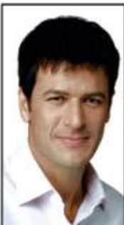
Rogério Nogueira Deputado