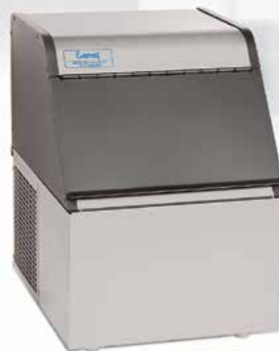
MÁQUINA DE GELO EVEREST EGC 50A

R. 7 de Setembro, 955 - Centro - Indaiatuba F: 19 3875-0356 - orlando.nair@hotmail.com