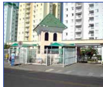
AP00149 - Condomínio Fechado 03 dormitórios. A/T: 78m² A/C: 78m² R$ 290.000,00