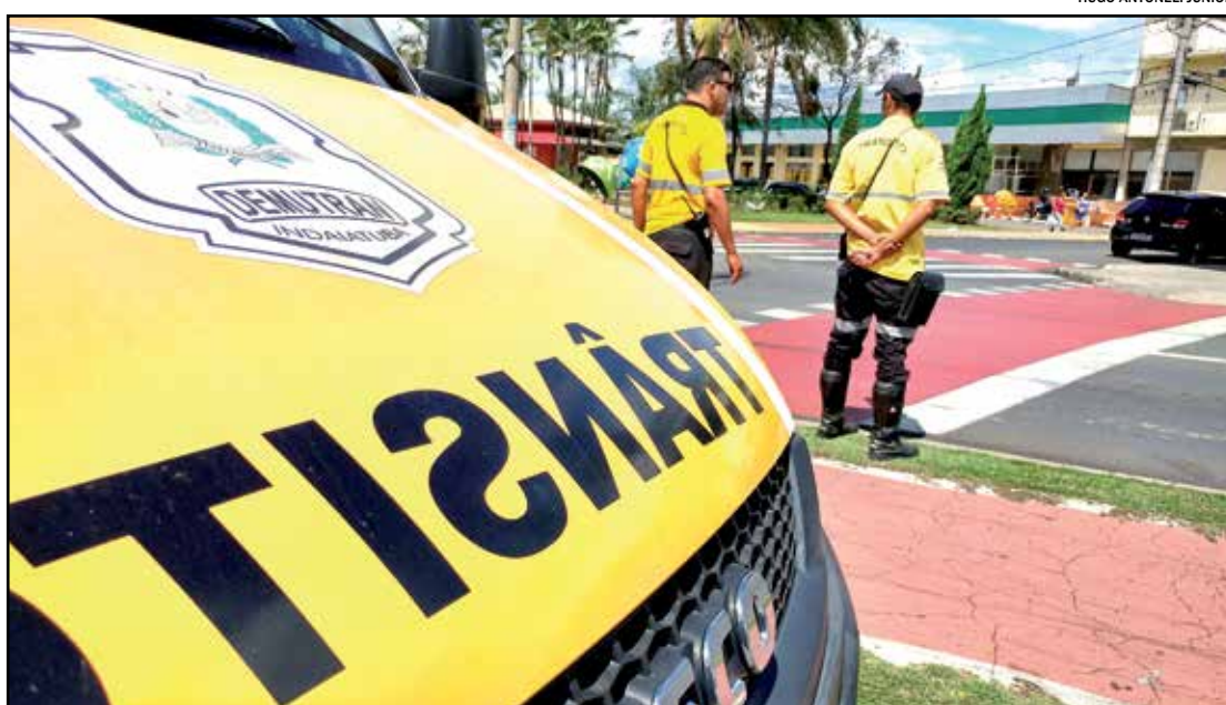
Novos valores das multas passam a entrar em vigor na próxima semana

Para o secretário municipal de Obras e Vias Públicas, o au-