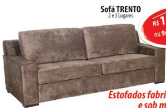
Sofá TRENTO 2 e 3 Lugares

R$ 1.632,00 a vista ou 9x de R$198,00 s/ entrada