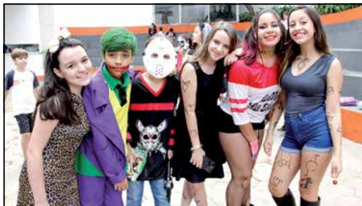
Alunos do 7º ano, do Colégio Rodin, fantasiados para o Halloween