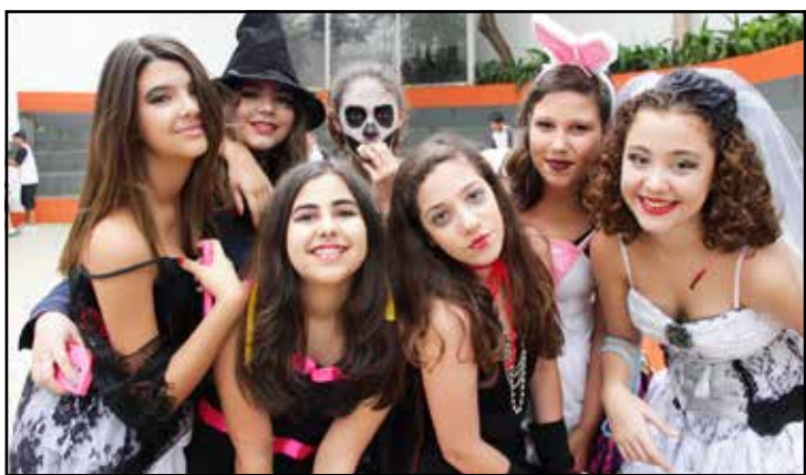
Alunas do 7º ano, do Colégio Rodin, durante o Halloween feito pela escola

Visite nosso site: www.maisexpressao.com.br