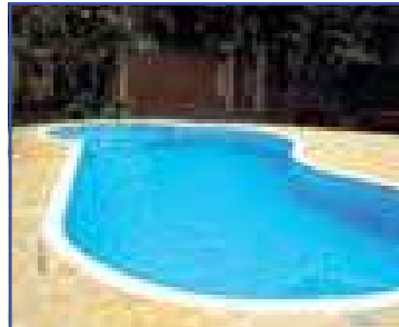
CH00054 – Terras de Itaici 03 dormitórios sendo 01 suíte. A/T: 1000m² A/C: 240m² R$ 800.000,00