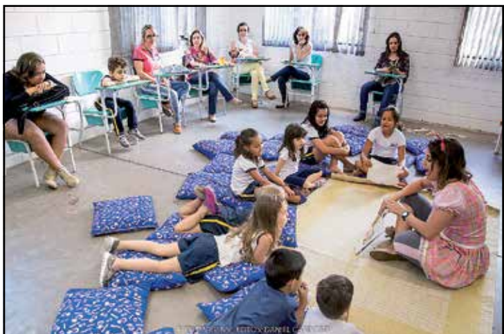
A sala de Contação de Histórias despertou a imaginação das crianças na Feira do Conhecimento do Objetivo