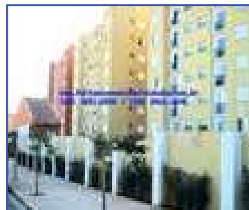
AP00261 – Condomínio Fechado 02 dormitórios. A/T: 60m² A/C: 60m² R$ 235.000,00