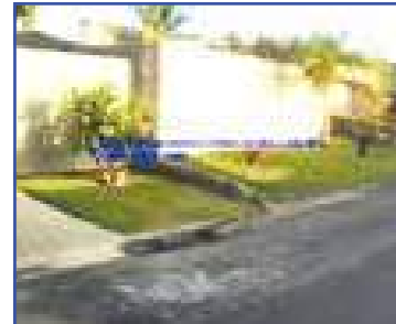
CH00094 – Terras de Itaici 03 suítes. A/T: 1200m² A/C: 600m² R$ 1.200.000,00