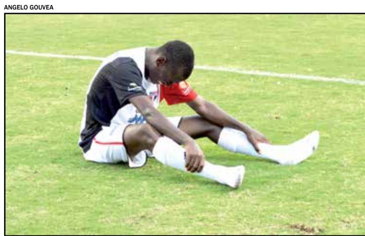
Derrota por 5 x 0 pôs um ponto final na trajetória do Sub-20

Apesar da derrota, esta foi a primeira vez que um time Sub-20 passa de fase na disputa do Paulista. “O grupo fez uma excelente campanha e os jogadores provaram que podem chegar a um time profissional, até mesmo no Primavera, pois este é nosso objetivo: formar jogadores”, diz. “Na campanha geral terminamos em 13º, numa competição com 46 equipes. Dentro das nossas condições, isso foi excelente.”