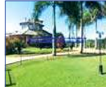
CH00088 – Condomínio Fechado 04 suítes. A/T: 5000m² A/C: 700m² R$ 2.500.000,00