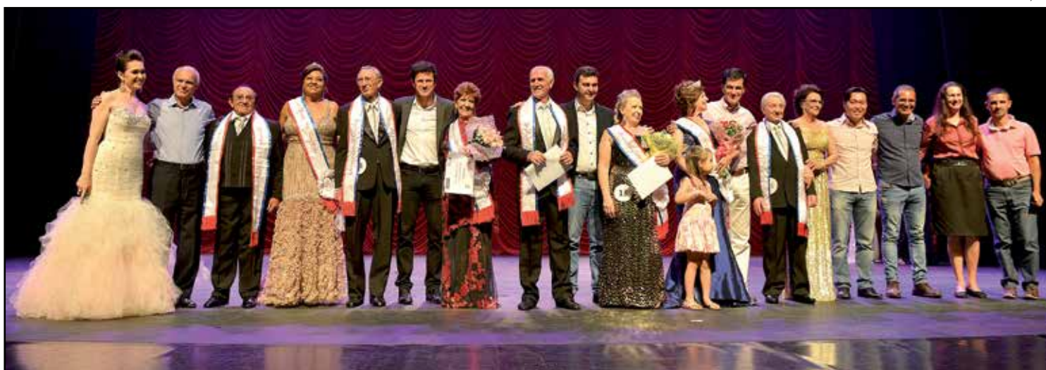
Cinco homens e quinze mulheres participaram desta edição do concurso, que no domingo escolheu os seus representantes

DA REDAÇÃO maisexpressao@maisexpressao.com.br