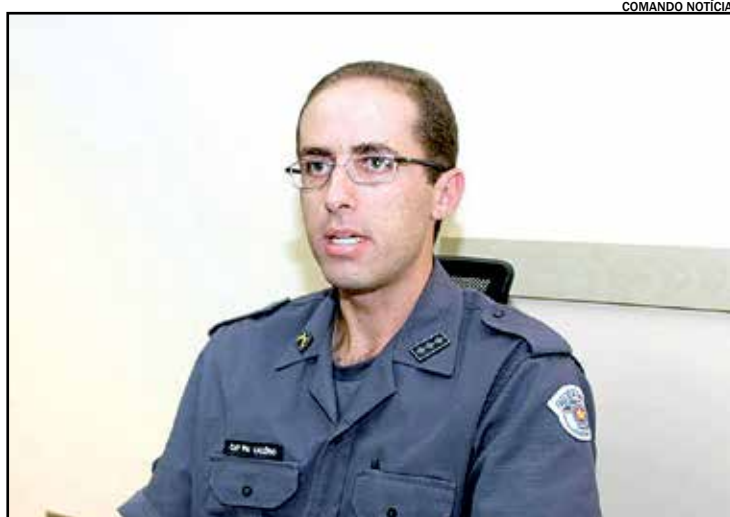
Segundo o capitão da PM, moradores devem ficar atentos a ação dos criminosos quando estiverem pelas ruas da cidade

HUGO ANTONELI JUNIOR Especial para o Mais Expressão maisexpressao@maisexpressao.com.br