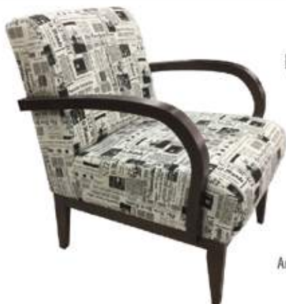
Poltrona CLASS Tecidos categoria A