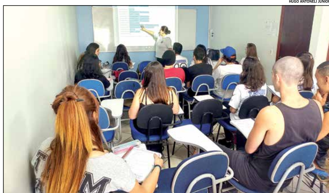
Faltando uma semana para o "grande dia", alunos 'correm' para irem bem na prova do Enem