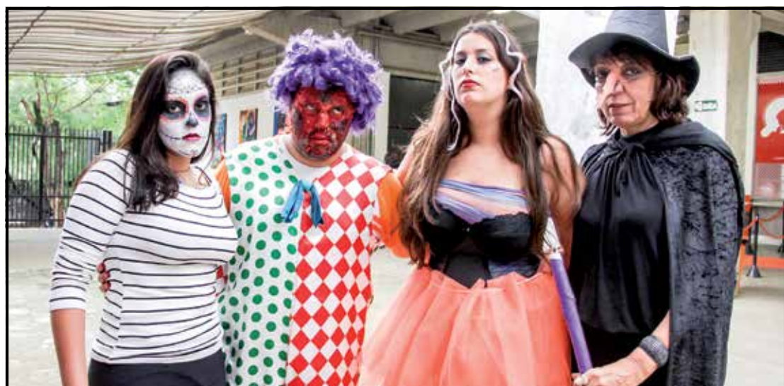
A equipe de monitores do Colégio Rodin também se fantasiou para o Halloween