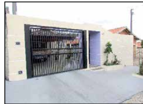
53056 – Jd do Sol – Ac 151m 2 - 2 dorm - 2 gar – R$ 420.000,00