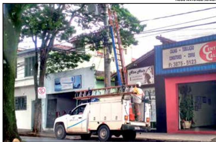
Até a tarde de ontem 800 pontos na cidade estavam sem energia

Os moradores foram orientados a não frequentar o cômodo atingido até a vistoria técnica de um engenheiro. Após a vistoria o local foi liberado para remoção de escombros e ação de manutenção.