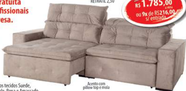
Sofá CREMONA RETRATIL 2,50

Nos tecidos Suede, Animale, Pena e Amassado