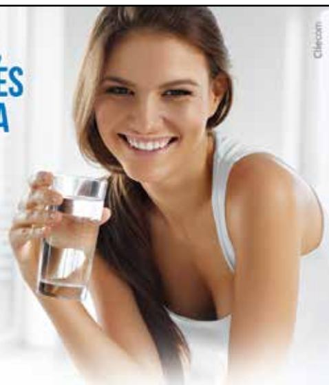
PURIFICADORES DE ÁGUA SOFT