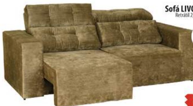
Sofá LIVORNO Retratil 2,20

Nos tecidos Suede, Animale, Pena e Amassado