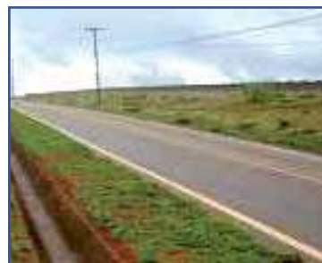
Monte Mor - Gleba na Estrada Municipal de Indaiatuba a Monte Mor 2.571.800 m2 R$ 110,00/m2