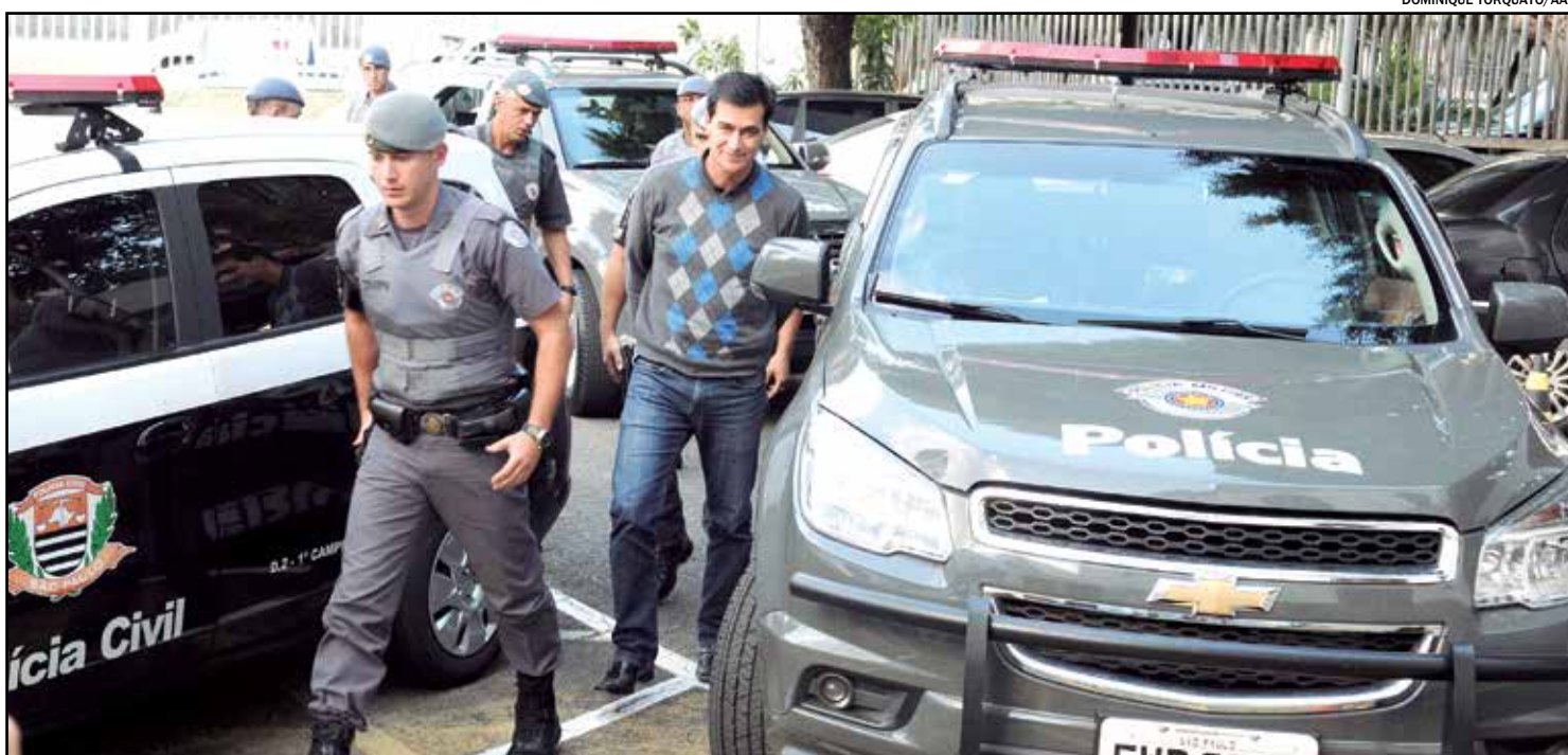
O prefeito licenciado Reinaldo Nogueira é suspeito de liderar um esquema de ‘cobrança de percentual’

No início de novembro completam-se seis meses desde o primeiro afastamento do prefeito Reinaldo Nogueira. O primeiro pedido de retirada à Câmara aconteceu em maio e ele chegou a ficar 14 dias de licença, mas precisou voltar porque o vice, Antonio Carlos Pinheiro, também tirou férias. Após a volta de Pinheiro,