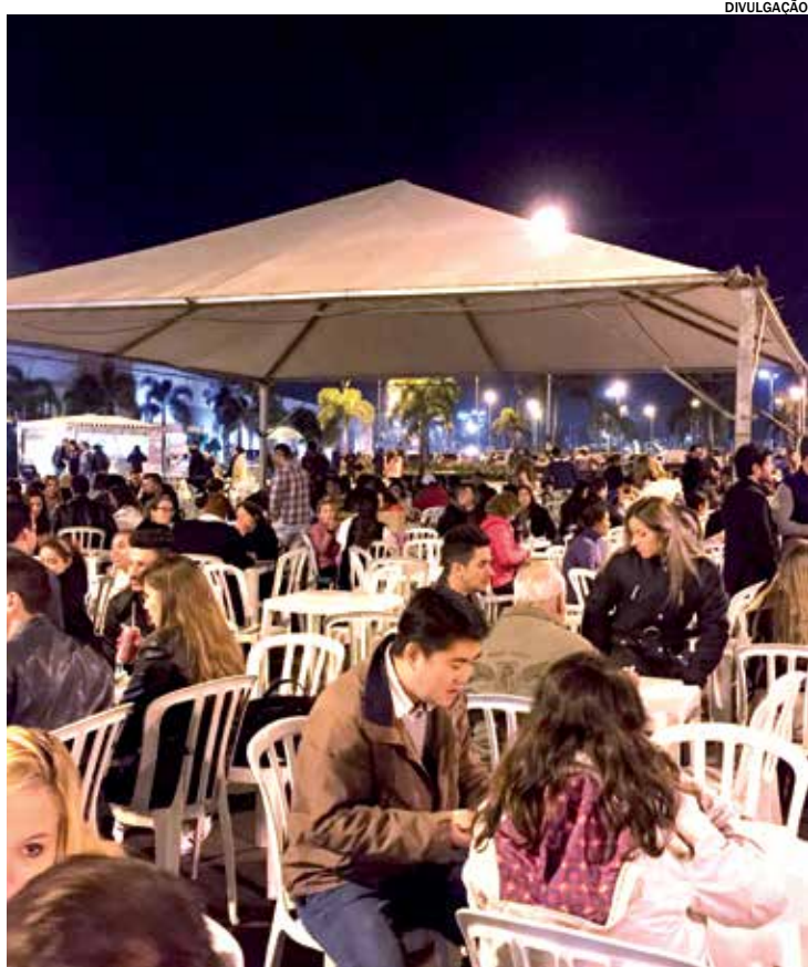
Evento acontece até domingo no estacionamento do shopping

O Polo Shopping Indaiatuba sedia a partir de hoje, dia 28, a 3ª edição do Agito Food Truck. O evento vai até domingo, dia 30, das 12h às 22 horas, no estacionamento do empreendimento. Os presentes poderão saborear pratos de mais de operações entre trucks, vans e bikes.