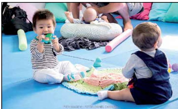
Bebês se preparando para a Dança Materna na Feira do Conhecimento do Objetivo