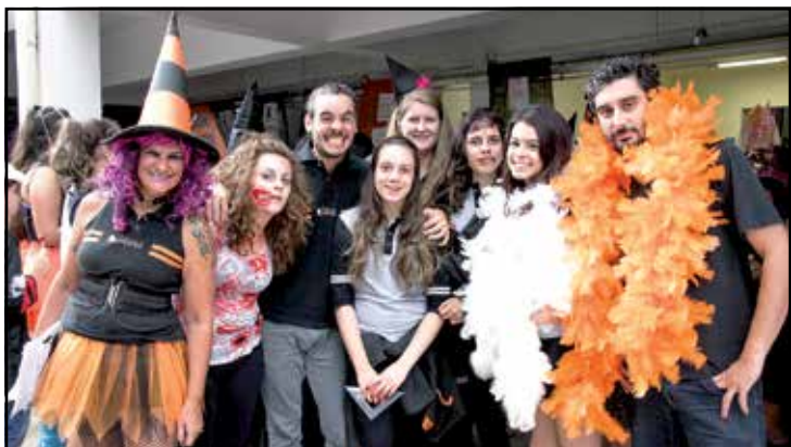
Alunos e professores do Colégio Rodin se divertem no Halloween