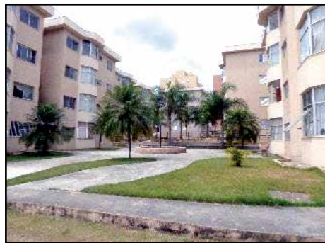
64093 – Res Nações Unidas – Au 60 m 2 - 2 dorm – 1 gar – R$ 230.000,00