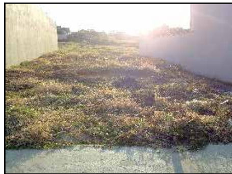
64114 – Jd Europa – At 250m 2 - R$ 175.000,00