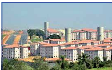
Área 1: excelente área para loteamento – gleba adjacente ao bairro Campo Bonito 3.000.000 m2 ( três milhões), R$120,00/m2 – área 2 Campo Bonito, 1.839.878 m2 R$ 130,00/m2