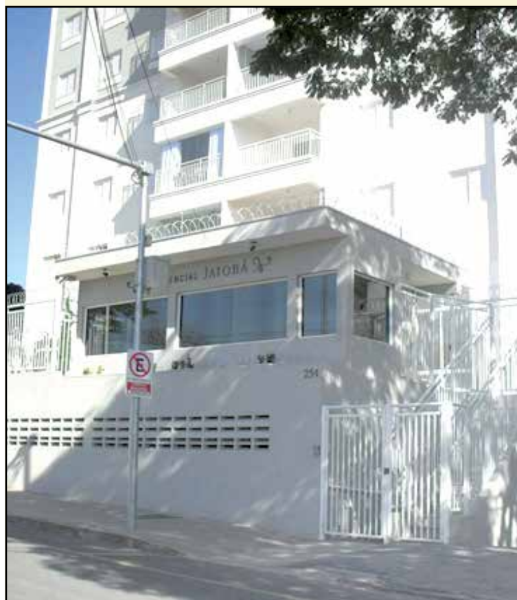
Apartamento residencial jatobá (CENTRO) de R$ 800.000,00 por R$ 690.000,00 * APROVEITE*