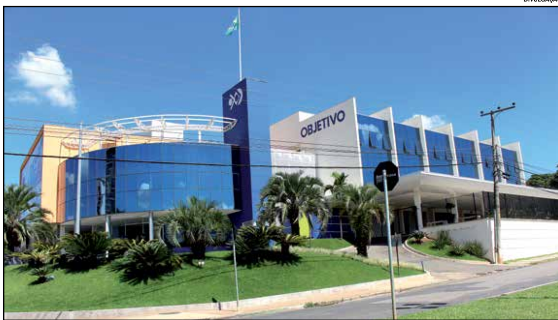
Prêmio recebido pelo Objetivo é considerado o maior de Arquitetura da América Latina

O projeto do Colégio Objetivo Indaiatuba, assinado pelo Escritório Ricardo Bandeira, foi premiado ao lado de outros trabalhos importantes e de projeção nacional, como a Casa da Sustentabilidade - Campinas, na categoria Obras Públicas (projeto), a Orla Conde do Rio de Janeiro-RJ, na categoria Obras Públicas (obra realizada) e o Estúdio Olímpico da TV Globo, utilizado nos Jogos