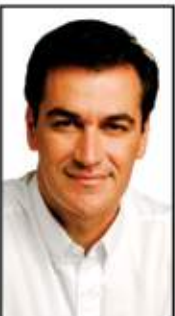
Reinaldo Nogueira Prefeito