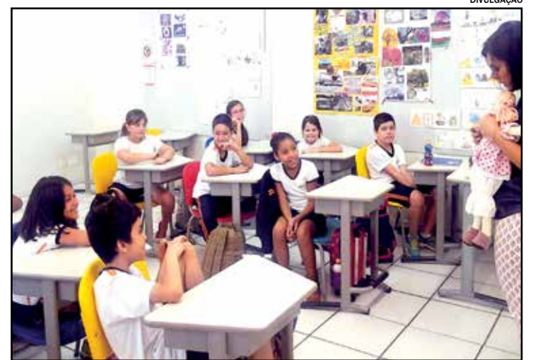
Projeto tem participação dos alunos dos 3ºs anos do Fundamental I

O último encontro Pame deste ano, no Colégio Montreal, está marcado para o dia 22 de novembro.