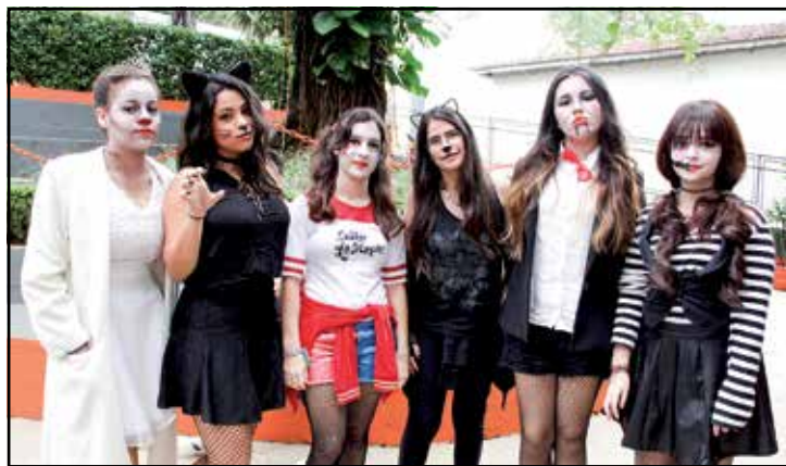
Alunas do 9º ano, do Colégio Rodin, com suas fantasias de Halloween