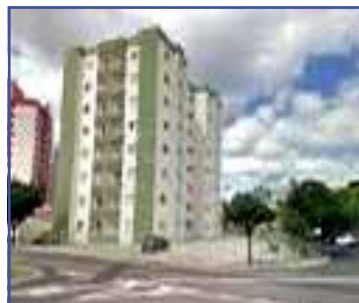
AP00468 – Condomínio Fechado 03 dormitórios. sendo 01 suíte A/T: 84m² R$ 255.000,00