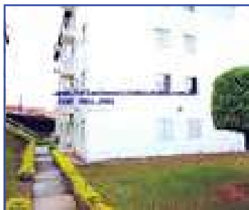
AP00333 – Condomínio Fechado 02 dormitórios. A/T: 57m² A/C: 57m² R$ 215.000,00