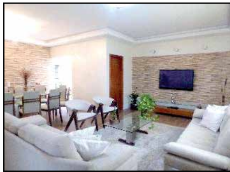
64091 – Jd Esplanada – Ac 175m 2 - 3 suítes – 2 gar – R$ 750.000,00