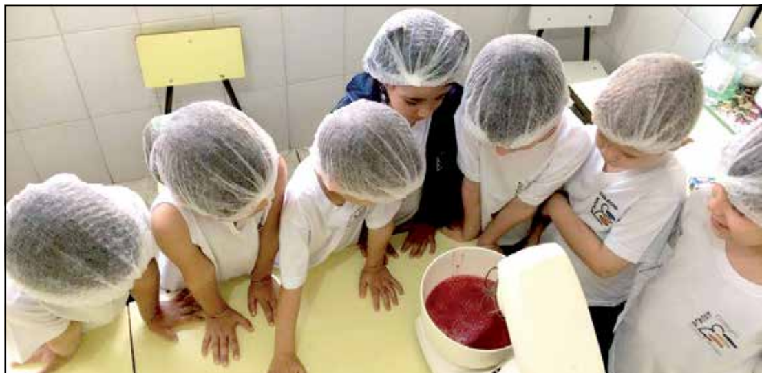
Diversas atividades fora da sala de aula são desenvolvidas pelo Colégio Escala