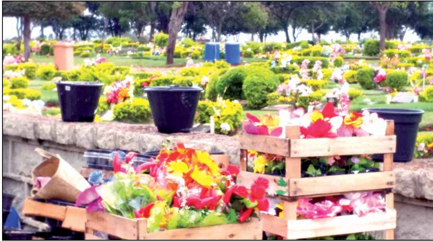
Apesar do pessimismo nas vendas, flores já estão sendo vendidas em frente aos cemitérios de Indaiatuba