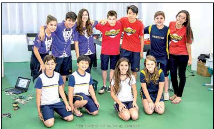
Equipes de Robótica do Objetivo na Feira do Conhecimento do Colégio