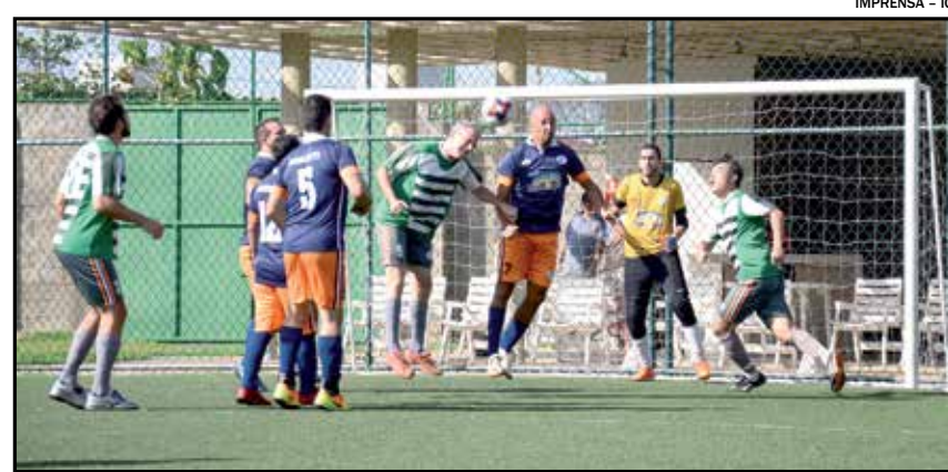
Caso haja empate nos jogos, campeão será definido nas cobranças de pênaltis

Isso porque, menos de um minuto depois, no último lance da partida, em uma cobrança de escanteio, o goleiro do Vizzent foi para a área e, sem marcação, cabeceou para o fundo da rede, empatando o jogo em 3 a 3 e colocando a equipe na decisão.