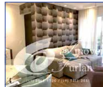
AP00486 - Cond Maroc 3 dorm. Sendo 1 suíte , com área de lazer total at 85m2 R$ 500.000,00