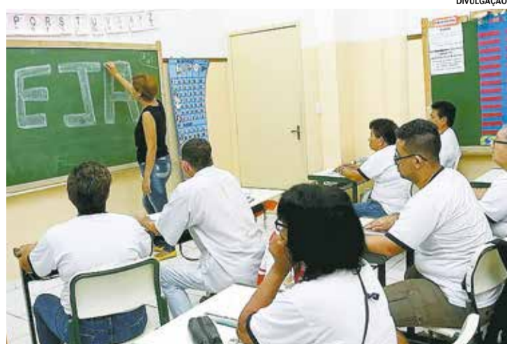
SALTO TEJA abre matrículas até 21 de julho para Educação de Jovens e Adultos. Pág. A9