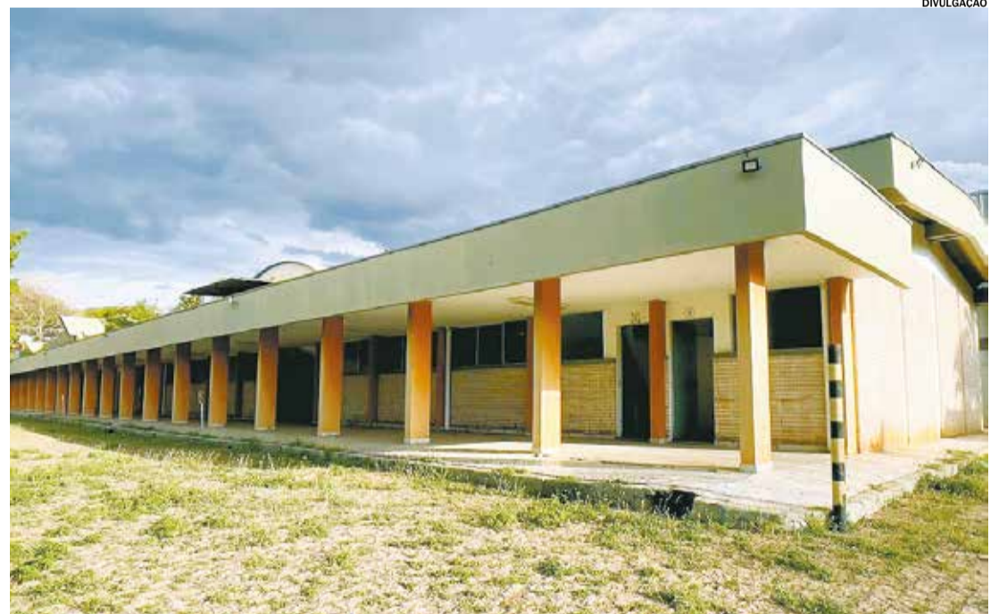
Salto iniciou a reforma e ampliação da nova sede da Guarda Civil, com investimento de R$ 1,29 milhão