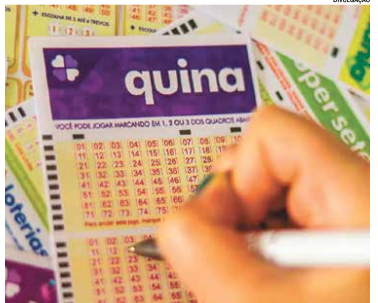
Aposta feita na cidade levou R$ 26,6 milhões na Quina de São João

Segundo dr. William, justamente por ser socialmente aceito, o problema costuma permanecer escondido durante muito tempo. "Diferentemente do álcool ou de outras drogas, a dependência em jogos costuma ser banalizada. A maioria dos pacientes procura ajuda apenas quando já perdeu o controle financeiro ou quando os prejuízos familiares e emocionais se tornaram muito graves."