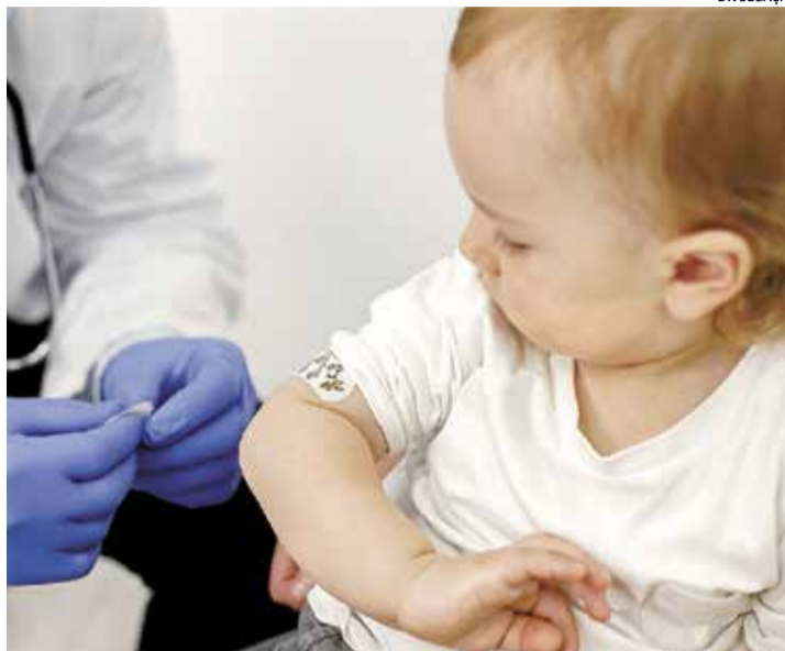
A vacinação é uma das principais formas de prevenção de doenças

Com o objetivo de transformar informação em cuidado e prevenção, a Prefeitura de Rafard promoveu de 1 a 3 de julho, a campanha Julho Amarelo, dedicada ao combate às hepatites