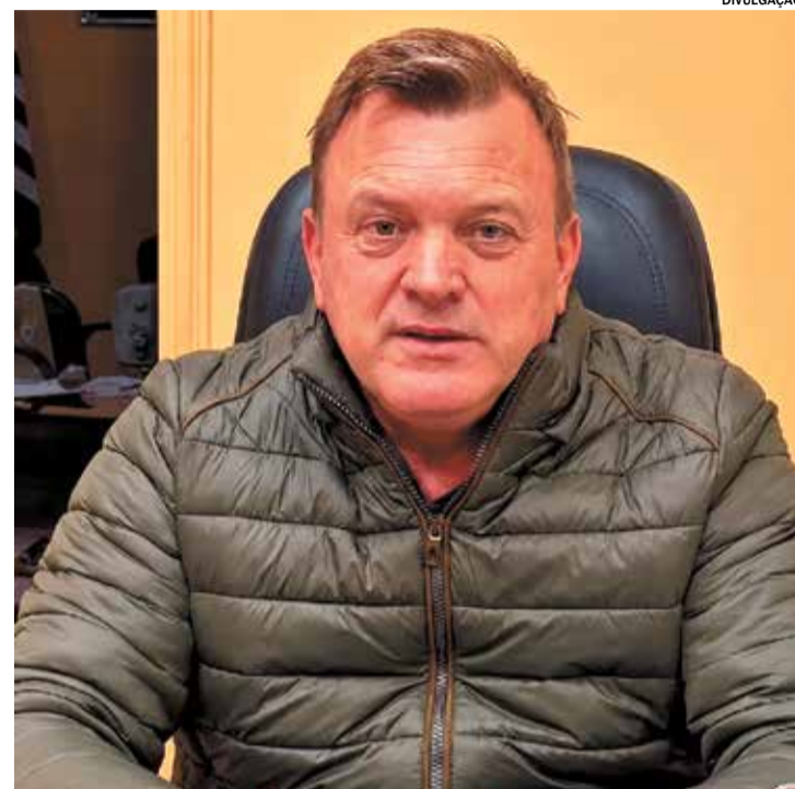
O prefeito utilizou as redes sociais para prestar contas do mandato

prefeito, após negociações foi firmado um acordo para que os reparos necessários sejam executados. "Seguimos trabalhando para corrigir problemas herdados, sempre com responsabilidade,