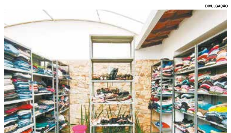
ITU Campanha do Agasalho arrecada doações em diversos pontos de coleta espalhados da cidade. Pág. A10