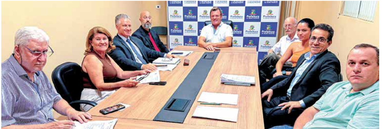
Os salários dos servidores também já foram pagos, garantindo o cumprimento com os compromissos assumidos pela administração

O pagamento do vale-alimentação representa mais do que um benefício ao funcionalismo público, é um estímulo à economia local. Antes, os servidores rece-