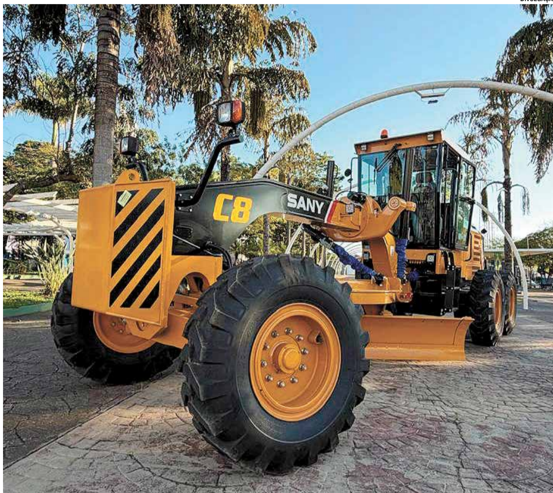
A motoniveladora será utilizada na manutenção, conservação e recuperação de vias urbanas e rurais

“Essa conquista representa mais um avanço para Elias Fausto. Depois de 10 anos, nosso município volta a receber uma patrol, um equipamento fundamental para melhorar a manutenção das nossas estradas e vias. Estamos trabalhando para equipar cada vez mais a cidade, oferecendo melhores condições para que nossas equipes prestem um serviço de qualidade à população. Agradecemos ao Governo do Estado pela parceria e seguimos em busca de novos investimentos para nossa cidade”, destaca o prefeito Tato Bicudo.