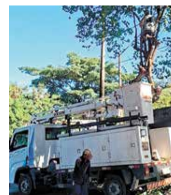
Equipes realizam serviços de manutenção urbana, poda, capina e limpeza

os moradores podem registrar solicitações pelos canais oficiais de atendimento, permitindo que as equipes programem e executem os serviços conforme a demanda, garantindo a conservação dos espaços públicos e a segurança da população.