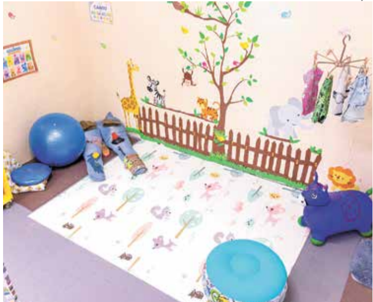
A sede "Professor Nadir Assalin" fica na rua Pedro Stucchi, 381

A Prefeitura de Capivari, por meio da Secretaria Municipal da Educação, inaugurou a primeira sala sensorial do município. O novo espaço fica na Emeief (Escola Municipal de Educação Infantil e Ensino Fundamental) Doutora Jurema Aparecida de Sousa Martins, no bairro Nova Aparecida, e representa um avanço nas ações voltadas à inclusão e ao desenvolvimento integral dos estudantes da rede municipal.