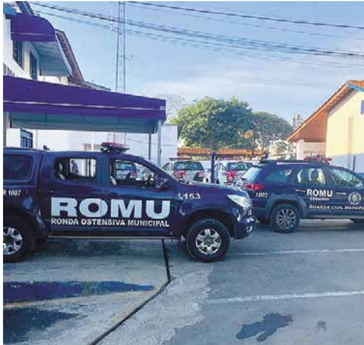
A previsão de conclusão das obras da nova sede é março de 2027

Com investimento total de R$ 1.290.000,00, a iniciativa busca oferecer melhores condições de trabalho aos