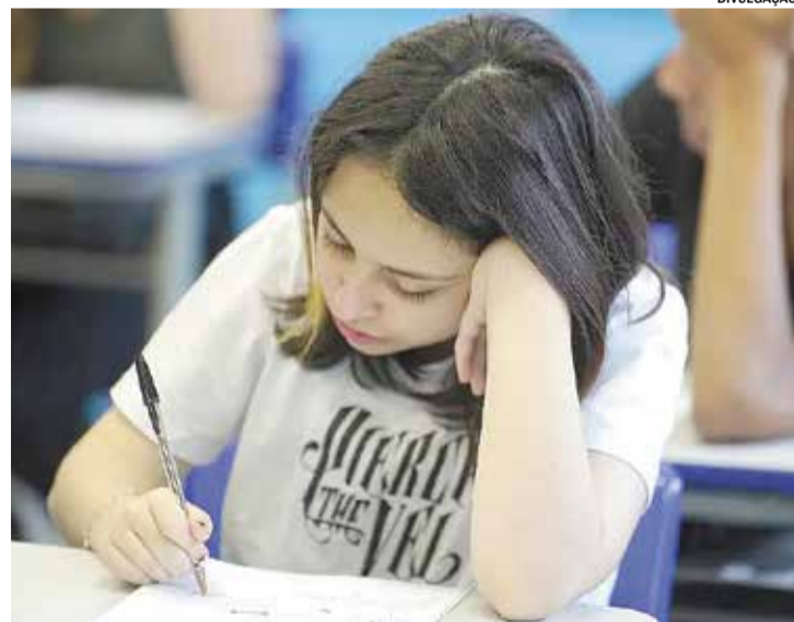
A novidade deste ano é a inclusão dos estudantes do 6º, 7º e 8º anos

A Prefeitura de Elias Fausto, por meio da Secretaria Municipal de Educação, oficializou a adesão ao Sistema de Avaliação do Rendimento Escolar do Estado de São Paulo (Saesp) 2026, ampliando a participação dos estudantes da rede municipal no principal instrumento de avaliação da educação pública paulista.