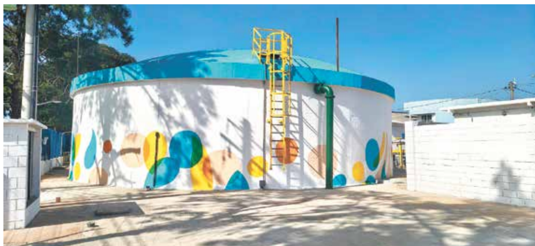
Uma das principais transformações em andamento está relacionada à infraestrutura de saneamento básico

Com obras estruturantes, expansão da infraestrutura e novos projetos em andamento, Cardeal vive um momento de transformação que pode marcar definitivamente sua história e consolidar sua posição como uma das regiões com maior potencial de crescimento no entorno de Indaiatuba e Elias Fausto.