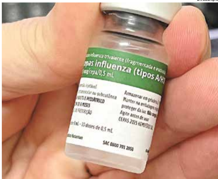
A vacinação é a estratégia mais eficaz de prevenção

A campanha de vacinação objetiva reduzir as complicações, as internações e a mortalidade decorrentes das infecções pelo vírus