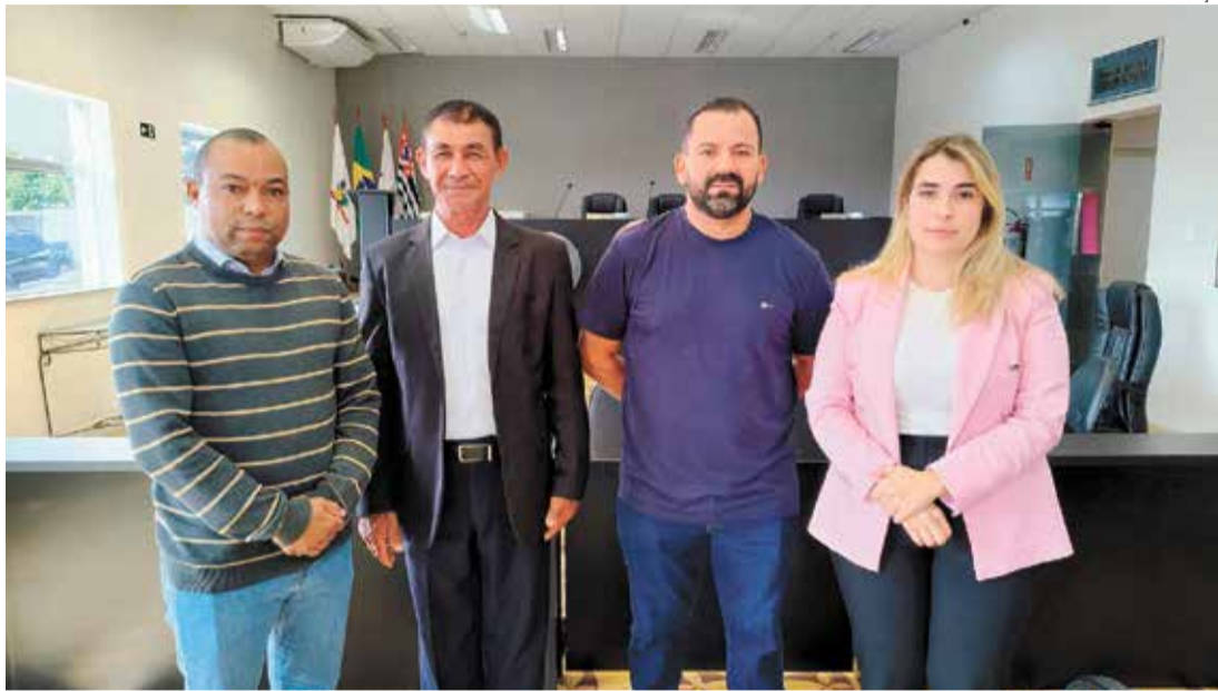
Vereadores pediram a criação da CPI para investigar o presidente da Casa, que está afastado

De acordo com a ata da sessão, por ocupar o cargo de vice-presidente da Mesa