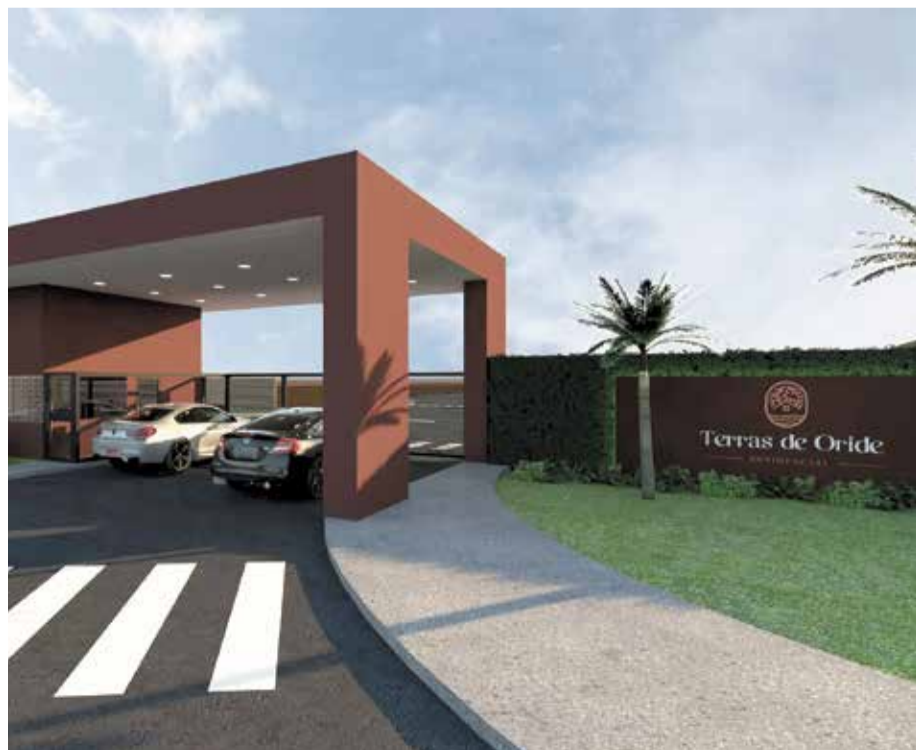
Terras de Orides: proprietários logo poderão construir no 1º loteamento fechado da cidade

A expectativa do setor é pela conclusão das vistorias da Sabesp, aprovações cartorárias e adequações legislativas necessárias para que os empreendimentos sejam plenamente liberados. O objetivo é ampliar a oferta de loteamentos regularizados, com infraestrutura completa e segurança jurídica, contribuindo para o crescimento organizado evitando a expansão de ocupações clandestinas.