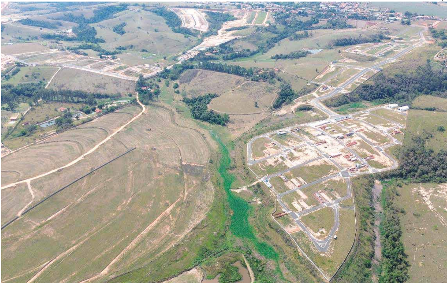
Jardim América e Jardim Belvedere impulsionam o crescimento urbano de Cardeal e fortalecem o mercado imobiliário local

Entre os exemplos estão o projeto de um condomínio com pista de pouso e o primeiro loteamento fechado da cidade, ambos inicialmente considerados ousados, mas que hoje se consolidam como empreendimentos estruturados, com aceitação do mercado e valorização