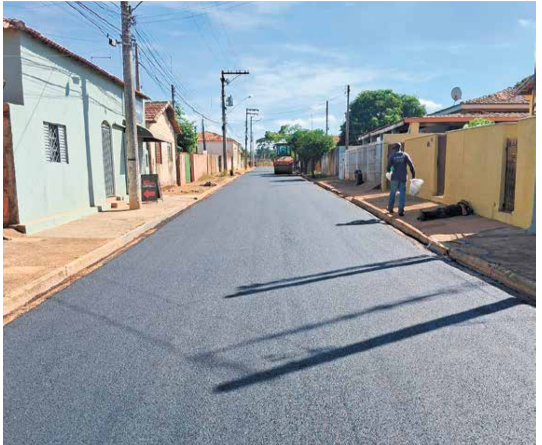
Obras de pavimentação e recapeamento de vias fazem parte dos investimentos realizados na região

Os investimentos realizados nos últimos anos também refletem diretamente na