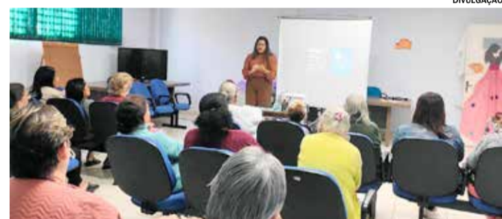
Atividade n orientou sobre direitos e prevenção de abusos financeiros

A palestra também abordou os direitos da pessoa idosa, os sinais de alerta para esse tipo de abuso e os canais disponíveis para denúncia e apoio. Além de promover informação e conscientização, a atividade proporcionou um momento de troca de experiências.