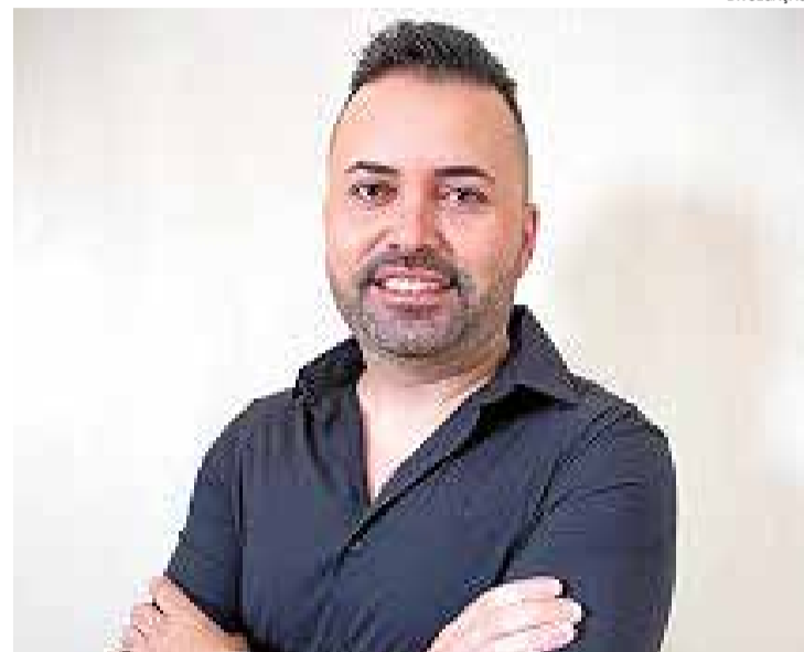
Presidente da Câmara emitiu nota negando as irregularidades

Além disso, um vídeo publicado nas redes sociais da própria Câmara no dia do empenho mostraria o plenário