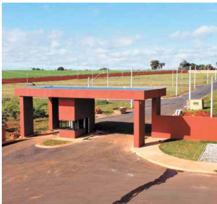
Os empreendimentos já aprovados representam um marco para a região

O Saneef - Consórcio de água e esgoto de Elias Fausto atua como estrutura técnica fundamental para garantir a implantação das redes de saneamento, assegurando que cada etapa siga padrões exigidos pelos órgãos reguladores e pela legislação vigente. Sua atuação é integrada ao planejamento urbano, contribuindo para a expansão ordenada de Cardeal com eficiência