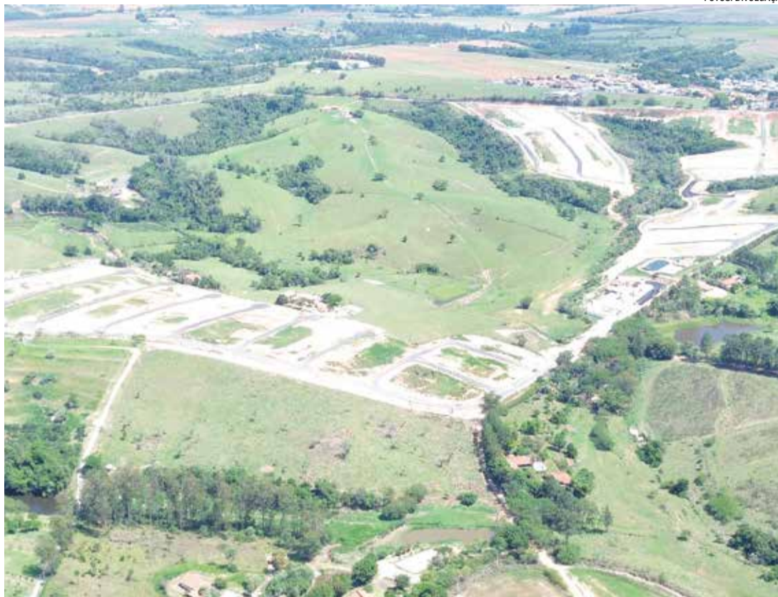
Jardim América e Jardim Belvedere já possuem o TVO ( Termo de Vistoria de Obra)

Outro projeto que merece destaque é o Condomínio Aeronáutico Santos Dumont, da FCK Empreendimentos Imobiliários, considerado uma conquista não apenas para Elias Fausto, mas para toda a região. O complexo conta com pista de pouso e decolagem de 1.200 metros por 30 metros, operação VFR Noturno, balizamento noturno, abastecimento AVGAS e JET-A, portaria 24 horas, certificação ESG e espaço aéreo Classe Golf. O loteamento possui formato 100% priva-