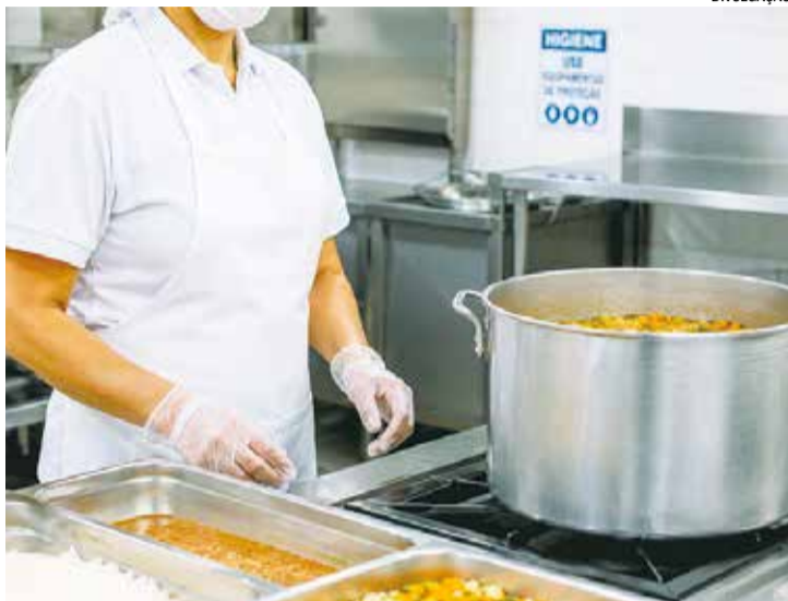
Entre as atribuições da função estão o preparo das refeições

Os interessados devem enviar currículo para o e-mail