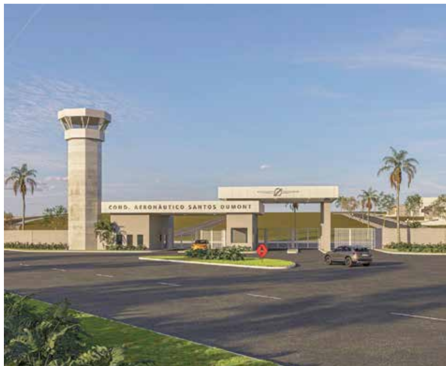
Condomínio Aeronáutico Santos Dumont: pista de pouso é conquista para toda a região