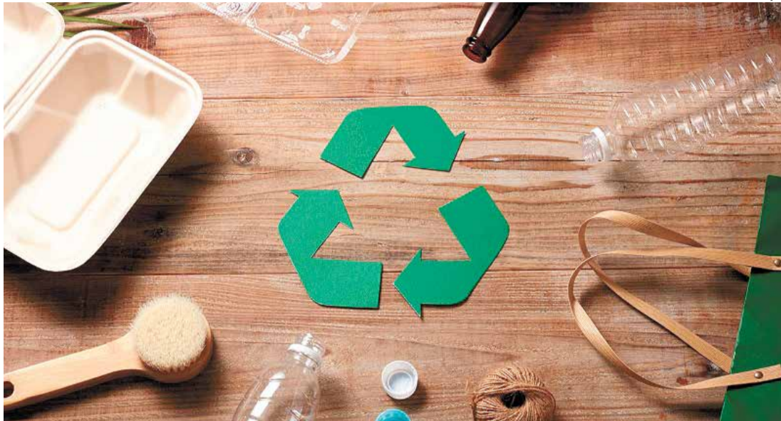
Além de contribuir para uma cidade mais sustentável, o projeto também fortalece a geração de renda

Realizada semanalmente no período da manhã em bairros participantes do projeto piloto, a coleta incentiva os moradores a separarem corretamente os materiais recicláveis em suas residên-