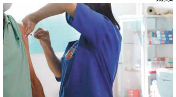
VACINAÇÃO contra gripe e febre amarela segue até o dia 29 no Pirapitingui Pág. A10