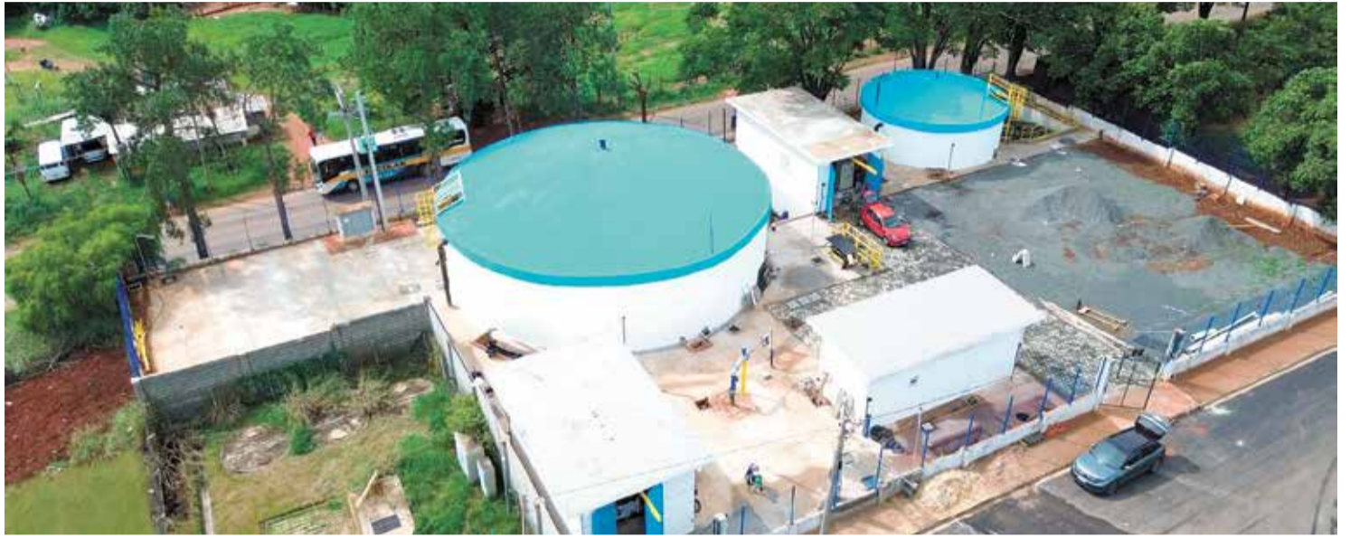
O reservatório faz parte das obras que foram desenvolvidas em parceria com a Prefeitura de Elias Fausto, o DAAE, o Graprohhab, a CETESB e Sabesp

O projeto teve início ainda em 2017, a partir da iniciativa de empresários que identificaram o potencial de desenvolvimento da região. Naquele momento,