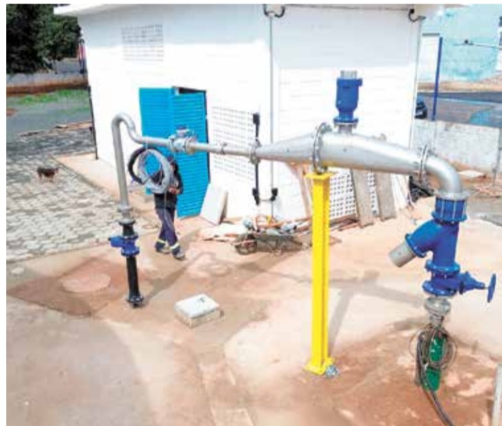
Poço profundo que foi viabilizado através do consórcio

água por meio de poços, adutoras e reservatórios, solução necessária diante da ausência de mananciais de captação na região.