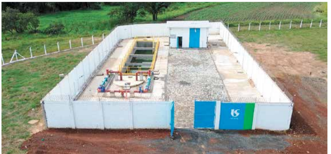
Paralelamente, o consórcio também realizou melhorias diretas na cidade

Diante desse cenário, foi criado o Saneff – Consórcio de Água e Esgoto de Elias Fausto, responsável por viabilizar a implantação do sistema de saneamento no município, incluindo a rede de esgoto, elevatórias, ETE, além do sistema de abastecimento de