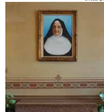
A programação é aberta