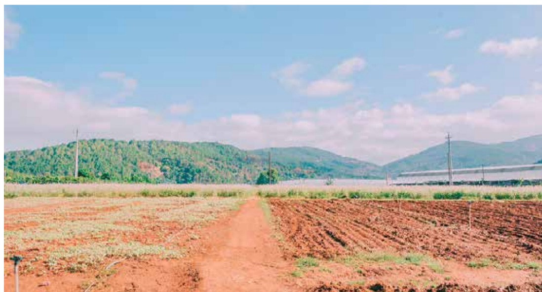
Loteamentos clandestinos podem elevar significativamente os custos futuros de regularização.

Segundo orientações do Procon São Paulo, o consumidor deve desconfiar de ofertas com valores muito abaixo do mercado ou promessas de regularização futura sem documentação oficial. A recomendação é que toda negociação seja feita com acompanhamento técnico e jurídico especializado, evitando riscos que podem comprometer o patrimônio da família por muitos anos.