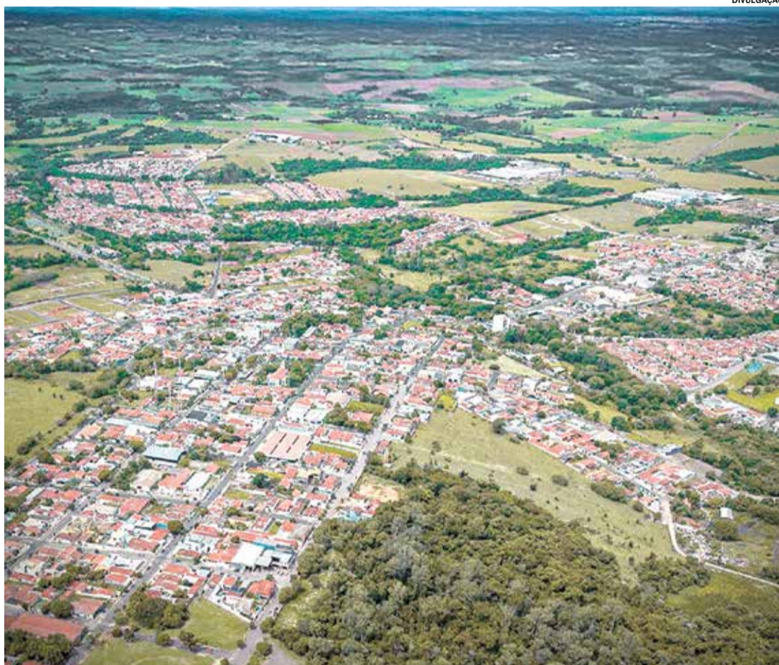
Loteamentos clandestinos continuam entre os principais problemas urbanísticos no estado de SP

Além do prejuízo individual, loteamentos clandestinos também podem gerar impactos coletivos, comprometendo o planejamento urbano e aumentando custos