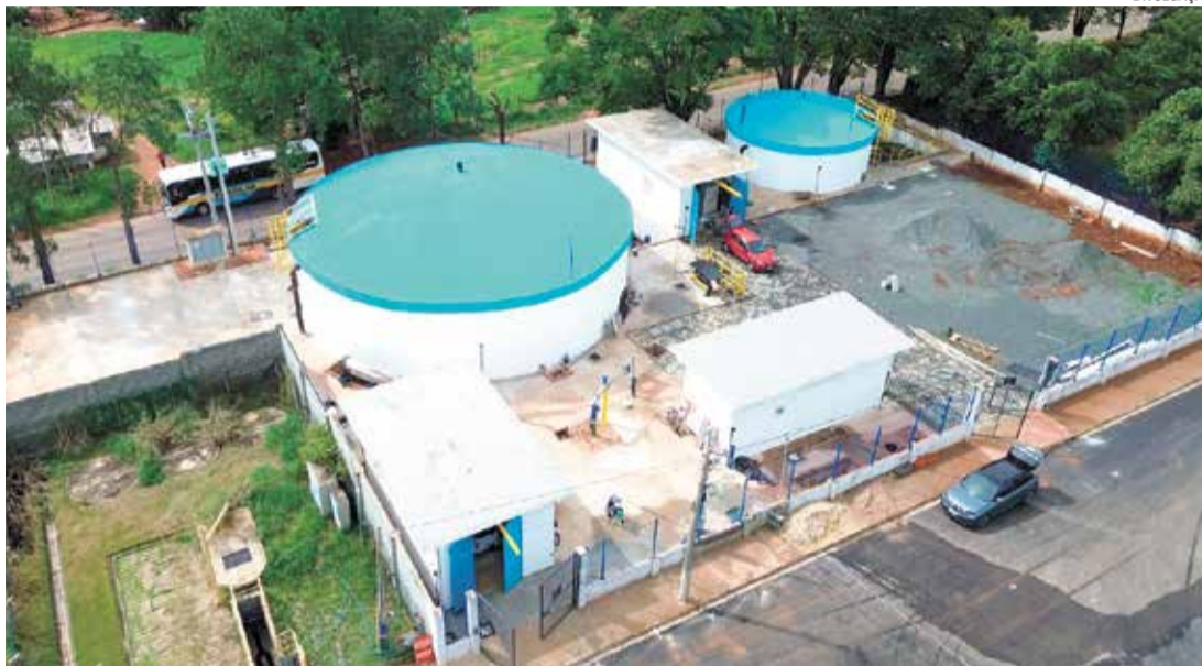
A Cardeal Saneamento implementou rede de esgoto, elevatórias e Estação de Tratamento de Esgoto