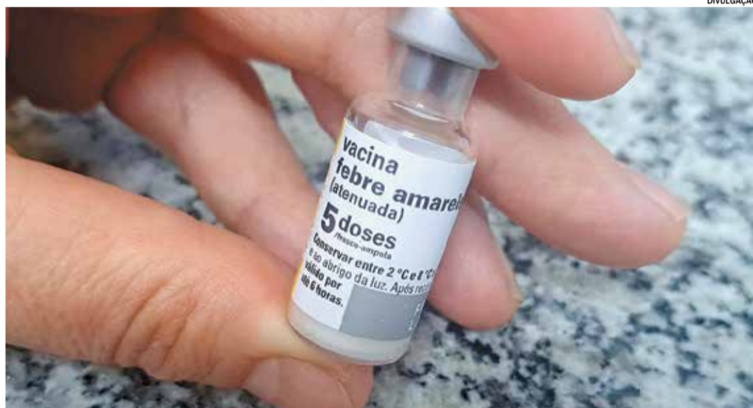
A vacina contra Febre Amarela é destinada a pessoas de 9 meses a 59 anos