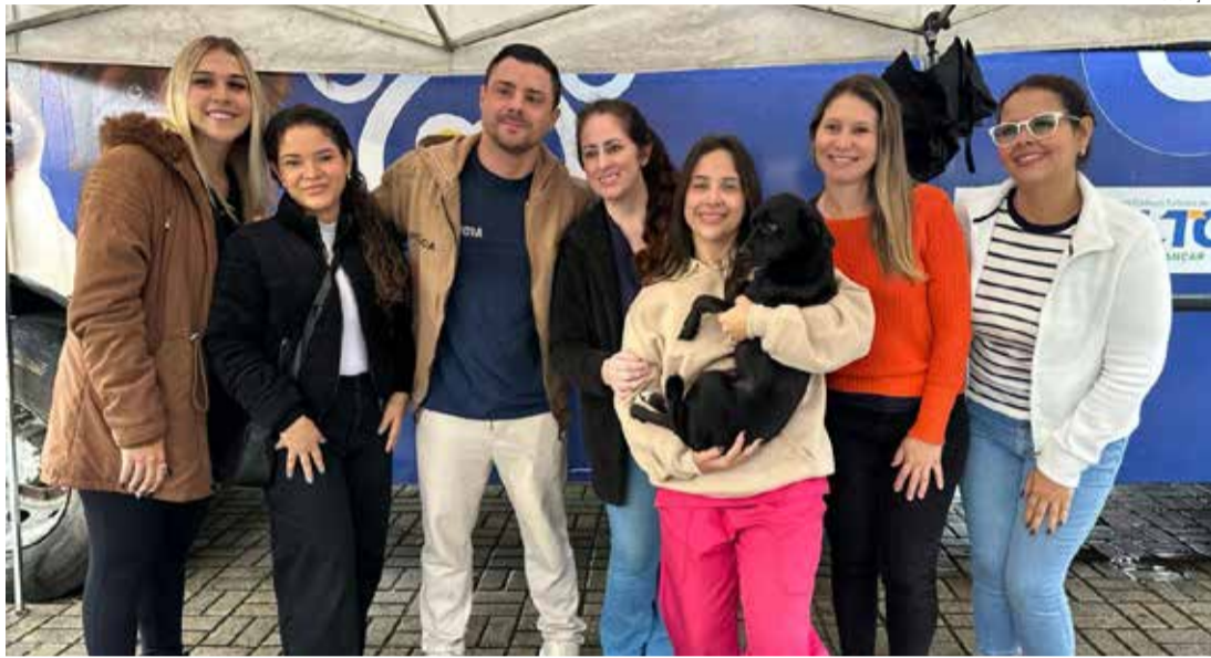
O projeto representa o primeiro passo de uma política pública ampla à proteção animal

Os atendimentos acontecerão em etapas, percorrendo diferentes regiões da cidade. As equipes permanecerão entre uma e duas semanas em cada localidade, em horário co-