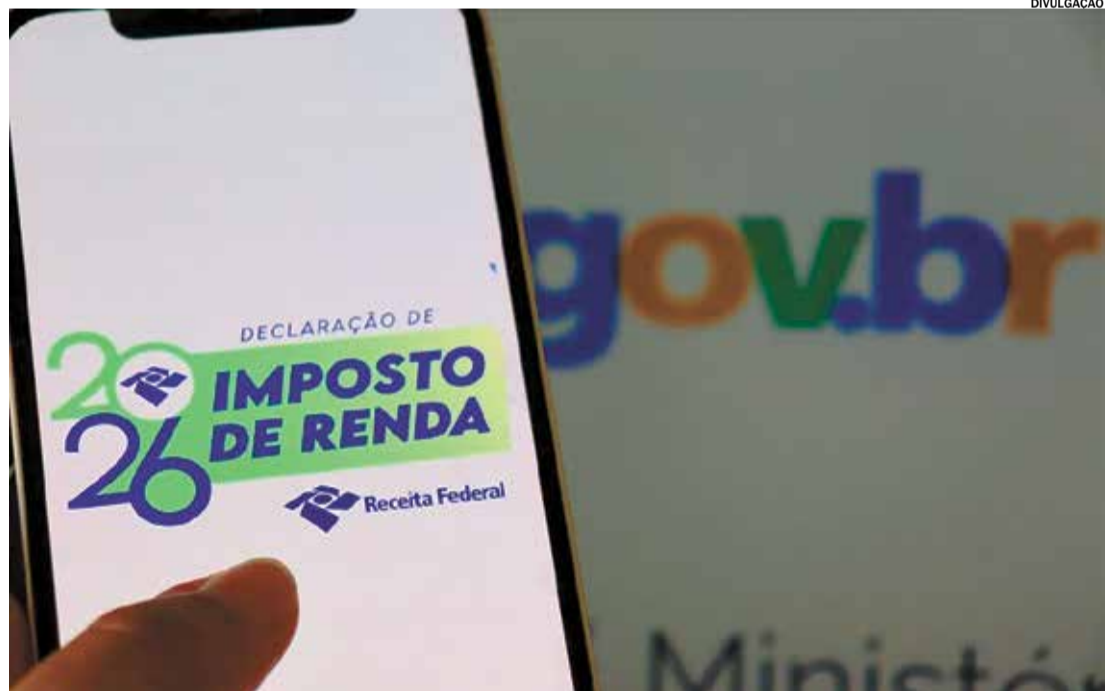
A Receita Federal libera a consulta ao maior lote de restituição do Imposto de Renda da história