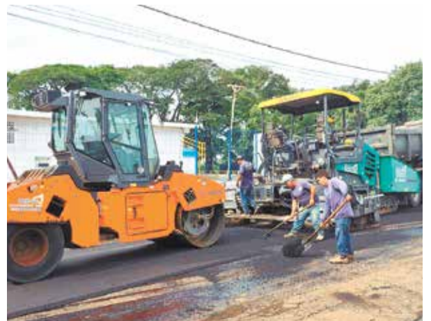
O consórcio também realizou melhorias diretas na cidade, como pavimentação e recapeamento de vias que antes apresentavam esgoto a céu aberto