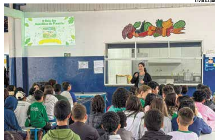
Alunos participaram de palestra sobre preservação ambiental

A ação reforça o compromisso da educação municipal com a formação de cidadãos mais conscientes, preparados para compreender a importância da preservação ambiental e contribuir para um futuro mais responsável e sustentável.