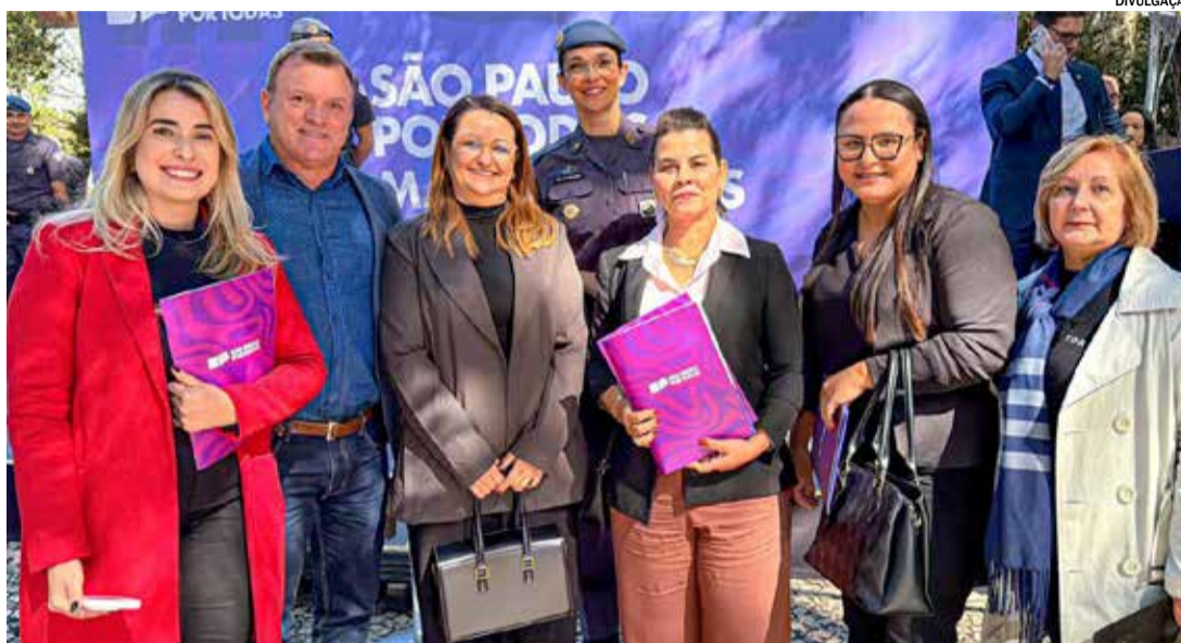
Evento discutiu ações de proteção, acolhimento e combate à violência contra a mulher

O encontro contou ainda com a presença do governador Tarcísio de Freitas, da primeira-dama do Estado, Cristiane