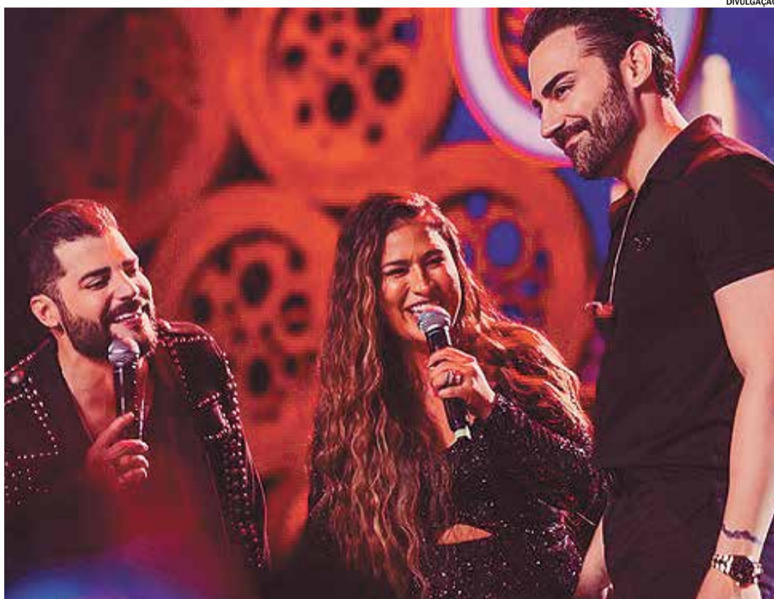
MONTE MOR Festa do Peão será realizada entre os dias 28 e 31 de maio de 2026 e traz grandes nomes da música, como Guilherme e Benuto, Simone Mendes e Péricles.