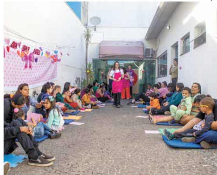
A data simbólica de 18 de maio marca as mobilizações pelo cuidado