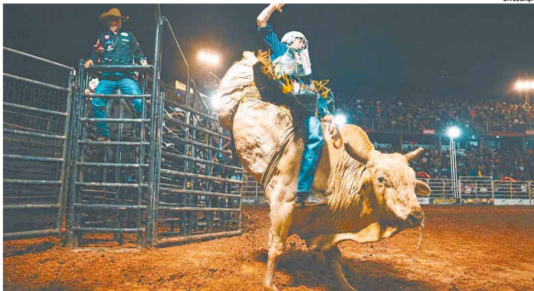
A expectativa é de grande público durante os quatro dias de evento

A programação segue no dia 30 com os shows de Vini e Lucas, Charles e Mancini e da