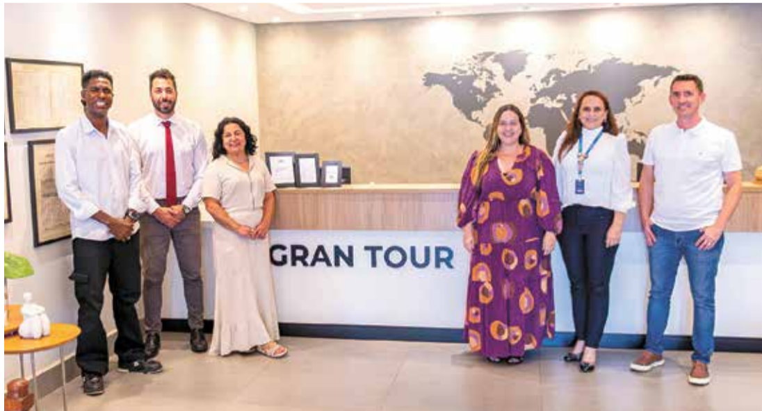
Um dos principais eixos destacados foi o turismo rural, entendido como vetor estratégico

A articulação já traz resultados, como a inclusão dos municípios no Mapa do Turismo Brasileiro, amplian-