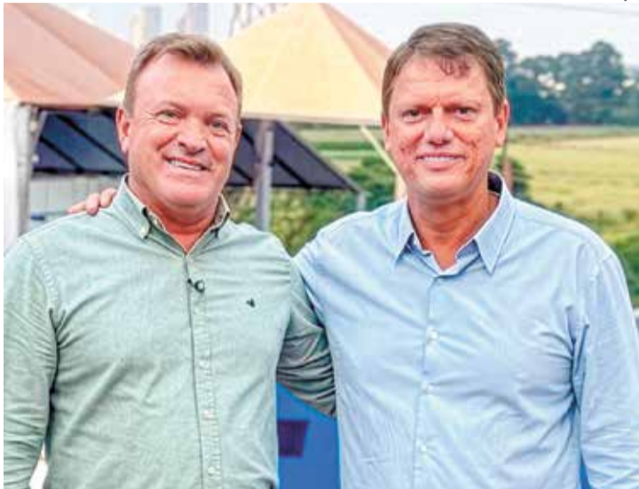
Prefeito Tato Bicudo e Governador Tarcísio de Freitas

O equipamento, viabilizado por meio do governador Tarcísio de Freitas, chega em um momento estratégico e deverá contribuir diretamente para a manutenção e recuperação das estradas rurais, facilitando o escoamento da produção agrícola e o acesso das comunidades do campo. A previsão é de que a entrega da máquina aconteça em até 90 dias.