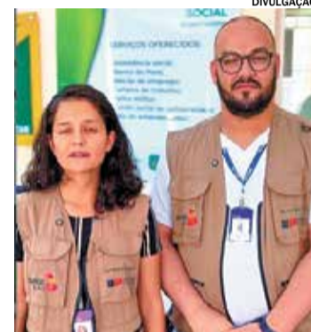
A administração municipal publicou um vídeo nas redes

mento estão realizando visitas domiciliares para identificar as necessidades das famílias, além de orientar e convidar os moradores a participarem das atividades do programa. A Prefeitura reforça que todos os profissionais estão devidamente identificados durante as abordagens.