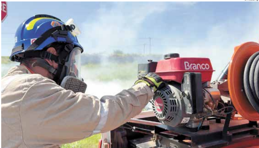
As queimadas são frequentemente causadas por práticas inadequadas como a queima de lixo

A Lei 9.605/98, do Governo Federal, a Lei Municipal N.6347/2022 e o Art. 250 do Código Penal, proíbem qualquer tipo de queimada, seja ela realizada em espaço público ou particular, sendo passível de multa cujo valor pode chegar até R$19.960,00. Durante todo o período da operação, as rondas são frequentes pelas equipes da Defesa Civil, visando identificar os infratores