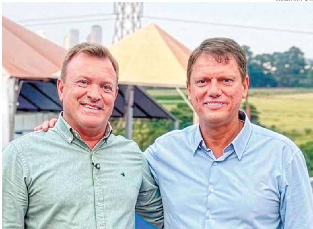
Prefeito Tato Bicudo e Governador Tarcísio de Freitas firmam acordo para beneficiar a cidade

Durante agenda oficial na Agrishow, em Ribeirão Preto, o prefeito Tato Bicudo assinou convênio com o Governo do Estado que garantirá a doação de uma nova máquina patrol para Elias Fausto. O equipamento, viabilizado