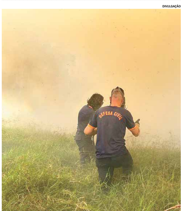
CAPIVARI Operação estiagem começa na cidade com foco na prevenção de incêndios