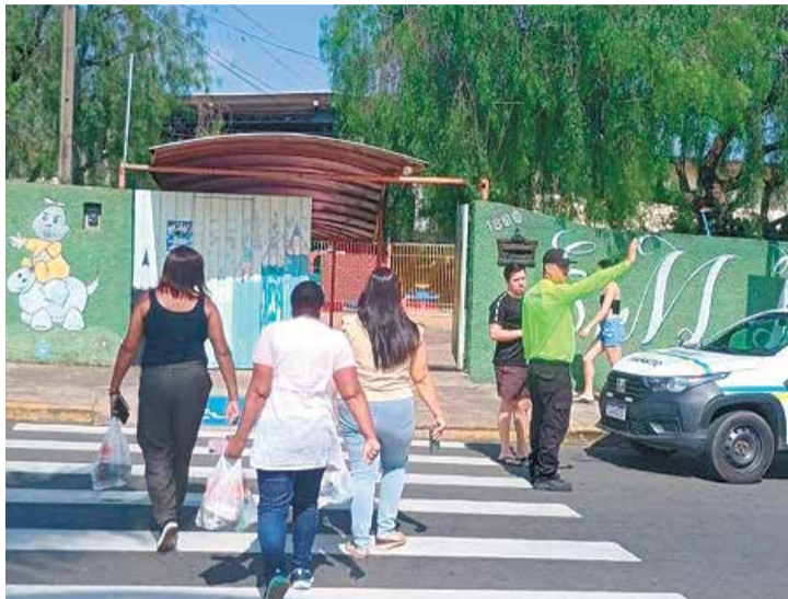
O Maio Amarelo é um movimento que busca dar visibilidade ao tema da segurança viária

A campanha tem como principal objetivo sensibilizar motoristas, motociclistas, ciclistas e pedestres sobre comportamentos seguros no trânsito. Entre as atividades