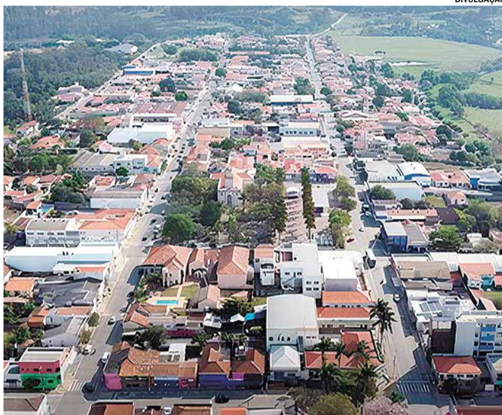
Um ofício emitido em 11 de dezembro de 2024

Outro ponto central da reunião foi o reforço do trabalho técnico realizado pela Prefeitura no apoio à Regularização