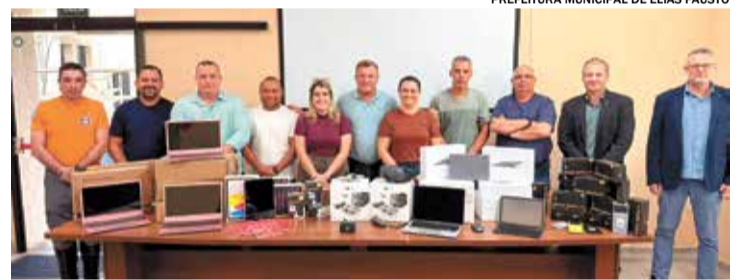
Prefeitura de Elias Fausto faz parceria com a Receita Federal

A parceria com a Receita Federal permite que o município disponibilize, de forma acessível, serviços como regularização do CPF, apoio ao acesso à plataforma GOV.BR, consulta de pendências fiscais, além da emissão de documentos como DARF e GPS, entre outros atendimentos importantes para o dia a dia dos cidadãos. Entre os itens estão drones, HD e tablets.