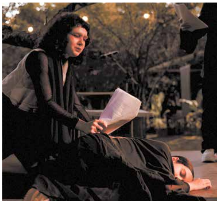
Evento aconteceu no espaço da Fazenda São Bernardo

processo coletivo contínuo que fortalece redes culturais e amplia o acesso à arte no interior paulista. A ação integrou o 20º Encontro Regional de Contadores de Histórias, reunindo diversos grupos e artistas da região em uma programação voltada à valorização da cultura e da oralidade. O evento contou com produção da Xekmat, Secretaria de Cultura de Santa Bárbara d’Oeste, Cia Ui de Teatro, Diretoria de Cultura e Turismo de Rafard e Associação Amigos da Fazenda Abaçai, consolidando uma importante rede de articulação cultural entre municípios e agentes do território.