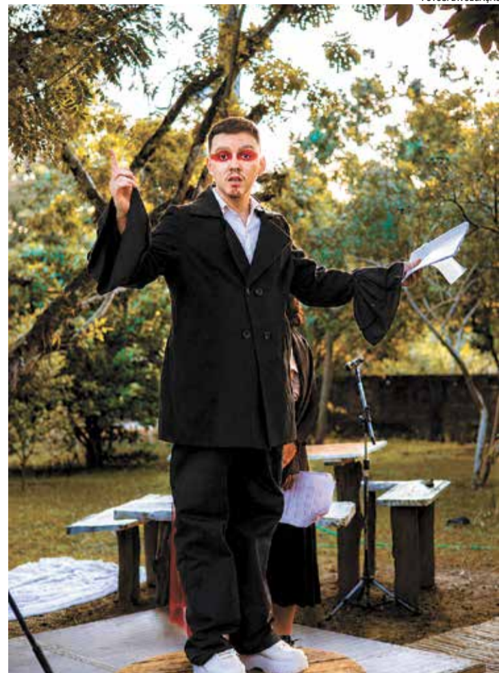
Projeto é uma parceria entre a Cia Ui de Teatro e a UNICAMP

O espetáculo “O Reino dos Cogumelos – uma fábula política”, inspirado na obra “O Príncipe”, de Maquiavel, trouxe reflexões sobre poder, opressão, desigualdades e meio ambiente, temas que