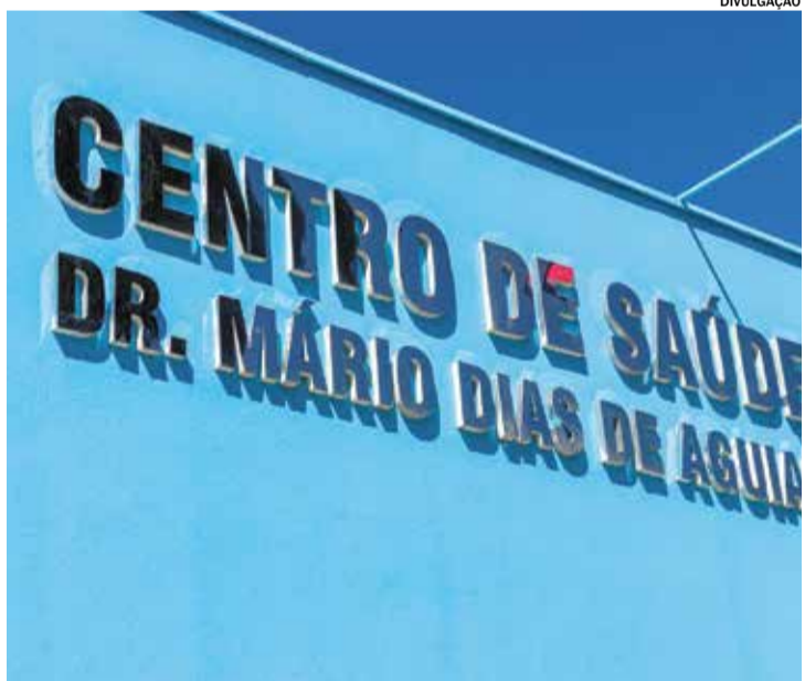
A iniciativa contará com a presença de farmacêuticos e atendentes

A Secretaria de Saúde anunciou atendimentos intensificados durante esta semana com o objetivo de conscientizar a população da cidade sobre o uso racional de medicamentos em todos os Postos de Saúde de Capivari. A iniciativa contará com a presença de farmacêuticos e atendentes da rede municipal que farão orientações especializadas sobre o tema, contando também com a distribuição de panfletos.