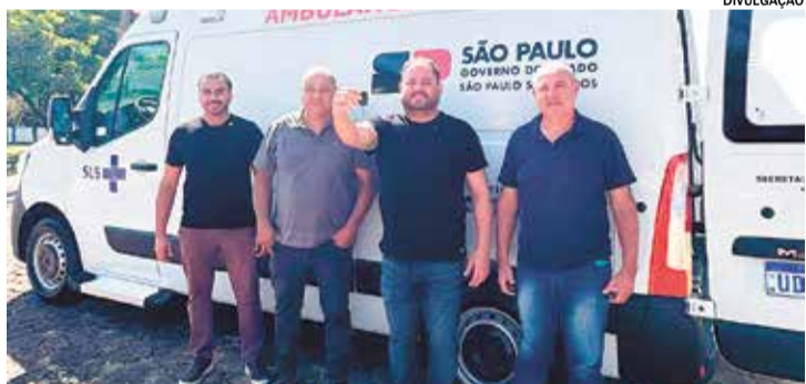
O veículo é resultado de uma articulação entre município e estado

O novo equipamento já está à disposição da Diretoria de Saúde e deve ser integrado imediatamente ao atendimento diário da população, ampliando a capacidade de resposta em situações de emergência.