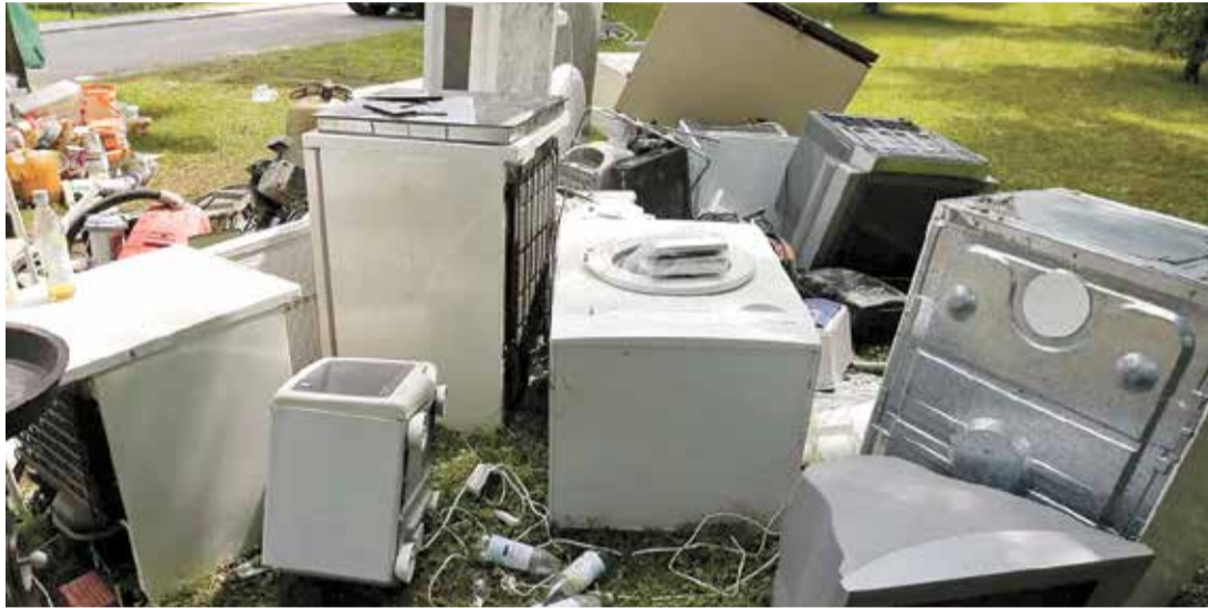
Os moradores devem colocar para recolhimento apenas os materiais autorizados

Nesta etapa, o cronograma contempla os bairros Jardim