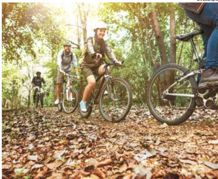
O evento promove convivência e incentiva hábitos saudáveis

A concentração dos participantes começa às 8h, na Praça Central, com a distribuição de cupons para o tradicional sorteio de bicicle-