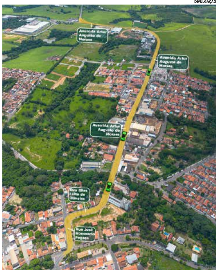
Obra prevê mais de 22 mil m² de melhorias e nova sinalização

A Prefeitura de Elias Fausto anunciou um novo investimento em infraestrutura urbana com o recapeamento asfáltico da Avenida Arthur Augusto de Moraes. A obra, que contempla mais de 22 mil metros quadrados de pavimentação, também inclui a implantação de nova sinalização viária ao longo da via.