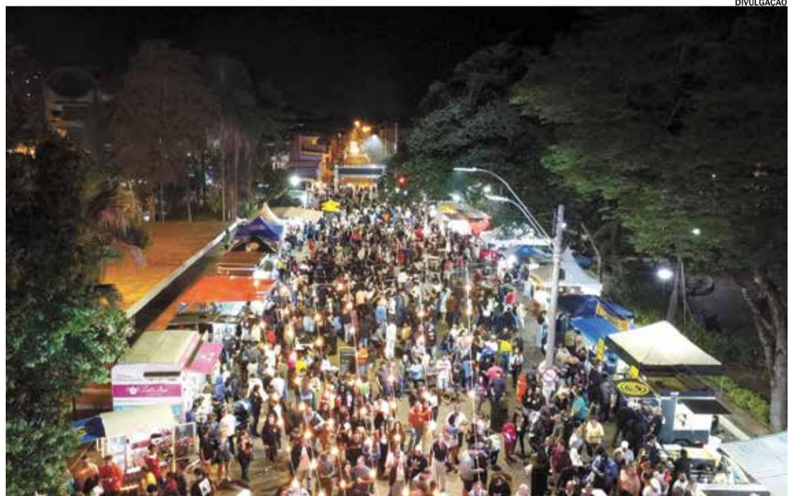
A Praça Central será palco de opções gastronômicas, música ao vivo, artesanato e espaço de convivência