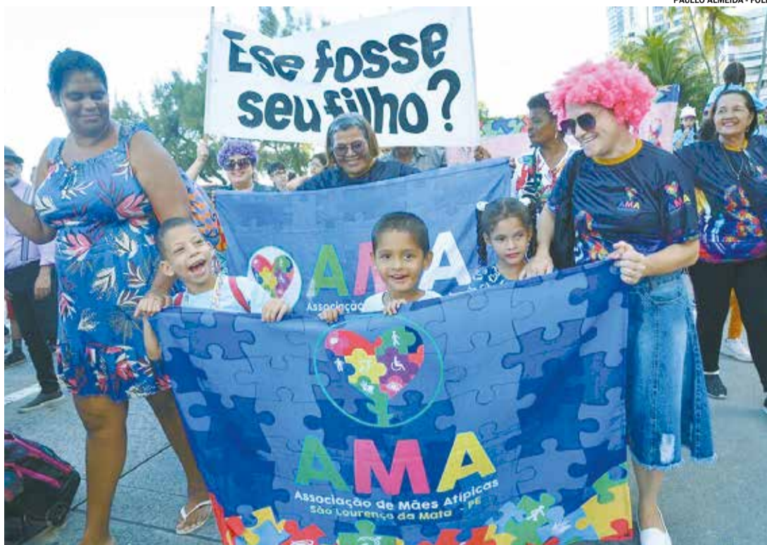
A gincana busca estimular convivência, aprendizado e diversão para todos

A proposta da caminhada é ampliar o diálogo sobre o