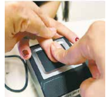
Prefeitura reforça importância da participação da população

O contato da Secretaria de Desenvolvimento Social é pelo telefone (19) 3821-1755.