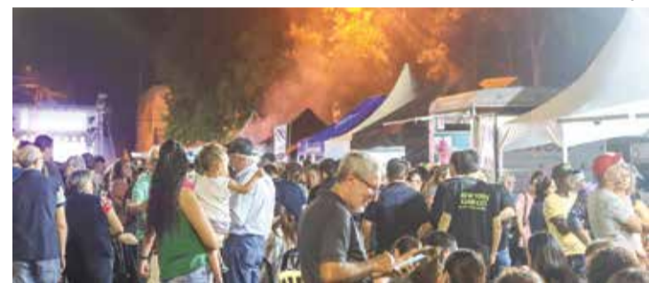
Evento será realizado no dia 7 de maio, na Praça Central

Entre os destaques do evento está a área gastronômica, com comidas e bebidas para diferentes gostos, além de produtos preparados por expositores e empreendedores locais.