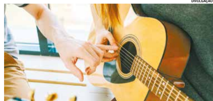
Destaque do projeto é a valorização de diferentes estilos musicais

Outro destaque do projeto é a valorização de diferentes estilos e tradições musicais. Enquanto o violão e o canto coral oferecem experiências amplamente conhecidas e acessíveis, a viola caipira também reforça a preservação da cultura popular e das raízes