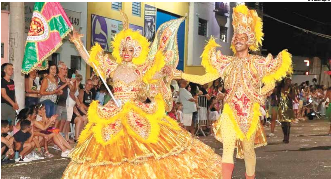
A cidade realiza neste sábado (14) e domingo (15) a 2ª edição do Monte Mor Folia, com desfiles e samba