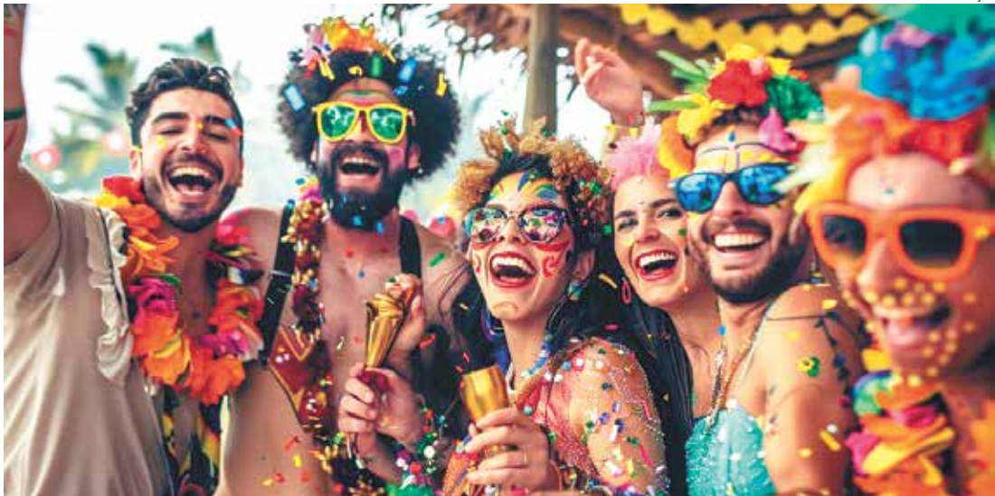
A administração municipal estará fechada na segunda (16) e terça-feira (17), com retorno na quarta-feira

SECRETARIA DE DESENVOLVIMENTO SOCIAL Durante o feriado, os atendimentos regulares da Secretaria de Assistência Social estarão suspensos. Permanecem em funcio-