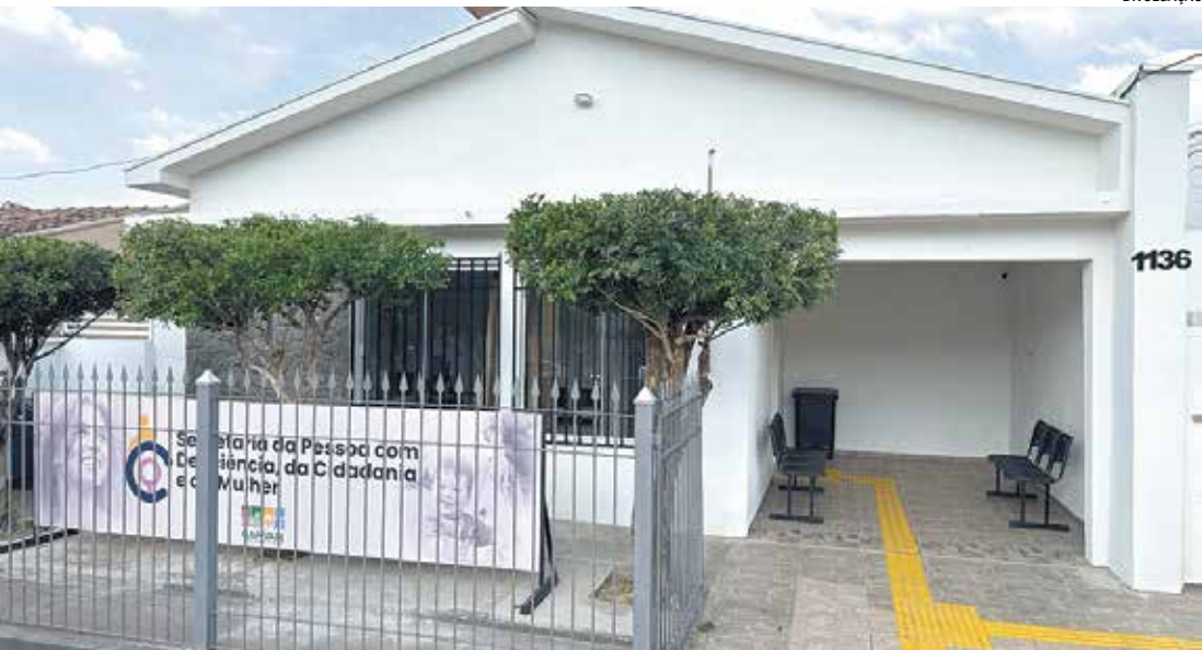
A expectativa da administração municipal é de que o projeto Aurora seja colocado em prática em breve