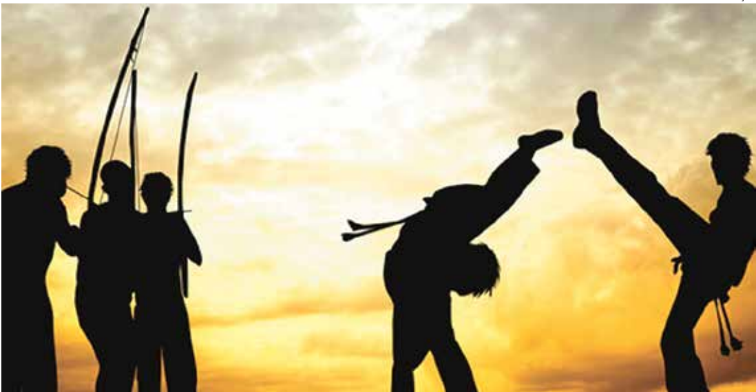
Os encontros acontecem às segundas, terças e quintas-feiras, em horários variados