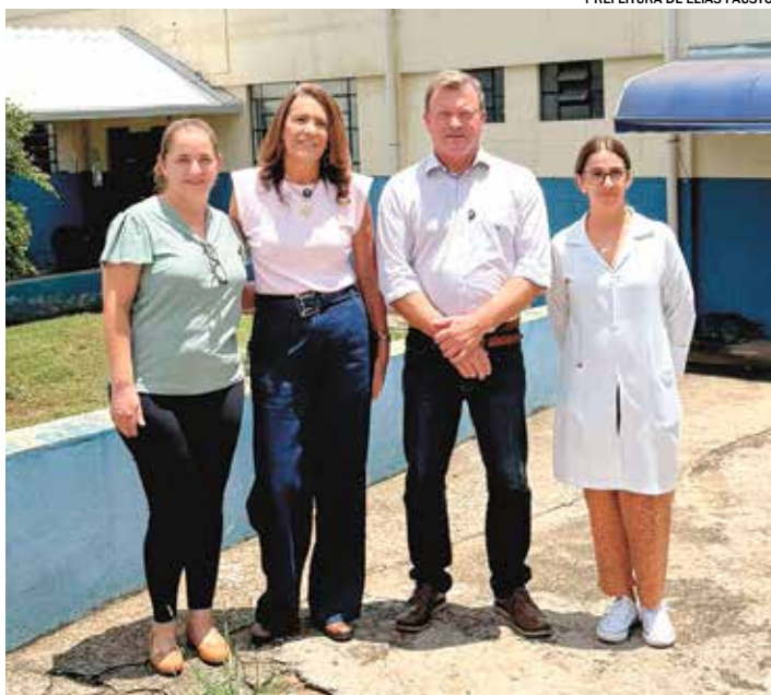
PREFEITURA DE ELIAS FAUSTO

Cardeal recebe vacinação antirrábica para cães