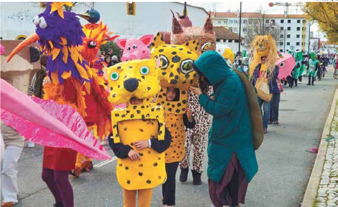
Além da animação, o evento também reforça o compromisso com a sustentabilidade

Com foco na valorização da cultura popular e no fortalecimento das tradições carnavalescas, o Monte Mor Folia contará com apresentações de samba e pagode, desfiles, dança e a participação de escolas de samba, transformando as ruas em um grande espaço de celebração. A proposta é resgatar o espírito do Carnaval de rua, incentivando