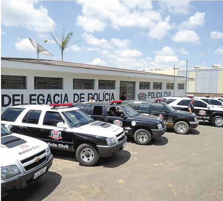
Indicadores oficiais mostram avanço das políticas de segurança

"A estratégia implantada desde o início da gestão está funcionando. Estamos investindo em inteligência, integração das polícias e,