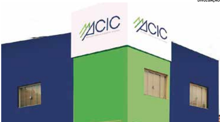
Atividade gratuita acontece no dia 16 de março, na ACIC

A oficina tem como objetivo orientar os participantes sobre a importância da marca pessoal no mercado atual, abordando temas como valorização da imagem profissional, comunicação assertiva, clareza na apresentação de ideias e posicionamento.