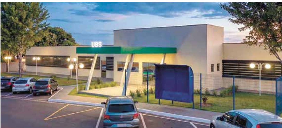
O projeto também contempla a modernização da área externa do prédio oferecendo mais conforto

REFORMA DO PSF DE CARDEAL Segundo a Secretaria de Obras, Engenharia e Planeja-