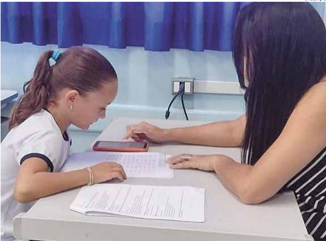
O resultado reflete uma política educacional pautada em investimentos em infraestrutura

Entre as iniciativas adotadas pelo município, destaca-se a entrega dos kits de material escolar já no retorno às aulas, garantindo igualdade de oportunidades e melhores condições de aprendizagem para todos os alunos desde o início do ano letivo.