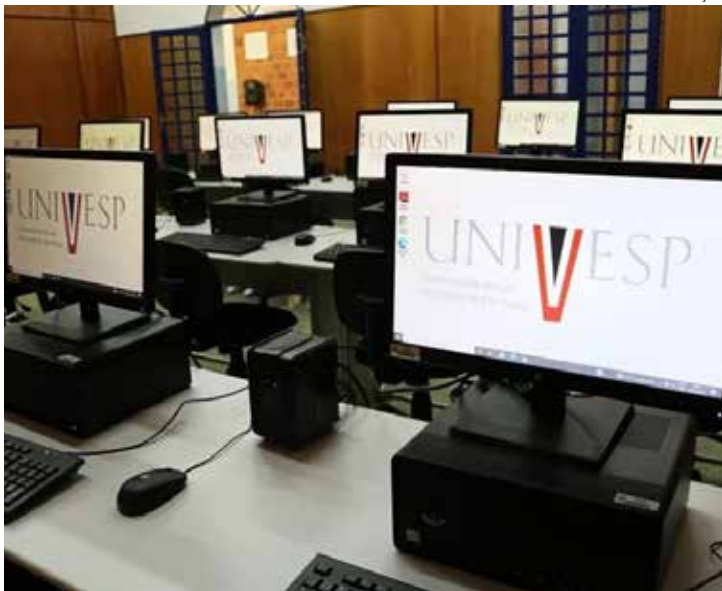
A Univesp ofereceu ainda 2.956 vagas para o Provão Paulista

A Univesp é vinculada à Secretaria de Ciência, Tecnologia e Inovação (SCTI) do Governo do Estado e em todos os 456 polos, de 386 municípios (capital, interior e litoral), são oferecidas 24.029 vagas gratuitas em cursos de Letras, Matemática e Pedagogia (Eixo de Licenciatura), Ciência de Dados, Engenharia de Computação,