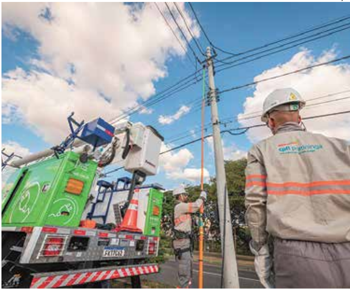
Empresa orienta moradores a desligarem aparelhos da tomada

Um segundo documento, o TES 11257380, prevê ainda um desligamento adicional no dia 26, das 08h40 às 12h40, atingindo trecho da