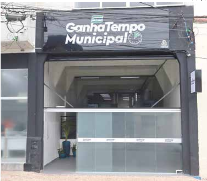
Medida resulta de desligamento programado da CPFL Energia

A Prefeitura de Capivari informa que, nesta sexta-feira (13), o GanhaTempo Municipal, localizado na rua Tiradentes, nº 283, no Centro, terá interrupção parcial de suas atividades em razão de uma manutenção programada na rede elétrica, realizada pela CPFL Energia. De acordo com comunicado da concessionária, o desligamento do fornecimento de energia está previsto para ocorrer das 11h30 às 17h40, período necessário para a execução de serviços de manutenção e melhoria na rede elétrica. A medida tem como objeti-