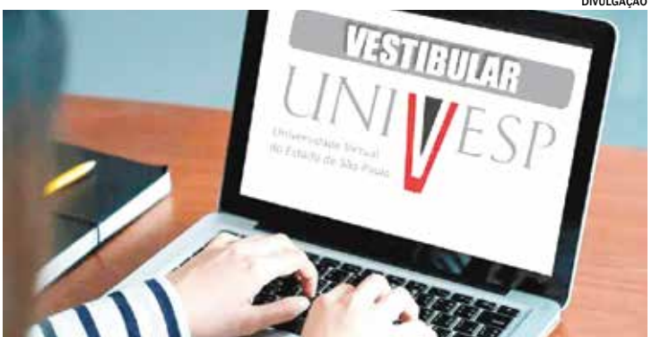
Universidade Virtual do Estado de São Paulo oferece cursos gratuitos

Inscrições Os interessados podem obter mais informações pelo telefone (19) 3821-7032 ou presencialmente na Rua José Borges de Almeida, nº 90 – Centro. Documentação necessária: RG e CPF do aluno e do responsável, Comprovante de endereço, além de matrícula escolar (para alunos de 6 a 18 anos)