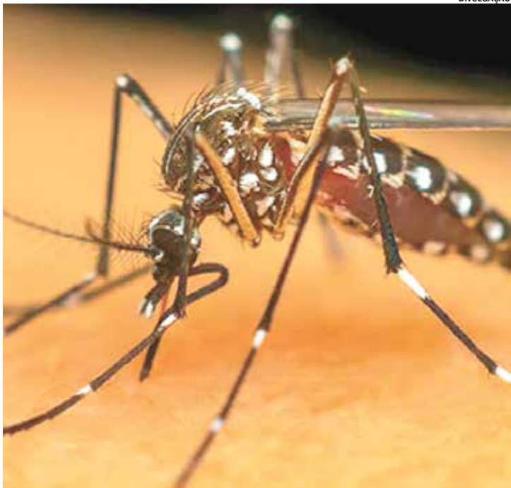
Mosquito Aedes aegypti , transmissor da dengue, zika e chikungunya

A Prefeitura reforça que a participação da população é essencial. Atitudes simples,