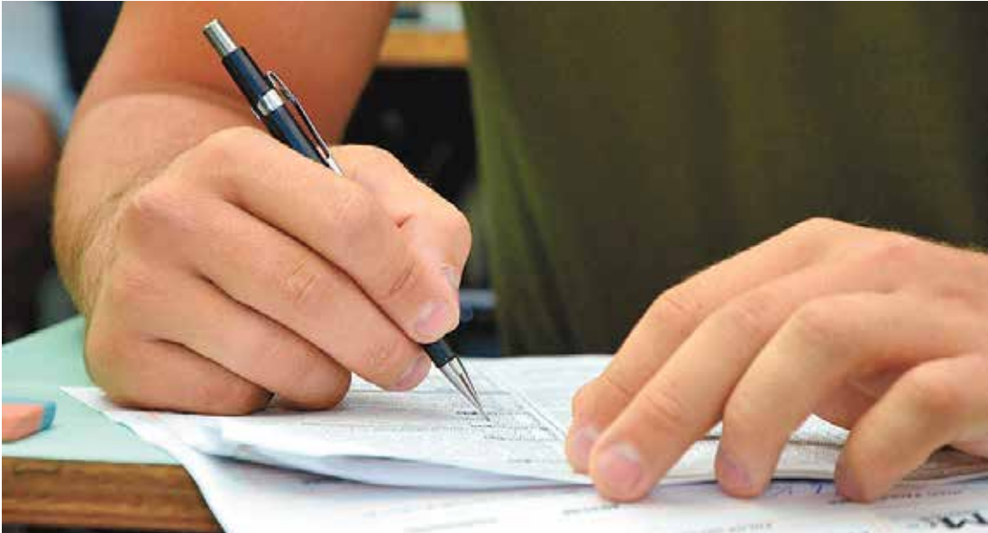
As provas objetivas e dissertativas do Concurso serão aplicadas neste domingo (18) na cidade de Elias Fausto