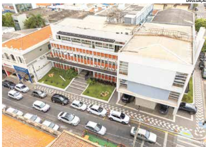
Para dar seguimento ao Refis, o morador deverá estar em dia com os débitos

O Paço Municipal está localizado na Rua XV de Novembro, nº 639.