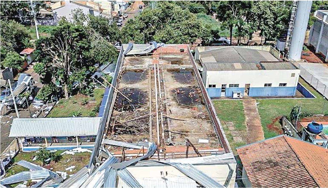
Entre as ocorrências mais graves está o destelhamento total do PSF de Cardeal