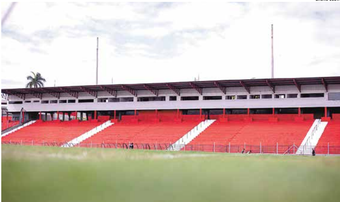
Melhorias se estendem às áreas destinadas ao público e imprensa, com pintura nas arquibancadas e mais

Entre os principais avanços está o novo gramado. O campo recebeu substituição total, com a implantação de sistemas modernos de drenagem e irrigação, além do plantio da grama Tahoma, reconhecida internacionalmente por sua alta performance e utilizada em grandes competições do futebol mundial. A mudança eleva o padrão