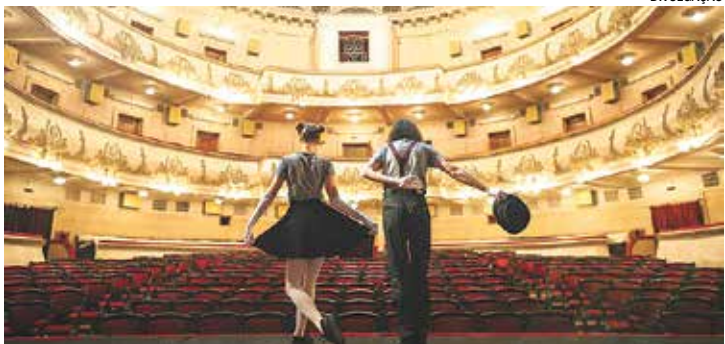
As inscrições são gratuitas e podem ser feitas presencialmente

A Secretaria reforça que servidores estarão disponíveis para orientar artistas, coletivos e demais agentes culturais