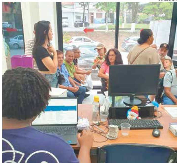
Os atendimentos da Farmácia de Alto Custo são na Av. Jânio Quadros

Durante o período de desabastecimento, a Secretaria Municipal de Saúde acompanhou o cenário e manteve diálogo constante com os órgãos estaduais responsáveis, buscando agilizar a entrega e minimizar os impactos à população. Com a normalização da logística, o fluxo