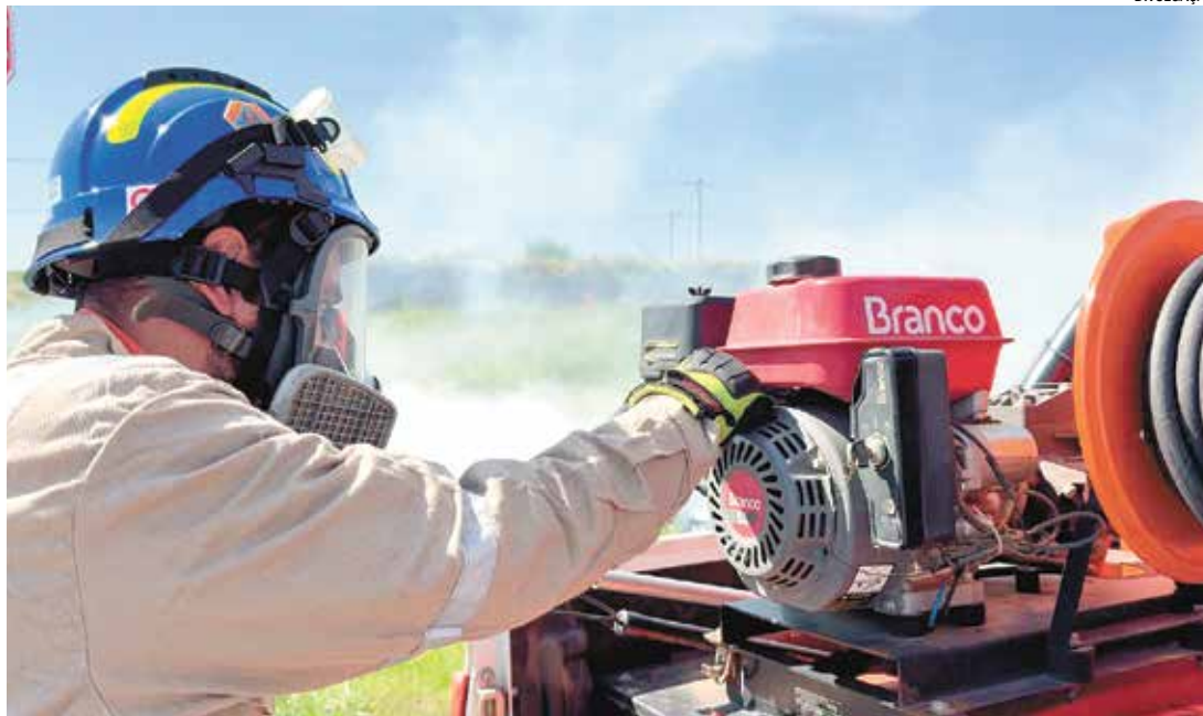
A população poderá solicitar atendimento da Defesa Civil em qualquer dia

Dentre os serviços ofertados pelo novo plantão da Defesa Civil, estão combate a incêndios em residências e indústrias, além de resgate de animais silvestres, derramamento de líquido escorregadio em via pública, podas preventivas de árvores, quedas de fios elétricos, retiradas de cachos de abelhas e também apoio aos serviços