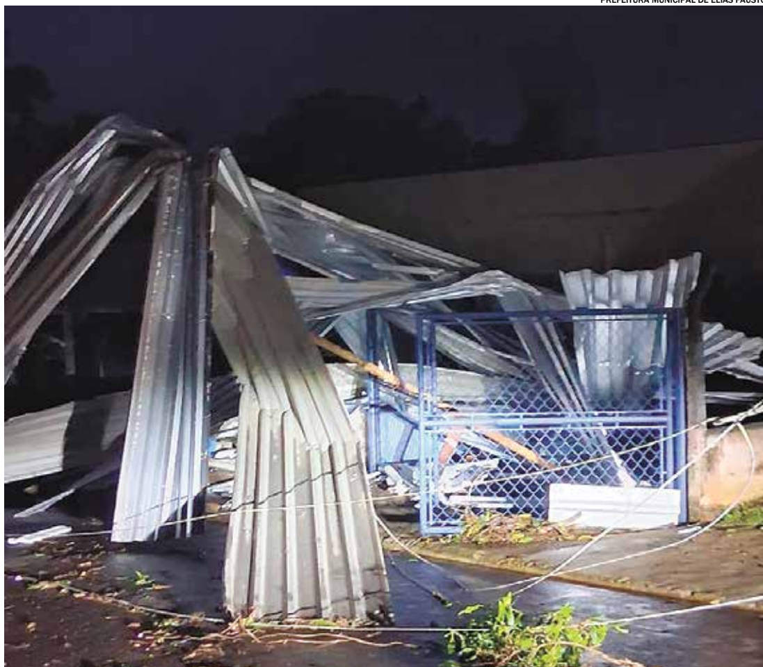
Entre as ocorrências mais graves está o destelhamento total do PSF de Cardeal, que sofreu danos