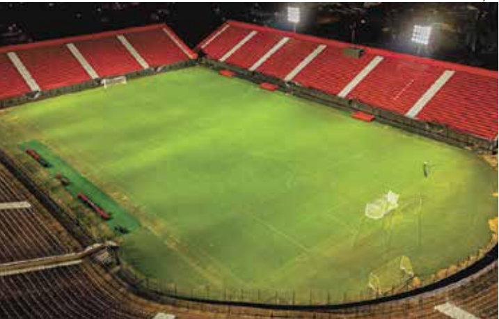
Capivariano entrega estádio pronto para o Paulistão de 2026 Pág. A11

O desabastecimento temporário registrado no fim de 2025 foi causado por atrasos no sistema estadual. Pág. A8