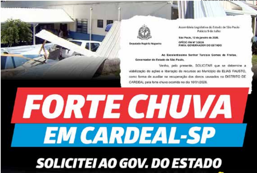
Informação foi postada nas redes sociais do deputado