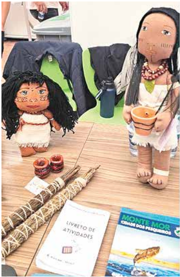
A iniciativa tem como objetivo fomentar a economia criativa

O Programa Cultura Viva é gerida através Política Nacional Aldir Blanc (PNAB) estabelece um sistema federativo de financiamento da cultura,