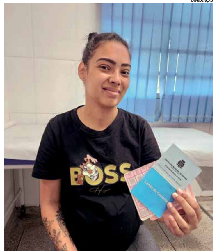
A estratégia contribui para a redução da circulação do vírus

A orientação é que as gestantes procurem a UBS dentro do período recomendado e mantenham o acompanhamento do pré-natal em dia. A vacinação é mais um passo importante para garantir um início de vida mais saudável e seguro para os bebês de Rafard.