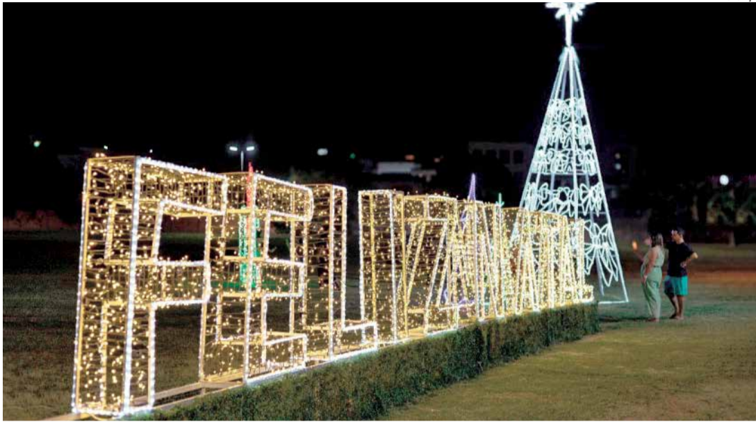
O calendário completo está disponível no site oficial da Prefeitura

aconteceu na Avenida Ayrton Senna, no Centro, com grande participação do público. A noite foi marcada pela chegada do Papai Noel e pelo concerto da Orquestra Filarmônica Bachiana SESI Indaiatuba, que emocionou o público com um repertório especial de Natal. No dia