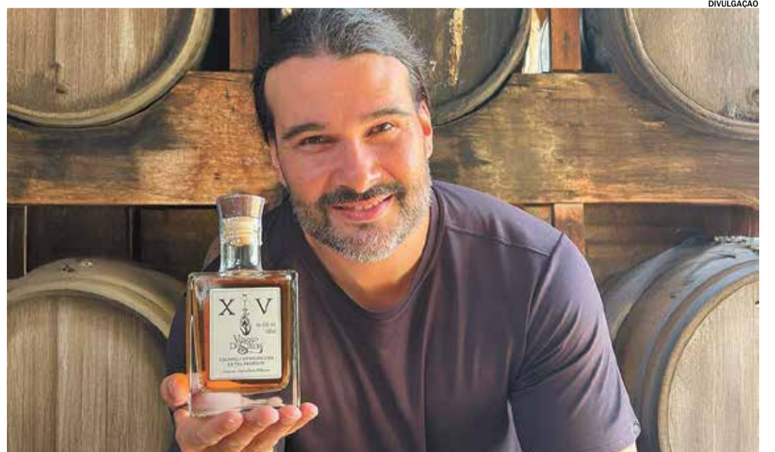
CAPIVARI: integra Rotas da Cachaça e ganha destaque no turismo gastronômico Pág. A11