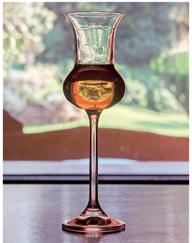
Capivari integra as Rotas da Cachaça

Para Capivari, integrar as Rotas da Cachaça representa uma oportunidade estratégica de valorização do município, fortalecimento do turismo local, geração de renda e reconhecimento da produção artesanal de qualidade.