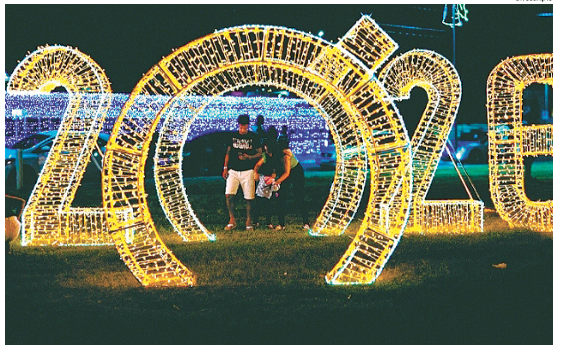
Monte Mor Luz 2025 encerra programação com circuito natalino no Jardim Paulista