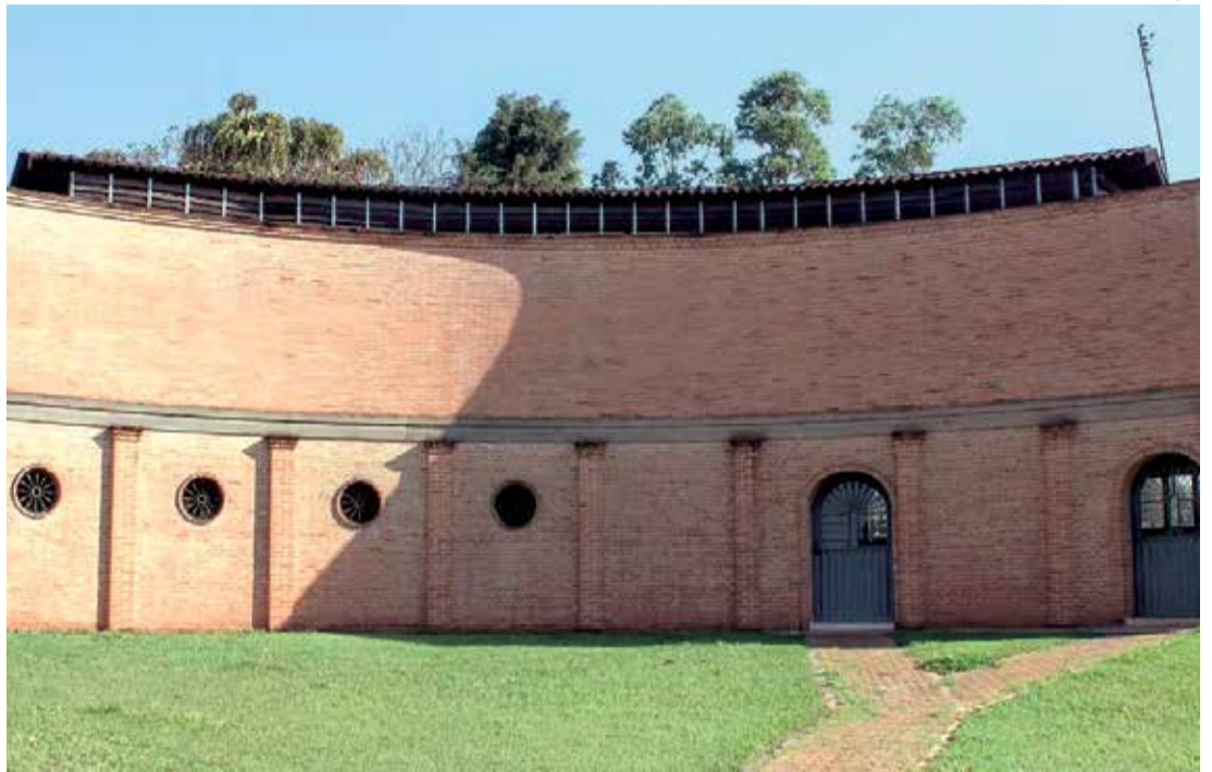
No município, o grande destaque é o Villaggio De Simoni

De acordo com o Anuário da Cachaça 2025, do