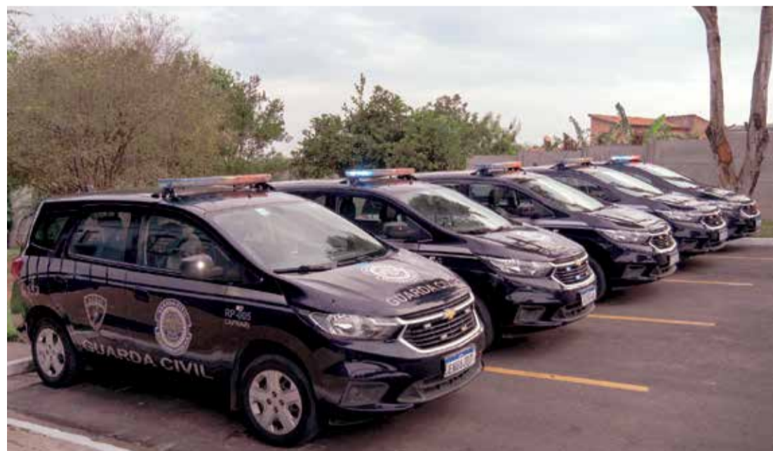
A operação contempla ações preventiva