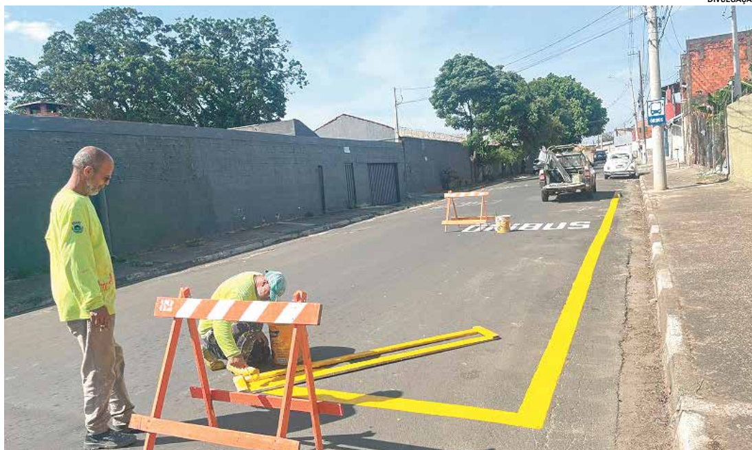
A alteração atende a uma demanda antiga

Com a mudança, o ponto de ônibus que ficava às margens da SP-101 deixou de ser utilizado. Agora, o ônibus passa pela rua 21, onde foi implantado um novo ponto próximo à escola, oferecendo mais segurança e acesso para quem depende do transporte público. De acordo com a Secretaria, os veículos se-