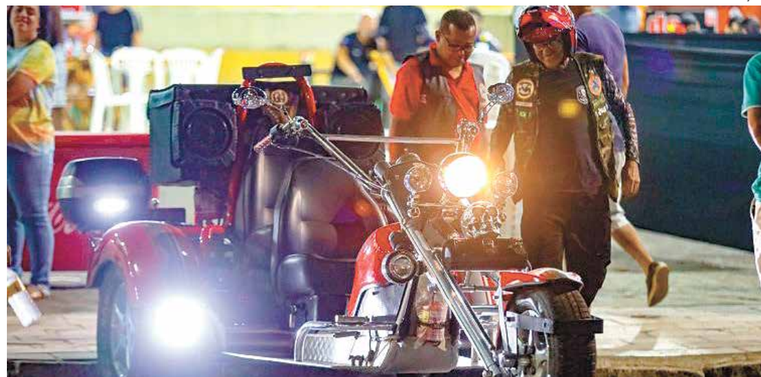
ENCONTRO DE MOTOS: Shows, exposições e a 11ª edição do Motofest integram a programação do tradicional Encontro de Motos de Capivari