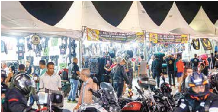
Evento reúne apaixonados por motociclismo