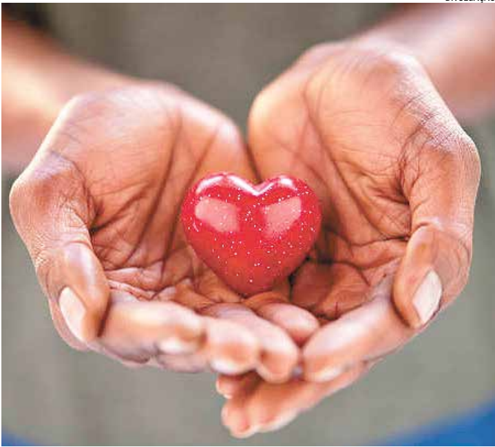
A campanha reforça a importância da participação coletiva

Para este ano, a instituição destaca uma lista de itens prioritários, essenciais para o funcionamento diário