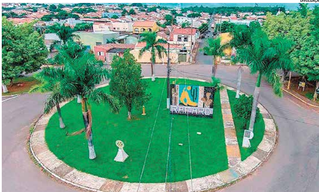
Os recursos garantidos até 2029 permitem ampliar ações culturais

Esse processo reforça o compromisso da gestão municipal com a democratização do acesso às políticas públicas de cultura e com o fortalecimento do Sistema Municipal de Cultura, composto por Conselho, Fundo e Plano — estruturas legalmente instituídas e reconhecidas