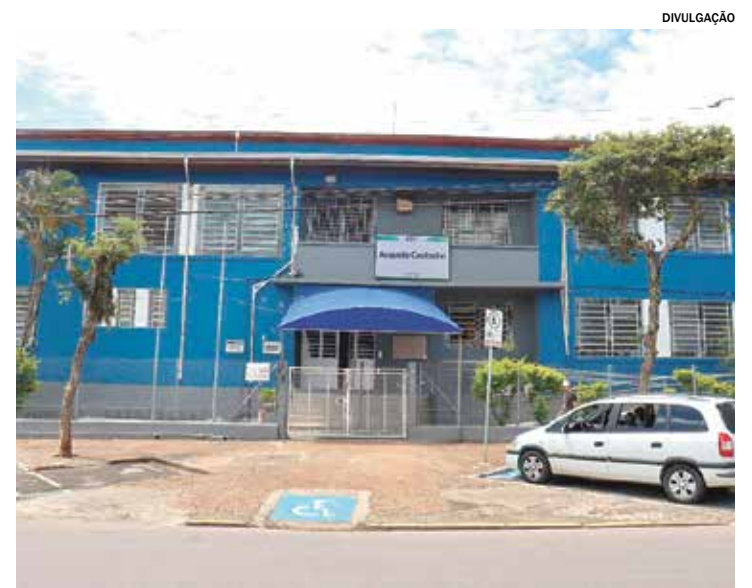
Os interessados devem comparecer pessoalmente

O governo afirma que as mudanças têm como objetivo reduzir custos e burocracias, ampliando o acesso à CNH e contribuindo para diminuir o número de motoristas que circulam sem habilitação no país. A nova norma entrará em vigor após ser publicada no Diário Oficial da União.