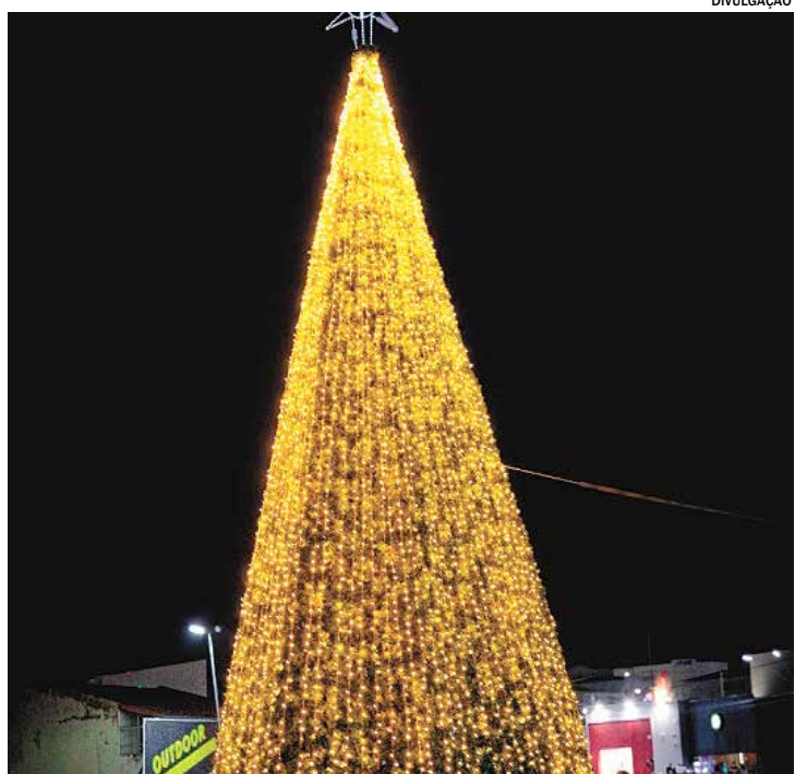
NATAL: Monte Mor volta a brilhar com decoração natalina após anos sem iluminação especial