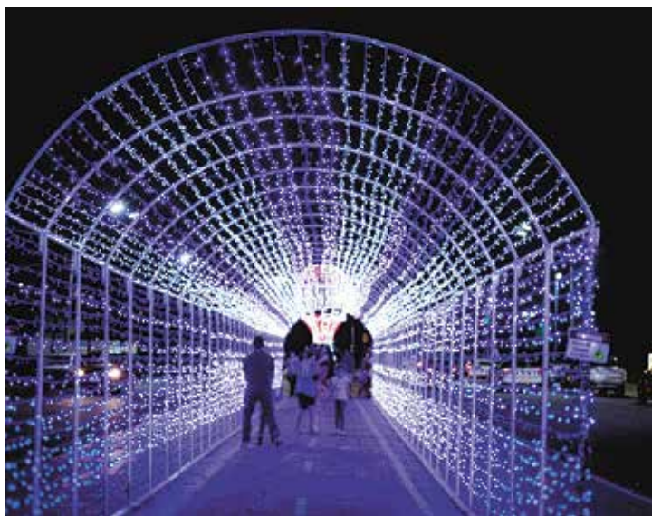
Cidade ganhou letreiro com os números 2026