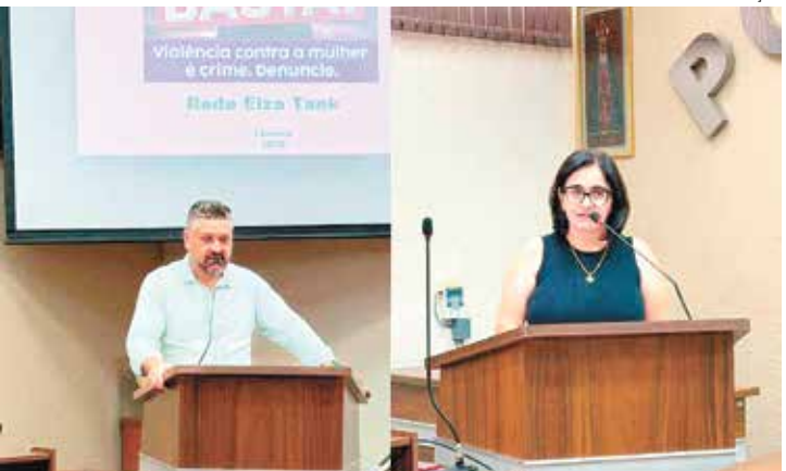
Intenção é enfrentar a violência de gênero no município

A Câmara Municipal de Rafard recebeu a apresentação do Plano de Metas – Proteção contra a Violência da Mulher, iniciativa que reúne diretrizes para ampliar a prevenção, a segurança e o acesso a direitos por parte das mulheres do município. O encontro contou com representantes do poder público e do Conselho Municipal da Condição Feminina.