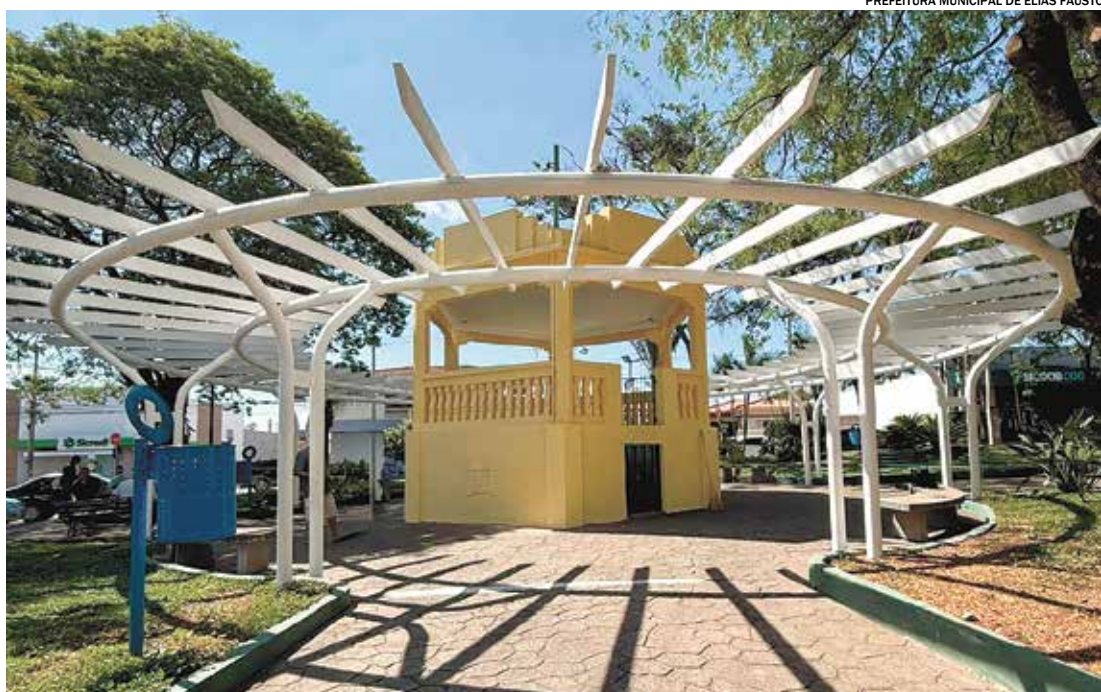
Um dos destaques da revitalização é o novo parquinho infantil, brinquedos novos, coloridos, modernos e completo

ressaltou a importância dessa intervenção para a cidade. “Estamos trabalhando para transformar nossos espaços públicos e oferecer mais qualidade de vida às famílias de Elias Fausto. A revitalização da Praça