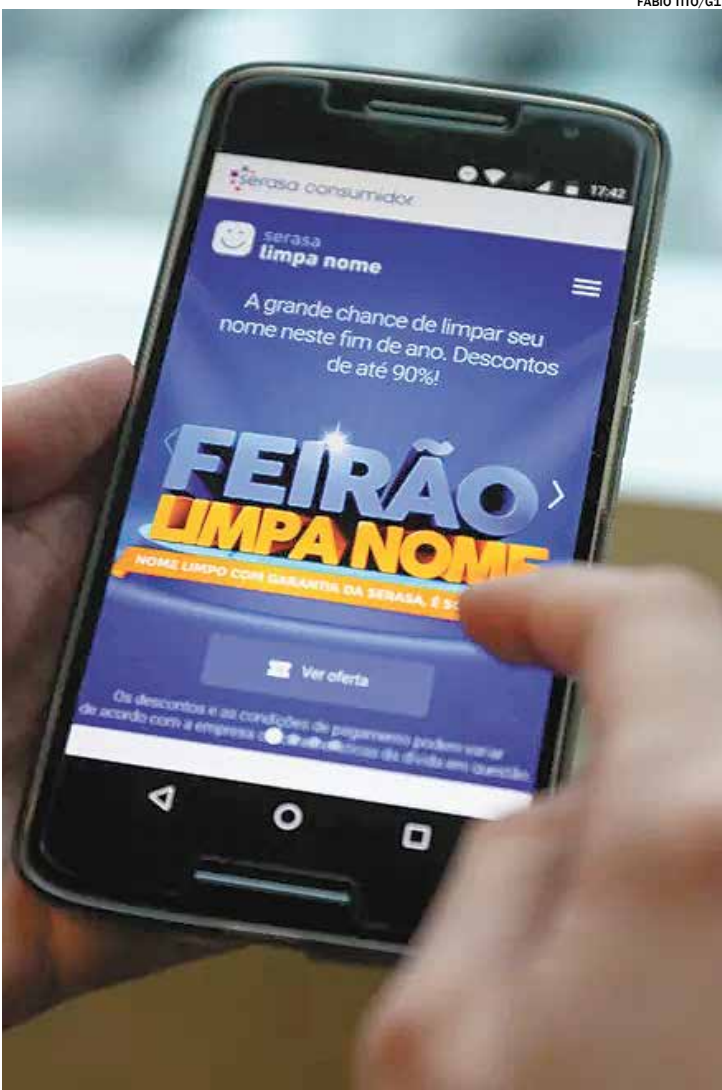
O Feirão é uma oportunidade de reorganizar as contas