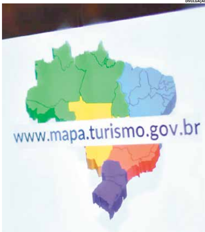
Cidade segue exigências do Ministério do Turismo

Para alcançar essa conquista, o município precisou cumprir uma série de exigências do Ministério do Turismo. Entre elas estão a existência de um órgão gestor da área, função exercida pela Diretoria de Turismo, a manutenção de um Conselho Municipal de Turismo ativo, a apresentação de dotação orçamentária específica para o setor e o registro de pelo menos um prestador de serviços no sistema CADAS-