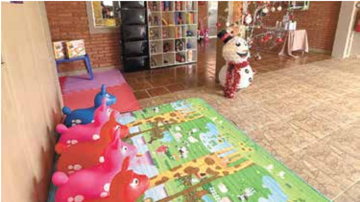
Espaço foi totalmente reestruturado, recebendo móveis e brinquedos novos, criando um ambiente mais seguro, acolhedor e adequado às necessidades dos acolhidos

Já falecido, Monsenhor Jonas Abbib residiu em Cachoeira Paulista, onde fundou a Comunidade Canção Nova e o jornal religioso da instituição. Sua trajetória de evangelização, acolhimento humano e defesa da dignidade das pessoas motivou o município a eternizar seu legado por meio da instituição que acolhe crianças em situação de vulnerabilidade.