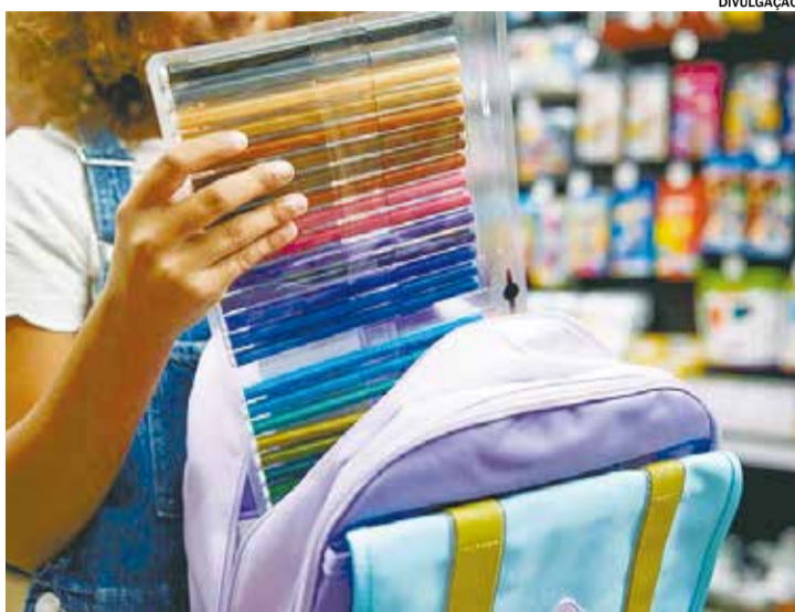
A dica é pesquisar antes de comprar os produtos

Para driblar os reajustes, especialistas recomendam a pesquisa de preços. Um levantamento do Procon-SP revelou diferenças significativas nos valores de produtos entre