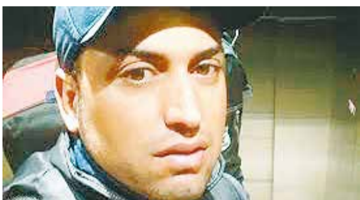
Motoboy de 37 anos perdeu a vida vítima de cerol