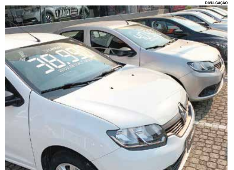
Com alta de 9,7% na produção, o país retomou posição no ranking global

As importações, por sua vez, alcançaram 466,5 mil unidades, com alta de 33%, impulsionadas principalmente pela chegada de veículos eletrificados da China.