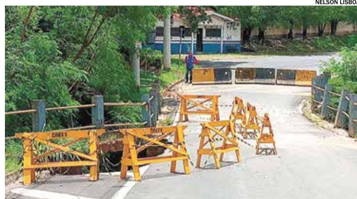
Executivo trabalha para garantir reparos e novas obras de infraestrutura

No que se refere ao asfalto, a gestão municipal informou que não houve repasse de contratos anteriores da administração anterior para este tipo de serviço. A necessidade de uma nova licitação é uma medida que levará mais tempo para ser concretizada.