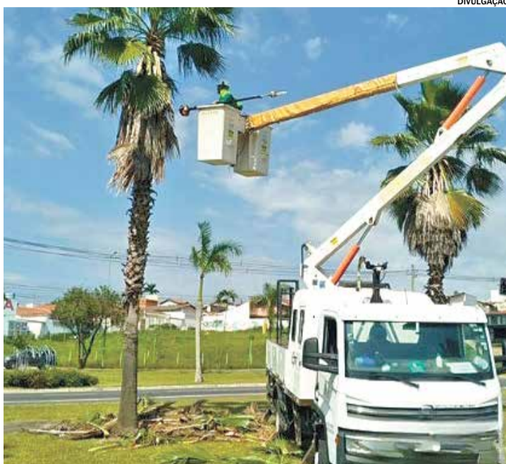
A fiscalização será mais rigorosa, com base na Lei Municipal

pulação, que antes estavam represadas no canal da Ouvidoria da Prefeitura, agora estão sendo direcionadas para atendimento imediato. A fiscalização será mais rigorosa, com base na Lei Municipal 3480/2015, que prevê a autuação de pro-