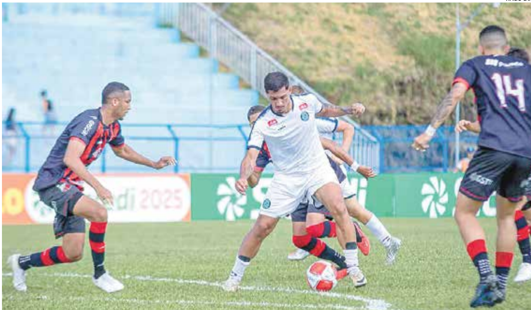
O duelo marcou a volta da disputa entre as duas cidades vizinhas