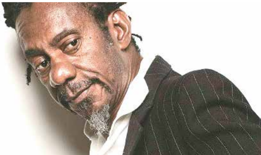
Documentário resgata legado de Luiz Melodia

Luigi, aos 20 anos, busca pertencimento em um grupo fascista, tentando lidar com as marcas de um passado abusivo causado por seu pai.