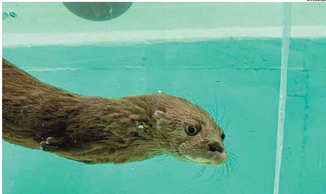
Zoo também quer escolher o do nome da nova lontra

Das 9h30 às 12h30, os visitantes poderão explorar o acervo do Museu de Zoo-