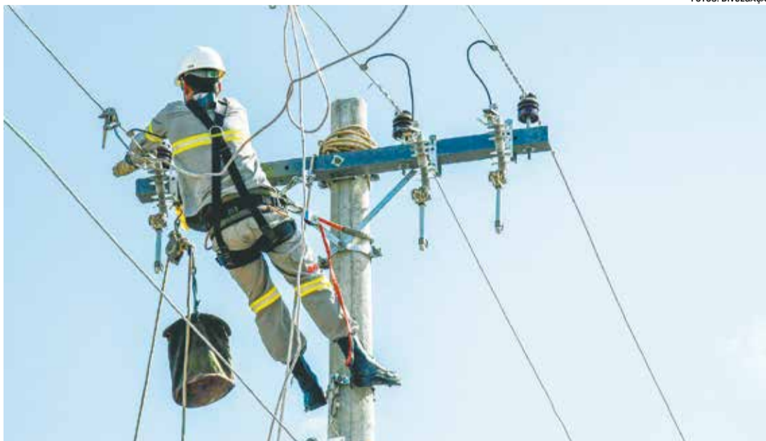
Salto registrou 83 ocorrências de falta de energia provocadas por pipas

Por esse motivo, a CPFL trabalha o tema ativamente com sua campanha Guardiã da Vida, realizando,