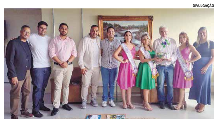
A Festa do Figo/Expo Goiaba 2025 acontece de hoje a 2 de fevereiro

A Biblioteca Infantil Municipal está localizada na Rua da Pena, 673, no Centro. Mais informações podem ser obtidas, de segunda a sexta-feira, das 8h às 17h, pelo telefone: (15) 3231-5723.