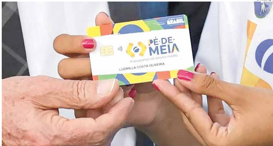
As inscrições para a bolsa serão abertas no segundo semestre

A medida, que faz parte do Programa Mais Professores, visa aumentar o número de ingressantes em licenciaturas e combater a evasão nos cursos. “Esse importante programa é para atrair, estimular e incentivar as pessoas a entrarem nas licenciaturas e permanecerem”, destacou o ministro da Educação,