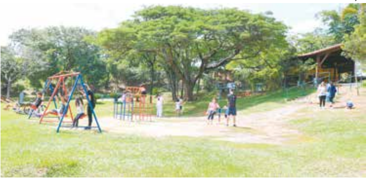
O Parque do Lago é um dos principais espaços de lazer da cidade