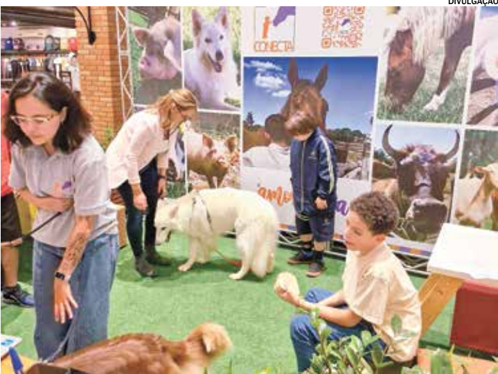
O público poderá participar de oficinas pedagógicas e atividades com os cães

É uma oportunidade para ver, sentir e compreender como a presença e o vínculo com os animais, especialmente os cães, podem ser