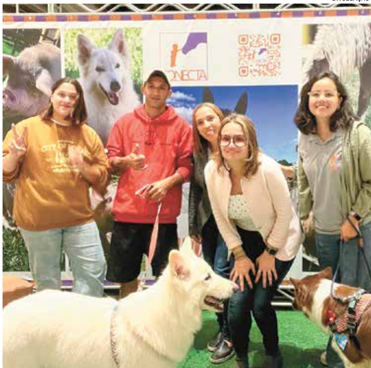
Cães terapeutas: são atração no Plaza Shopping.