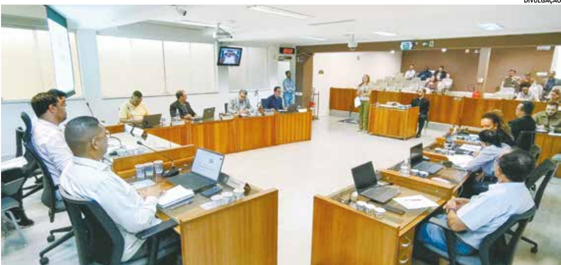
A audiência foi conduzida pelo presidente da Câmara