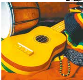
O Projeto celebra o Dia Municipal do Reggae

O Projeto, que celebra o Dia Municipal do Reggae, promove a unificação de vertentes artísticas como dança, artesanato, grafitti, capoeira e a valorização de bandas independentes. Classificação livre, entrada gratuita.