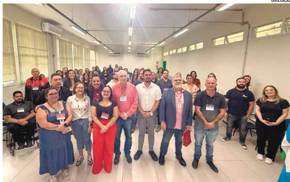
As propostas discutidas serão encaminhadas para a Conferência Estadual de Saúde

Participação popular e controle social: Foi reforçada a importância de fortalecer os conselhos locais de saúde, garantindo mais representatividade e autonomia.