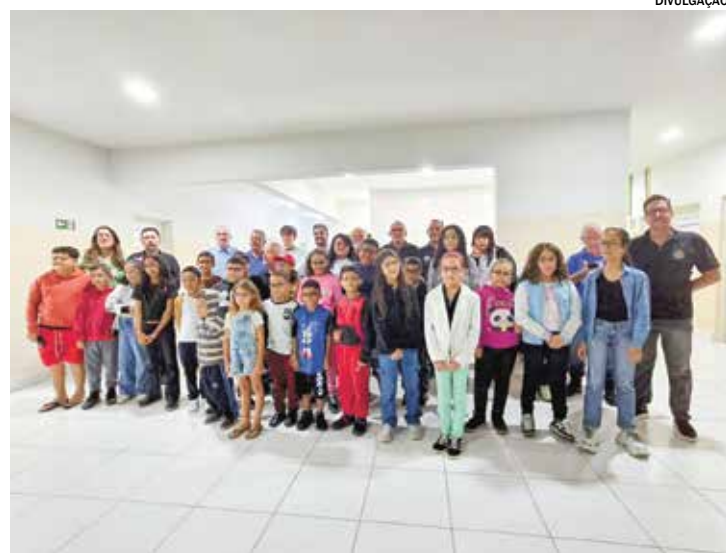
A entrega beneficiou cerca de 30 crianças que passaram por avaliação

A Prefeitura de Salto, em parceria com o Rotary Club local, realizou a entrega gratuita de óculos para aproximadamente 30 alunos da rede municipal de ensino. A ação representa um importante passo na promoção da saúde ocular e no cuidado com o desempenho escolar das crianças, garantindo melhores condições de aprendizagem.