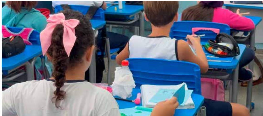
A entrega faz parte do curso de capacitação dos educadores

referência nacional em educação inclusiva e acessibilidade.