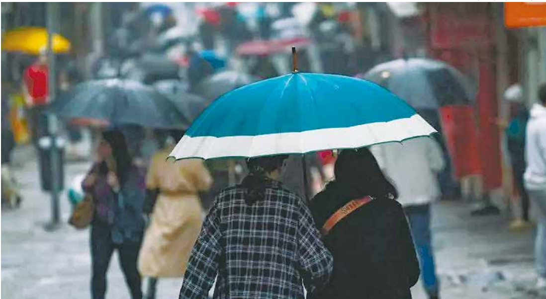
O inverno começa oficialmente no dia 20 de junho

Além da frente fria que chegou nesta semana, um segundo pulso de ar polar deve avançar entre os dias 31 de maio e 1º de junho, reforçando ainda mais o frio, especialmente no Sul, Sudeste e Centro-Oeste. A expectativa é de que os primeiros dias de junho registrem recordes de baixa temperatura, com possibilidade de geada e até neve em