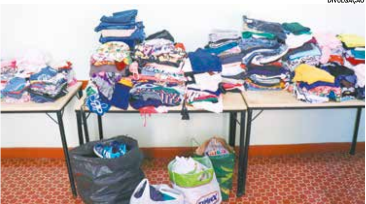
A campanha segue até o dia 13 de junho