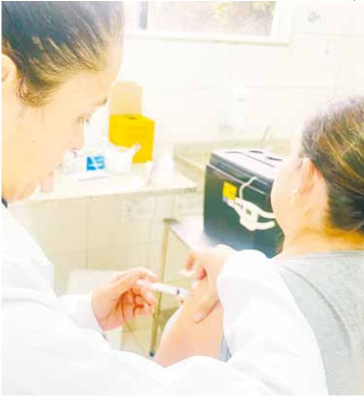
A ação tem como objetivo ampliar a cobertura vacinal

Para receber a dose, é necessário levar CPF e car-