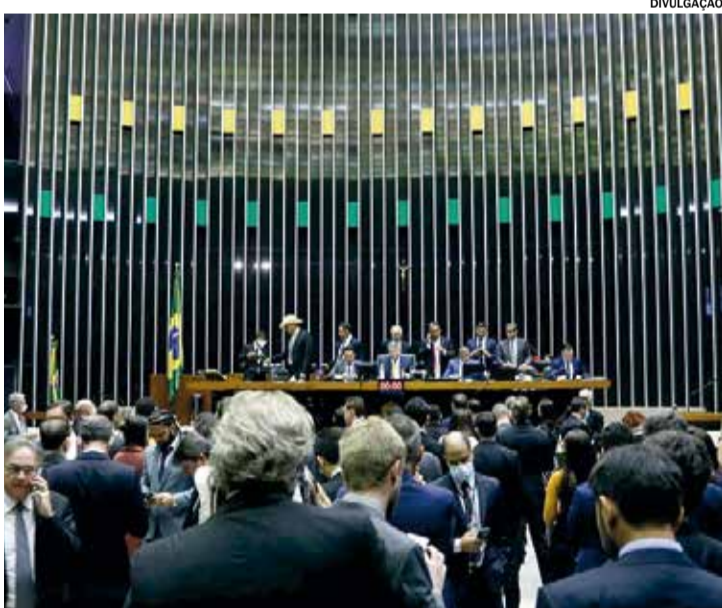
A proposta surgiu devido a uma decisão do Supremo Tribunal Federal

A Câmara dos Deputados finalizou terça-feira (19) a votação do projeto de lei complementar (PLP) 175/24, que regulamenta as regras de transparência, execução e impedimentos técnicos de emendas parlamentares ao Orçamento. O projeto já havia passado pela avaliação dos deputados, mas sofreu mudanças no Senado e teve que tramitar de novo na Câmara e será enviado à sanção presidencial. A proposta surgiu devido a uma decisão do STF de suspender a execução de emendas parlamentares até que sejam definidas regras sobre con-