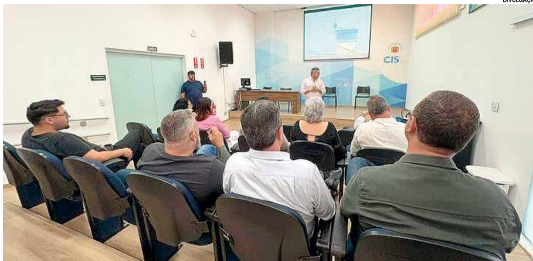
Reunião de transição abordou o saneamento em Itu