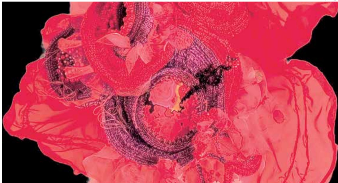
As obras questionam permanência e mudança, identidade e dissolução