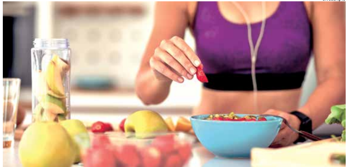
Atletas precisam de um acompanhamento nutricional especializado

A nutricionista ressalta ainda que a hidratação é um aspecto crucial, embora muitas vezes negligenciado. “A desidratação pode comprometer seriamente o rendimento do atleta. A quantidade e a frequência de ingestão de líquidos devem