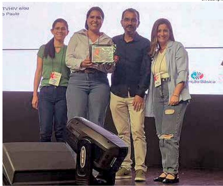
A cidade se destaca nos avanços de combate à transmissão vertical

O prêmio, conquistado pelo segundo ano consecutivo, reflete o trabalho integrado da Vigilância Epidemiológica (Viep), Ambulatório de Moléstias Infecciosas (AMI), Unidades Básicas de Saúde (UBS), Centro de Referência da Mulher (CRM), Rede Cegonha, maternidade, equipe multiprofissional