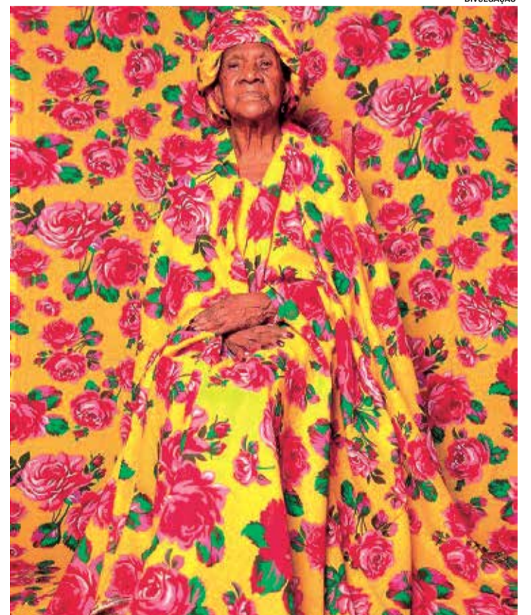
AFRO: Exposição celebra ancestralidade negra em Itu. Pág. A10