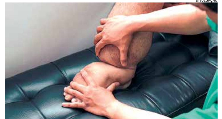
Nome popular, elefantíase, é derivado do grande inchaço que ela provoca

prazo, a filariose linfática ou elefantíase permanecia endêmica no Brasil apenas na região metropolitana do Recife, incluindo Olinda, Jaboatão dos Guararapes e Paulista. Segundo o Ministério da Saúde, o último caso confirmado foi registrado em 2017. A doença é transmitida pelo mosquito Culex quiquefasciatus .