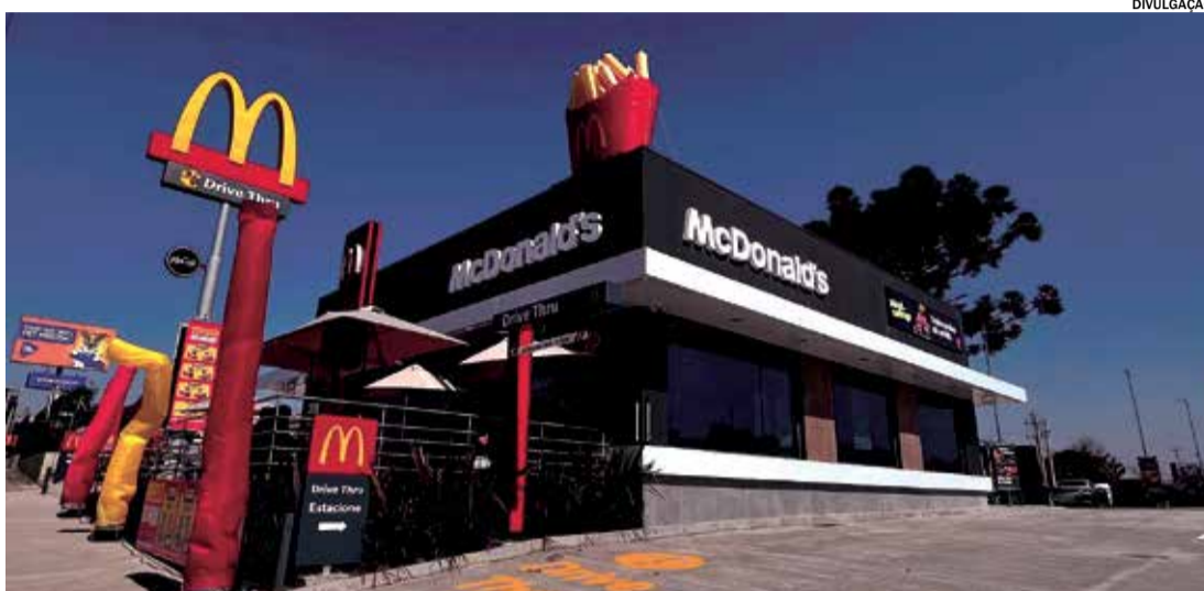
As entrevistas e seleções ocorrerão dia 28 de novembro a partir das 14h

O estabelecimento se destaca por ser uma das principais portas de entrada para o mercado de trabalho jovem