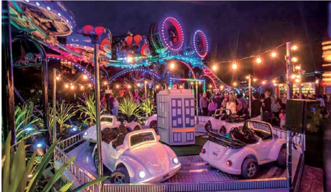
O prefeito Guilherme Gazzola (PP) lamentou a disseminação do que classificou como "fake news"