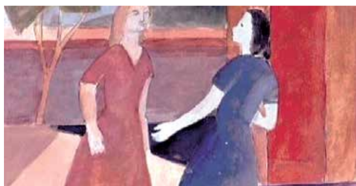
Uma das obras da mostra premiada

do pela renomada artista plástica Maria Bonomi, o prêmio trouxe mais visibilidade ao FAMA Museu, que