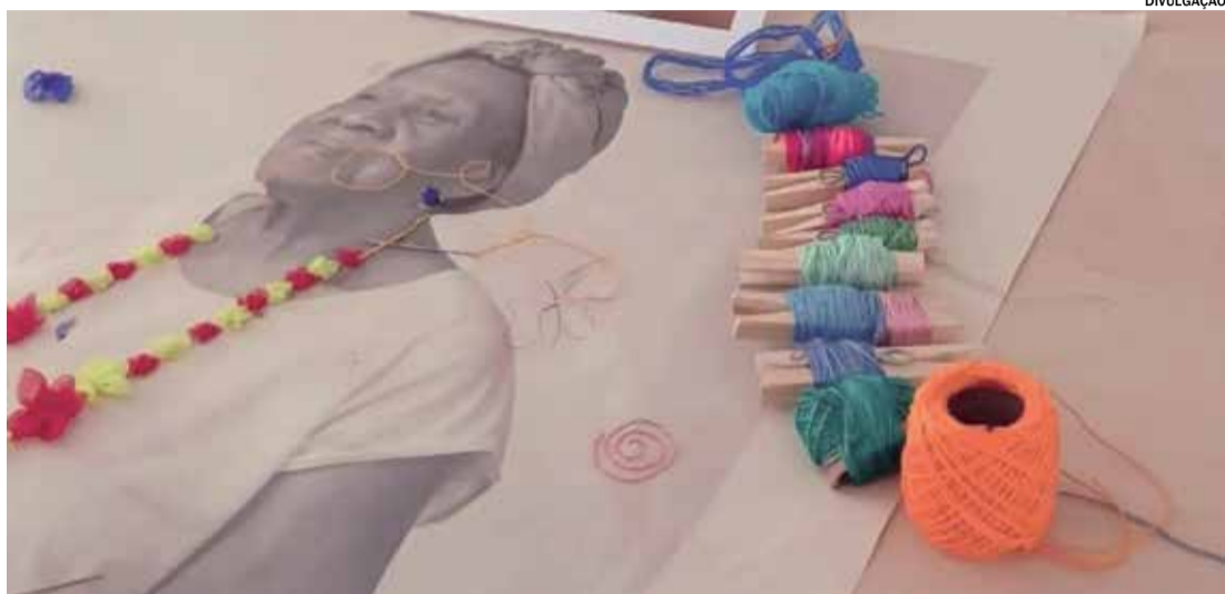
A mostra revela a resistência negra frente aos desafios históricos

O Grupo NYOTAS, cujo nome significa “estrela” em swahili, é formado por mulheres negras com mais de 50 anos que, há mais de uma década, vêm lutando para transformar invisibilidade social em protagonismo. Inspirado por uma palavra que também significa “guerreira”, o grupo representa a luta pela preservação e valorização da cultura afro-brasileira, resgatando histórias e destacando o papel essencial das mulheres negras na formação da