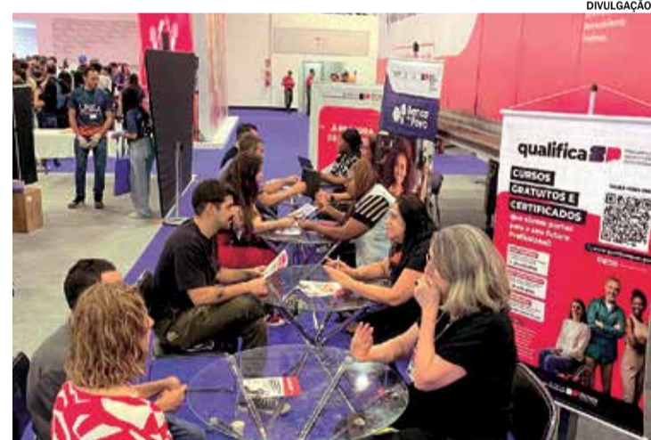
As inscrições podem ser feitas pelo site até dia 25 de novembro

didatos selecionados ocorrerá por e-mail. As aulas têm previsão de início para o dia 2 de dezembro. Para