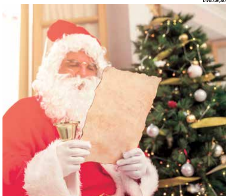
NATAL: Correios disponibilizam cartinhas de crianças para adoção. Pág. A5