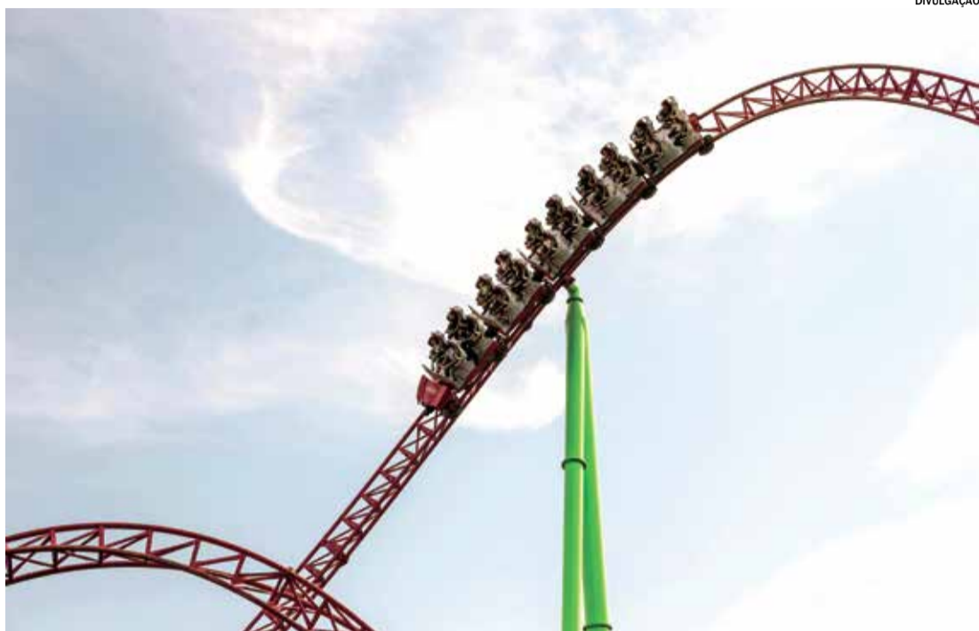
Fabricada na Itália, montanha russa deve ter 54 metros de altura

tem um prazo de um ano para o início das obras, com a previsão de gerar cerca de mil empregos diretos e indiretos durante a construção. Em plena operação,