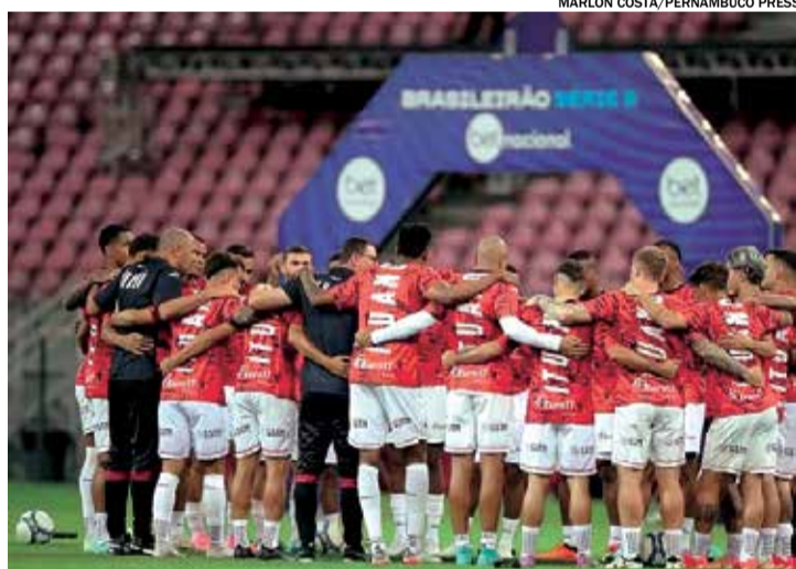
Só em 2024, o Galo de Itu caiu para a A2 no paulista e Série C no brasileiro

Com a vitória do CRB na Vila Belmiro, o Z-4 da Série B foi definido. Sendo assim, Ituano, Ponte Preta, Guarani e Brusque foram os quatro rebaixados para a terceira divisão nacional. Para o Galo, o sabor é amargo, pois a virada heroica contra o Vila Nova tinha devolvido a esperança para a torcida. Sendo assim, o clube passará 2025 longe dos holofotes, disputando a A2 no Paulistão e a Série C no Brasileiro. Em nota, a diretoria definiu os dois acessos como prioridade.