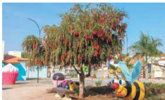
Ao longo do dia, monitores coordenarão atividades recreativas para as crianças