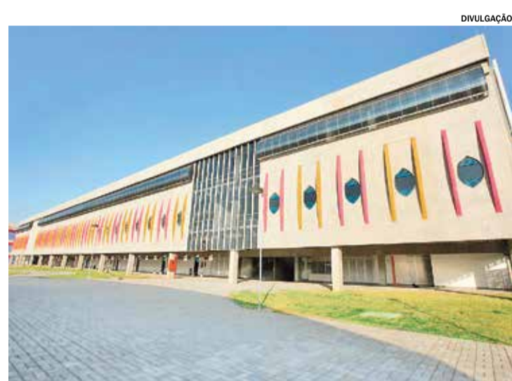
Objetivo é revisar o Plano Diretor e da Lei de Ocupação do Solo de Itu