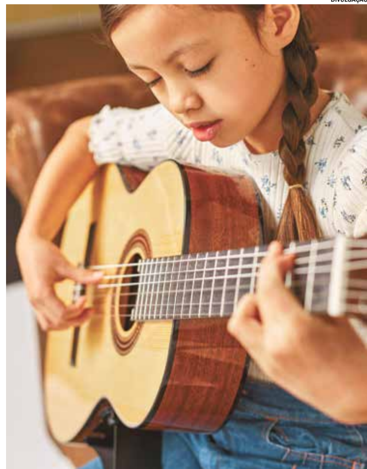
A idade mínima para participar é de 7 anos

A sede da Assatemec está localizada na Rua Cuiabá, 81, no Bairro Brasil, em Itu. Para mais informações, os interessados podem entrar em contato pelo telefone (11) 4022-0206.