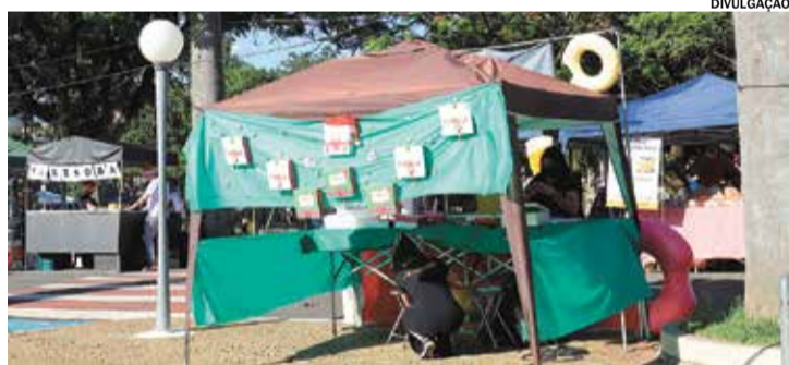
As inscrições podem ser realizadas até o dia 30 de novembro

A Prefeitura de Itu abre inscrições para artesãos, pequenos produtores e revendedores interessados em participar da Feira de Artes e Artesanato edição de Natal,