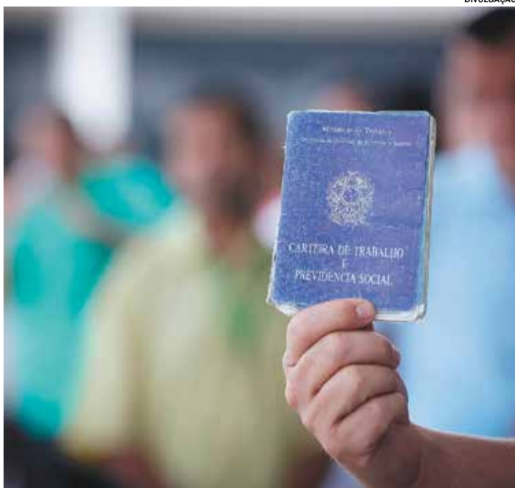
Itu ocupa 21ª posição no ranking mensal

Esse desempenho é parte de um cenário mais amplo de crescimento do mercado de trabalho no estado. Em agosto, São Paulo criou 60.770 vagas de emprego, representando 26% do total de postos formais gerados no Brasil. No acumulado do ano, de janeiro a agosto,