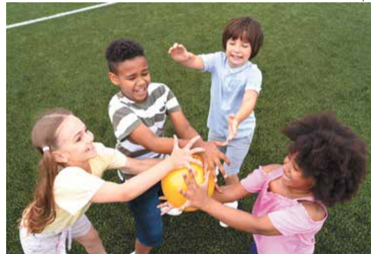
O evento contará com uma variedade de atividades para os participantes