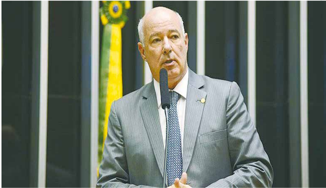
O prefeito eleito tem 68 anos, é casado e declara à Justiça Eleitoral a ocupação de empresário.

A abstenção foi de 37.151 eleitores da cidade, o que representa 28,54% dos aptos a votar.