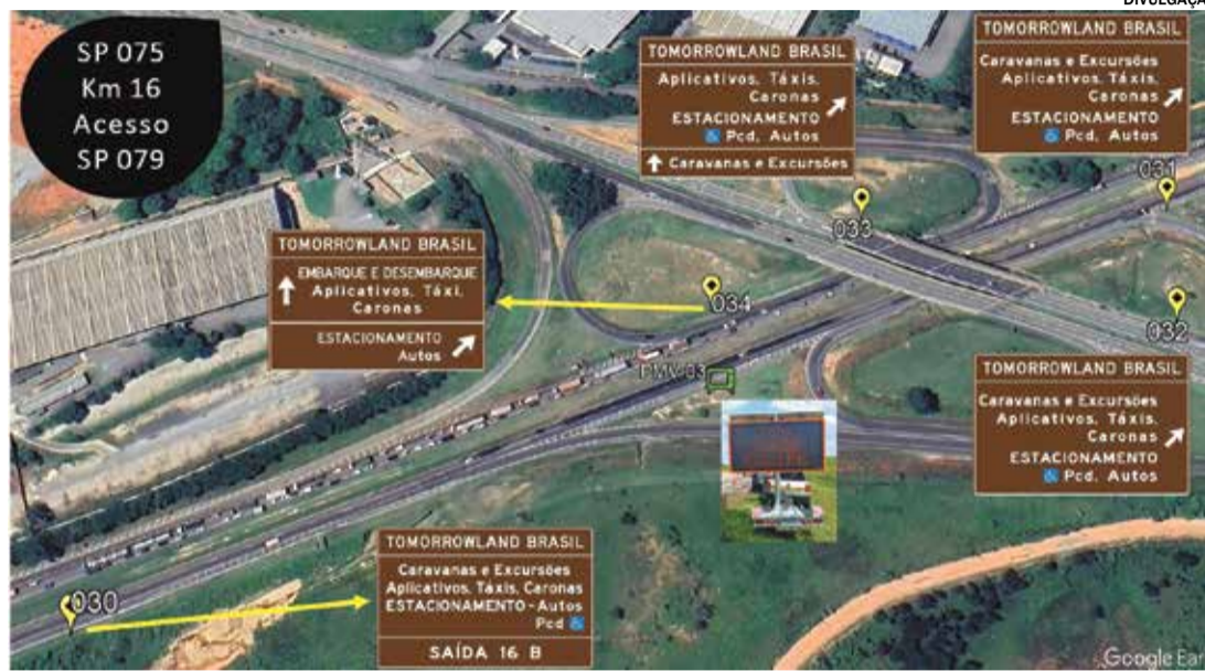
Sinalização aos motoristas estará à disposição nas rodovias

Como o festival ocorre próximo ao km 18 da SP-075, em Itu, e o acesso principal se dá pelas rodovias SP-280 e SP-300, a concessionária implementará uma sinalização especial nesses trechos para indicar as melhores rotas aos motoristas. Placas serão instaladas para direcionar ônibus, vans,