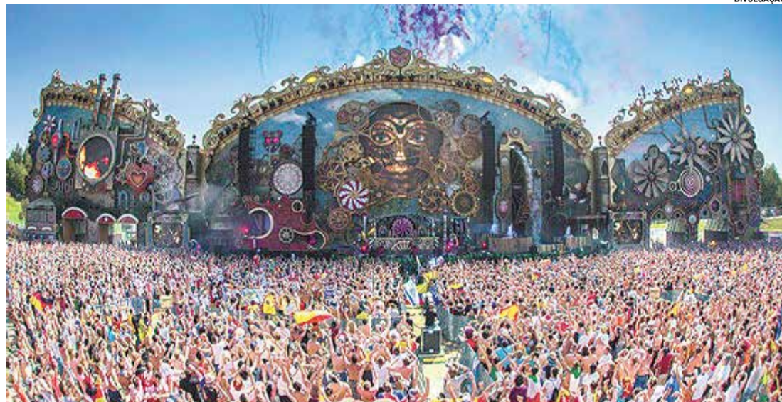
O festival de música eletrônica mais famoso do mundo segue até domingo

O evento também terá grandes nomes da cena eletrônica brasileira, como Alok, ANNA, Bhaskar e Vintage Culture, entre outros. O festival promete uma experiência inesquecível para os fãs, unindo sons, culturas e visuais em um único lugar.