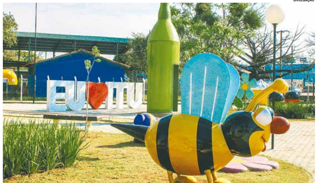
DIA DAS CRIANÇAS: tradicional festa será na Praça dos Exageros.