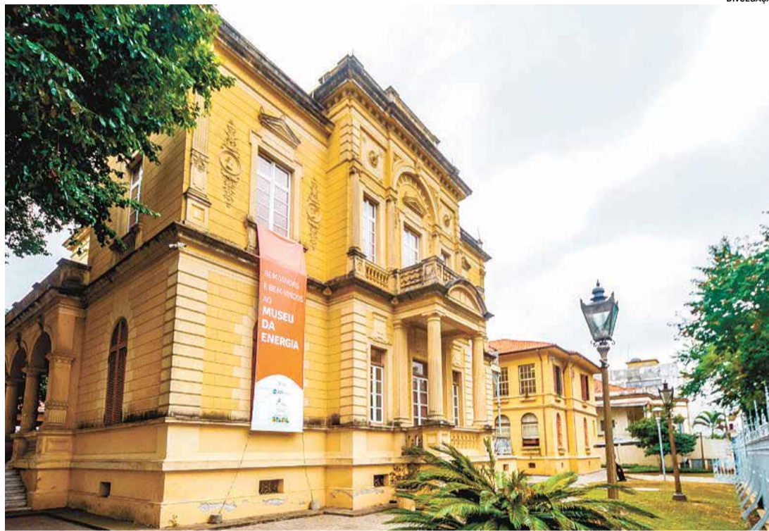
No feriado, o Museu lança o jogo educativo “Super Eletros”, às 15h

No feriado, o Museu lança o jogo educativo “Super Eletros”, às 15h, na Sala de Ação Educativa. Este jogo de cartas oferece uma experiência divertida, onde os participantes competem para conquistar as cartas dos adversários por meio de escolhas estratégicas relacionadas à eficiência energética, Selo Procel, preço e consumo. “Super Eletros” é uma maneira lúdica de ensinar sobre sustentabilidade, apresentando eletrodomésticos do dia a dia e informações sobre consumo