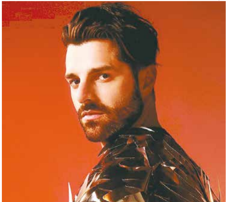
ALOK: DJ se apresenta domingo, 13, no palco principal “Adscendo” Tomorrowland 2024.