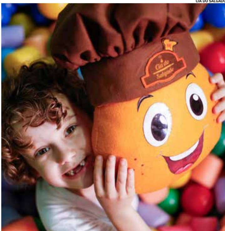
CIA DO SALGADO

Ao longo do dia, monitores coordenarão atividades recreativas para as crianças, com personagens do universo infantil interagindo e tirando fotos com os pequenos. Além disso, haverá distribuição gratuita de pipoca, algodão doce e suco para o público.