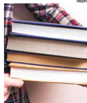
Não é preciso se inscrever

A feira é gratuita e aberta a toda a comunidade, permitindo que os interessados tragam livros que já leram e os troquem por cupons. Esses cupons poderão ser usados para adquirir novos títulos durante a feira, ampliando a oportunidade de descobrir novas obras e autores. Este formato de troca não só incentiva a leitura, mas também promove a sustentabilidade, ao dar uma nova vida a livros que não são mais utilizados. Um ponto importante a destacar é que, para participar, não é necessário fazer reservas.