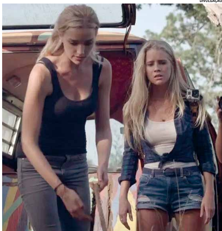
A Caverna será um dos filmes exibidos no dia 28

O Plaza Shopping Itu segue com a Mostra Curta Itu neste sábado (28), celebrando o cinema independente ituano com exibições no Cine Plaza. Nesta segunda etapa da mostra, serão apresentados curtas-metragens ficcionais de diversos diretores e produtores da cidade, das 10h às 12h. A entrada é gratuita, mas é necessário retirar os ingressos pela plataforma Symply. Os curtas-metragens que serão exibidos no dia 28 incluem: “A Caverna”, “O Eremita Recebe Visitas”, “Genuíno”, “Xadrez Mafioso” e “O Homem por trás da Cortina”. A Mostra Curta Itu conta com produção e curadoria da Hybrid Arte e Conteúdo, Estúdio Politeama e Emilio Filmes.