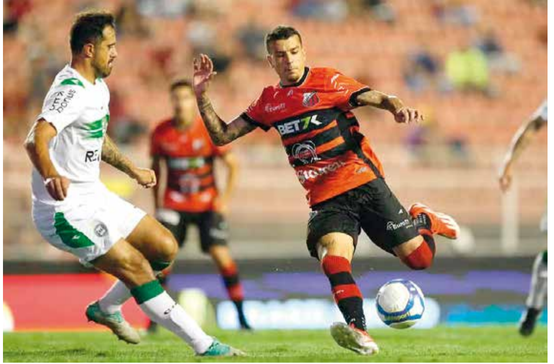
O rubro-negro de Itu volta a campo nesta sexta-feira (27)

O rubro-negro de Itu volta a campo nesta sexta-feira (27) visitando o Papão no estádio da Curuzu, no Pará.