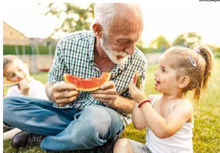
Crianças e idosos, necessitam de cuidados redobrados