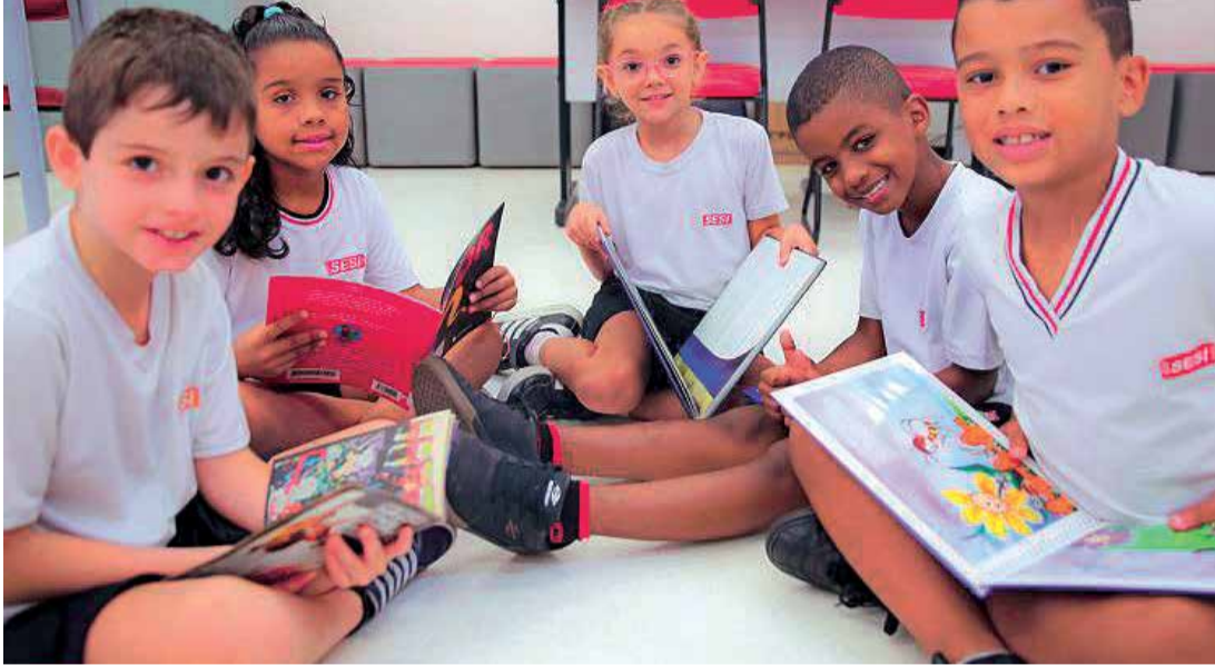
No ato da inscrição, o sistema exibirá as vagas disponíveis

As vagas são destinadas principalmente para o ingresso no 1º ano do Ensino Fundamental, com 128 escolas participando em todo o Estado. Outras séries terão