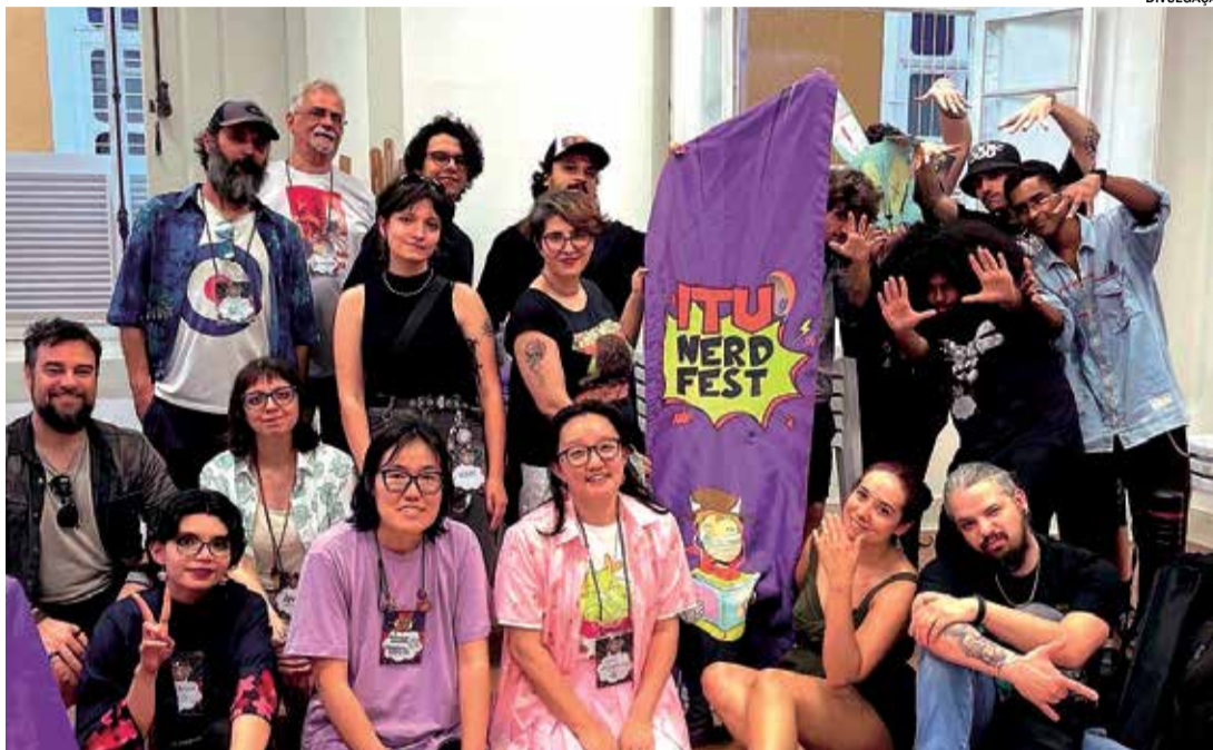
Os artistas que participaram do Artists' Alley da primeira edição

“O evento foi uma grande celebração da cultura nerd de Itu e região e veio para ficar. Já estamos nos preparativos para as próximas edições e agradecemos o apoio de todos os patrocinadores e apoiadores culturais, já que sem eles a Itu Nerd Fest não seria a mesma”, afirmam os