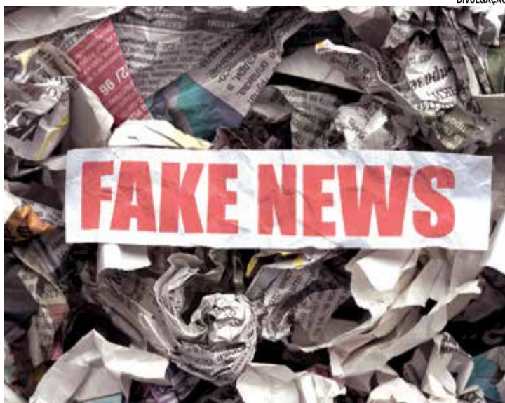
Entre os principais crimes eleitorais estão as chamadas Fake News

A prática de oferecer dinheiro ou prometer outras vantagens em troca de votos é uma das infrações mais graves. A comprovação da compra de votos pode levar à cassação do registro de candidatura ou do diploma