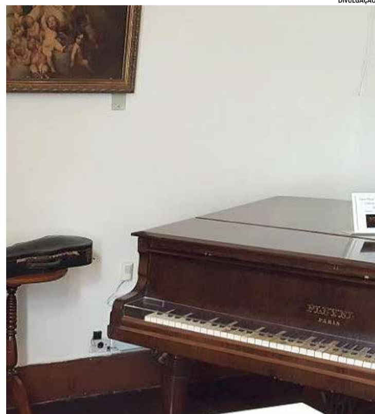
A mostra divulga a obra do compositor Luiz Gonzaga da Costa Júnior

Domingo (13): divulgação online da mostra “Uma bengala no acervo? O despertar da memória e do acervo”, disponível no site do Museu da Música – Itu.