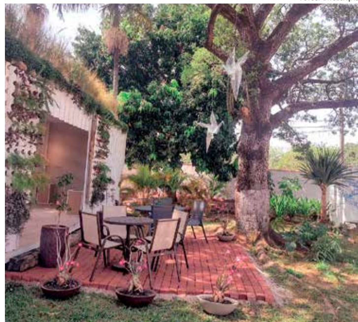
Ambiente externo que valoriza a sustentabilidade

Na gastronomia, o Itu Casa Decor Select apresenta o Boteco do BB, a Osteria Saltoral Bistrô e o Café Container Pérola Buffet, oferecendo uma variedade de experiências culinárias aos visitantes.