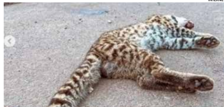
O gato-do-mato-pequeno é um dos menores felinos do Brasil

Considerado um dos menores felinos do Brasil, o gato-do-mato-pequeno é confundido até com espécies domésticas.