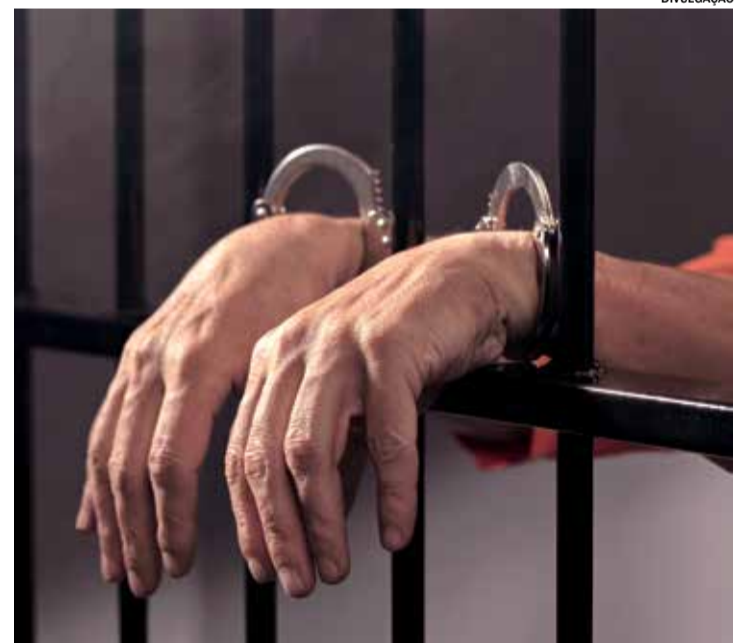
A legislação eleitoral também impõe restrições à prisão de eleitores

Para as eleições de 2024, essa restrição estará vigente entre os dias 1º e 8 de outubro, garantindo que os eleitores possam exercer seu direito de voto de forma livre e sem intimidações.