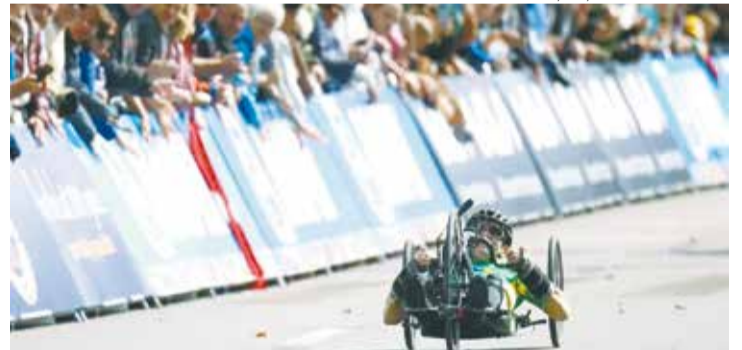
O Brasil chegou ao total de três medalhas na competição