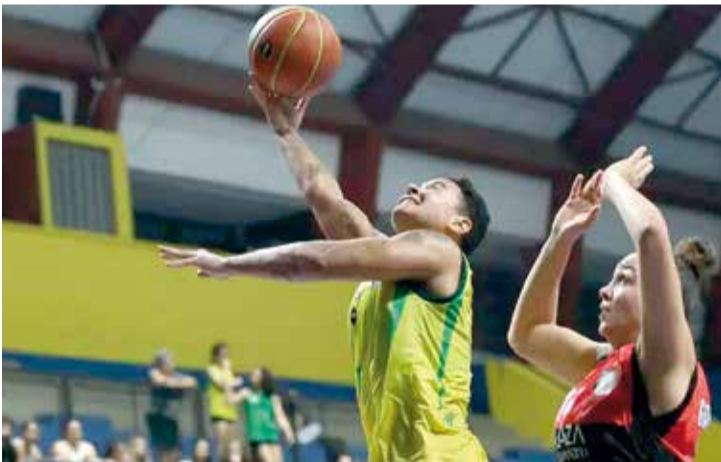
O Santo André saiu vitorioso, fechando o jogo em 84×74

Na noite de segunda-feira (23), o Ituano enfrentou o Santo André fora de casa e sofreu sua primeira derrota no Campeonato Paulista, com o placar de 84×74.