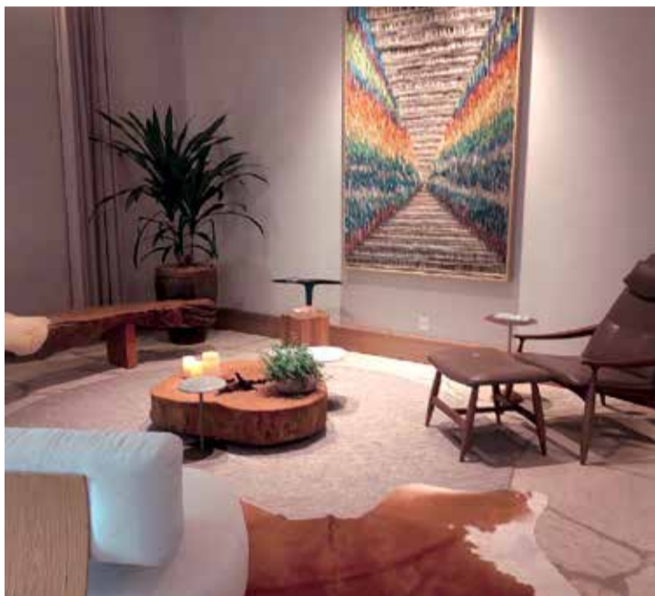
São 29 ambientes internos e externos projetados por profissionais