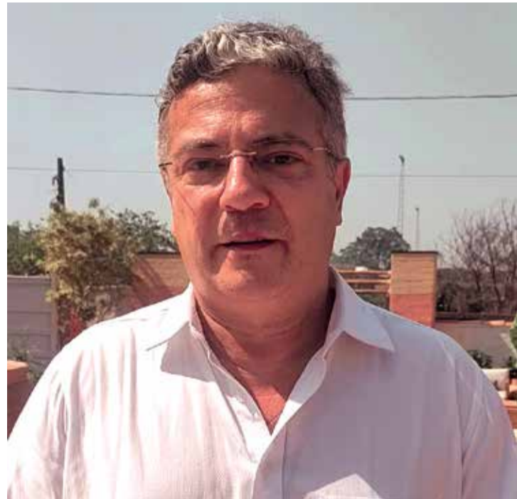
Prefeito falou da importância econômica da mostra para a cidade

presente na abertura, reforçou a importância do evento para o desenvolvimento do município: “A construção civil é uma prova do crescimento econômico da cidade, e eventos como esse mostram a pujança de Itu”.