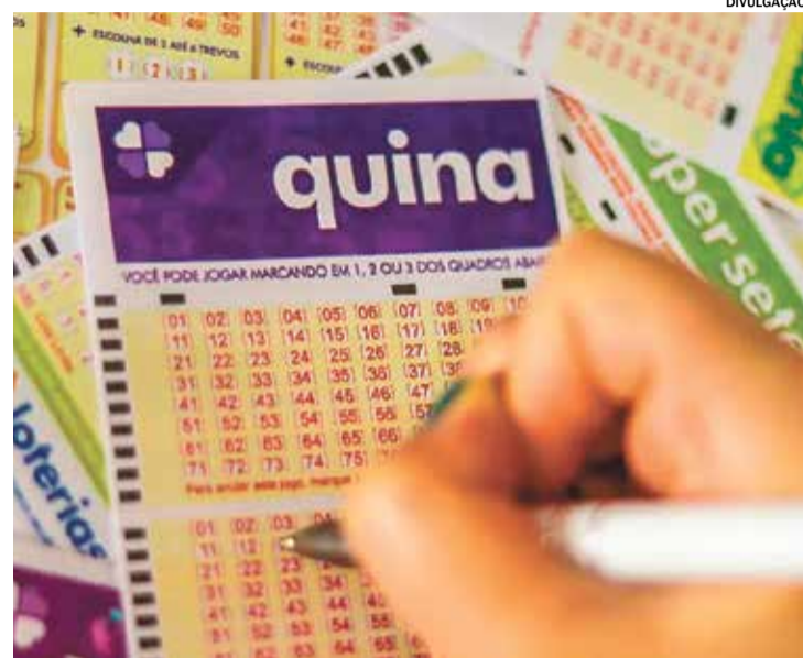
Aposta feita na cidade levou R$ 26,6 milhões na Quina de São João

Segundo dr. William, justamente por ser socialmente aceito, o problema costuma permanecer escondido durante muito tempo. "Diferentemente do álcool ou de outras drogas, a dependência em jogos costuma ser banalizada. A maioria dos pacientes procura ajuda apenas quando já perdeu o controle financeiro ou quando os prejuízos familiares e emocionais se tornaram muito graves."