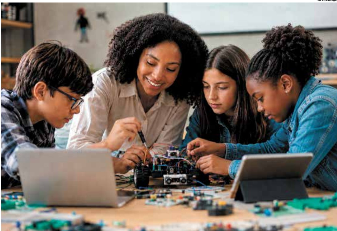
Estudantes se tornam autônomos, críticos e preparados para lidar com os desafios contemporâneos

Na educação, o pensamento computacional contribui para formar estudantes