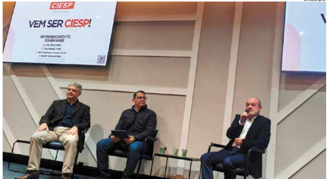
CIESP Indaiatuba promoveu diálogo entre empresas e organizações sociais pelo desenvolvimento regional