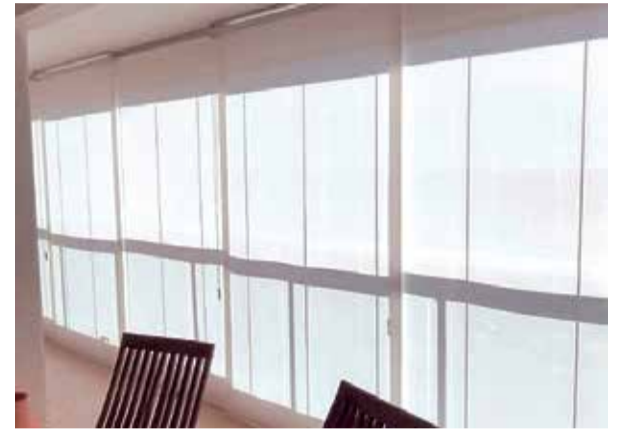
Precisando de cortinas, persianas, papel de parede, colchas, almofadas, tapetes, lembre-se sempre da Adelaide Decorações. Ligue e agende seu horário (19) 3894-4638 / (19) 99763-2829. Você vai adorar!