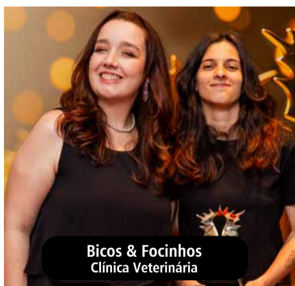
Bicos & Focinhos Clínica Veterinária

O Troféu Frutos de Indai, consolidado como um dos eventos mais tradicionais do município, valoriza trajetórias de dedicação, inovação e compromisso com o desenvolvimento econômico e social de Indaiatuba. A cerimônia acontece dia 24 de outubro e reúne lideranças, autoridades, convidados e representantes de diferentes segmentos.