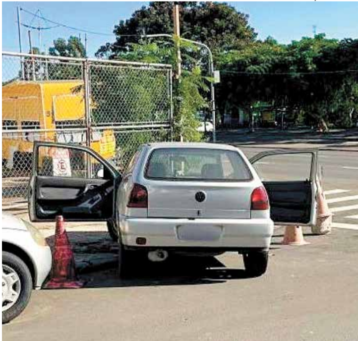
O veículo já havia sido localizado antes do proprietário fazer a denúncia

A Guarda Civil de Indaiatuba recuperou um veículo furtado na tarde de domingo (28), no Jardim Adriana. O automóvel foi localizado por uma equipe da ROMI após informações repassadas pelo Centro de Operações e Inteligência (COI).