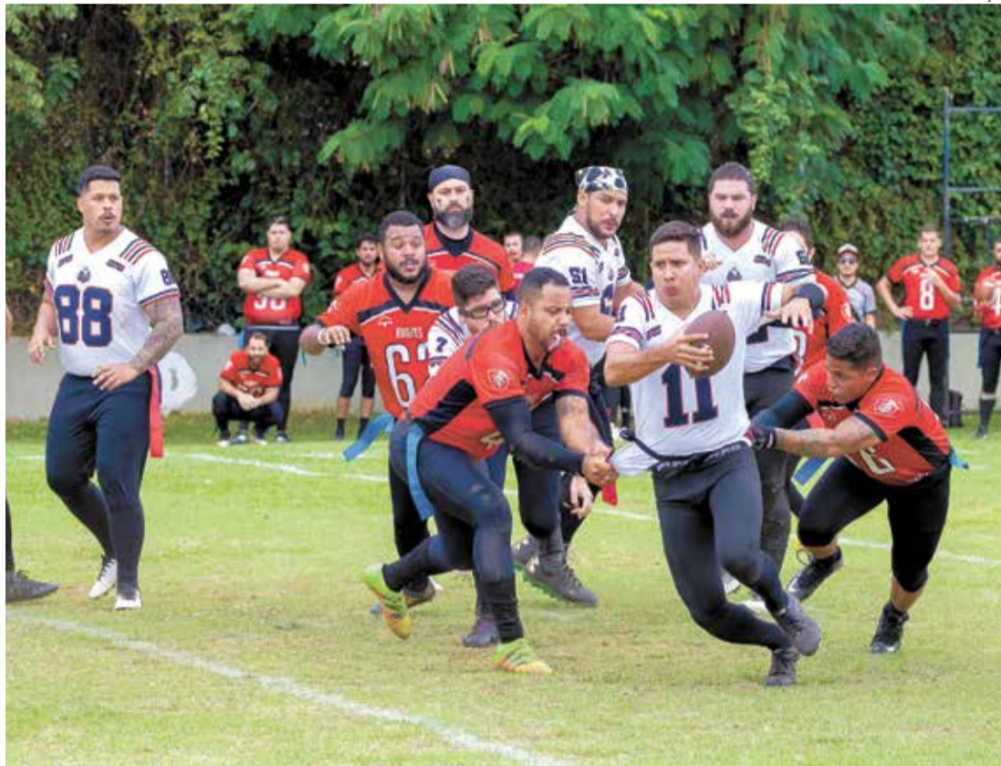
Equipe, que conta com 50 participantes, pretende crescer e melhorar resultados nas competições