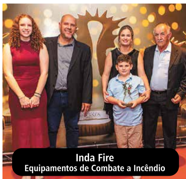
Inda Fire Equipamentos de Combate a Incêndio