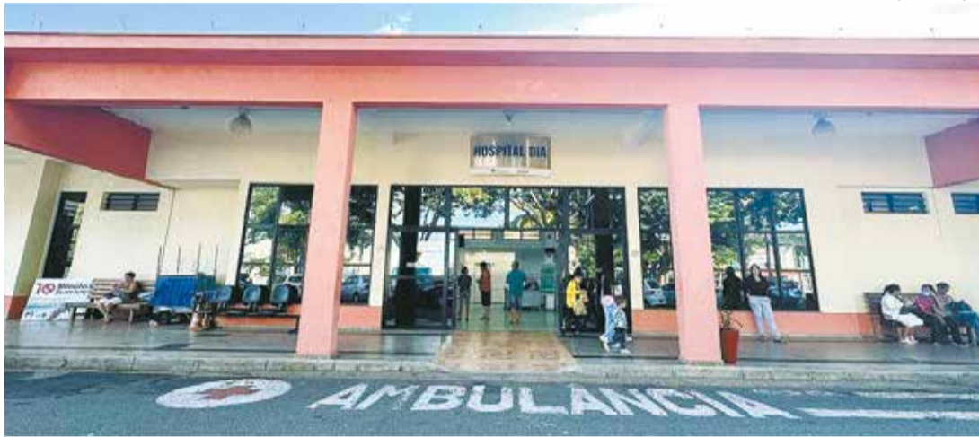
Procedimentos para pacientes oncológicos e hemodiálise estão entre as prioridades para uso da verba

Do total dos recursos, R$ 350 mil por mês serão destinados à realização de cirurgias. Até então, esse serviço era financiado exclusivamente pelo município. Com o novo repasse estadual, a administração municipal passa a contar com um importante reforço para ampliar o número de procedimentos e reduzir a pressão sobre os recursos próprios.