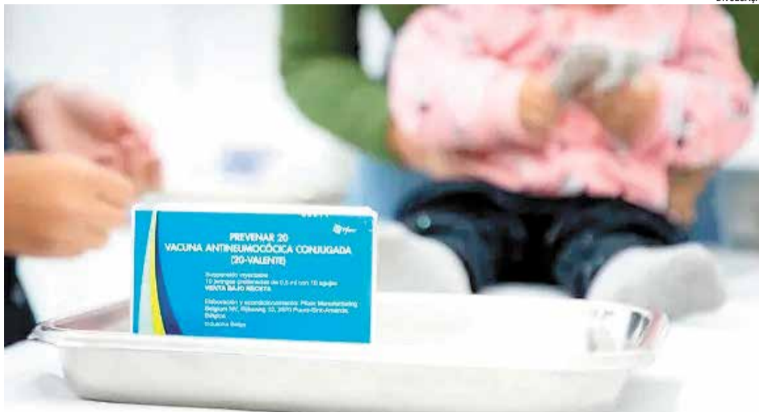
Esquema previne contra pneumonia, meningite e otite e é indicada para crianças com menos de 5 anos

A Pneumo 20 é indicada para crianças menores de cinco anos, com idade entre 2 meses e 4 anos, 11 meses