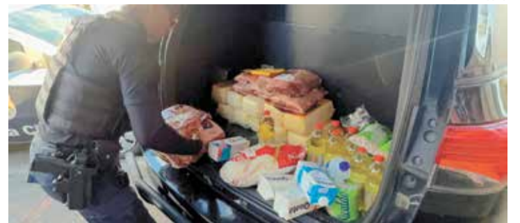
Foram apreendidos produtos alimentícios roubados de supermercados

Em razão da colisão, ambos foram encaminhados para atendimento médico e, posteriormente, apresentados no Plantão Policial para as providências da Polícia Judiciária. O veículo utilizado na ação criminosa ficou destruído com o impacto.