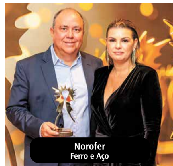
Norofer Ferro e Aço