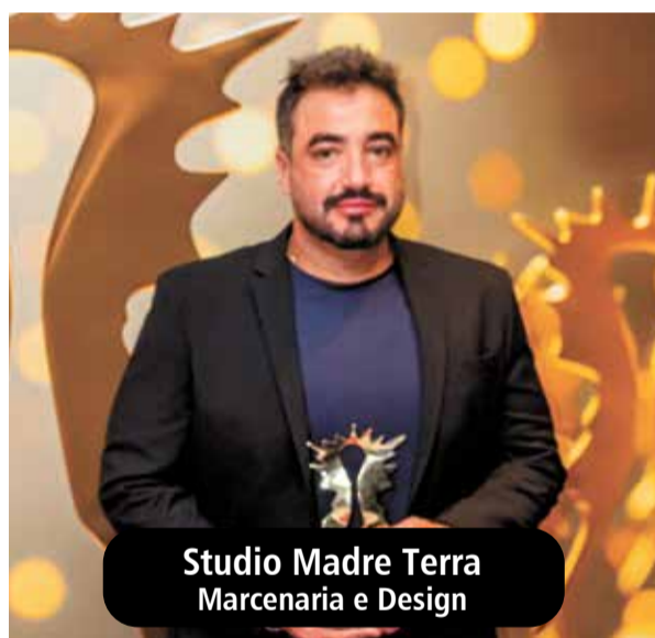
Studio Madre Terra Marcenaria e Design