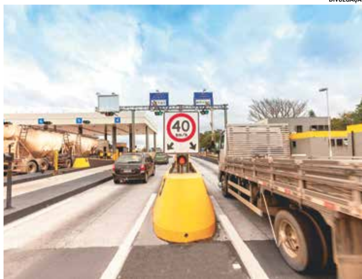
A tarifa para veículos de passeio passou de R$ 19,40 para R$ 20,30

Além de Indaiatuba, outras rodovias da região de Campinas também tiveram alterações nos valores. Ao todo, 17 praças de pedágio registraram aumento nas tarifas e cinco tiveram redução. A maior queda foi na Rodovia Adhemar Pereira de Barros (SP-340), em Jaguariúna, onde a tarifa