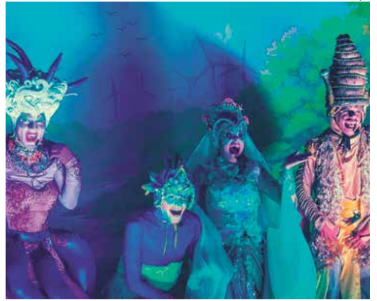
Teatro tem enredo que mescla fantasia e conscientização ambiental

Também já está confirmada a segunda edição do projeto Férias Eu Escolho Você, promovido pela Secretaria Municipal de Esportes. Embora as atividades comecem apenas em 13 de julho, já vale se programar para aproveitar