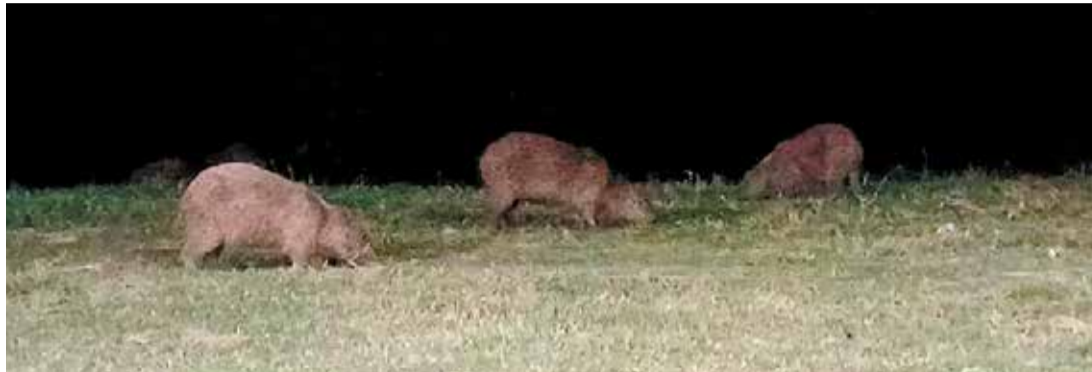
No Jardim União, pesquisa levará à análise laboratorial de ácaros presentes em seus terrenos

O trabalho atende, inclusive, à preocupação de moradores, que relataram ao Mais Expressão a presença frequente de capivaras no bairro. Segundo a Prefeitura, a pesquisa é considerada fundamental para o monitoramento dos carrapatos transmissores de zoonoses e servirá de base