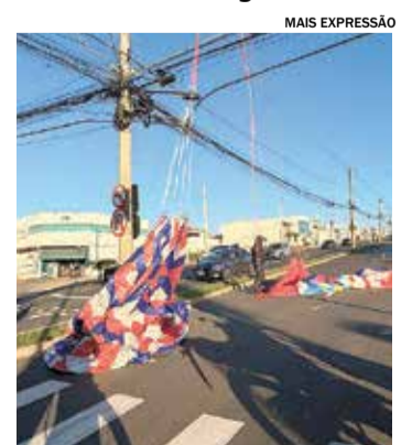
Balão foi encaminhado à delegacia

A corporação orienta que, ao avistar um balão, a população não tente recuperá-lo e acione imediatamente a Guarda Civil por meio do telefone de emergência 153.