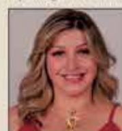
Branca Holística (19) 97821-9096