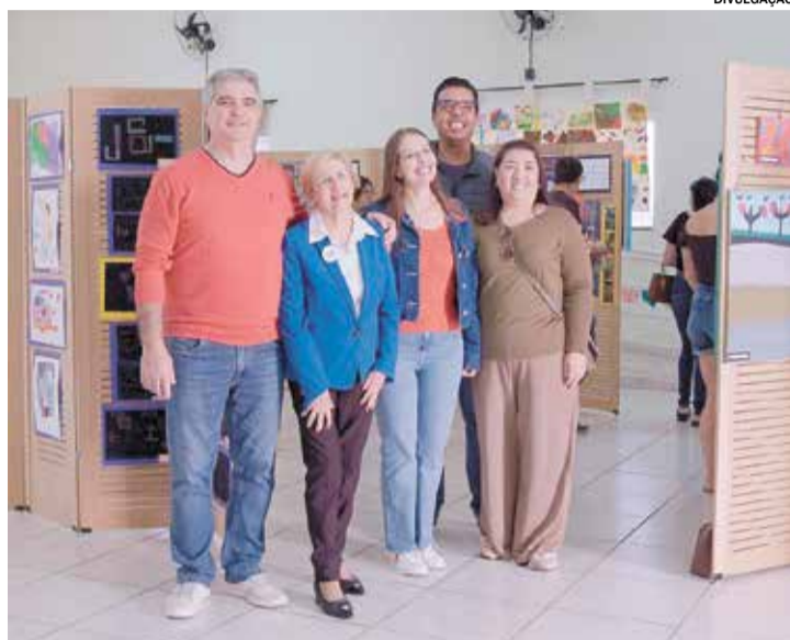
Durante o evento, os visitantes puderam conhecer produções