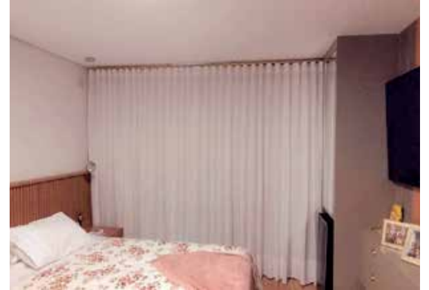
Precisando de cortinas, persianas, papel de parede, colchas, almofadas, tapetes, lembre-se sempre da Adelaide Decorações. Ligue e agende seu horário (19) 3894-4638 / (19) 99763-2829. Você vai adorar!