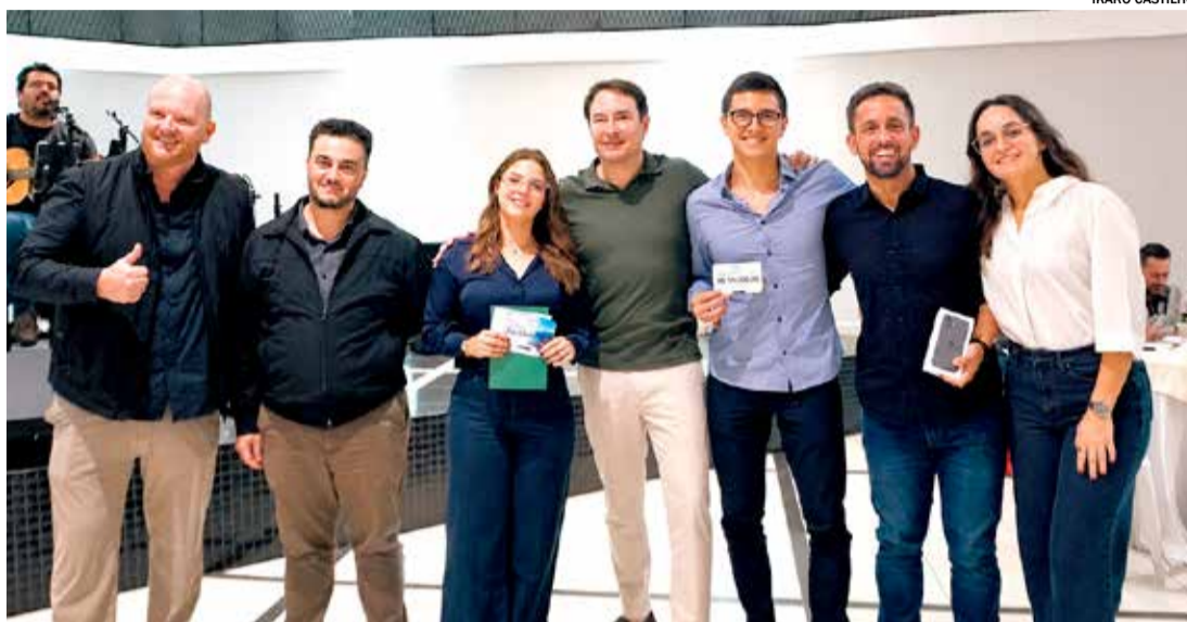
Comemoração exaltou resultados e o avanço de uma importante etapa para o crescimento de Cardeal

Durante o evento, foram homenageados os corretores que mais se destacaram