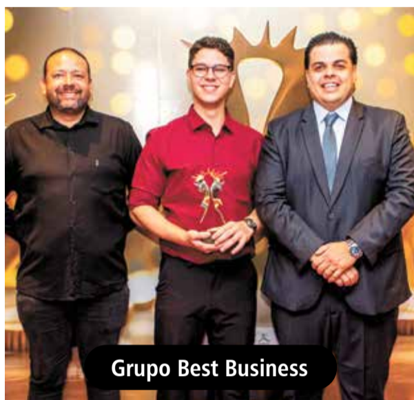
Grupo Best Business