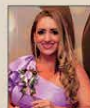
Hilda Vicente Fotógrafa