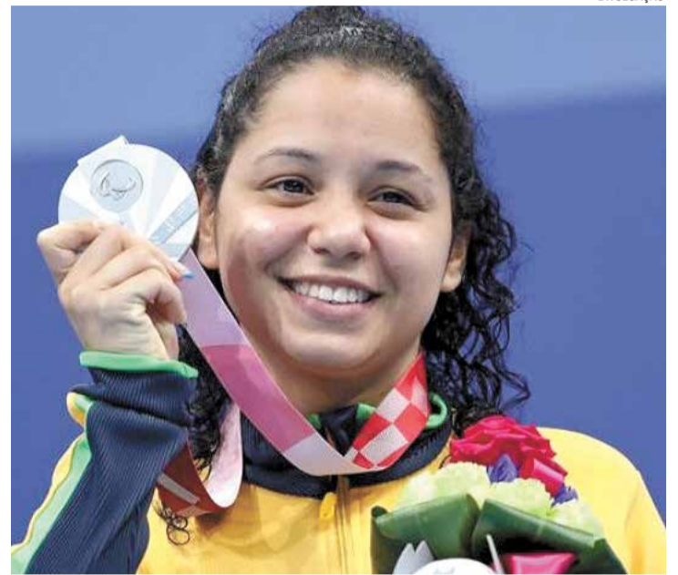
A nadadora Cecília Araújo trouxe medalhas do Parapan-Americano

Cecília Araújo é o principal nome da natação paralímpica indaiatubana. Foi prata nos 50m livre nos Jogos Paralímpicos de Paris 2024, levou quatro ouros no Parapan-Americano de 2023 e coleciona dezenas de medalhas internacionais na classe S8 (nadadores com falta de coordenação motora de baixo grau, transtorno do movimento de grau moderado nas pernas, com apenas um braço funcional ou com ausência de membros). A natação paralímpica, aliás, é a modalidade que mais projetou Indaiatuba internacionalmen-