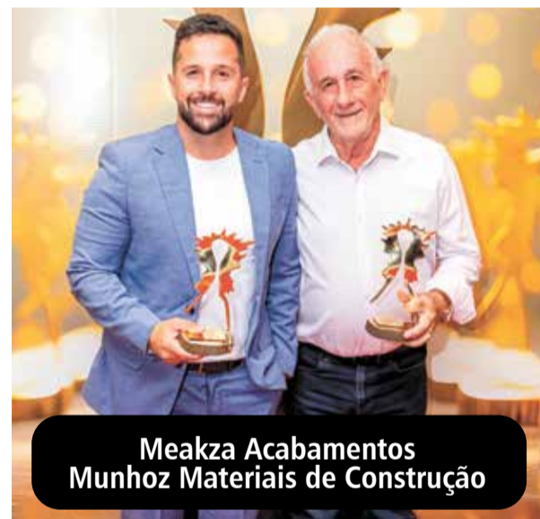
Meakza Acabamentos Munhoz Materiais de Construção