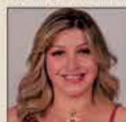
Branca Holística (19) 97821-9095