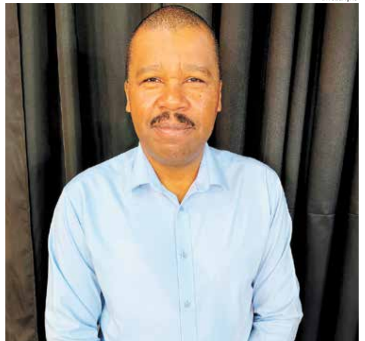
Sargento Gaba: quem fez procedimento online também deve comparecer

O atendimento é realizado no Ponto Cidadão e a equipe está preparada para prestar orientações e esclarecer dúvidas. "O jovem não pode deixar passar o prazo. Nossa equipe está à disposição para realizar o alistamento e garantir que todos estejam com sua situação regularizada."