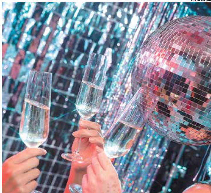
Os ingressos já estão à venda por R$ 40 no valor antecipado

Os ingressos já estão à venda por R$ 40 no valor antecipado. Quem deixar para comprar na bilheteria pagará R$ 50. Também é possível