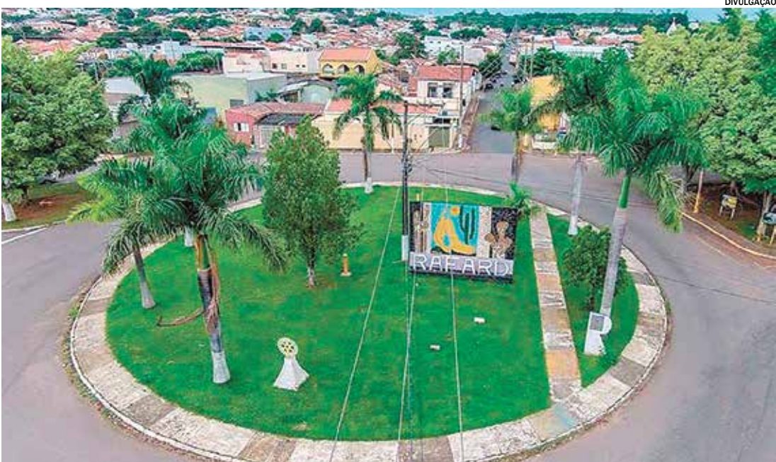
O plano também está disponível para servidores com salários abaixo do teto

O RPC atende à Lei Complementar nº 285/2021 e é obrigatório para municípios que mantêm Regime Próprio de Previdência Social (RPPS) e possuem servidores efetivos que recebem remuneração superior ao teto do Regime Geral de Previdência Social (RGPS), atualmente fixado em R$ 8.157,41 (valor de 2025). Com isso, os novos servidores com salários acima do teto terão suas aposentadorias limitadas ao valor do RGPS e poderão aderir ao plano complementar para