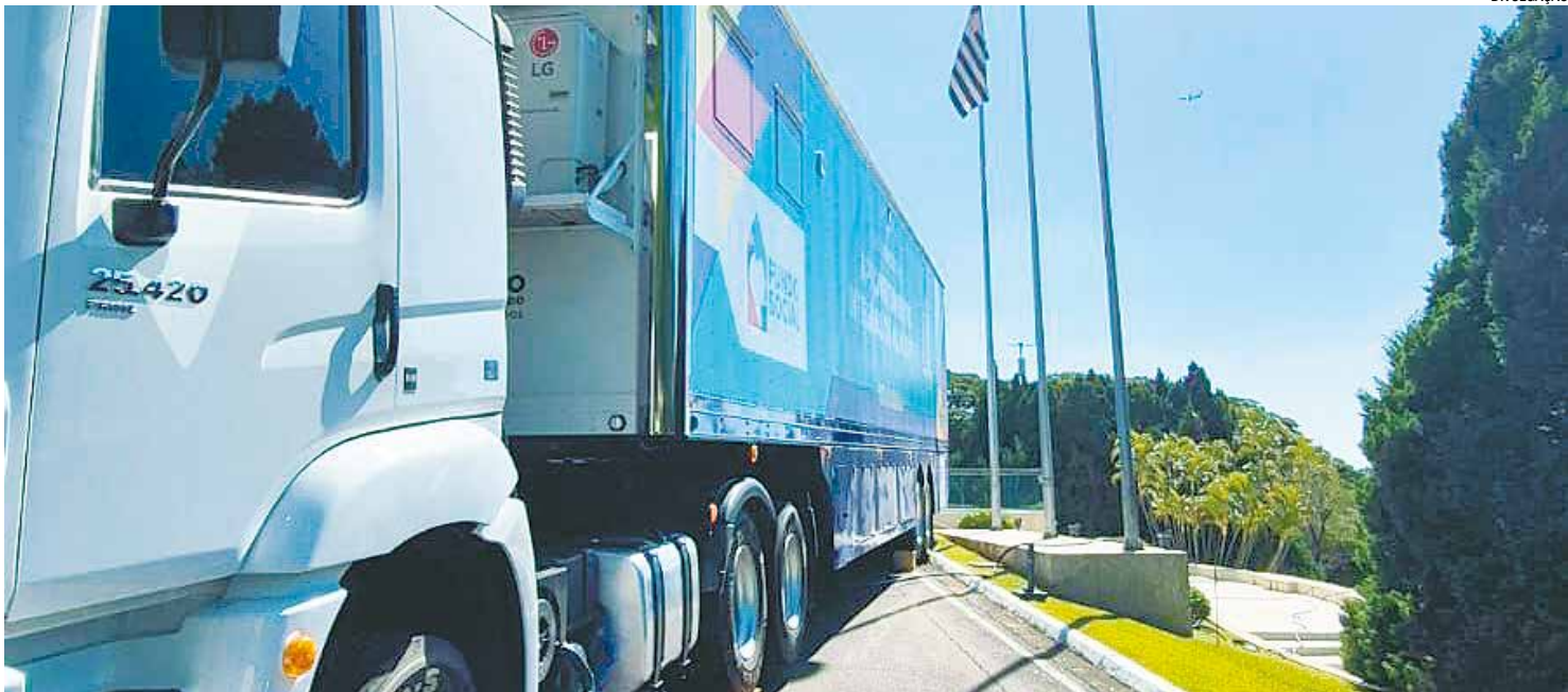
Elias Fausto foi anunciada como uma das primeiras cidades a receber o programa

Durante a cerimônia, foi apresentado o projeto Caminho da Capacitação, iniciativa do Fundo Social do Estado que levará cursos gratuitos de qualificação profissional, por meio de carretas-escola, a municípios com índices de vulnerabilidade social. Elias Fausto foi anunciada como uma das primeiras cidades a receber o programa, reforçando o compromisso da gestão municipal com