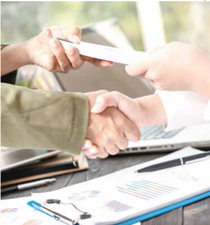
O contribuinte deve procurar o setor responsável na Prefeitura Municipal

Para participar, o contribuinte deve procurar o setor responsável na Prefeitura Municipal, munido de documentos pessoais e infor-