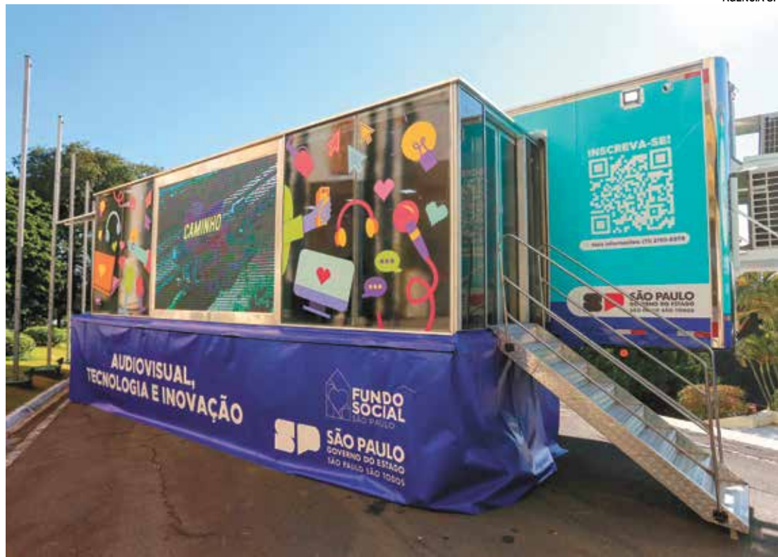
A ação vai usar carretas para profissionalizar a população de baixa renda do município

O Caminho da Capacitação levará cursos gratuitos de qualificação profissional em carretas-escola