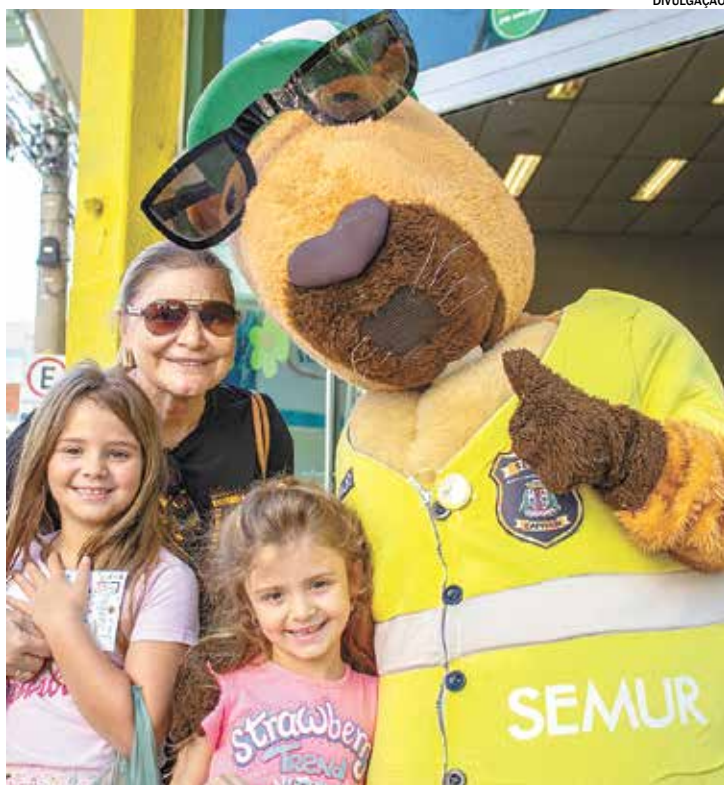
Maio Laranja combate o abuso e à exploração sexual de menores

Durante este mês, a cidade de Capivari promoveu ações de conscientização em duas frentes fundamentais: a proteção de crianças e adolescentes contra a violência e a segurança no trânsito. As iniciativas fazem parte das campanhas nacionais Maio Laranja e Maio Amarelo, que mobilizam a sociedade em torno de temas sensíveis e vitais.