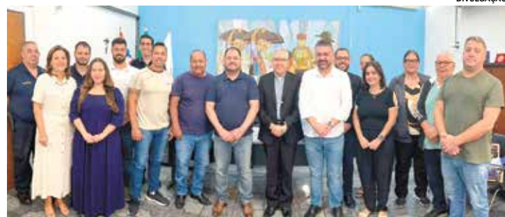
A ação será voltada às crianças em idade escolar do município

Durante a visita, foram discutidos diversos temas relacionados às áreas sociais, de saúde e educação. Entre as propostas apresentadas, destacou-se a sugestão de realização de um mutirão oftalmológico voltado às crianças em idade escolar do município.