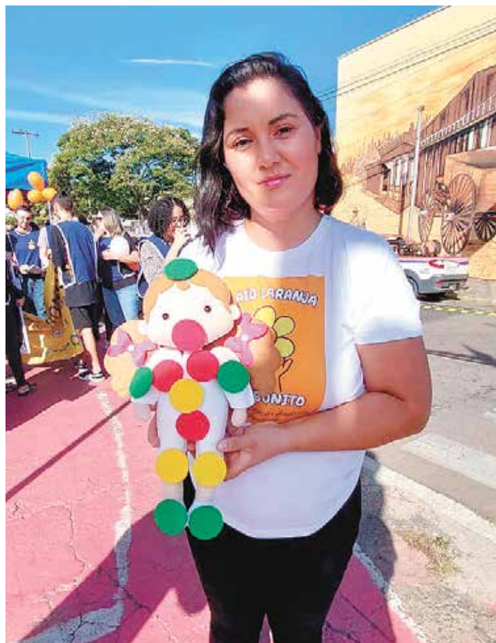
Um boneco com bolinhas verde exemplificou quais locais são permitidos

A ação faz parte da campanha de conscientização do Maio Laranja contra o abuso e a exploração