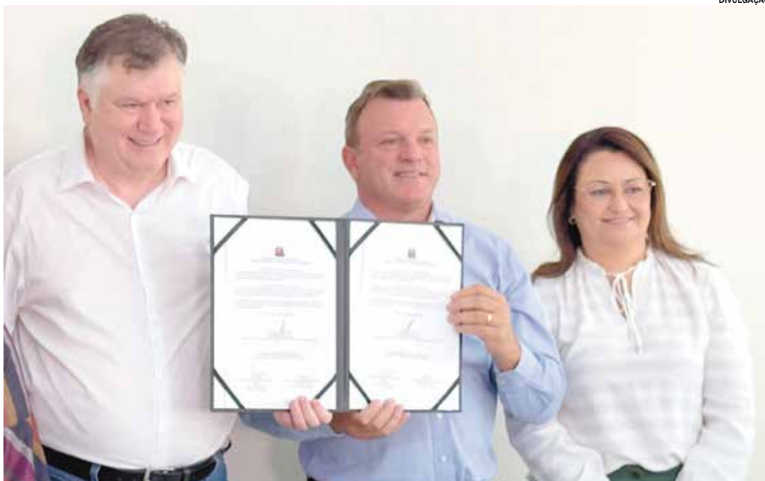
A visita também contou com a presença de autoridades locais

Durante a agenda em Elias Fausto, o secretário anunciou três importantes iniciativas para a cidade e região. A primeira é a abertura, em julho, das inscrições para o Curso de Libras, voltado à capacitação de servidores públicos no atendimento às pessoas com deficiência auditiva. A segunda ação é a