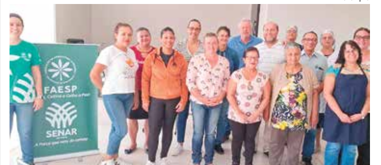
Mais informações sobre cursos na Casa da Agricultura ou Sec. Desenvolvimento

Para mais informações sobre os próximos cursos do SENAR e do Sindicato Rural, os interessados devem procurar a Casa da Agricultura de Rafard ou a Secretaria Municipal de Desenvolvimento.