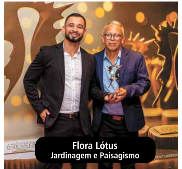
Flora Lótus Jardinagem e Paisagismo