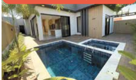
CA0597 – Villa Sapezal

Casa com 3 suítes, sala com pé-direito duplo, cozinha integrada, gourmet, piscina com hidro e 4 vagas. Venda: R$ 2.190.000,00 + encargos.