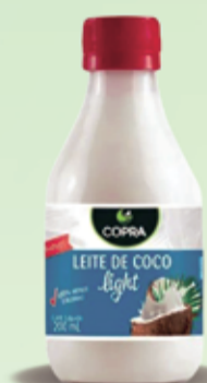
Leite de coco light