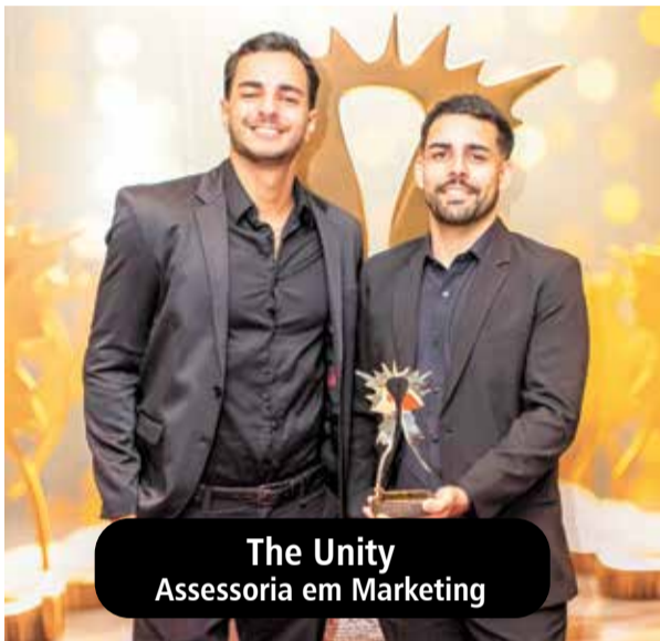
The Unity Assessoria em Marketing

Indaiatuba se prepara para uma das principais noites do calendário empresarial com a 20ª edição do Troféu Frutos de Indaiá, no dia 24 de outubro, a partir das 19h, no Clube 9 de Julho. Promovido pelo Grupo Mais Expressão, o evento vai reconhecer empresários que impulsionam a economia local e regional, reunindo lideranças, autoridades e convidados em uma celebração marcada por networking, homenagens e show da dupla Guilherme e Benuto, destaque do sertanejo nacional.