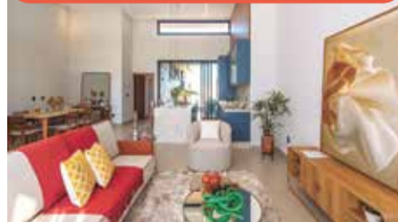
CA0590 – Cond. Dona Maria Cândida

Casa nova com 3 suítes, lavabo, sala integrada com pé-direito alto, cozinha gourmet, piscina, 4 vagas. Venda: R$ 1.900.000,00 + encargos.