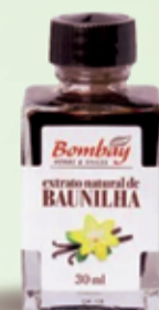
Extrato de baunilha