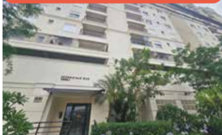
AP0217 – Essenciale Due

Apto com 2 dorms (1 suíte), sol da manhã, sala integrada e 2 vagas paralelas. Condomínio com lazer completo. Venda: R$ 800.000,00 + encargos.