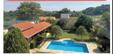
CH0044 - Terras de Itaici

Chácara com 1.000m 2 , sobrado com 2 suítes, salas com lareira, cozinha, gourmet com churrasqueira e forno, piscina, e poço caipira. Venda: R$ 2.100.000,00 + encargos.