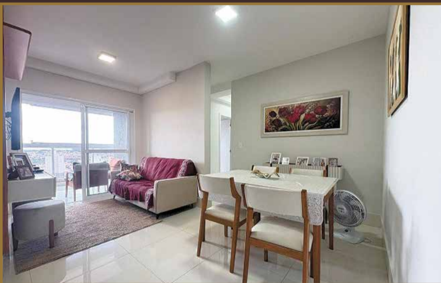
APARTAMENTO IMAGINE - JD. PAU PRETO ANDAR ALTO - MOBILIADO R$ 1.000.000,00