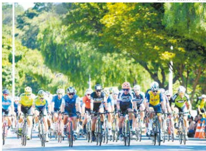
CICLISMO Cerca de 500 atletas participam da 74ª Prova Ciclística 1º de Maio em Indaiatuba Pág. A14