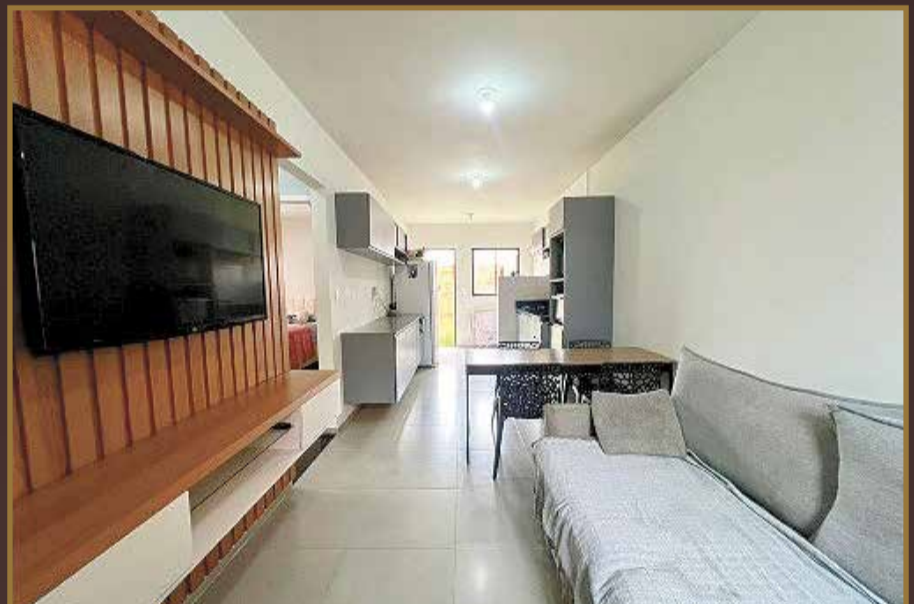
CASA SMART CITY R$ 365.000,00