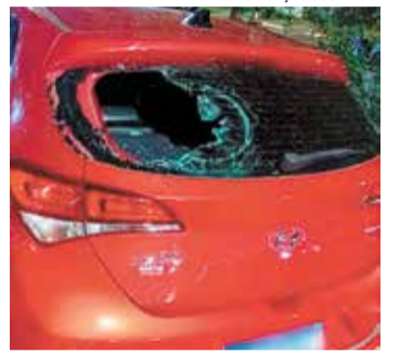
O carro da vítima foi danificado

Ele foi conduzido à delegacia, onde permaneceu preso em flagrante por violência doméstica.