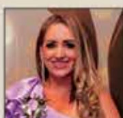
Hilda Vicente Fotógrafa