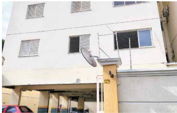
O imóvel permanecerá interditado até a apresentação de laudo

no prazo de 24 horas apontem as medidas que estão adotando para eliminar o risco de colapso do edifício, e também a avaliação dos riscos de desabamento e proteção dos imóveis do entorno, que também é uma preocupação da administração municipal. O imóvel