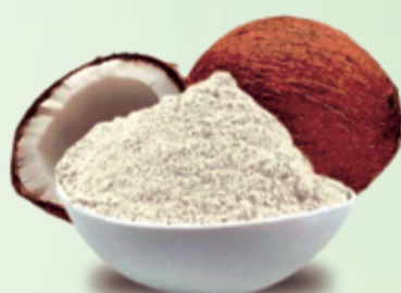
Farinha de coco