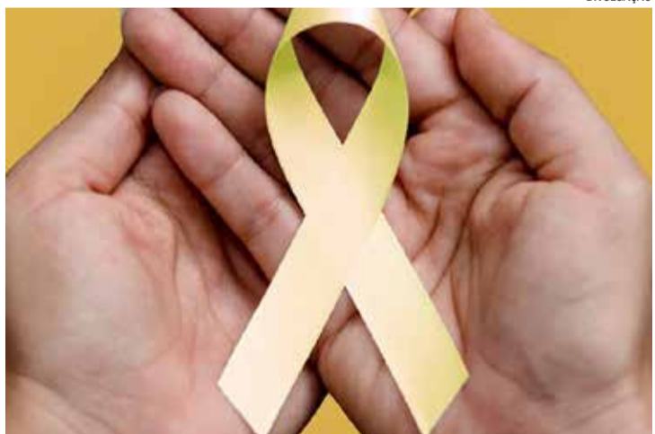
Maio Amarelo: evento gratuito reúne vivências educativas e lazer