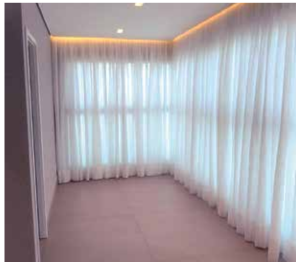
Precisando de cortinas, persianas, papel de parede, colchas, almofadas, tapetes, lembre-se sempre da Adelaide Decorações. Ligue e agende seu horário (19) 3894-4638 / (19) 99763-2829. Você vai adorar!