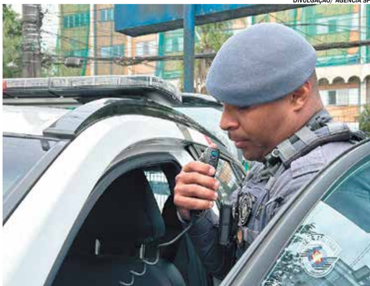
Operação é coordenada pelo Conselho Nacional dos Comandantes-Gerais

Coordenada pelo Conselho Nacional dos Comandantes-Gerais, a iniciativa integra o calendário mensal da corporação e tem como objetivo intensificar o policiamento ostensivo e preventivo, especialmente em regiões com maiores indicadores criminais, com foco nos crimes contra o patrimônio.