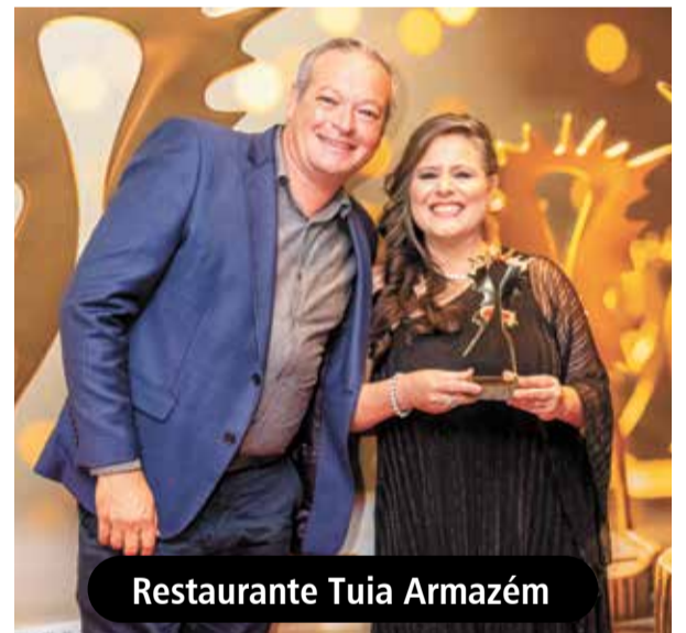
Restaurante Tuia Armazém