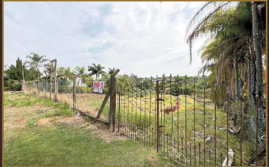
TERRENO - COND. MOSTEIRO DE ITAICI 250M 2 R$ 1.250.000,00