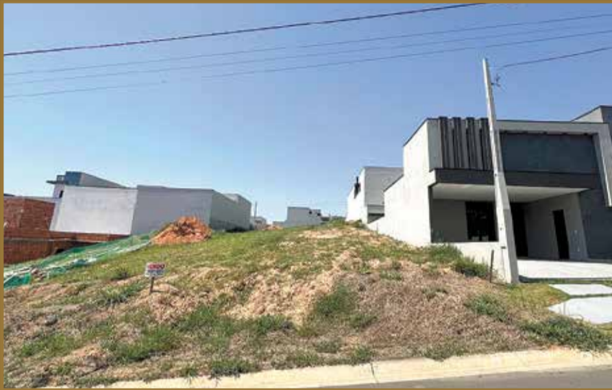
TERRENO PARK GRAN RESERVE INDAIATUBA SP TERRENO: 200 M 2 VALOR R$360.000,00 AVALIA CARRO COMO PARTE DE PAGAMENTO!