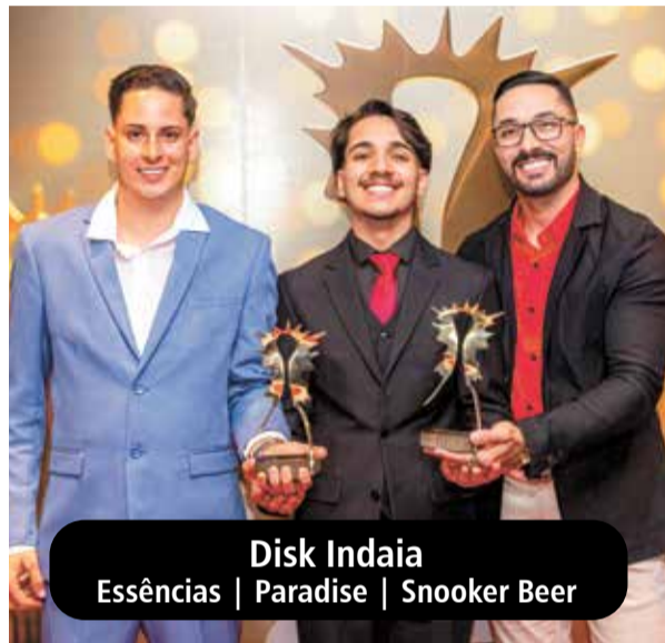
Disk Indaia Essências | Paradise | Snooker Beer