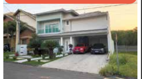
SO0200 – Cond. Villa Romana

Sobrado com 4 suítes, salas integradas, escritório, gourmet, piscina aquecida e 4 vagas. Venda: R$ 2.150.000,00 + encargos.