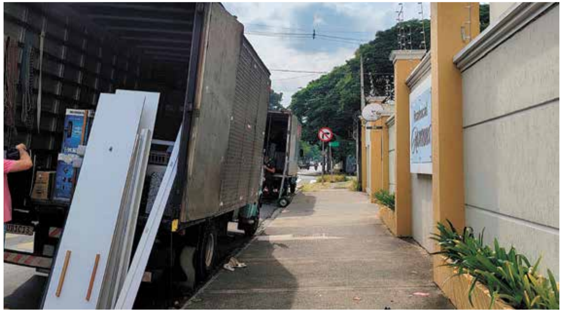
Durante a inspeção, equipes técnicas identificaram trincas e movimentações estruturais relevantes

Diante da gravidade do caso, foi solicitado à Associação de Moradores a apresentação de uma avaliação estrutural atualizada, e os responsáveis pela edificação foram notificados para que