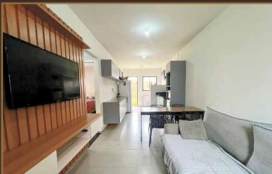
CASA SMART CITY R$ 365.000,00