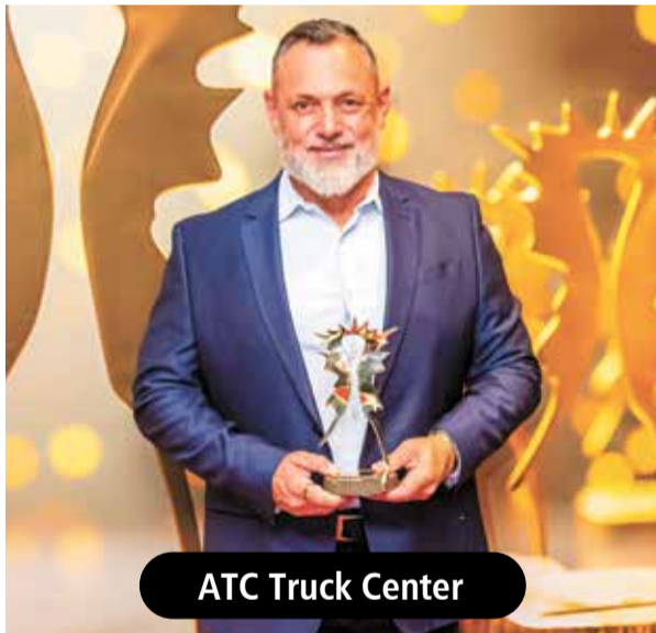
ATC Truck Center