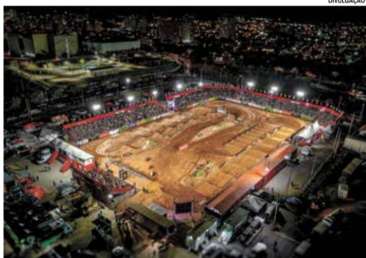
ARENA CROSS abre sua edição 2026 em Indaiatuba no próximo dia 16 de maio