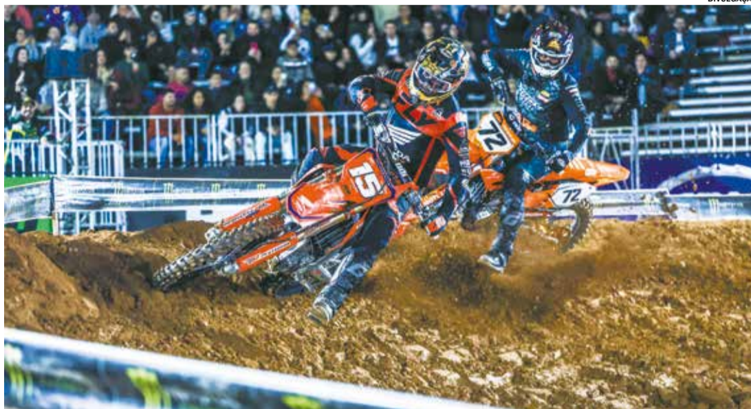
Nesta temporada, o Arena Cross mantém seu formato, com disputas em quatro diferentes categorias

Nesta temporada, o Arena Cross mantém seu formato, com disputas em quatro categorias: PRÓ (para pilotos acima dos 16 anos, com motos de até 450cc), AX2 (para competidores de 14 a