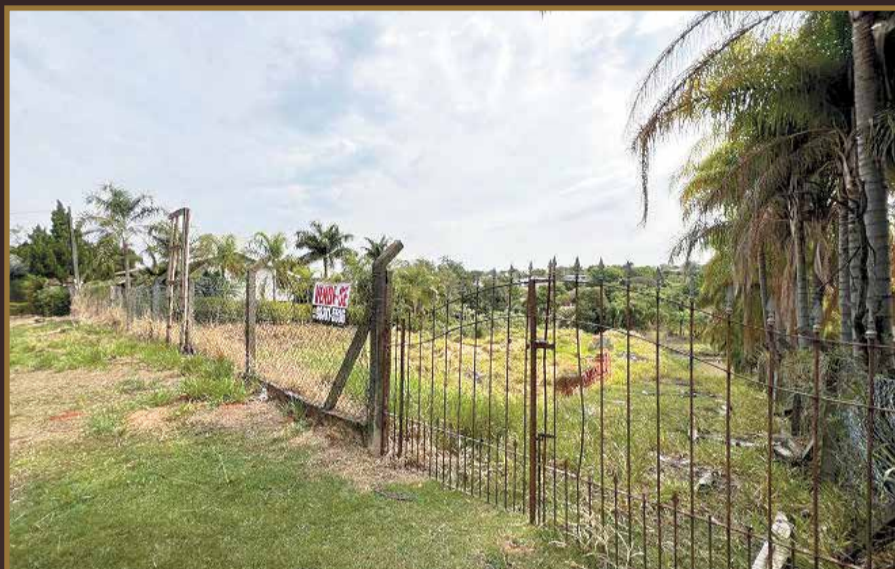
TERRENO - COND. MOSTEIRO DE ITAICI 250M 2 R$ 1.250.000,00