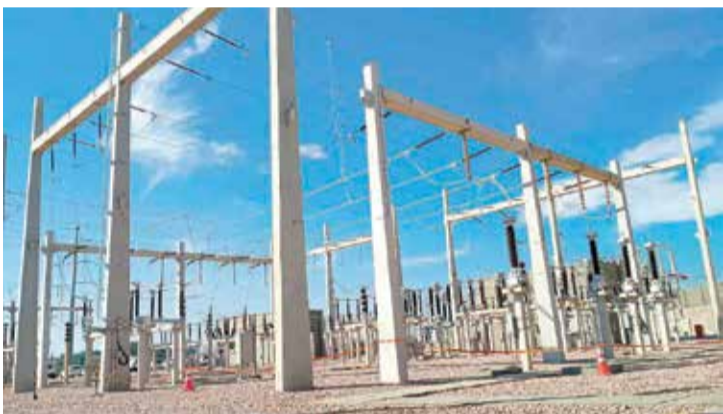
A estrutura amplia a capacidade de atendimento e evitar apagões