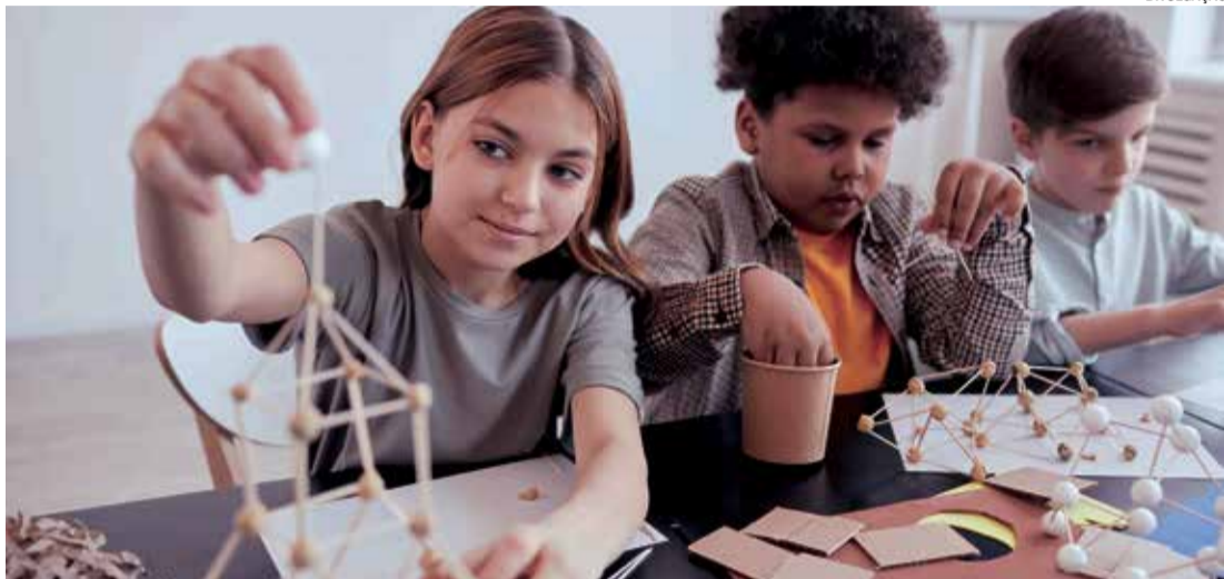
Movimento ganha forma no protagonismo e fortalecimento de habilidades essenciais no século XXI

Esse movimento também implica uma reorganização