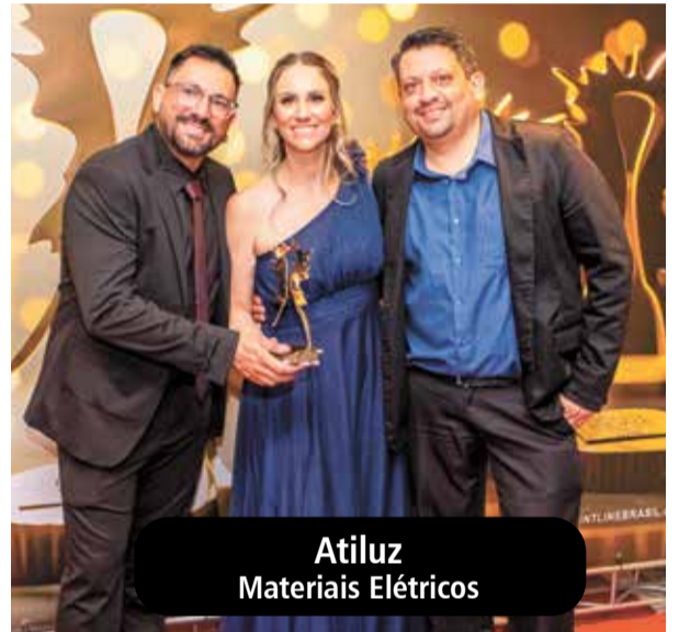
Atiluz Materiais Elétricos