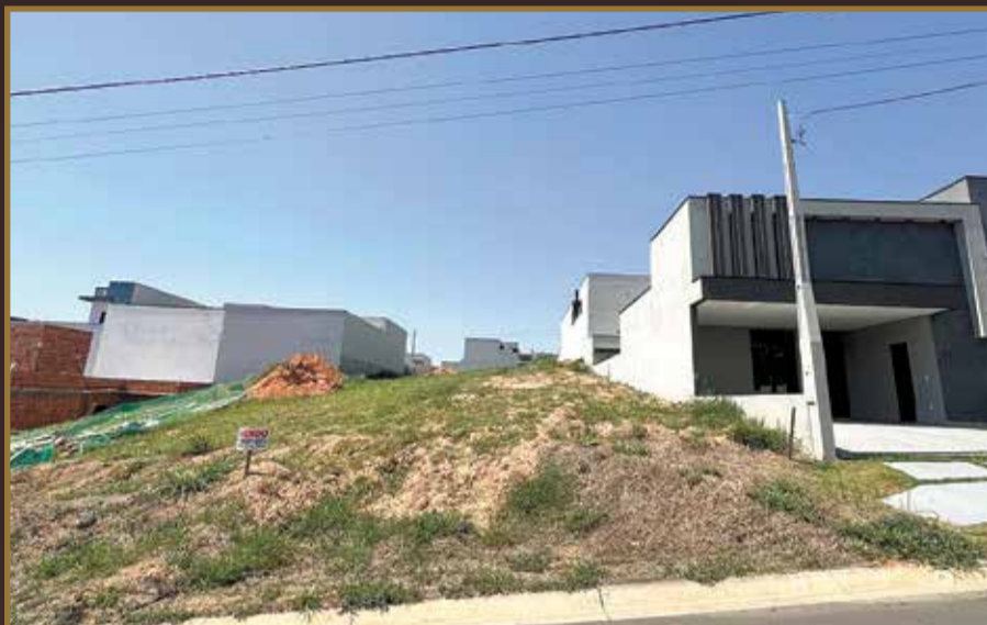
TERRENO PARK GRAN RESERVE INDAIATUBA SP TERRENO: 200 M 2 VALOR R$360.000,00 AVALIA CARRO COMO PARTE DE PAGAMENTO!