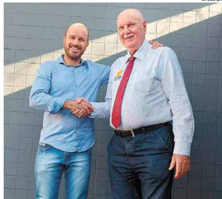
À frente da Prefeitura, criou a Guarda Municipal e a FIEC

Nos últimos anos, manteve atuação na área da comunicação como fundador da TV Sol. Foi também fundador e primeiro presidente da Associação dos Engenheiros,