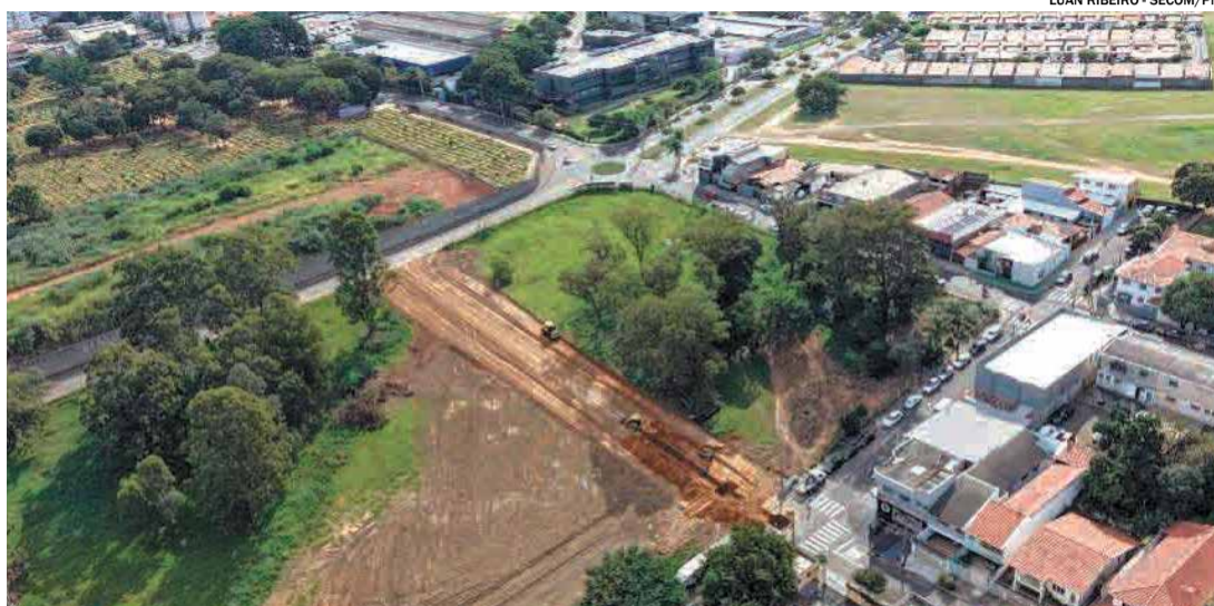
A obra tem previsão de conclusão em até 60 dias; também estão previstas a construção de calçadas

O projeto inclui serviços de terraplanagem, im-