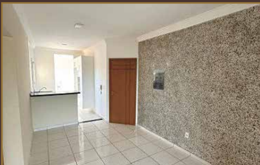
APARTAMENTO EDIFICIO VERSELLI - CENTRO INDAIATUBA 2 DORM. / 01 SUÍTE R$ 500.000,00