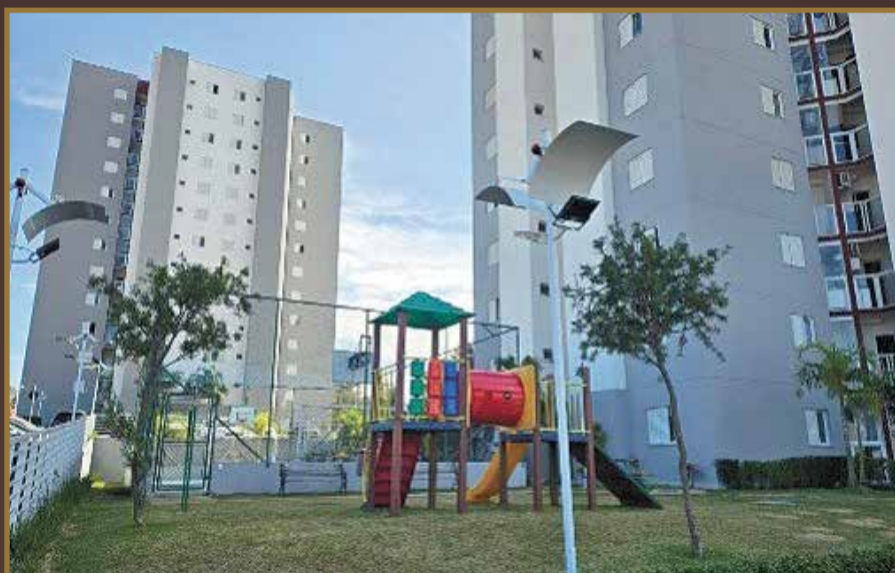
APARTAMENTO PLAZA BELA VISTA (LOCADO) R$ 490.000,00 ANDAR ALTO / 2 DORM. - 01 SUÍTE