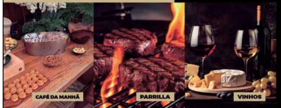
CAFÉ DA MANHÃ