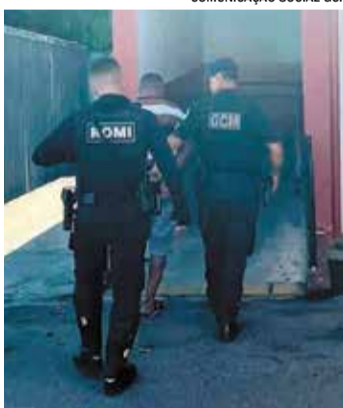
Autor foi encaminhado à Delegacia