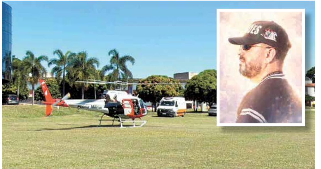
Policiais militares do Comando de Avaliação da Polícia Militar realizaram o transporte do coração para SP

Policiais militares do Comando de Aviação da Polícia Militar (CAVPM) realizaram, por volta das 13h30 deste domingo (19), o transporte de um coração para transplante em São Paulo. A equipe decolou de Indaiatuba, a bordo do