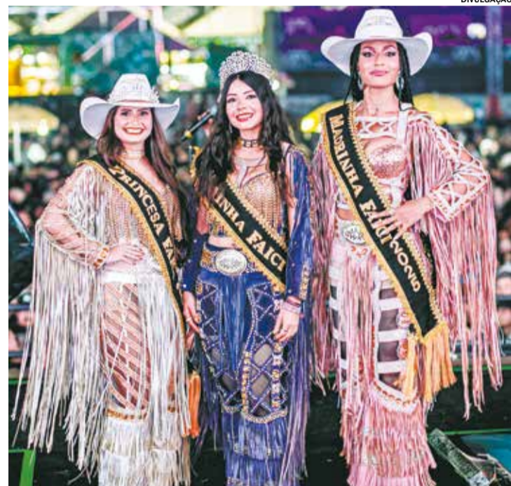
Corte 2025 passará faixa para Rainha, Princesa e Madrinha 2026

No palco, a FAICI 2026 abre os trabalhos no dia 7 de agosto com Natanzinho Lima, um dos destaques da edição passada do evento, e abertura de Samuel Sorocabinha, uma das grandes revelações do sertanejo na atualidade. No dia 8, três grandes shows: a dupla