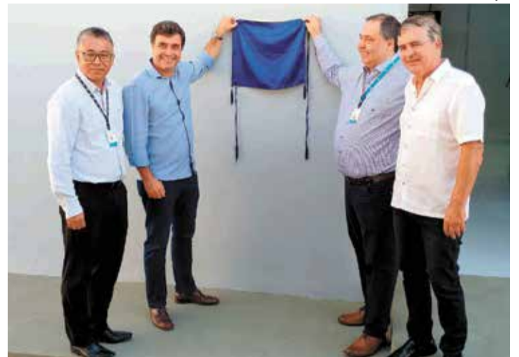
A nova subestação integra um plano de modernização da rede

Com capacidade inicial de 40 MVA (Megavolt-Ampère) e possibilidade de ampliação para 80 MVA, a subestação permite redistribuição estratégica das cargas e maior flexibilidade operacional do