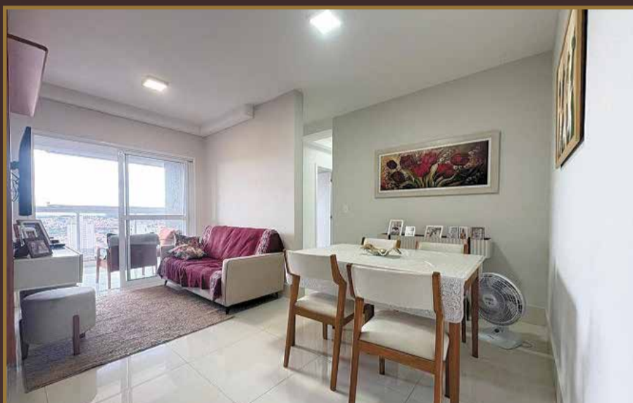
APARTAMENTO IMAGINE - JD. PAU PRETO ANDAR ALTO - MOBILIADO R$ 1.000.000,00