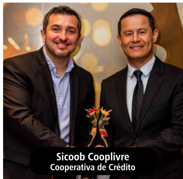
Sicoob Cooplivre Cooperativa de Crédito