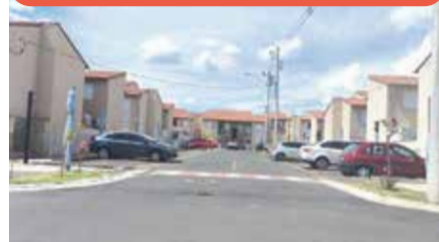
AP0274 - Edifício Graúna

Apto com 3 dormitórios (1 suíte), planejados, sala integrada, varanda, lavabo, cozinha planejada e 1 vaga. Condomínio com salão de festas. Venda: R$ 690.000,00 + encargos.