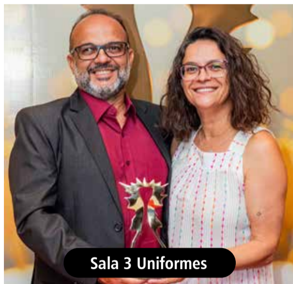
Sala 3 Uniformes