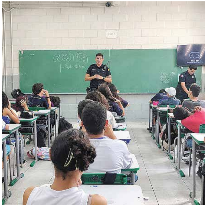
ALUNOS DA REDE MUNICIPAL participam de ações da GCI na Escola contra o bullying e a violência; iniciativa promove conscientização, respeito e segurança no ambiente escolar