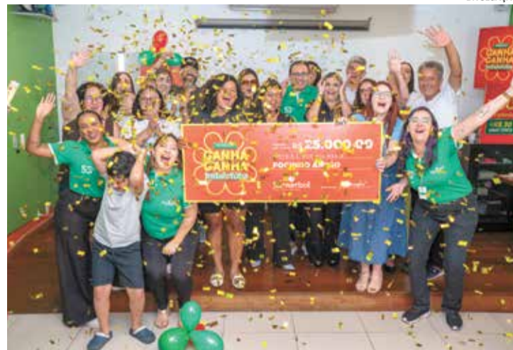
Focinho Amigo vence campanha que une pessoas e solidariedade

Ao todo, mais de 700 vales-compra e 1.849 Ecobags Colecionáveis foram distribuídas, totalizando R$ 300 mil em prêmios para os clientes, além de R$ 30 mil destinados às ONGs envolvidas na gincana, incentivando a participação do público e ampliando o alcance da ação. As entidades também tiveram espaço para apresentar seus projetos diretamente nas lojas, aproximando a população das