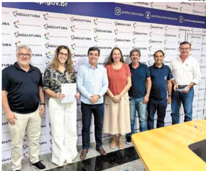
Assinatura do contrato marca início de programa de manejo

O município foi dividido em sete áreas para levantamento populacional das capivaras, monitoramento e pesquisas, avaliação sorológica dos animais e manejo reprodutivo por meio de procedimentos como vasectomia e laqueadura. O mapeamento contempla a