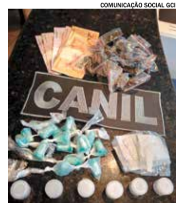
Menor confessou a venda das drogas

com acompanhamento da responsável legal, seguindo o Estatuto da Criança e do Adolescente (ECA).