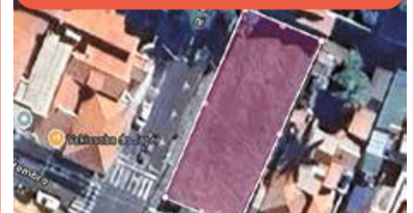
TE0283 - Centro

Terreno comercial de esquina, topografia em aclive, ideal para BTS, com alta visibilidade e fluxo em localização central. Locação: R$ 6.000,00 + encargos.