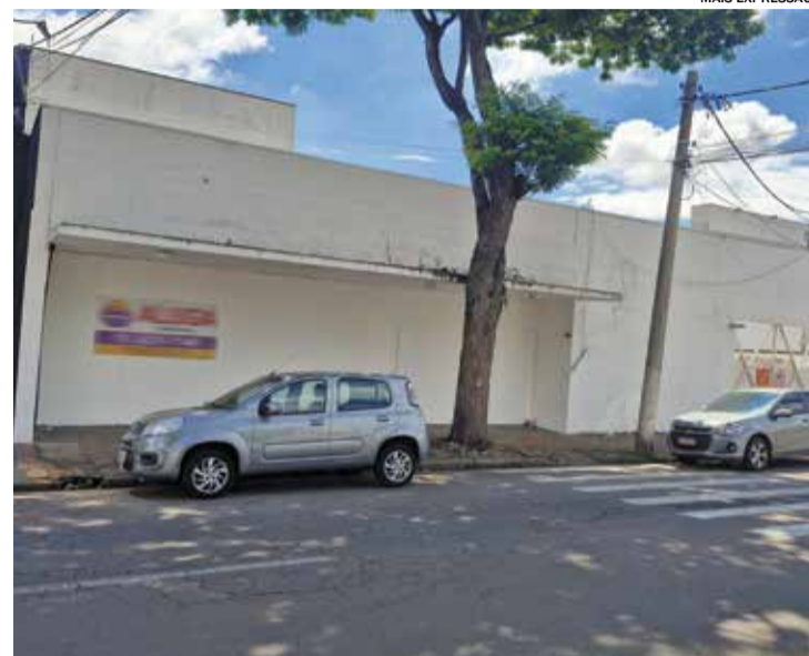
Prédio comercial na Avenida Presidente Vargas que abrigava agência