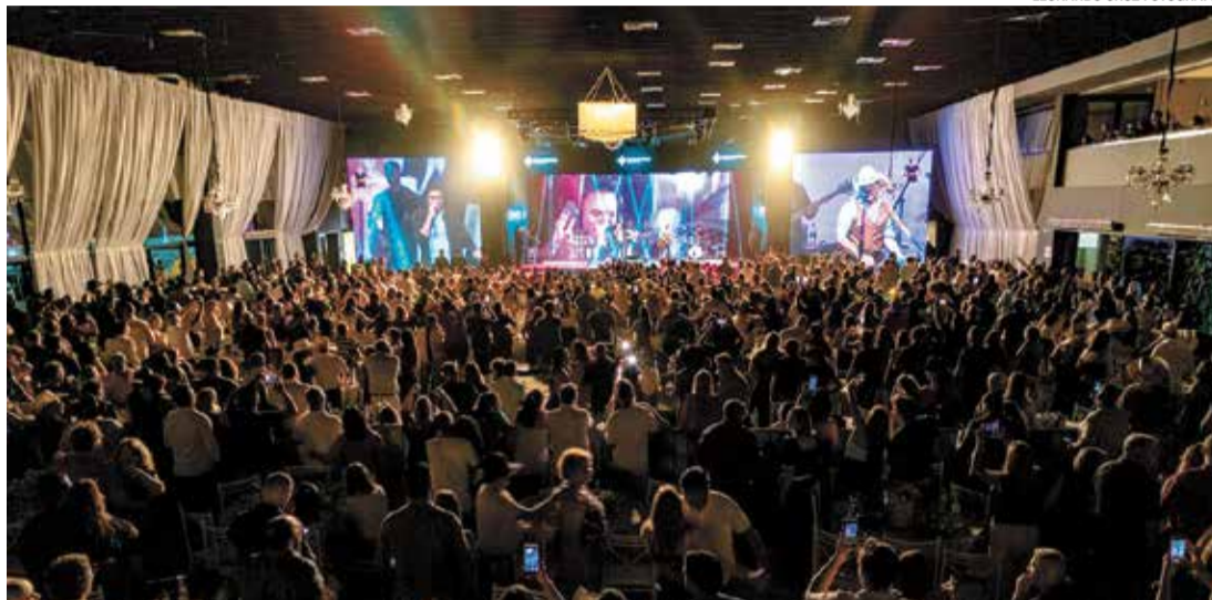
Boteco 3A Fest foi sucesso e já confirma Rock Fest e Costelada com grandes nomes em 2026