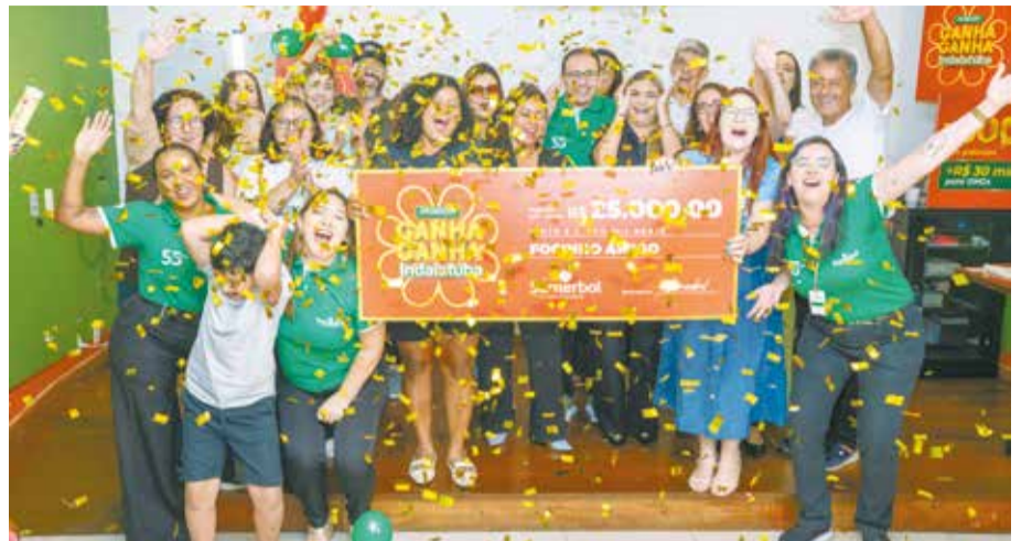
No último dia 02/04, o Sumerbol Supermercados premiou a ONG Focinho Amigo com R$ 25.000,00, em uma emocionante ação realizada em Indaiatuba. A iniciativa solidária mobilizou clientes, fortaleceu o trabalho da entidade e gerou um impacto social significativo na cidade. Parabéns ao Sumerbol pela sensibilidade, generosidade e por transformar solidariedade em ação concreta!!