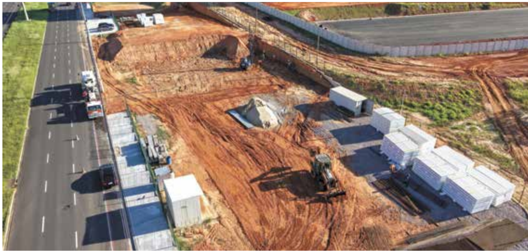
Projeto externo do prédio do Hospital Dia, que abrigará 26 leitos e a ampliação do Centro Cirúrgico

A proposta do novo hospital é atender a população da região do Parque dos Pássaros e bairros adjacentes, incluindo o Parque Campo Bonito, contribuindo para reduzir a demanda da UPA - Unidade de Pronto Atendimento do Jardim