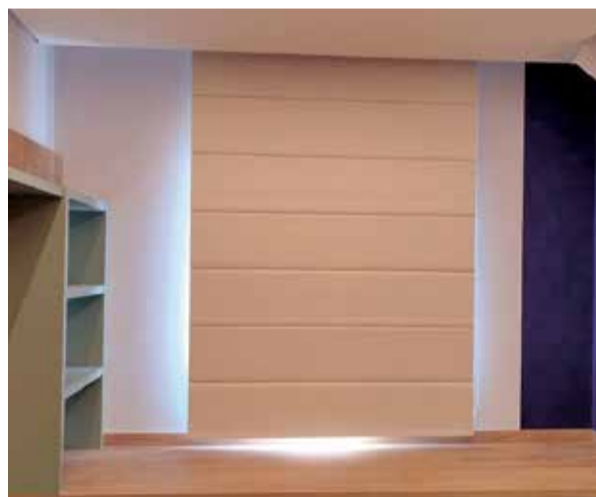
Precisando de cortinas, persianas, papel de parede, colchas, almofadas, tapetes, lembre-se sempre da Adelaide Decorações. Ligue e agende seu horário (19) 3894-4638 / (19) 99763-2829. Você vai adorar!