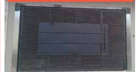
CA0885 - Jardim América

Casa térrea com 3 dormitórios (1 suíte), sala e cozinha integradas, pé direito alto, área gourmet, lavanderia e 2 vagas cobertas. Acabamento moderno. Venda: R$ 795.000,00 + encargos