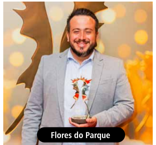
Flores do Parque