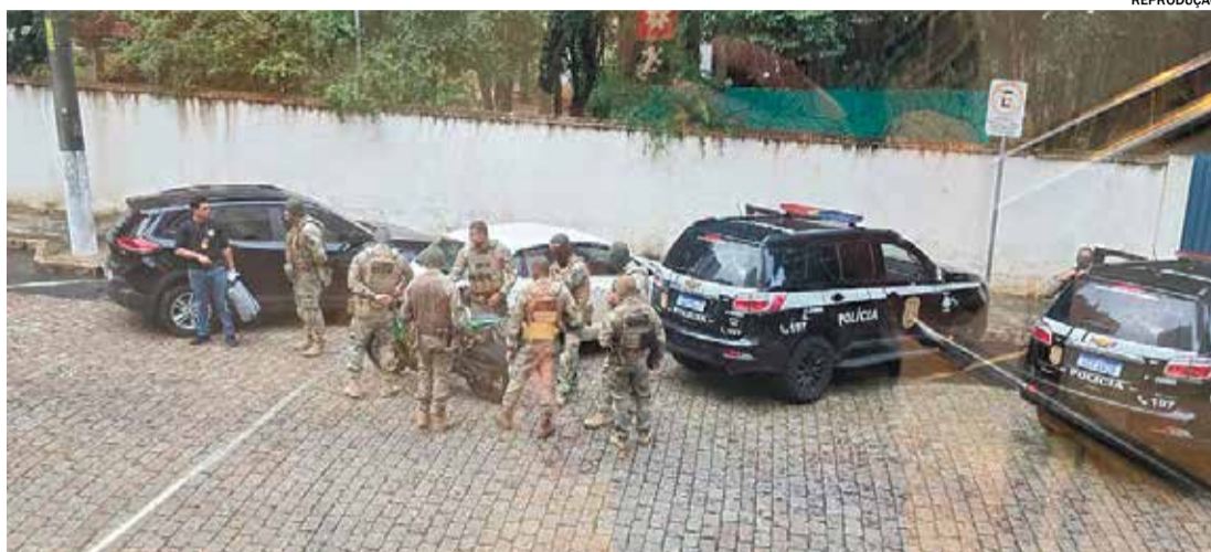
Agentes do Gaeco e da Polícia Civil cumprem mandado e efetuam a prisão durante a operação "Criptonita"

De acordo com as apurações, Spalone teria recebido valores para aquisição de criptomoedas e realização de