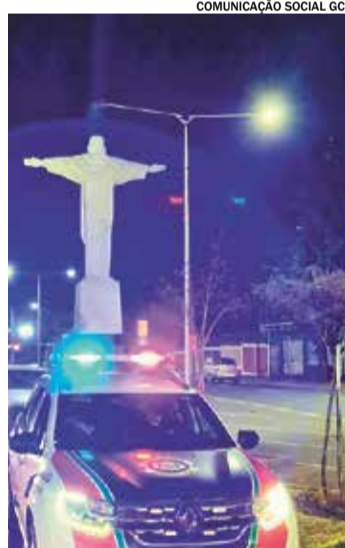
Moradora acionou a Guarda Civil

Um homem de 33 anos foi preso na noite de sábado (04) após invadir a residência da ex-companheira, no bairro Jardim Morada do Sol.