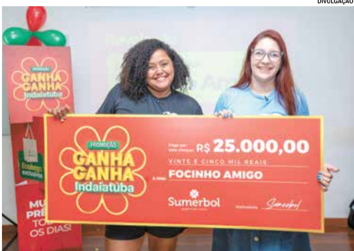
SOLIDARIEDADE Campanha do Sumerbol premia ONG Focinho Amigo em Indaiatuba Pág. A8

Gratuidade será válida aos domingos em todas as linhas do transporte coletivo do município. Pág. A5