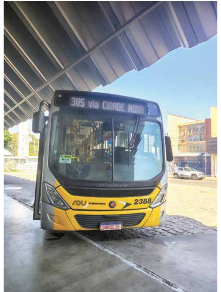
Para quem ainda não possui o cartão, a primeira via é gratuita

Para esclarecimento de dúvidas, os usuários podem entrar em contato com o Serviço de Atendimento ao Consumidor (SAC) da SOU Indaiatuba pelo WhatsApp 0800 460 0800 ou pelo telefone (19) 3518-7800.