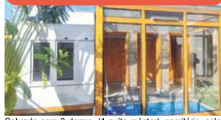
SO0193 - Jardim Mantova Residencial

Sobrado com 3 dorms. (1 suíte máster), escritório, salas integradas, cozinha planejada, área gourmet, piscina, sauna e 2 vagas cobertas. Condomínio fechado. Venda: R$ 1.490.000,00 + encargos.