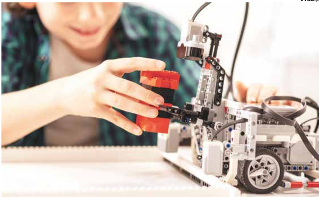
Iniciativa convida aluno a identificar obstáculo, analisar alternativas e tomar decisões fundamentadas

Nesses projetos, cada escolha faz diferença: como