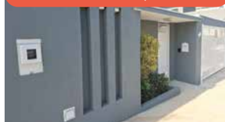
CA0784 - Jardim Esplanada

CA0784 - Jardim Esplanada, Indaiatuba/SP: Casa com 3 suítes, salas integradas, escritório, planejados, cozinha equipada, área gourmet, ar-condicionado e 4 vagas (2 cobertas). Venda: R$ 1.400.000,00 + encargos.