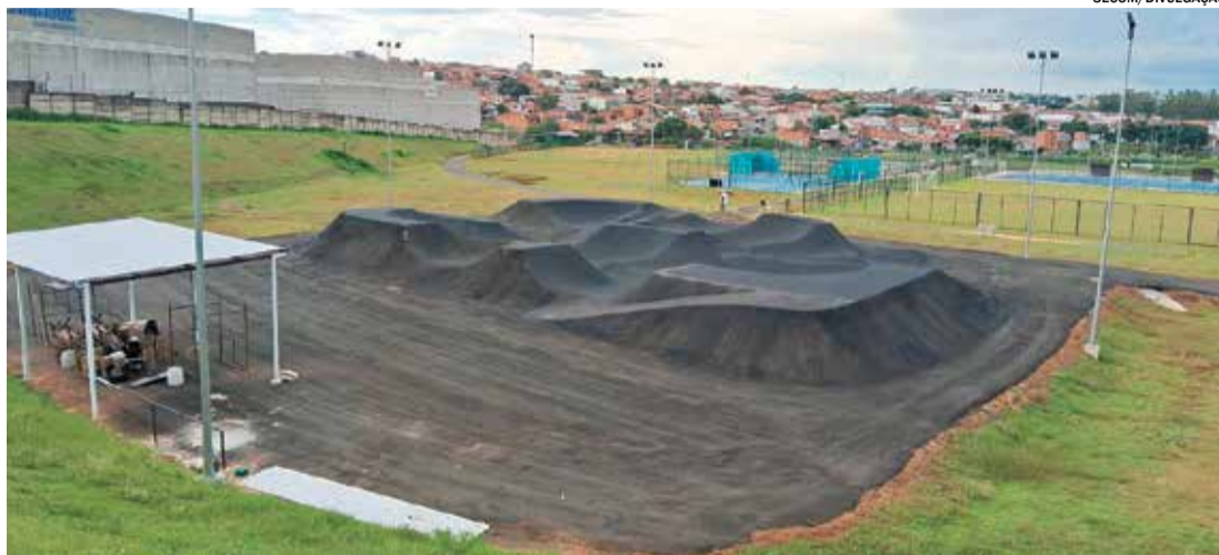
Pista de Pump Track está na fase final de execução e já ganha forma para receber atletas e população

A abertura oficial está prevista para as 11h. A programação inclui amistoso de futebol americano entre as equipes Indaiatuba Alpacas