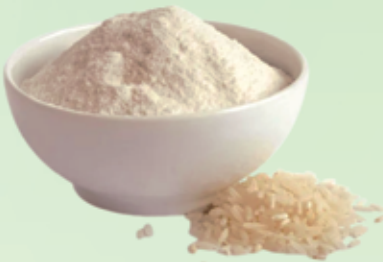
Farinha de arroz