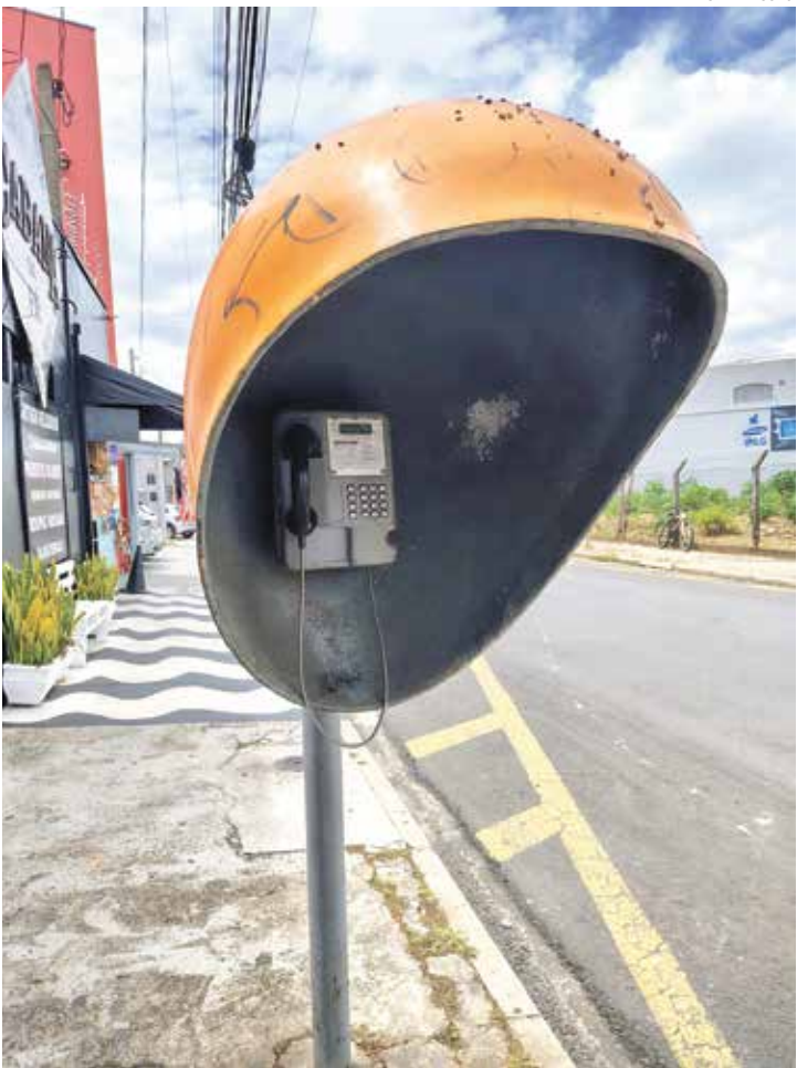
Orelhões, essenciais nos anos 70 a 2000, estão com dias contados

Cidade ainda mantém 76 telefones públicos; operação encerra concessões da telefonia fixa