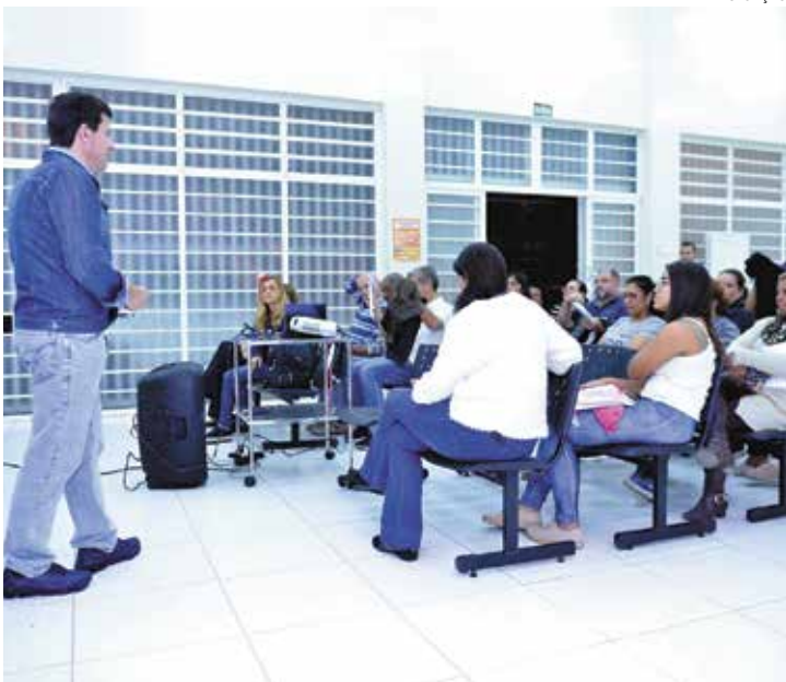
Iniciativa faz parte das ações de promoção e prevenção da saúde