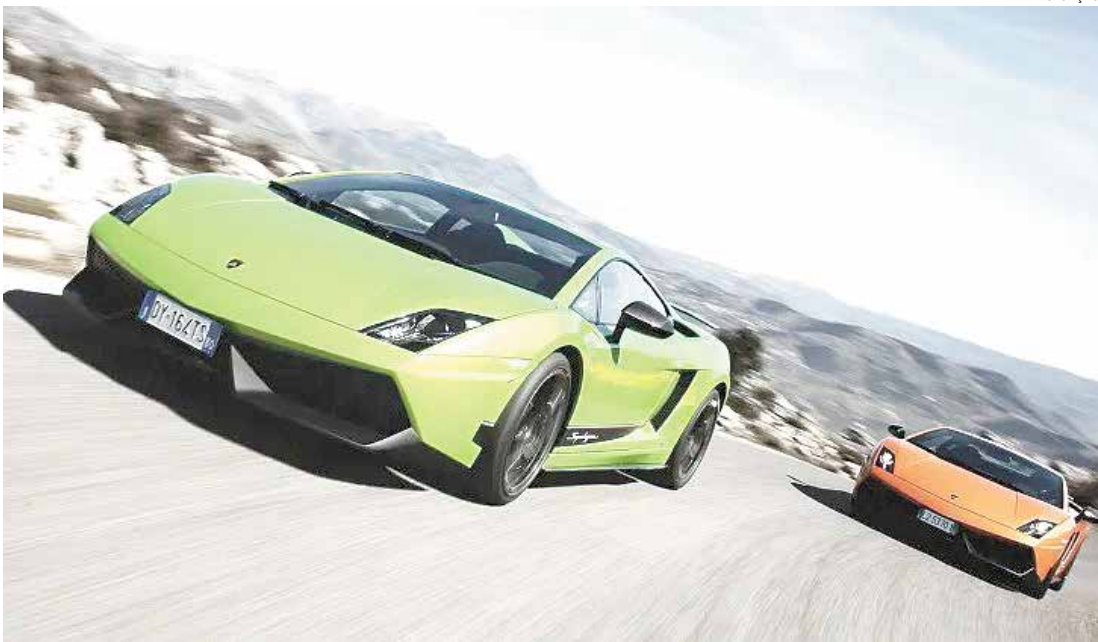
Lamborghini Gallardo Coupé Superleggera custa R$ 1.464.810, valor estipulado pela tabela FIPE

O segundo veículo registrado em Indaiatuba na