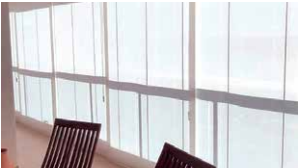
Precisando de cortinas, persianas, papel de parede, colchas, almofadas, tapetes e carpetes, lembre-se sempre da Adelaide Decorações. Ligue já e agende seu horário (19) 3894-4638 / (19) 99763-2829. Você vai adorar!