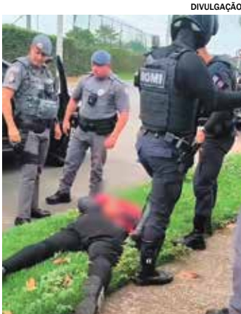
Ação integrada levou à prisão

lizou e abordou o carro no bairro de Perus. O suspeito detido em Indaiatuba permaneceu preso em flagrante. Os outros dois envolvidos foram apresentados no 33º Distrito Policial de Pirituba. A motocicleta furtada foi recuperada e devolvida ao proprietário.