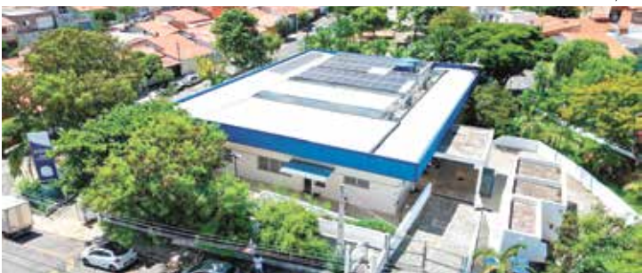
Obra é executada com recursos próprios e terá custo de R$ 280 mil

dezembro e inclui reparos na cobertura e na impermeabilização das lajes, substituição de janelas, ajustes na parte elétrica e reparos nas instalações hidráulicas, além de pintura interna e externa. Também serão realizadas manutenções nas calhas e forros danificados, manutenção de alambrados e correção do mapa tátil para melhorar a acessibilidade dos usuários.