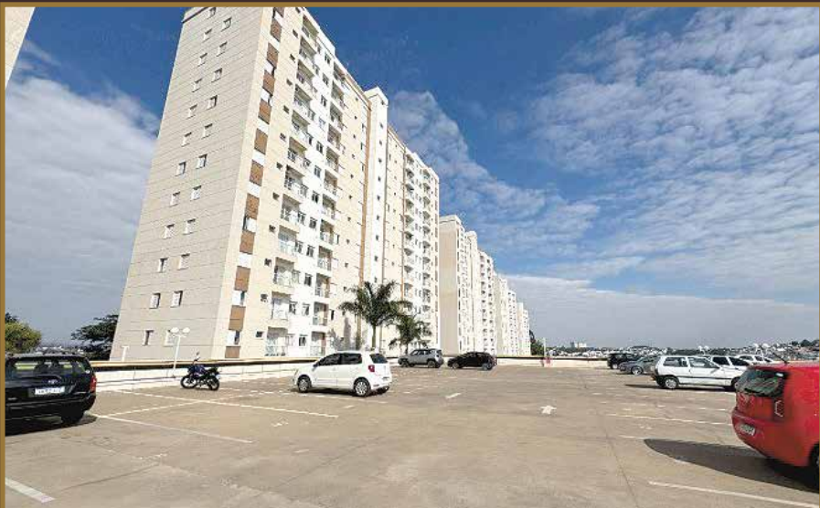
APARTAMENTO VILLA HELVETIA 2 VAGAS GARAGEM R$ 390.000,00