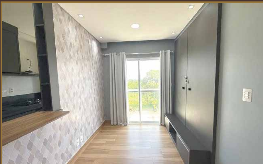
APARTAMENTO VILLA HELVETIA C/PLANEJADOS / 2 VAGAS DE GARAGEM R$ 480.000,00