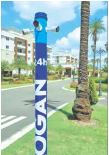
Logan utiliza totem inteligente de monitoramento integrado

tor, que passam a oferecer soluções completas baseadas na integração entre equipes treinadas e monitoramento tecnológico. Saiba mais no Instagram @loganindaiatuba.