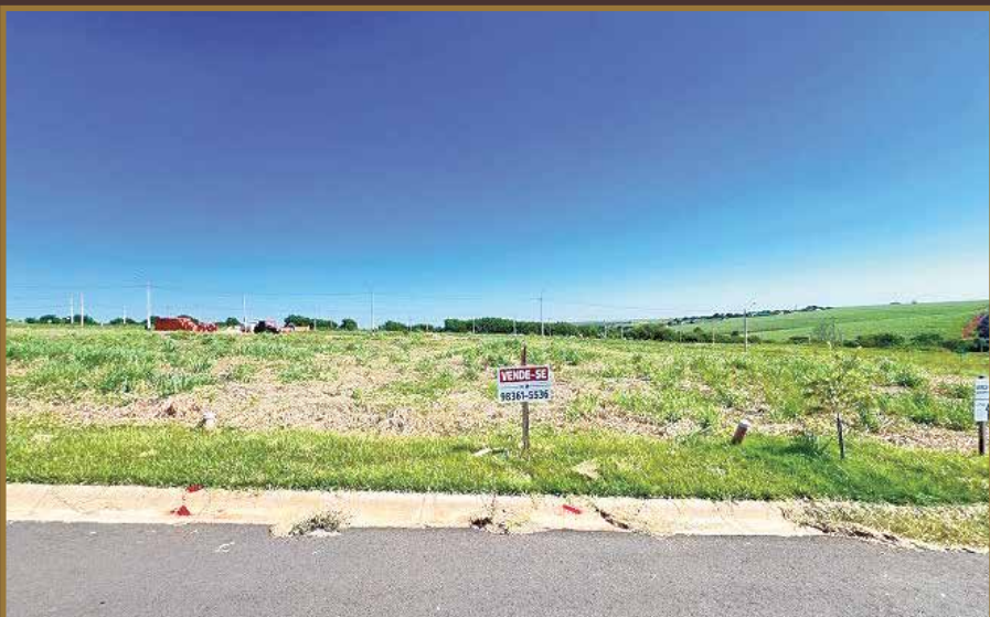
TERRENO CARDEAL - RESIDENCIAL SPORT LÍRIOS DOS VALES R$ 145.000,00

Unidade Vendas R. Treze de Maio, 1605 - Centro ☎ (19) 3370-1426 | ☎ (19) 98361-5536