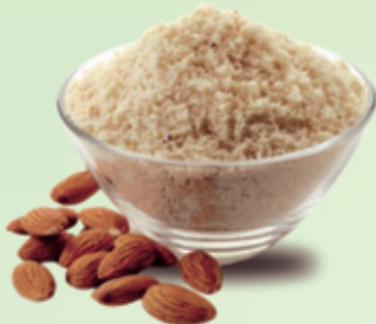
Farinha de amêndoa