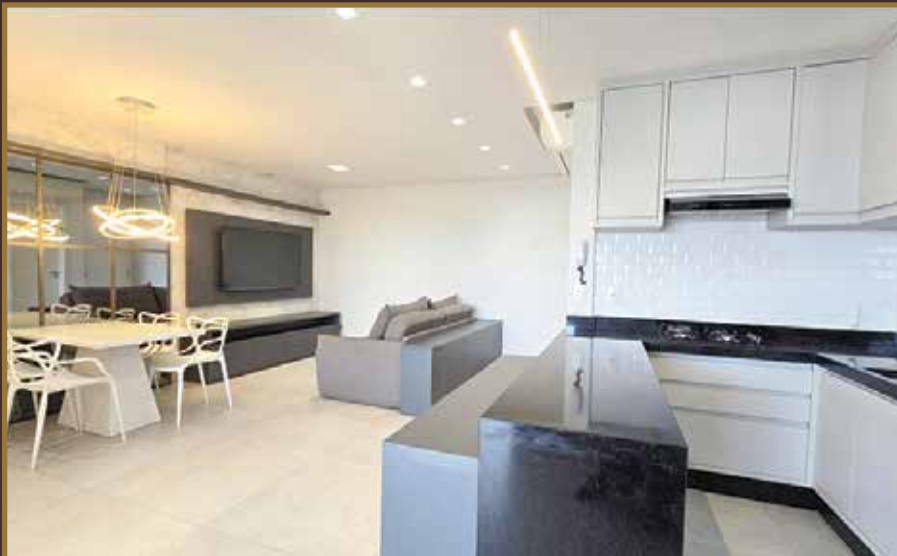
APARTAMENTO - THE PARK VIEW (MOBILIADO) ANDAR ALTO / FRENTE AO PARQUE ECOLÓGICO R$ 1.300.000