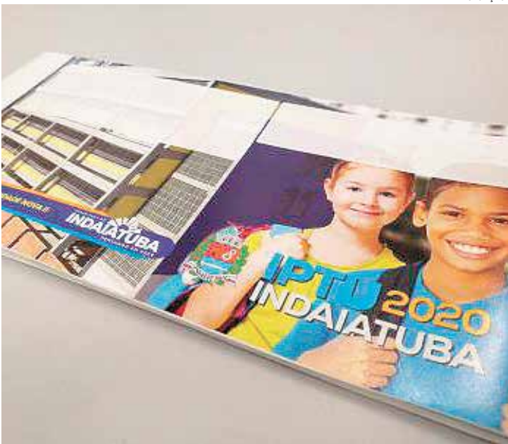
Pagamento do IPTU deve ser realizado nos bancos credenciados

Após o vencimento, o contribuinte deverá acessar o link www.indaiatuba.sp.gov.br/fazenda/rendas-imobiliarias/carne-iptu/ para atualização da guia de pagamento com os acréscimos legais. O prazo final para quitação do imposto é 29 de dezembro. Após essa data, os débitos serão inscritos em Dívida Ativa, com os devidos acréscimos legais e correção pela Ufesp (Unidade Fiscal do Estado de São Paulo).