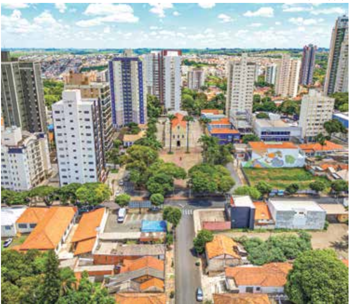
Reorganizar e revitalizar viária é principal tarefa da nova secretaria

Programa A nova pasta contará com identidade visual própria, novos agentes e viaturas. Também será criado o Conselho Municipal de Mobilidade Urbana, com participação do poder público e Sociedade Civil, com intuito de fortalecer o diálogo e a construção conjunta das políticas. O Demutran passa a atender por Diretoria de Trânsito e a sede da Secretaria de Mobilidade Urbana será no prédio onde fica o Departamento de Transporte, que segue em reforma. Os agentes de trânsito já estão sob novo comando. No total, entre administrativo, agentes e operacionais, a pasta conta com 38 servidores. A reforma deve contemplar a criação do CIMOB - Centro Integrado de Mobilidade, espaço onde a Prefeitura irá acompanhar o trânsito, transporte público e os principais pontos da cidade, utilizando tecnologia.