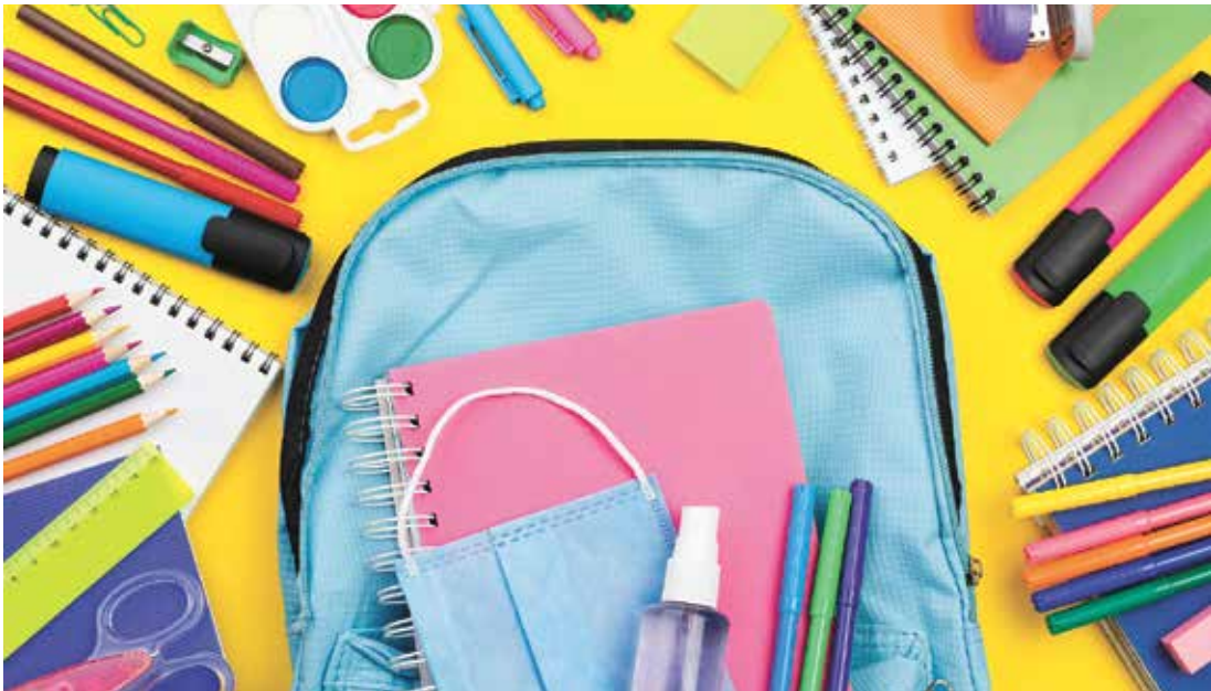
Crianças estão mais suscetíveis a produtos com personagens e logotipos e acessórios licenciados

Para dúvidas ou mais informações o telefone do Procon Indaiatuba é (19) 3816-9254. O consumidor também pode entrar em contato pelo e-mail: juridico.procon@indaiatuba.sp.gov.br . Ou presencialmente, das 8h às 17h, de segunda a sexta-feira no Ponto Cidadão, localizado na rua Vinte e Quatro de Maio, 1670.