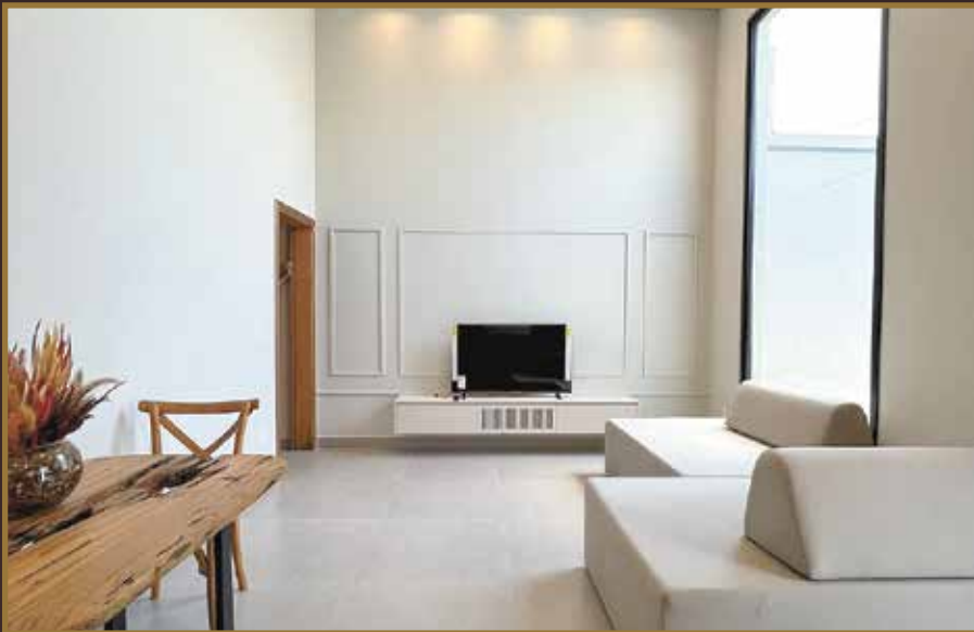
CASA - JD. BOM SUCESSO (NOVA) (MOBILIADA) - R$ 720.000,00