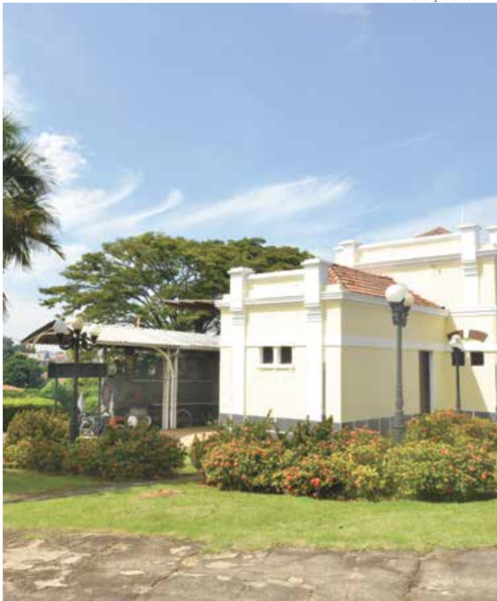
Museu Ferroviário recebe evento gratuito no domingo, dia 25

No campo literário, o projeto Adote um Livro permitirá