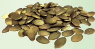
Semente de abóbora