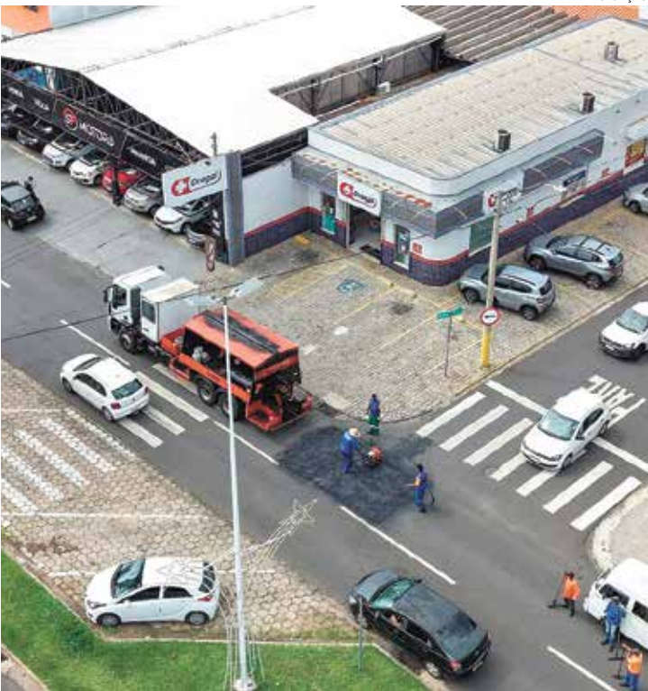
Em 2025, Operação Tapa-Buraco atendeu 1.450 ruas da cidade

Em 2025 a Operação Tapa-Buraco atendeu 1.450 ruas da cidade. Em média, a Operação utiliza 10 toneladas de massa asfáltica por dia,