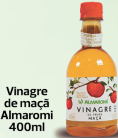
Vinagre de maçã Almaromi 400ml