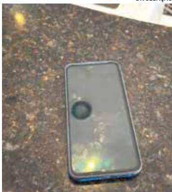
Aparelho foi devolvido à vítima

Na última quarta-feira, dia 22, a Guarda Civil foi acionada até o Terminal Rodoviário, onde um homem com deficiência visual foi vítima de roubo. Segundo informações, no momento em que a vítima utilizava o telefone celular para solicitar um transporte por aplicativo, o suspeito se aproximou, arrancou o aparelho de suas mãos e fugiu a pé em direção à Rua dos Indaiás. Após o crime, equipes policiais iniciaram buscas e o suspeito acabou localizado na Praça Andrea Maria Bonachela. Ele foi abordado e conduzido ao Plantão Policial pela viatura 176. A vítima havia deixado o local logo após o ocorrido, mas foi localizada e encaminhada ao Plantão Policial para prestar depoimento e acompanhar os procedimentos legais. No Plantão Policial, o delegado Dr. Matheus Felipe, determinou a lavratura do auto de prisão em flagrante contra o autor do crime, que permaneceu preso e à disposição da Justiça.