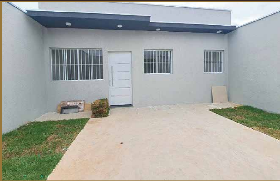
CASA À VENDA JD. BOM SUCESSO R$ 550.000,00