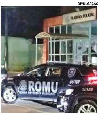
Ocorrência começou no centro