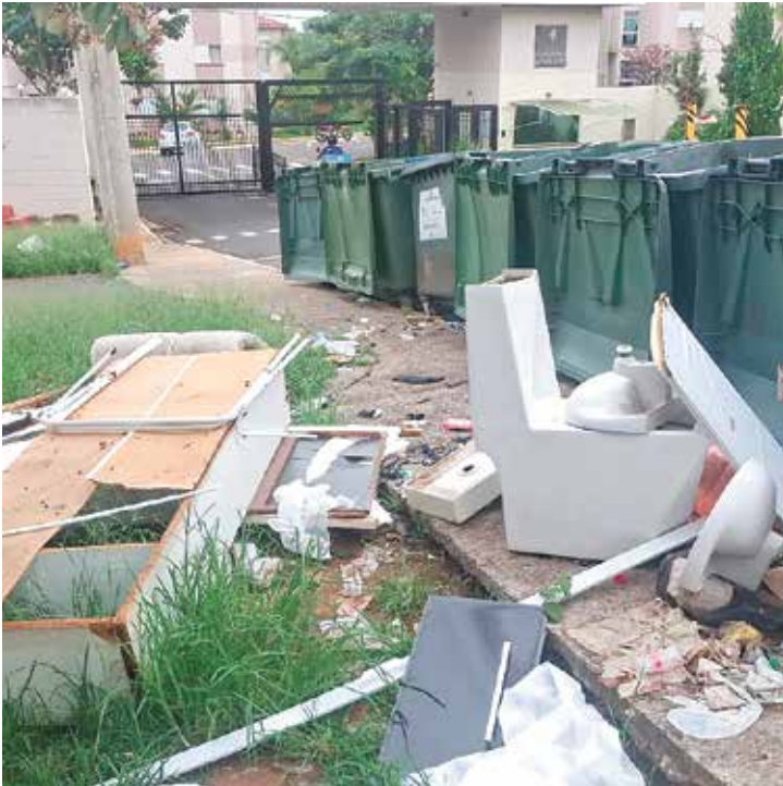
CAMPO BONITO flagra descarte irregular de entulhos e resíduos de reforma em Indaiatuba, prática que prejudica o meio ambiente, compromete a limpeza urbana e pode gerar penalidades aos responsáveis.