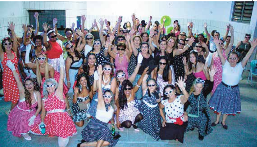
Encontro reúne participantes que venceram o câncer e outros desafios e compartilham suas histórias

A iniciativa nasceu a partir de um grupo de mulheres no WhatsApp. Entre cafés, passeios e comemorações de aniversários, surgiu a ideia de realizar a primeira festa, com o propósito de reunir um pequeno grupo de mulheres com o mesmo objetivo: socializar, interagir, buscar apoio e inspiração. Após a segunda edição, as organizadoras perceberam