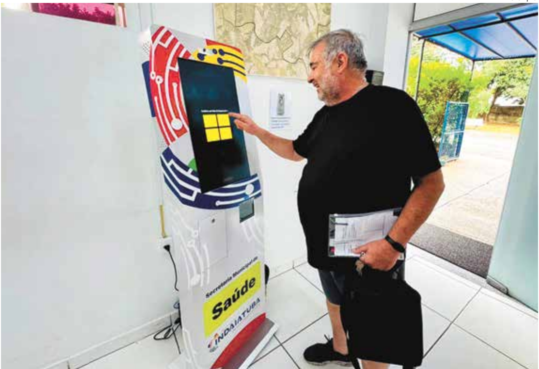
Atendente virtual denominada 'Daia' faz primeiro contato e orienta sobre etapas do autoatendimento

A atendente virtual denominada "Daia" faz o primeiro contato com o usuário, orientando sobre as etapas do autoatendimento. Ao digitar o CPF, uma pergunta de segurança é feita para