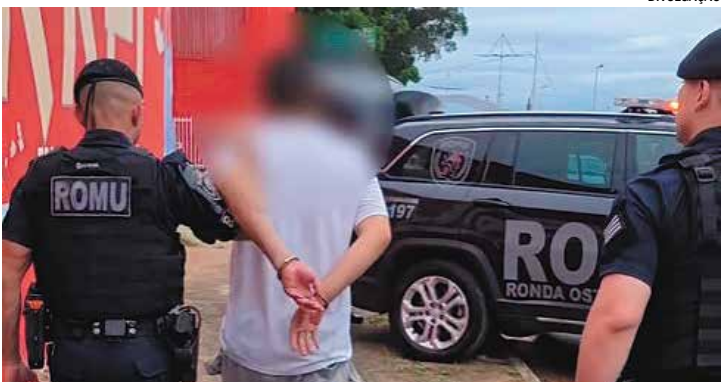
Abordagem ocorreu na Avenida Engenheiro Fábio Roberto Barnabé