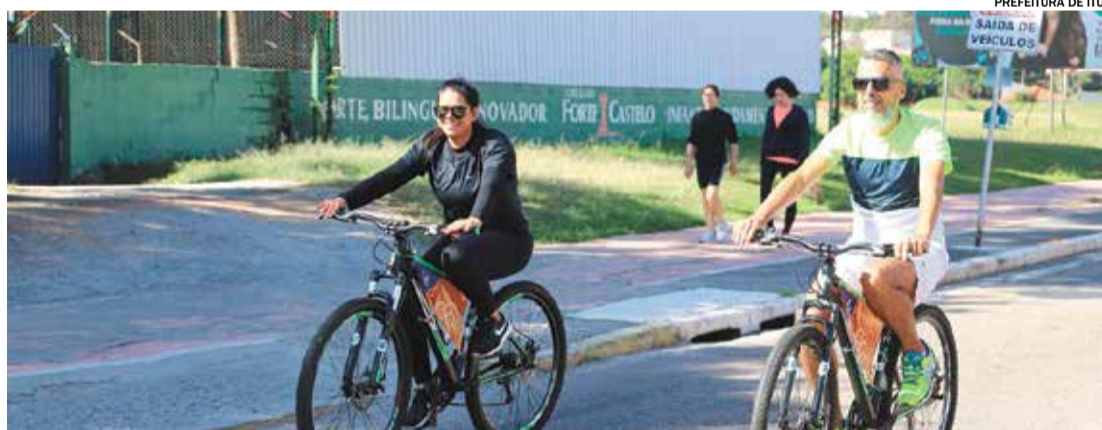
O projeto Pedal na Galileu acontece neste domingo, dia 23, na Avenida Galileu Bicudo

O projeto Pedal na Galileu acontece neste domingo, dia 23. O projeto disponibiliza aos munícipes, de forma gratuita, bicicletas para a prática esportiva na