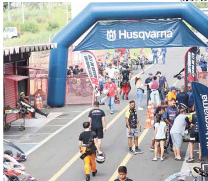
Pilotos da Cadete e da F4 Júnior disputarão uma premiação especial

Para mais informações, contate pelo WhatsApp (11) 9727-64333.