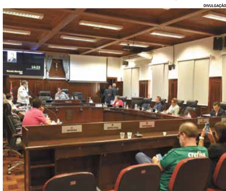
Os projetos aprovados em 2ª discussão seguem para sanção do Executivo

Na última terça-feira (18), ocorreu a 19ª sessão ordinária de 2024, na Câmara de Vereadores. Todos os projetos em pauta foram aprovados. Em primeira discussão, do Executivo Municipal, o Projeto de Lei Nº 46/2024, que “Dispõe sobre as diretrizes para a elaboração e execução da lei orçamentária de 2025, e dá outras providências”.