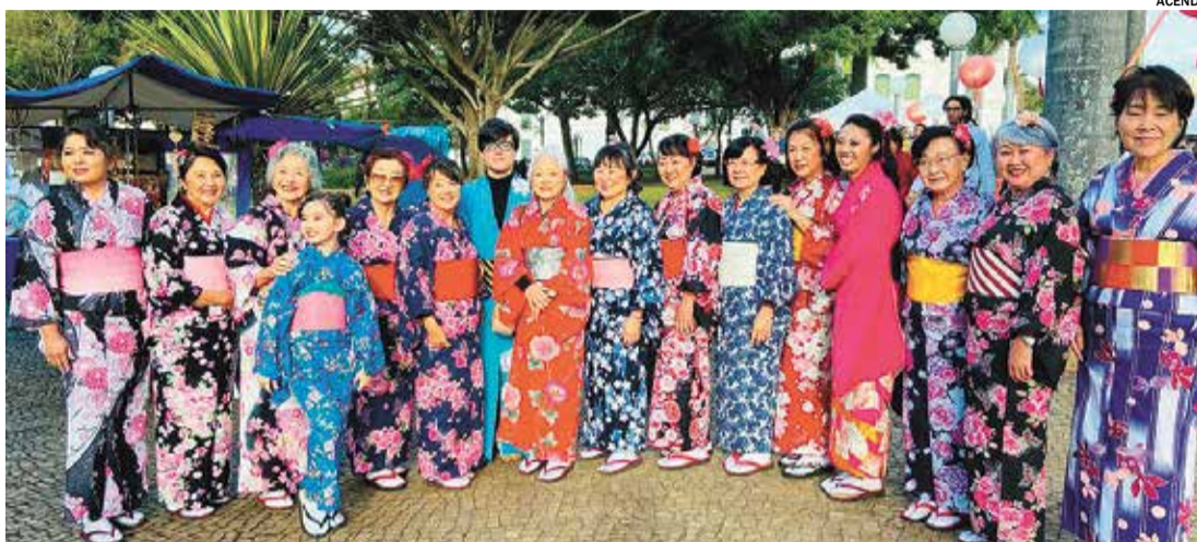
13ª Festa Japonesa tem início neste sábado, às 11h

Na atração cultural, os visitantes poderão conhecer mais sobre a cultura japonesa. Haverá apresentação de música, taikô, artes marciais e danças típicas.