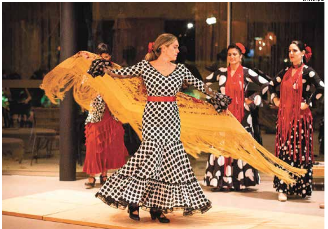
Sarau Memórias em Movimento será apresentado nesta sexta, às 19h, no Espaço Arte em Tablado

O Festival Hispânico é uma realização da Prefeitura de Itu, por meio da Secretaria Municipal de Cultura e Patrimônio Histórico, em parceria com apoiadores e colaboradores. O festival é viabilizado por meio do convênio nº 930047/2022 entre a Secretaria de Economia Criativa e Fomento Cultural/Ministério da Cultura e a Prefeitura da Estância Turística de Itu. A programação do festival segue até o dia 29 de junho e inclui diversas atrações gratuitas para todas as idades.