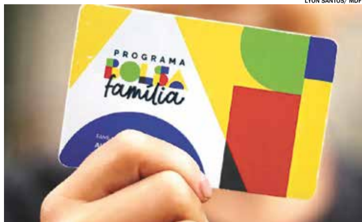
Com os adicionais, o valor médio do benefício é de R$ 683,75

A Caixa Econômica Federal realizou nesta semana o pagamento da parcela de junho do novo Bolsa Família aos beneficiários com Número de Inscrição Social (NIS) de final 3. O valor mínimo do benefício é de R$