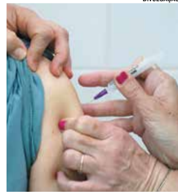
A campanha ocorre nas UBSs

A vacina contra a Dengue contempla, neste momento, crianças e adolescentes na faixa etária de 10 anos a 14 anos, 11 meses e 29 dias.