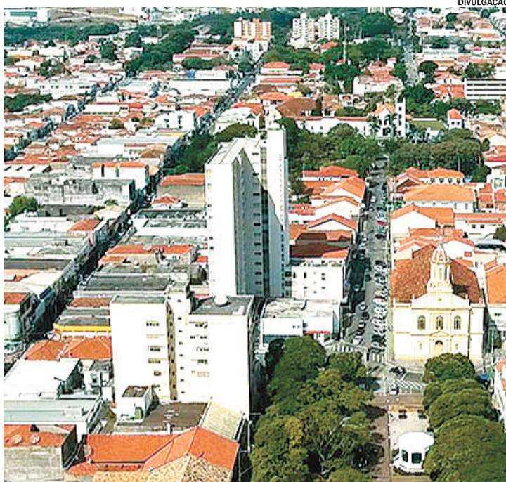
Nas últimas três edições da premiação, Itu foi destaque no estado

Ao todo, 240 projetos disputaram a grande final após a etapa estadual, que contou com a participação de representantes municipais de todas as Unidades da Federação. Representando o Sebrae e a Federação, participaram do evento o presidente do Sebrae Nacional, Décio Lima;