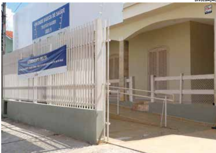
Itu conta não registra mortes na própria cidade há mais de um mês

Itu foi a primeira cidade de toda a região e uma das primeiras do Estado de São Paulo a destacar uma unidade dedicada exclusivamente ao diagnóstico e aos primeiros atendimentos dos casos de Dengue. Seu funcionamento teve início na última semana de fevereiro deste ano e, até o momento, os números indicam que foram realizados mais de 3 mil atendimentos no local e cerca de 1,5 mil exames. Itu conta ainda com ausência de óbitos na própria cidade há mais de um mês. O sétimo e último caso registrado, até então, foi o de um morador de Itu que estava no