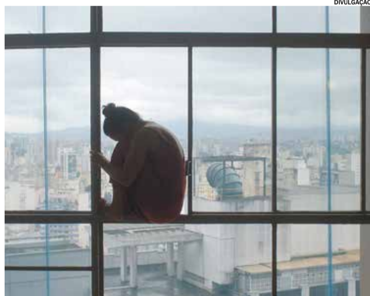
O filme é da consagrada cineasta Eliza Capai

Incompatível com a Vida Data: 21 de junho (sexta) Horário: 20h00 Faixa etária recomendada: Acima de 14 anos Duração: 92 minutos Local: Confrades Bar End.: Rua Padre Bartolomeu Tadei, 47 – Itu/centro