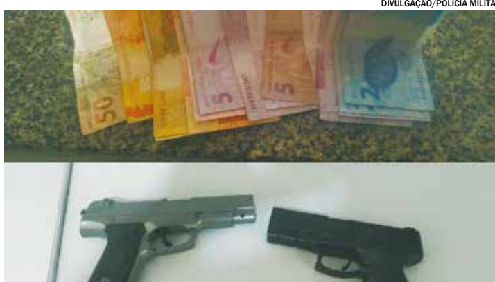
Com os bandidos foram localizados réplicas de arma de fogo e dinheiro

A ocorrência foi apresentada na Central de polícia Judiciária, onde os indivíduos permaneceram presos