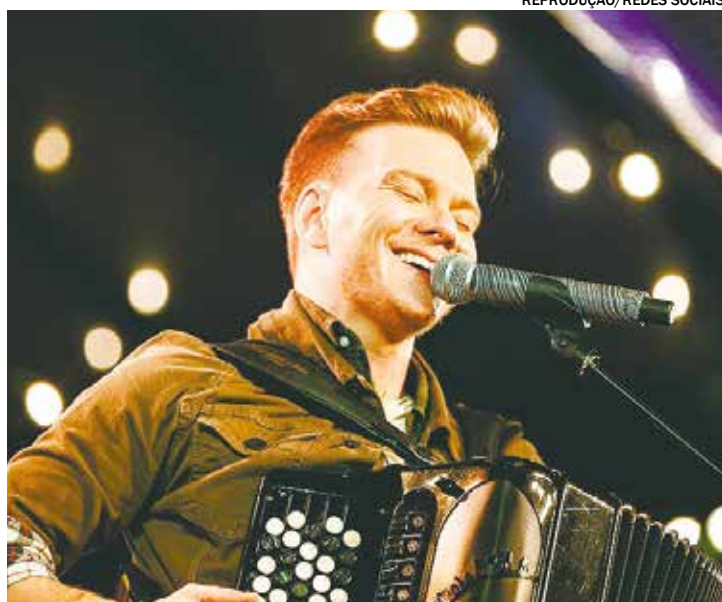
Michel Teló se apresenta em Itu no Dia Nacional do Trabalhador

Também haverá apresentações musicais com DJ,