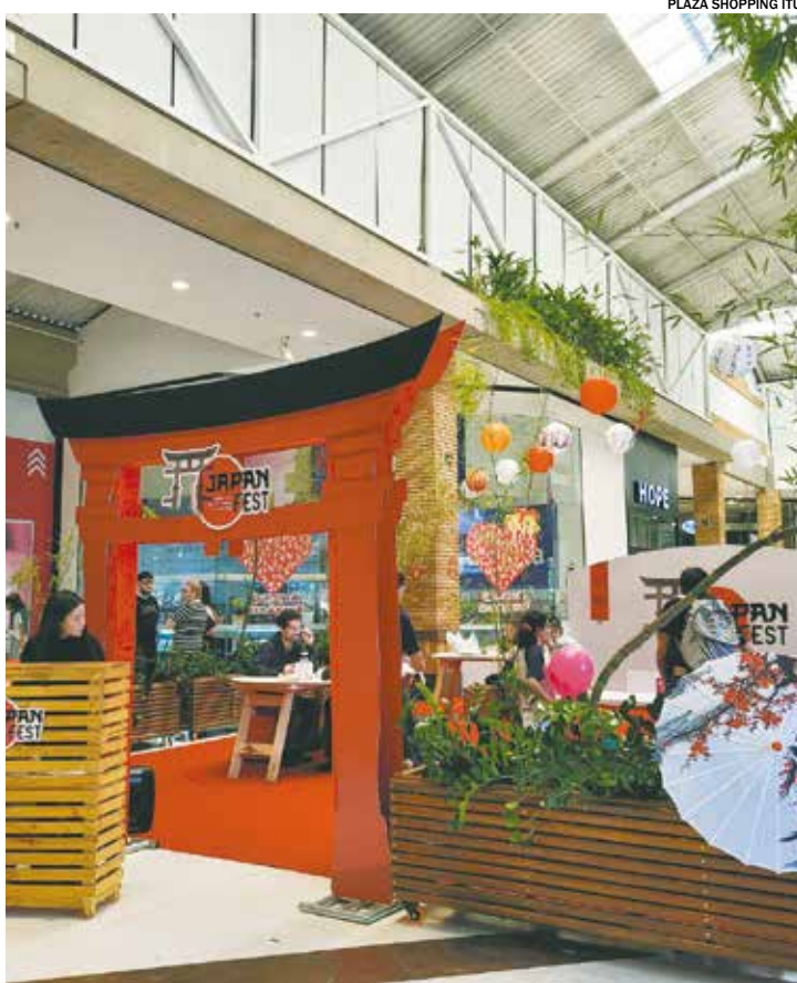
Crianças podem se divertir nas oficinas de origami e arte em anime

Ainda de quinta a domingo, das 13h às 19h, adultos e crianças podem participar das oficinas de origami, leque japonês e arte em anime, com entrada gratuita.