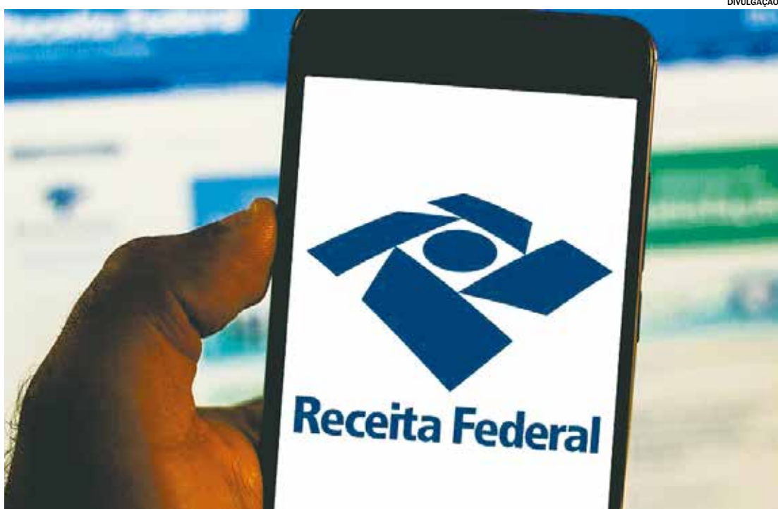
Em Itu, mais de 40 mil contribuintes devem declarar o Imposto de Renda 2024 até o dia 31 de maio

to da declaração, a organização pede que sejam apresentados os seguintes documentos: Declaração do imposto de renda entregue em 2023; Documentos de