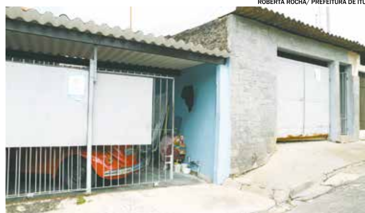
As reformas são válidas dentro do orçamento de até R$ 25 mil por imóvel

Os interessados podem entrar em contato pelo número (11) 4886-9846 ou pelo site https://itu.sp.gov.br/habitacao/programa-morar-melhor/ .