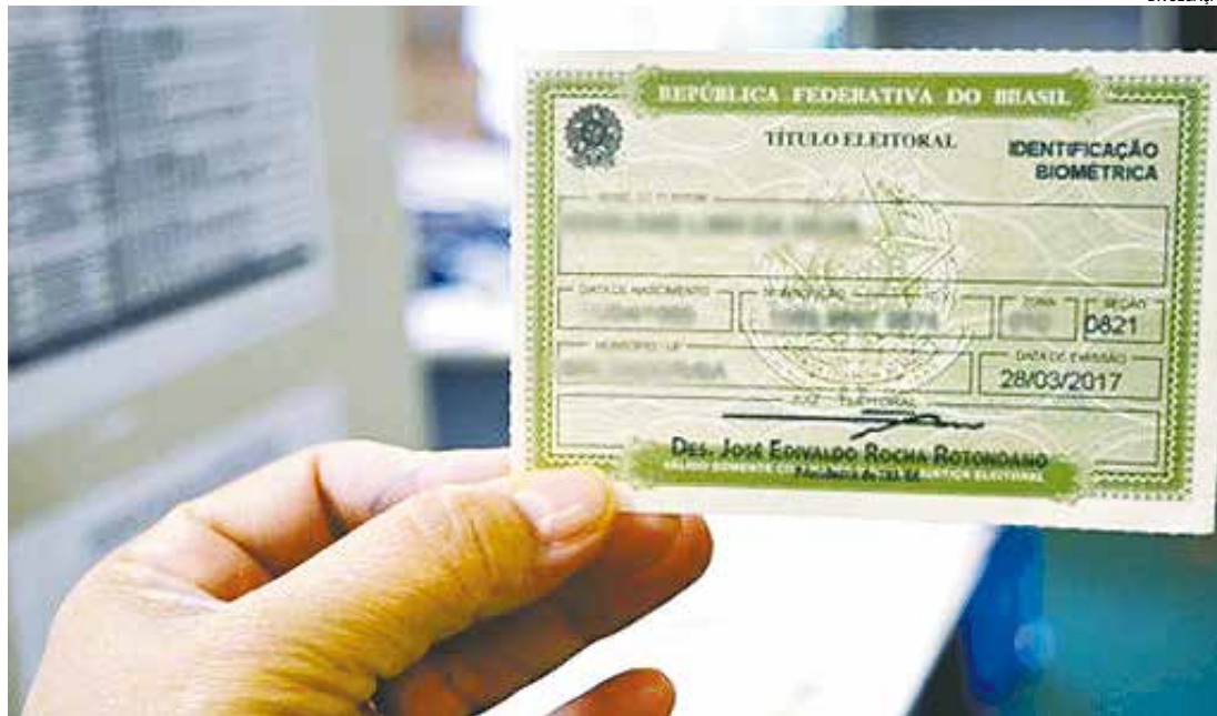
O alistamento eleitoral e o voto são obrigatórios para qualquer cidadão alfabetizado e com idade entre 18 e 70 anos

Para saber a situação eleitoral, basta acessar o Portal do TSE ou se dirigir a unidade da Justiça Eleitoral do município. O título pode ser cancelado por diversas circunstâncias, como não cumprimento das regras relativas à qualificação e ao domicílio; não comparecimento a três eleições