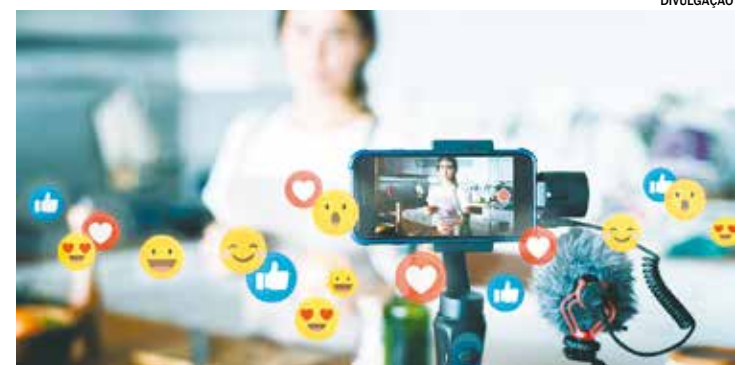
Curso de Influenciador Digital ocorre no dia 28 de maio, de forma presencial

Já os interessados em participarem do curso de vendas, poderão se inscrever até o dia 28 de maio, também nas unidades Sebrae Aqui. O curso ocorre no dia 11 de junho, das 18h às 22h, de forma presencial.