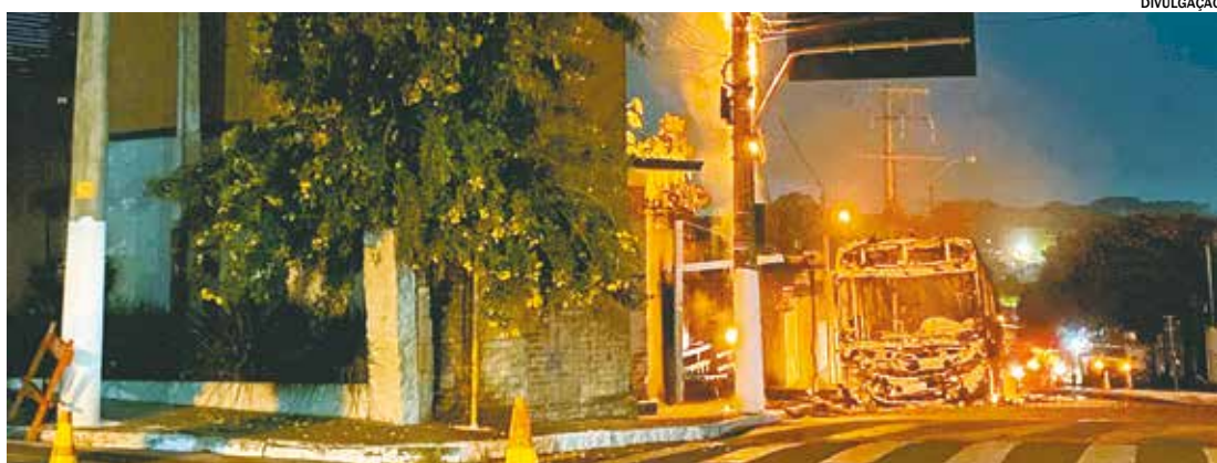
Acidente aconteceu na noite de segunda-feira, dia 22, na Rua Tomáz Simon, nas proximidades do Poupatempo

Um ônibus da empresa Rápido Luxo Campinas, que opera a linha metropolitana Itu/Sorocaba, pegou fogo na noite de segunda-feira, dia 22. O acidente ocorreu na Rua Tomáz Simon.