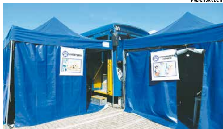
Castramóvel estará no estacionamento da Prefeitura no dia 5 de maio