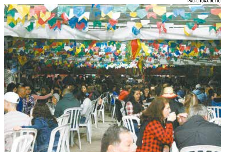
Festa Junina de Itu será realizada entre os dias 28 e 30 de junho

No primeiro dia, a festa vai das 18h às 22h. Nos demais dias, o horário será das 12h às 22h.