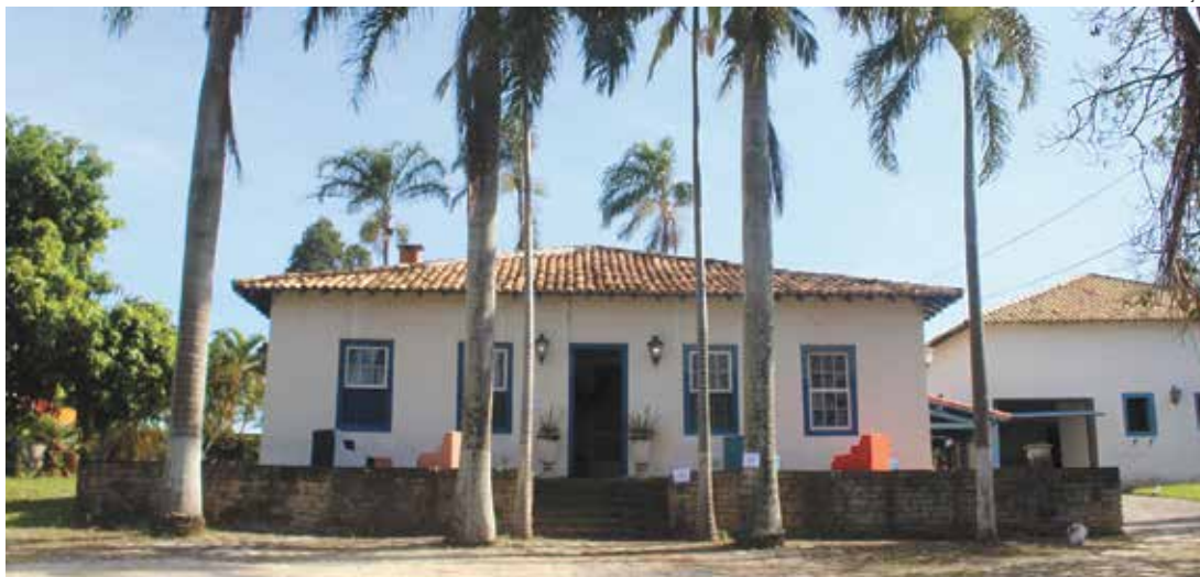
Oitava edição da Itu Casa Decor Select unirá passado e futuro em uma Casa de Fazenda com 600 m² de construção