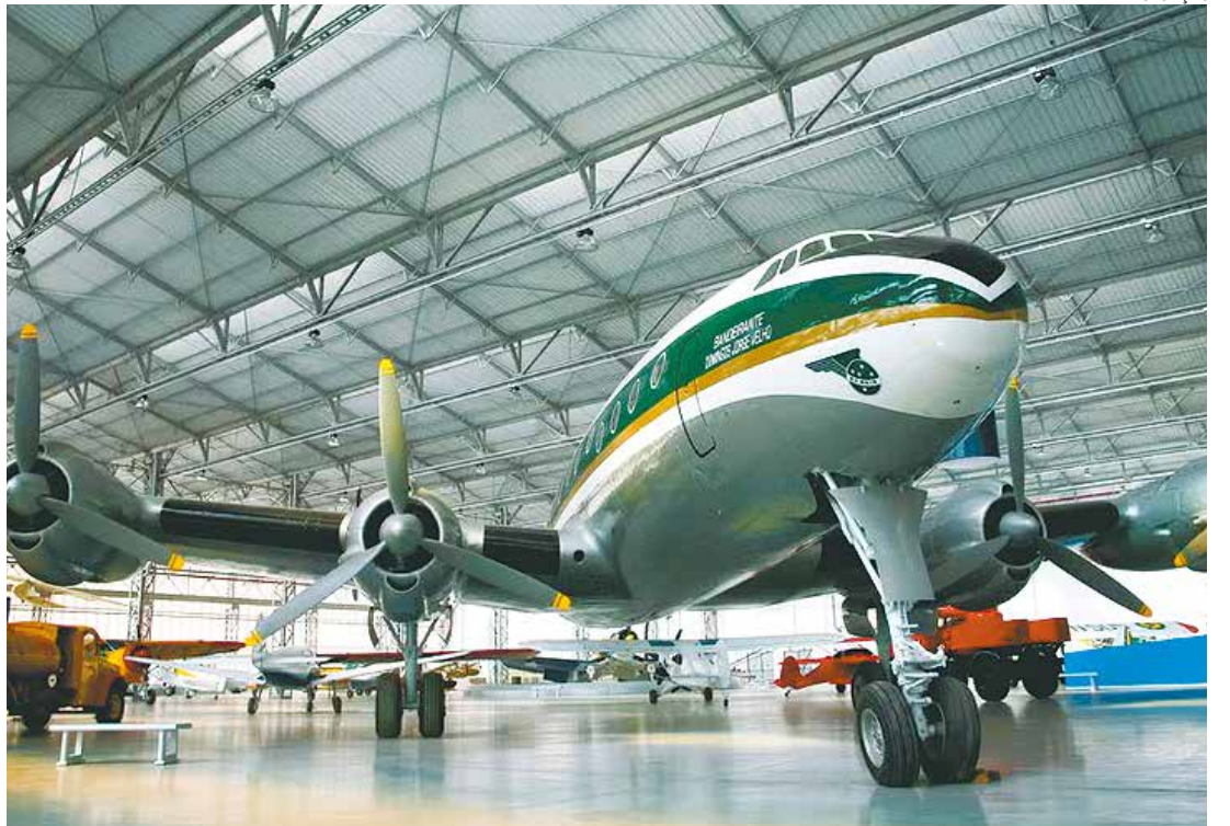
O museu da TAM o “Asas de um Sonho” deve ser inaugurado em Itu no primeiro semestre deste ano

O plano é inaugurar o museu até o final deste primeiro semestre com uma parte do acervo, e ir ampliando na medida em que as demais aeronaves forem sendo entregues.