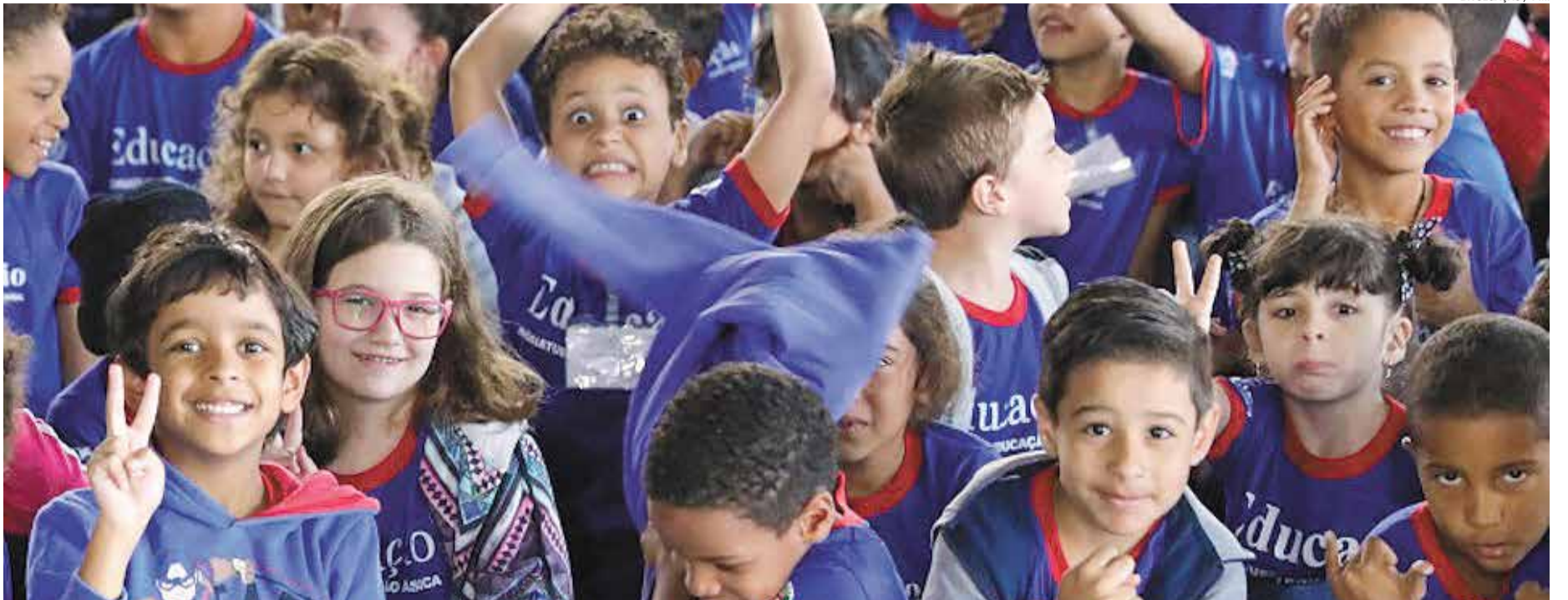
Alunos da Rede Municipal de Educação: todas as unidades escolares superaram o Ideb nacional e estadual, em pesquisa divulgada nesta quarta (14) pelo Ministério da Educação