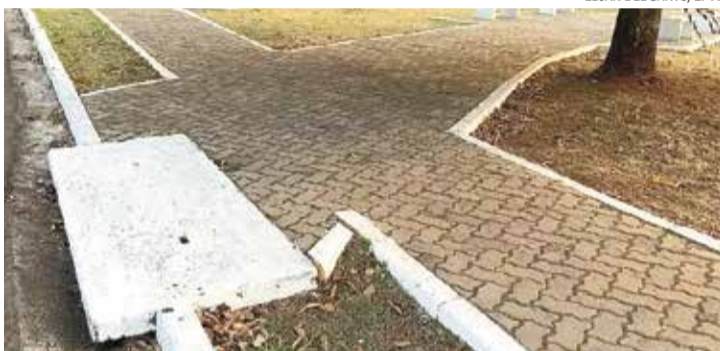
Partes de corpo da vítima foram encontradas em bueiros de uma praça