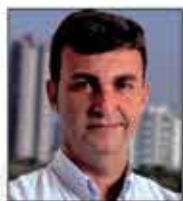
Nilson Alcides Gaspar Prefeito