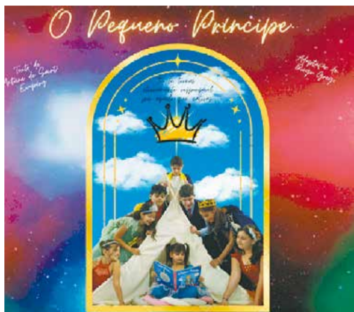
O Pequeno Príncipe do Grupo Raio de Luz contará com elementos circenses

Data: 18 de agosto Horário: 19 horas Local: Centro Hermenegildo Pinto (Piano)