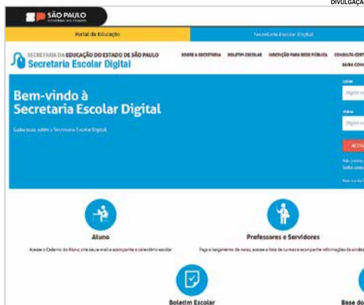
Alunos podem consultar uma série de serviços na Secretaria Escolar Digital

Caso o aluno queira mudar de escola, o período para solicitação de transferência, que geralmente acontecia no mês de janeiro do ano seguinte, foi antecipado pela Secretaria e vai seguir o