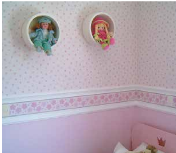
Precisando de cortinas, persianas, papel de parede, colchas, almofadas, tapetes e carpetes, lembre-se sempre da Adelaide Decorações. Ligue já e agende seu horário (19) 3894-4638 / (19) 99763-2829. Você vai adorar!