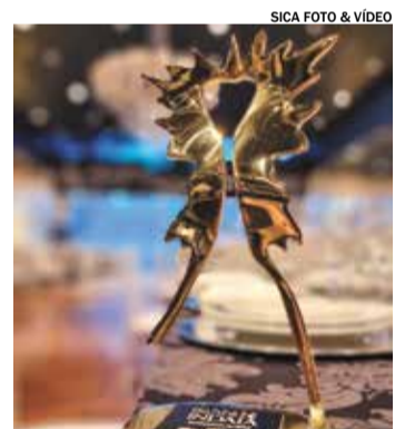
SICA FOTO & VIDEO

Neste ano, quando se realiza sua 18ª edição, a celebração recebe a banda Raça Negra, que tem mais de 40 anos de história com músicas que viralizaram, como "Cheia de Manias" e "É tarde demais".