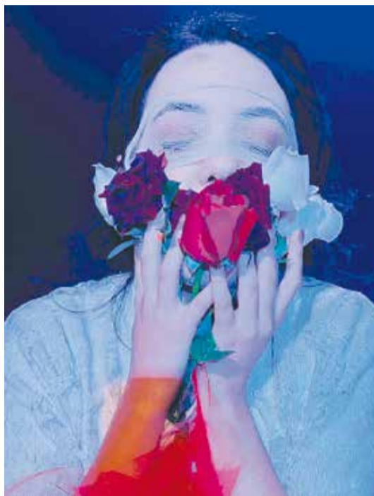
Por que as Rosas Calam? tem direção de Paloma Dourado

Dramaturgia Ainda no sábado (17), mas às 20h, no Piano, o Grupo de Teatro Estrada apresenta Por Que as Rosas Calam? , com