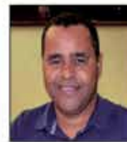
Pepo Lepinsk Pessoa Pública