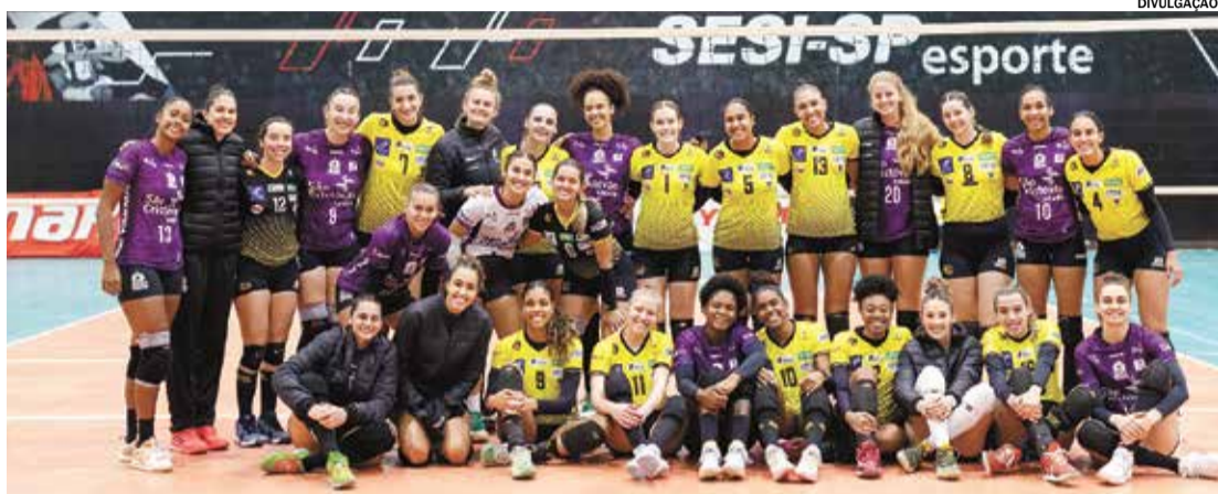
Equipes do Osasco e Renasce Vôlei disputaram partida amistosa para celebrar novo ciclo de patrocínio

“Osasco e Yanmar são duas marcas fortes e con-