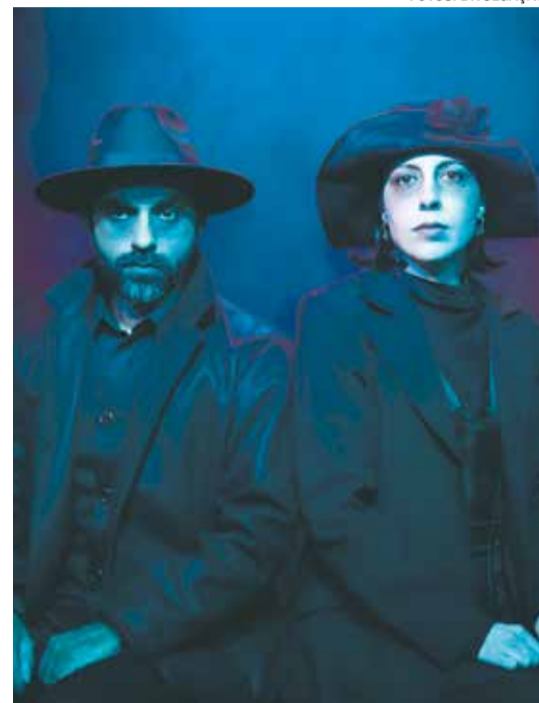
O Sétimo Hóspede tem texto e direção de Clóvys Tôrres