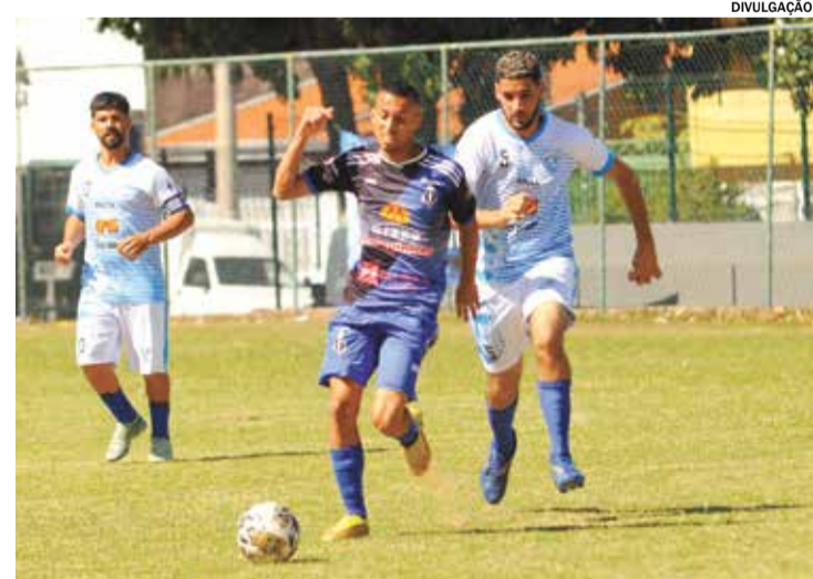
Jogos serão disputados em ida e volta; empate levará às disputas de pênalti