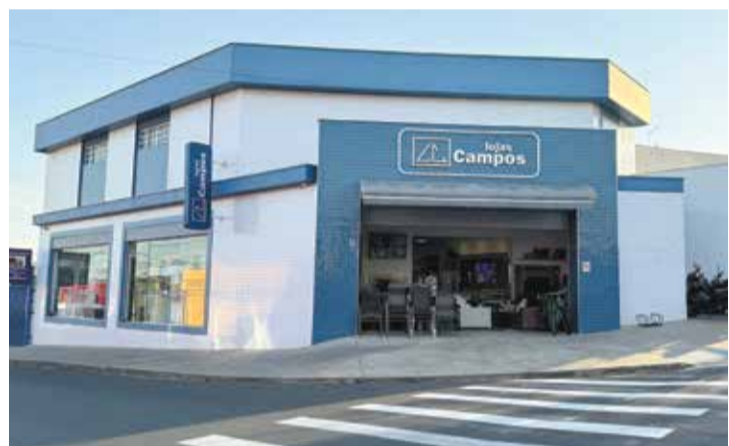
São mais de três décadas oferecendo diversidade e qualidade aos clientes