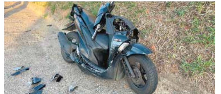
Parte frontal da motocicleta ficou destruída após batida em caminhão

Devido ao impacto da colisão, o motociclista sofreu ferimentos e escoriações pelo corpo. Ele foi socorrido e encaminhado ao Pronto Socorro do Hospital Augusto de Oliveira Camargo (HAOC).