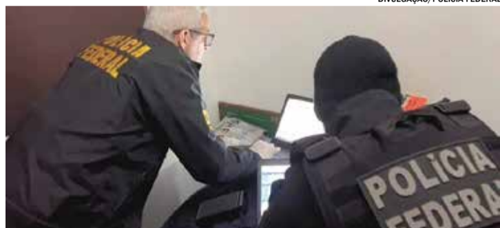
Polícia Federal cumpriu mandados em residência em Indaiatuba na terça (13)

A Polícia Federal orientou ainda aos pais e responsáveis sobre a importância de monitorar a atuação dos filhos na internet.