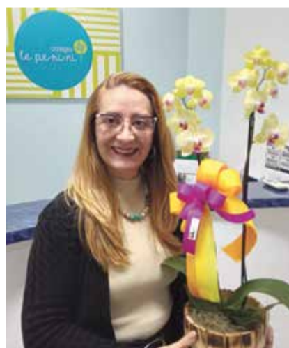
Com muita alegria, recebemos Leia, do Colégio Le Perini, no Mais Expressão. Para marcar esse momento especial, levamos uma linda orquídea da Recanto das Flores em agradecimento. Seja muito bem-vinda!!