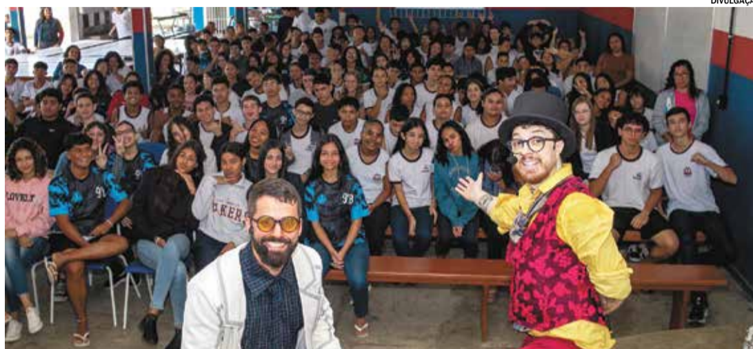
Projeto traz espetáculo teatral e oficina onde educadores trabalham temas como autoestima, motivação e bullying

Esta é a primeira vez que o projeto percorre o Estado de São Paulo, com objetivo de beneficiar pelo menos 800 pessoas da comunidade escolar. Em Indaiatuba, será realizado no dia 20 de agosto na E. E. Profª Annunziata Leonilda Virginelli Prado, no dia 21 na E. E. Antônio