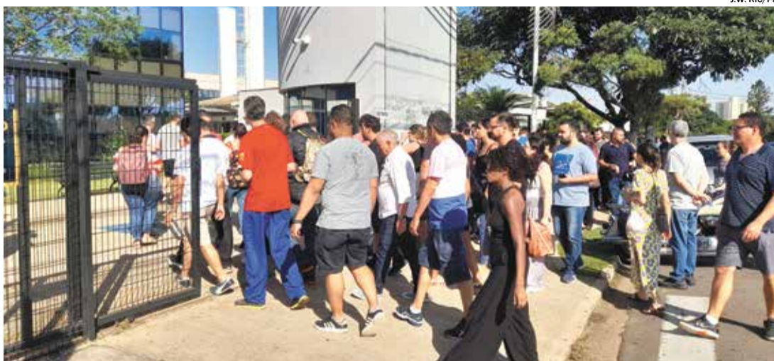
Candidatos indo realizar a prova em processo seletivo anterior da autarquia: inscrições seguem até setembro

As vagas disponíveis neste processo seletivo são de Gestão, Informática, Agronegócio e Enfermagem. Na área de Gestão, serão contemplados os municípios de Americana, Artur Nogueira, Boituva, Cabreúva, Campi-