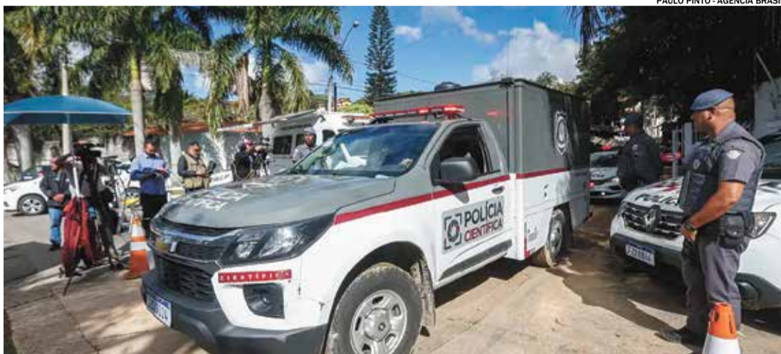
Especialistas afirmam que não foi preciso realizar exames de reconhecimento de comprovação biológica (DNA)

O Centro de Investigação e Prevenção de Acidentes Aeronáuticos (Cenipa) finalizou, na manhã da última segunda-feira (12), a fase inicial da investigação do acidente com o voo 2283, da empresa aérea Voepass (antiga Passaredo).