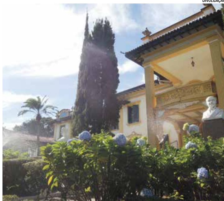
Há mais de nove décadas, HAOC oferece tratamento médico de qualidade

Em 1933, a estrutura do HAOC era formada por