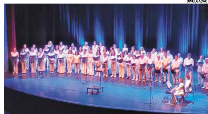
Núcleo de Canto Coral da Secretaria de Cultura abre as apresentações

No domingo, dia 30, a partir das 18 horas, sobem ao palco o Núcleo de Canto Coral da Secretaria de Cultura, Coral Astra (Jundiaí), Coral Cantares Adulto e Infantojuvenil da Associação Camerata Filarmônica de Indaiatuba e Coro Cênico Intermusic (Atibaia).