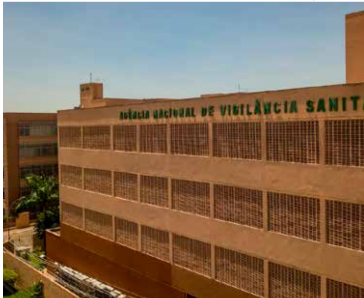
Realização de procedimentos estéticos por não médicos é debatida

O Conselho Federal de Medicina (CFM) encaminhou ofício à Agência Nacional de Vigilância Sanitária (Anvisa) solicitando que “reveja urgentemente” os termos da Resolução 2.384/2024, que proíbe a importação, fabricação, manipulação, comercialização, propaganda e o uso de produtos à base de fenol em procedimentos de saúde em geral ou estéticos.