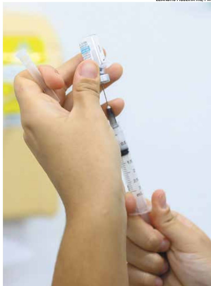
ELIANDRO FIGUEIRA RIC/PMI

Além de manter a caderneta vacinal em dia, também é fundamental seguir algumas regras como: higienização frequente das mãos e objetos; manter o ambiente arejado; beber bastante água e manter-se hidratado; ter uma alimentação saudável e rica em frutas, verduras e legumes; reforçar a imunidade; manter o ambiente domiciliar limpo e livre de poeiras e mofo; e a suplementação de vitaminas e minerais, se necessário.