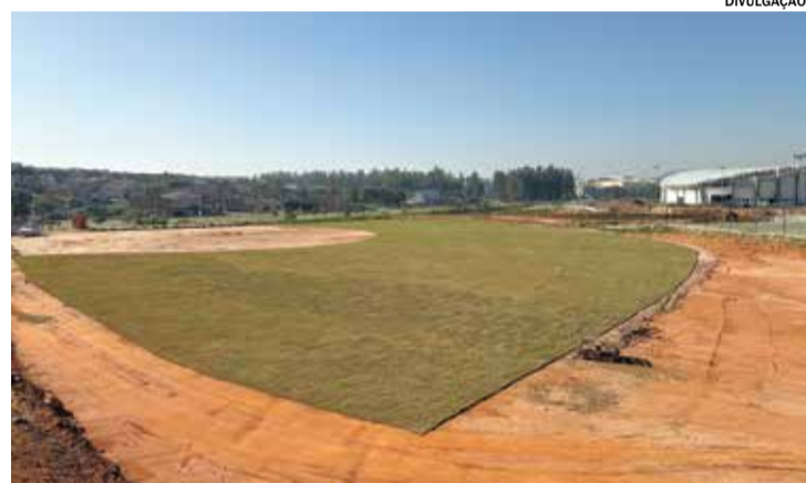
Novo campo possui 67 metros e está equipado para atender beisebol e softbol