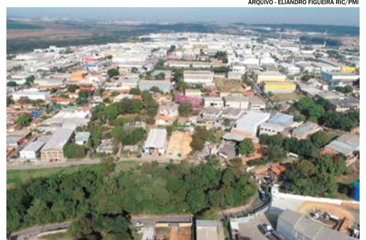
Distritos Industriais seguem em crescimento, gerando diversos empregos

Em abril de 2024, em relação a igual mês do ano anterior, o PIB paulista avançou 6,1%. Destaques para os setores: indústria (9,6%), serviços (4,3%) e agropecuária (4,0%).