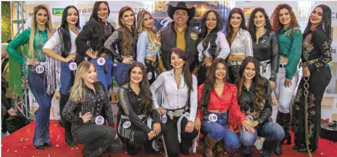
Final do Rainha Faici 2024 acontece dia 13 de julho no recém-inaugurado Espaço de Eventos Itaboraí

Nesta fase, as candidatas entraram usando, obrigatoriamente, calça jeans, camiseta e salto alto. Foram duas entradas: a primeira de maneira coletiva e a segunda de forma individual. A bancada, composta por dez jurados, deu notas de 1 a 5, sem fração, para os quesitos beleza, simpatia e desenvoltura. As vencedoras