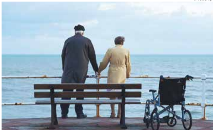
A GRANDE FUGA - Um veterano de guerra foge da casa de repouso em que vive para celebrar o 70º aniversário do Dia D, na Normandia.