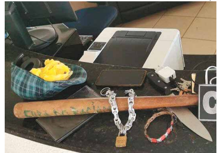
Rapaz estava bastante alterado e resistiu à abordagem da Guarda