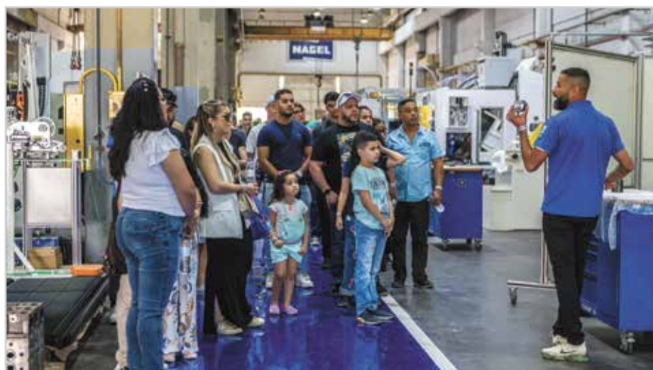
Visitantes fazendo o tour pelo parque fabril da Nagel