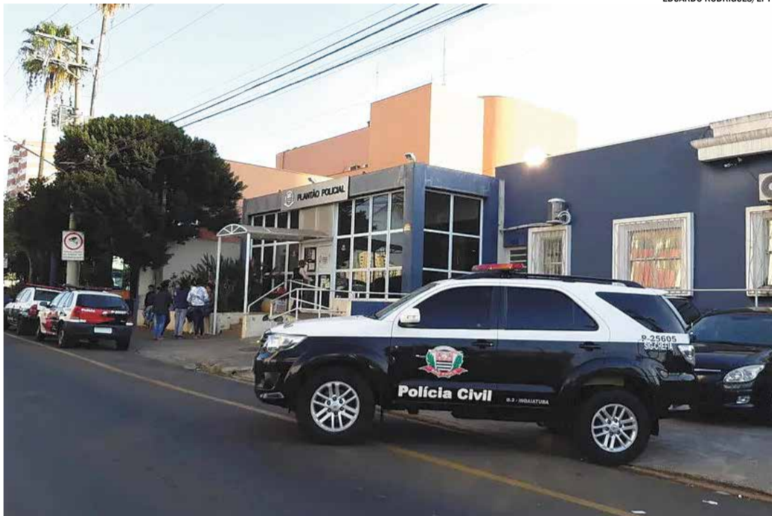
Operação visa desmantelar quadrilha que realizava furtos em residências de médio e alto padrão na região