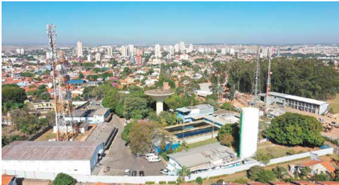
Registro pluviométrico entre os dias 20 de março e 21 de junho foi o menor desde o início das medições

Apesar do cenário de alerta, consumo entre março e junho aumentou 10%