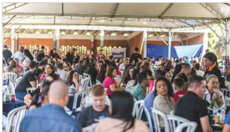
Colaboradores e família no dia 22/06 Open House

A Nagel do Brasil oferece uma ampla gama de soluções na área de máquinas especiais e automação industrial, além de fabricar máquinas e ferramentas de brunimento, máquinas de furação profunda e brocas canhão, máquinas de super acabamento em fita e pedra, tornos e retíficas.