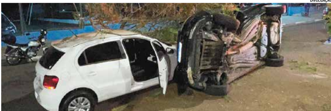
Após motorista perder controle da direção, carro colidiu contra árvore na Avenida Presidente Vargas, sábado

Um motorista perdeu o controle da direção do veículo e bateu contra uma árvore na Avenida Presidente Vargas, na noite de sábado (22). Após bater na árvore, o veículo colidiu contra outro e em seguida capotou.