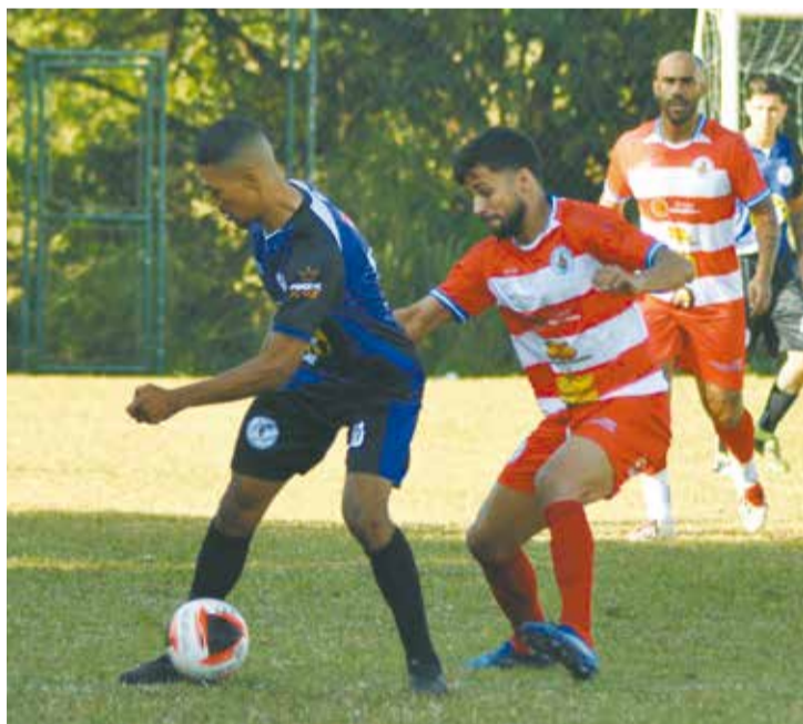
Apesar do jogo equilibrado, Galáticos venceu o Oliveira Camargo por 3 a 1

Oliveira enfrenta o Estrela Real no Campo do Oliveira Camargo; e Galáticos e Operário duelam no Campo da Osan. Fechando a rodada, às 13h30, Mastiga Samba e Unidos de Indaiatuba jogam no Campo da Osan (com informações de Manoel Mesias/www.lifutebol.com).