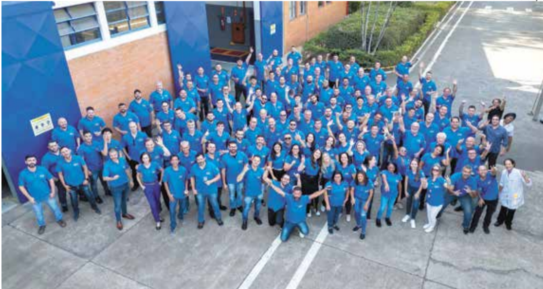
Colaboradores da Nagel reunidos para celebrar o cinquentenário da empresa do setor de usinagem de precisão