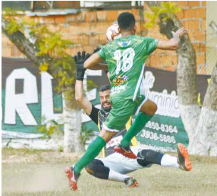
Pela Série A1 do Amador, o Vale Verde derrotou o Camisa 10 por 5 a 2

A etapa final foi muito disputada, mas o Galáticos conseguiu se impor e voltou à liderança do placar, novamente com Hemersson Leandro, aos 8 minutos. A equipe visitante seguiu suportando a pressão ad-