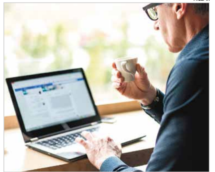
Importância do LinkedIn vai além do recrutamento e da busca por empregos

Título: quando o recrutador pesquisa por candidatos, ele busca principalmente pelo nome da vaga aberta, por palavras-chaves e competências. Por exemplo, em uma vaga de Técnico ou