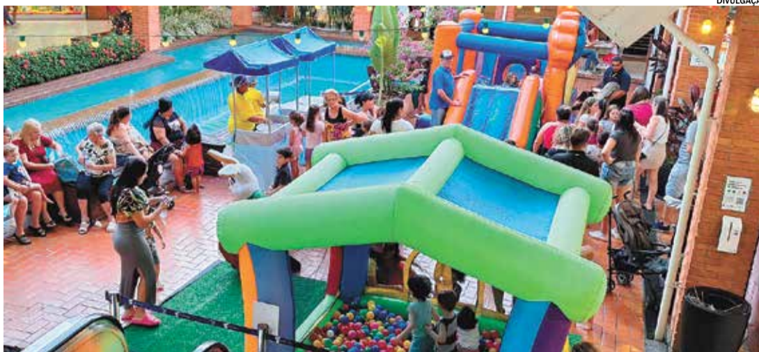
Evento terá pula-pula inflável, piscina de bolinhas, pipoca e algodão doce para os visitantes; entrada é gratuita

A programação inclui um pula-pula inflável e uma piscina de bolinhas, garantindo a diversão das crianças. Além disso, haverá um espaço especialmente decorado para fotos instagramáveis, permitindo que os participantes registrem e compartilhem os momentos especiais do evento. Para completar a tarde, pipoca e algodão doce serão distribuídos aos visitantes, criando um ambiente ainda mais festivo e acolhedor, com todas as atrações gratuitas.