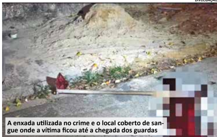
A enxada utilizada no crime e o local coberto de sangue onde a vítima ficou até a chegada dos guardas

Um homem de 44 anos foi assassinado a golpes de enxada na cabeça. O crime ocorreu por volta das 22h30 do domingo (6). O corpo foi encontrado na Rua Joaquim Pedroso de Alvarenga, no bairro Itaiaci.