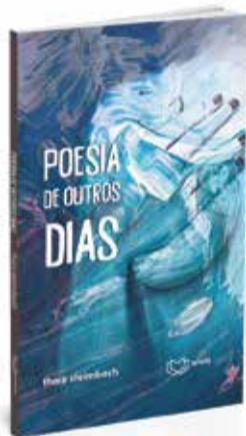
Capa do livro que retrata escritos de um período de três anos de produção literária

leitura de obras escritas por mulheres, das clássicas às contemporâneas. Na cidade, sem um espaço físico, ela e as outras integrantes participam dos encontros todas as últimas quartas-feiras do mês, às 19h, na cafeteria Black Coffee. “Desde o princípio, meu objetivo era reunir quem gosta de ler, quem gostaria de ler mais, quem deseja criar o hábito da lei-