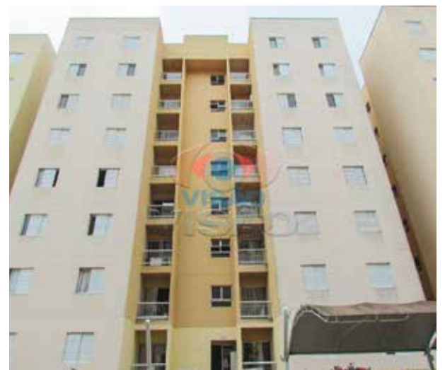
12 ref site 33210 - Apartamento Vila Brizzola - 3 dorm, coz, sala, banheiro, área serviço e garagem - R$ 290.000,00

TODOS OS VALORES ACIMA ESTÃO SUJEITOS A ALTERAÇÕES