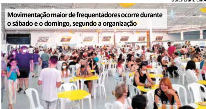
Movimentação maior de frequentadores ocorre durante o sábado e o domingo, segundo a organização