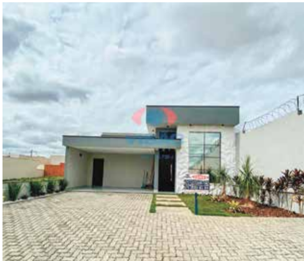
7 Ref site 33220- Casa Jardim Toscana - 3 dorm, banheiro, suíte, sala, coz, lavanderia e garagem - R$ 840.000,00