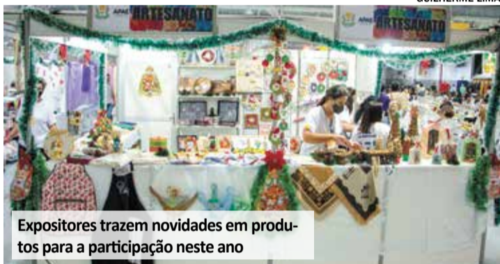
Expositores trazem novidades em produtos para a participação neste ano