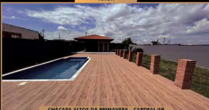
CHACARA ALTOS DA PRIMAVERA - CARDEAL/SP

terreno: 1.000 m 2 - construção: 220 m 2 - 3 dormitórios sendo 1 suite/ sala de TV/ sala de jantar/ cozinha/ lavanderia/ área gourmet com churrasqueira e piscina/ pomar com árvores frutíferas