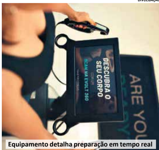
Equipamento detalha preparação em tempo real

A eficiência da eletroestimulação muscular tem sido benéfica também grandes jogadores de futebol. .