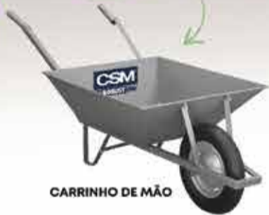
CARRINHO DE MÃO

NA COMPRA DE UMA BETONEIRA 400L GANHE UM CARRINHO DE MÃO!