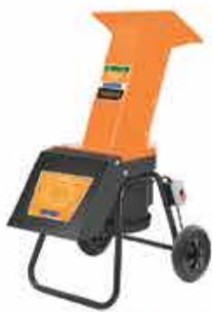
TRITURADOR ORGÂNICO ELÉTRICO