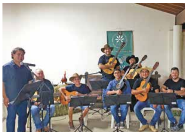
No dia 27 de outubro, o SENAR, formou a primeira turma de Violeiros, parceria com o Sindicato Rural Patronal de Indaiatuba. Finalizando o curso, os alunos mostraram que estão prontos para muitas apresentações. Parabéns a todos pela dedicação!!!