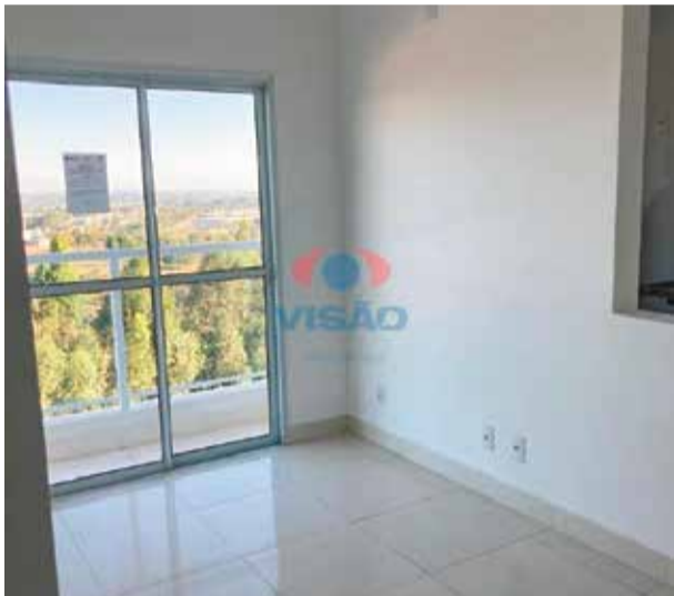
4 ref site 33217 - Apartamento Jardim Santiago - 2 dorm, banheiro, coz, área de serviço e garagem R$ 1.700 + IPTU+ Cond