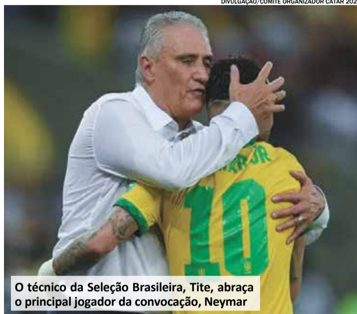
O técnico da Seleção Brasileira, Tite, abraça o principal jogador da convocação, Neymar

Escolhidos ou excluídos, a preocupação dos torcedores é que os que foram lembrados cumpram bem o seu papel e que consigam trazer o campeonato para o Brasil, como ocorreu no passado.