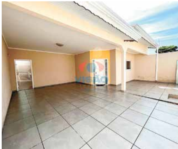
8 ref site 33209 - Casa Jardim Regina - 3 dorm , banheiro, suíte, sala, coz, área de serviço e garagem - R$ 850.000,00