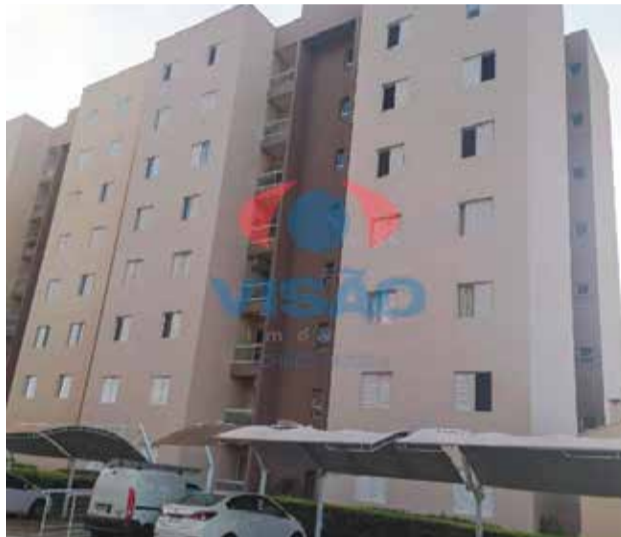
5 ref site 29097 - Apartamento Vila Brizolla - 2 dorm, coz, banheiro, área de serviço e garagem - R$ 1.700,00 + IPTU+ Cond