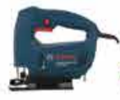
SERRA TIGO TIGO