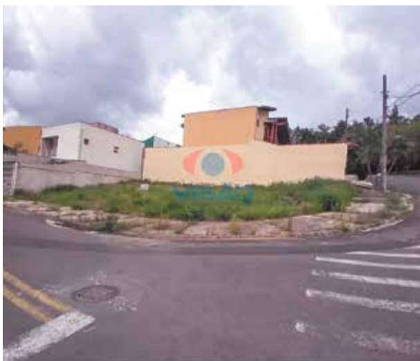
10 ref site 33050- Terreno Jardim Regente - Lote de 262,42 m² residencial - R$ 352.000,00