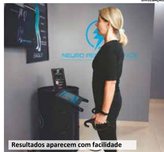
Resultados aparecem com facilidade