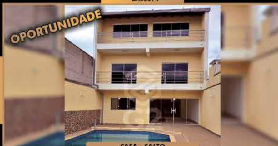
CASA - SALTO

03 suites, sendo uma com banheira de Hidromassagem / Espaço para academia / Sala de star e sala de jantar / Cozinha planejada / Área gourmet completa / Piscina/ Banheiro externo/ Portão automático