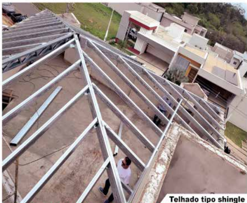
Telhado tipo shingle

Mr.ROOF Estruturas para Telhado em Aço Galvanizado