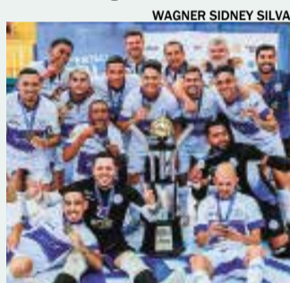
Time de Indaiatuba com o troféu da Supertaça EPTV de Futsal

Campeão dos Campeões! Além de conquistar o bicampeonato na Taça EPTV, Indaiatuba vence mais uma vez a equipe de Louveira e se torna campeã da primeira edição da Supertaça EPTV de Futsal.