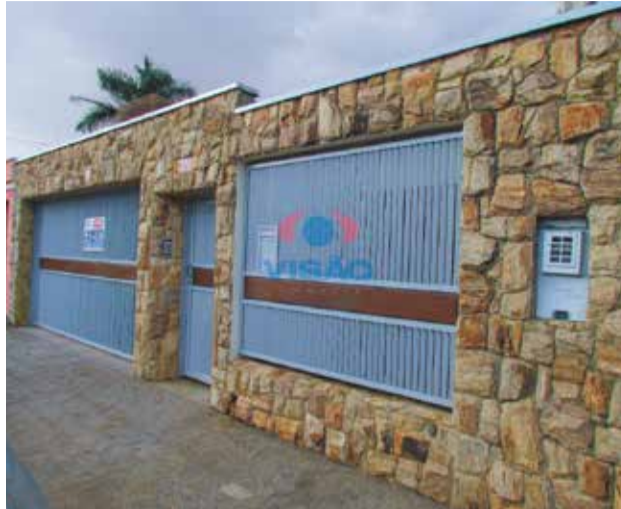
2 ref site 20- Casa Vila Furlan - 3 dorm , suíte, sala , coz , banheiro, garagem R$ 2.900 + IPTU