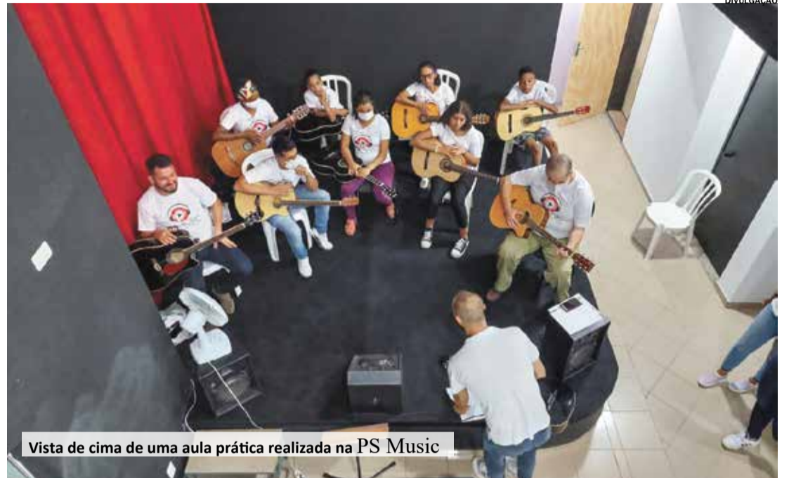
Vista de cima de uma aula prática realizada na PS Music

A PS Music - Escola de Música e Artes é completa e, além das aulas e a prestação de serviços culturais, sua infraestrutura dispõe de um estúdio para gravação e ensaio personalizado em parceria com a Dadya Audiovisual sob a responsabilidade do produtor Márcio Santos.