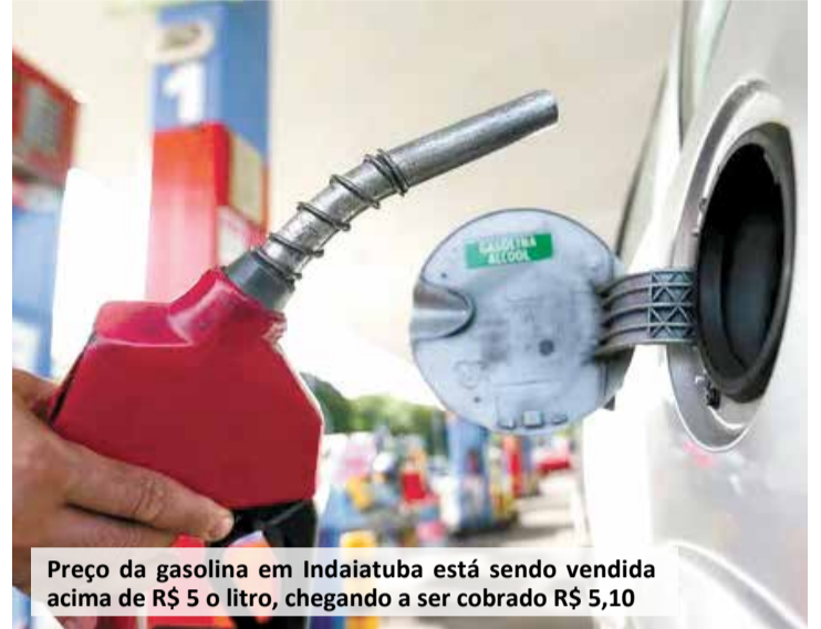
Preço da gasolina em Indaiatuba está sendo vendida acima de R$ 5 o litro, chegando a ser cobrada R$ 5,10

Já o diesel voltou a subir, após leve queda na semana anterior. O preço médio do litro subiu de R$ 6,56 para R$ 6,58, alta de 0,3%. O valor mais alto encontrado nesta semana foi de R$ 7,99.