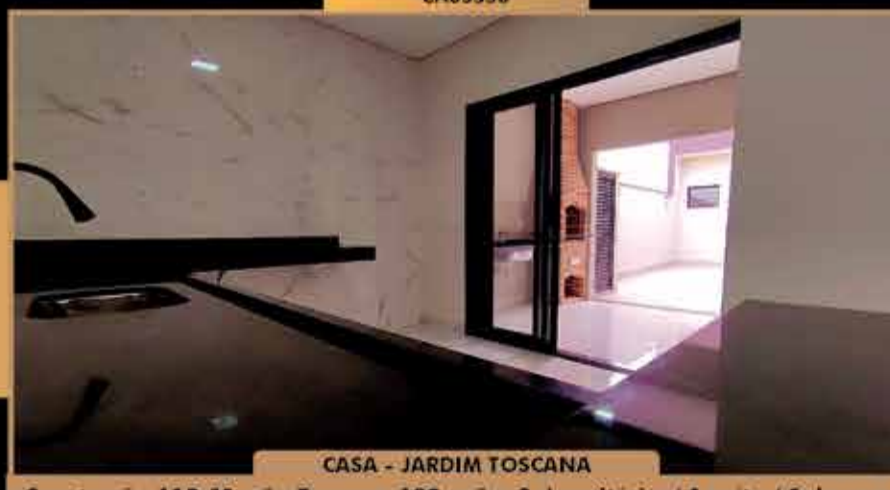
CASA - JARDIM TOSCANA

Construção 113,40 m 2 - Terreno. 189 m 2 - 3 dormitórios/ 1 suite / Sala com pé direito alto 2 ambientes / cozinha com ilha o fogão/ lavanderia/ área de Churrasqueira com pia/ quintal com gramado/ garagem para 4 carros.