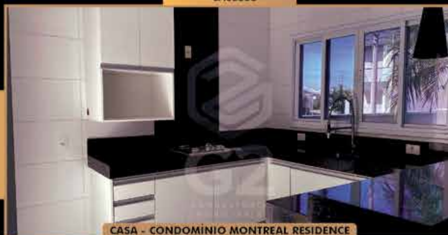
CASA - CONDOMÍNIO MONTREAL RESIDENCE

Terreno 150 m 2 - Construção 110 m 2 - 3 Dormitórios com 01 suite/ Cozinha com armários, fogão cooktop/ Lavanderia com armários/ churrasqueira/ Banheiro social/ Sala 02 Ambientes com pé direito alto/ Garagem 02 carros.