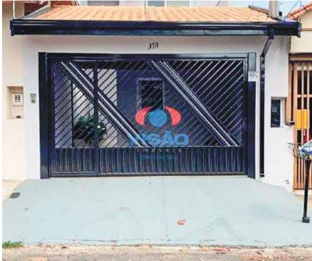
1 ref site 30974- Casa Jardim Pau Preto - 4 dorm , sala, coz, suíte, banheiro, área de serviço R$ 4.550 + IPTU