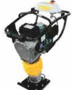
COMPACTADOR DE SOLO