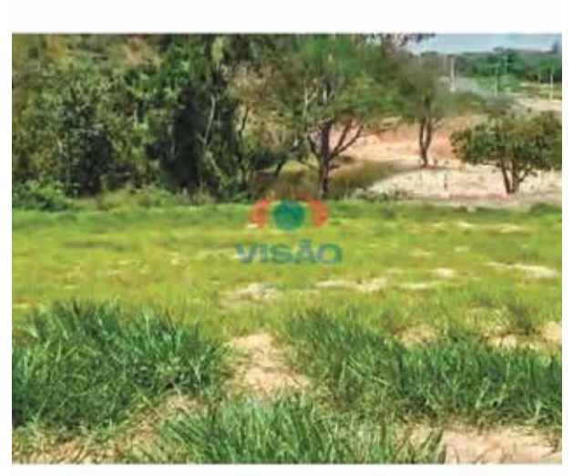
9 ref site 33112 - Terreno Santa Maria - Lote de 414,0m² residencial - R$ 470.000,00