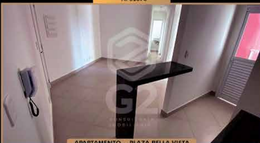
APARTAMENTO - PLAZA BELLA VISTA

3 Dormitórios - Sendo 1 Suite / Banheiro Social/ Sala De Estar E Jantar/ Cozinha Americana / Lavanderia / Varanda Grill / 02 Vagas Descobertas