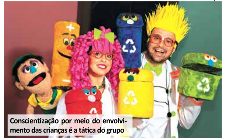
Conscientização por meio do envolvimento das crianças é a tática do grupo

Ao todo, serão oito apresentações realizadas em to-