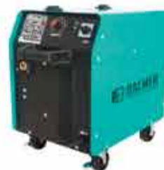
INVERSORA DE SOLDA