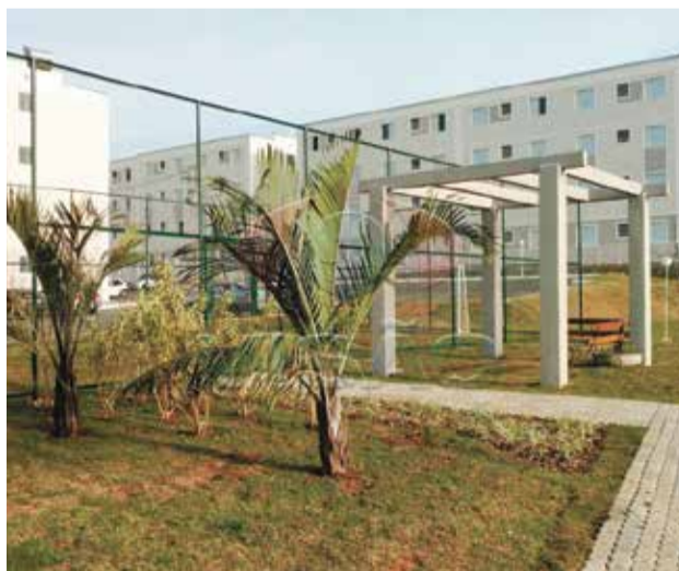
11 ref site 33219 - Apartamento Salto Ville - Salto/SP - 2 dorm, coz, sala, banheiro, área de serviço e garagem - R$ 230.000,00