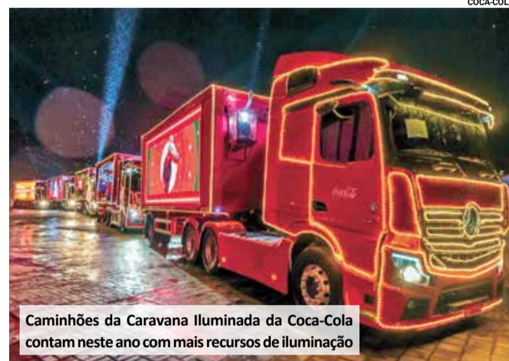
Caminhões da Caravana Iluminada da Coca-Cola contam neste ano com mais recursos de iluminação

Local de Início: na Avenida Presidente Vargas, próximo ao Clube 9 de julho.