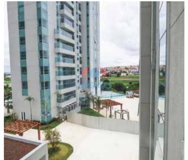
6 ref site 31578 - Apartamento Jardim Pompéia - 3 dorm, suíte, sala, coz, banheiro, área de serviço - R$3.900,00 + IPTU + Cond