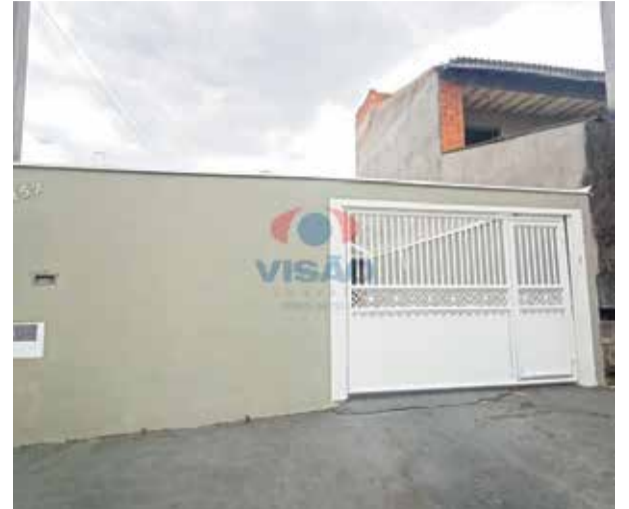
3 ref site 33200 - Casa Jardim Paulistano- 2 dorm, suíte, sala, cozinha, banheiro, área de serviço - R$ 2.000 + IPTU