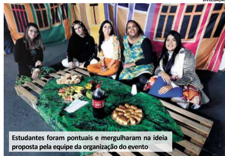
Estudantes foram pontuais e mergulharam na ideia proposta pela equipe da organização do evento

Após a reposição das energias, as dinâmicas com bexigas divertiram muito a galera e também os professores. Juntos, os concluintes e seus mestres brincaram como se fosses crianças,