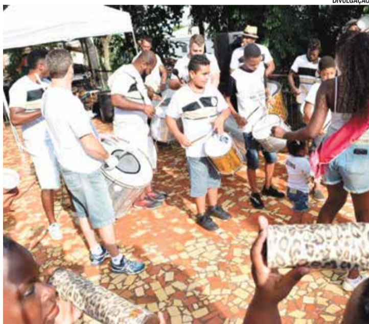
Em Rafard, a programação inclui matinê, marchinhas e desfile de blocos

No dia 19 de março, o Centro Cultural Júlio Henrique Raffard recebe o musical "Um Pouco de Elis", da Cia. UI de Teatro, às 19h00. O espetáculo faz uma homenagem à vida e ao legado de Elis Regina, uma das artistas mais emblemáticas da música popular brasileira..