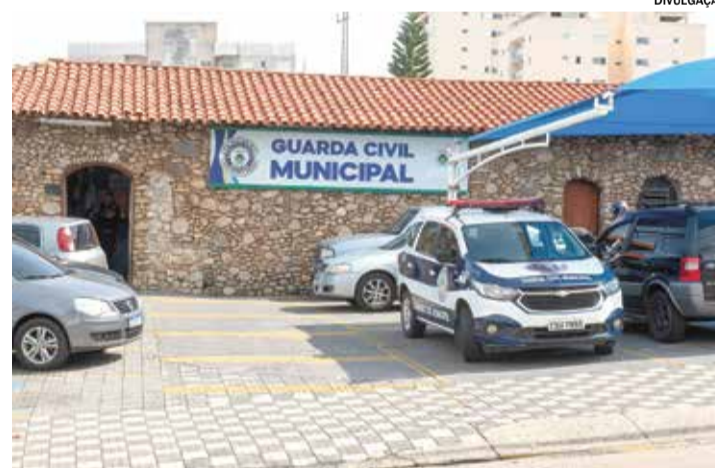
Guardas Civis que estariam de folga irão trabalhar