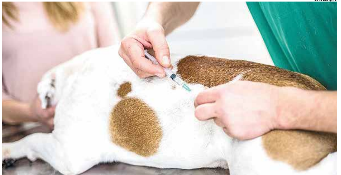
A raiva é uma doença infecciosa viral grave que pode ser fatal

Para mais informações, os interessados podem entrar em contato com a Prefeitura ou com o Setor Veterinário de Rafard.