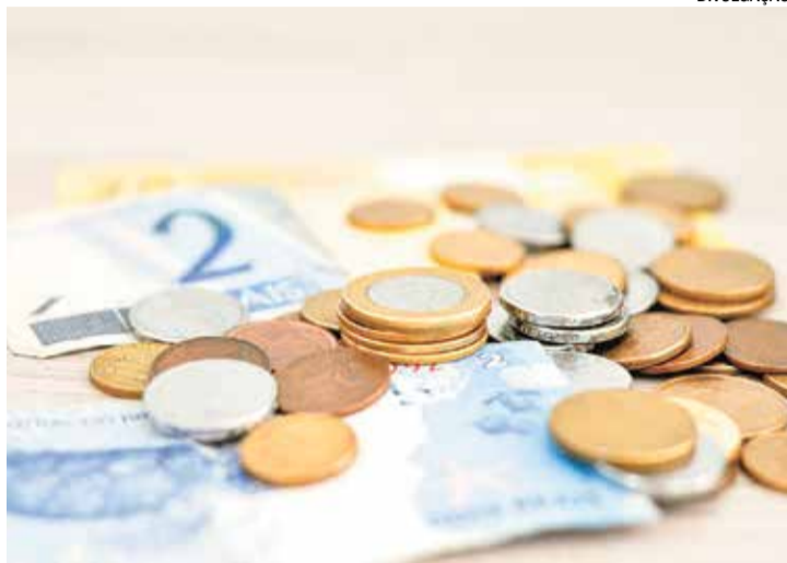
Outra dica é evitar compras por impulso e diminuir pedidos de delivery

ano, a recomendação do especialista é revisar hábitos de consumo e reduzir gastos supérfluos. “Evitar compras por impulso, diminuir pedidos de delivery e revisar assinaturas de serviços pouco utilizados pode fazer uma grande diferença no orçamento”, sugere. Pequenas economias acumuladas ao longo do tempo podem resultar em um alívio financeiro significativo.