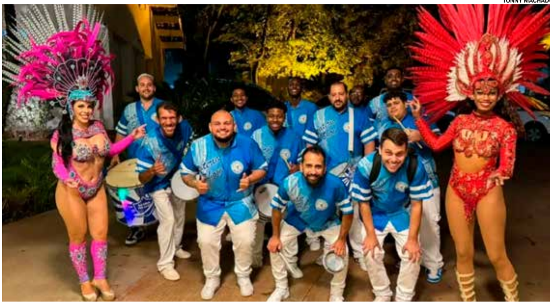
Vai Com Tudo e +10: desfila no sábado