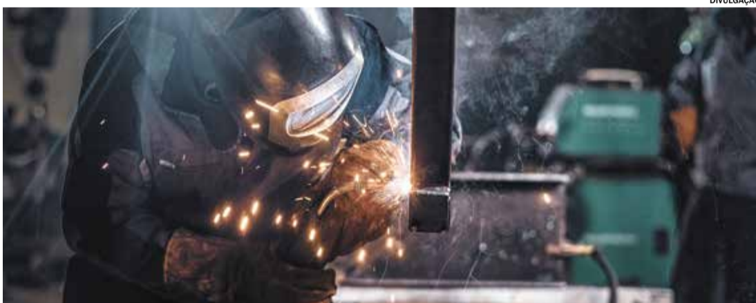
MOSB oferece capacitação teórica em parceria com a Prefeitura e a Câmara

Para mais informações, os interessados podem procurar a Secretaria de Desenvolvimento Econômico ou acompanhar as redes sociais da Prefeitura de Capivari.