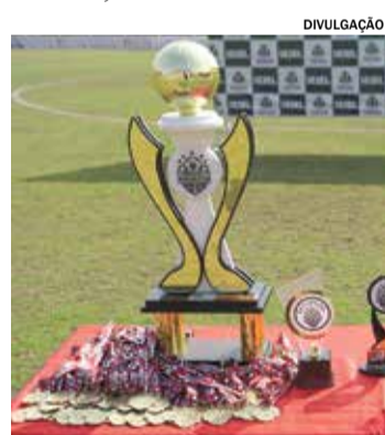
É necessário ir presencialmente na Secretaria de Esportes

Para saber mais sobre outros projetos e torneios organizados pela Secretaria de Esportes, o telefone (19) 2146-1525 e (19) 3492-8881 (Whats), de segunda a sexta, das 8h30 às 16h30.