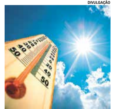
A previsão é de calor com sensação térmica acima dos 40°C

pacto da onda de calor na conta de luz sem abrir mão do bem-estar é diminuir o tempo de banho. Outra estratégia eficiente é utilizar o ar-condicionado junto com um ventilador, que ajuda a distribuir melhor o ar frio pelo ambiente. Outra dica é substituir lâmpadas fluorescentes ou incandescentes por modelos de LED.