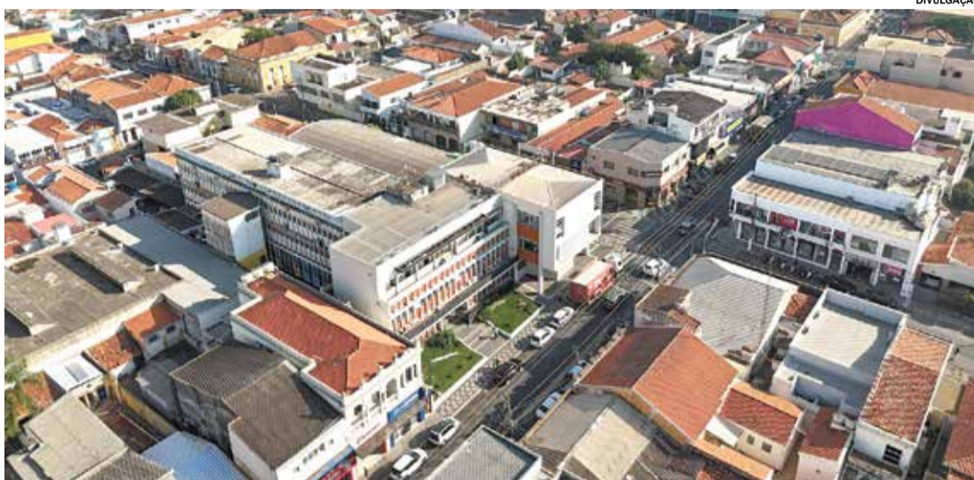
Foram 777 empregos gerados, melhor marca desde 2021

Durante 2024, a cidade registrou 7.582 contratações e 6.805 demissões, o que fez com que o município terminasse o calendário com o saldo positivo elevado. Comparando o último quadriênio, o ano passado só não superou a marca atingida em 2021 que