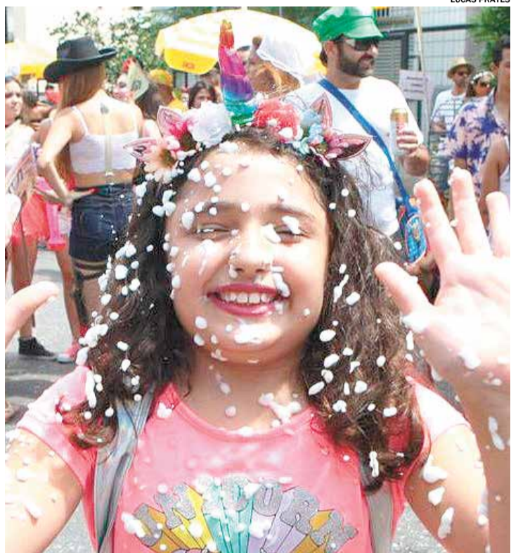
Também haverá matinês, bloquinhos e festa da espuma

gria. O Carnaval 2025 conta com marchinha itinerante, baterias vibrantes, passistas, além dos desfiles das Escolas de Samba Vai com Tudo e +10 e Turma da Barca. Também haverá matinês, bloquinhos, festa da espuma e muita diversão até o último batuque.