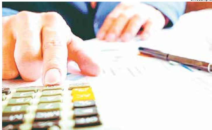
O setor de Dívida Ativa fica no Paço Municipal

O setor de Dívida Ativa fica no Paço Municipal, localizado Rua XV de Novembro, 639, no Centro. Mais informações pelo telefone (19) 3492-9200.