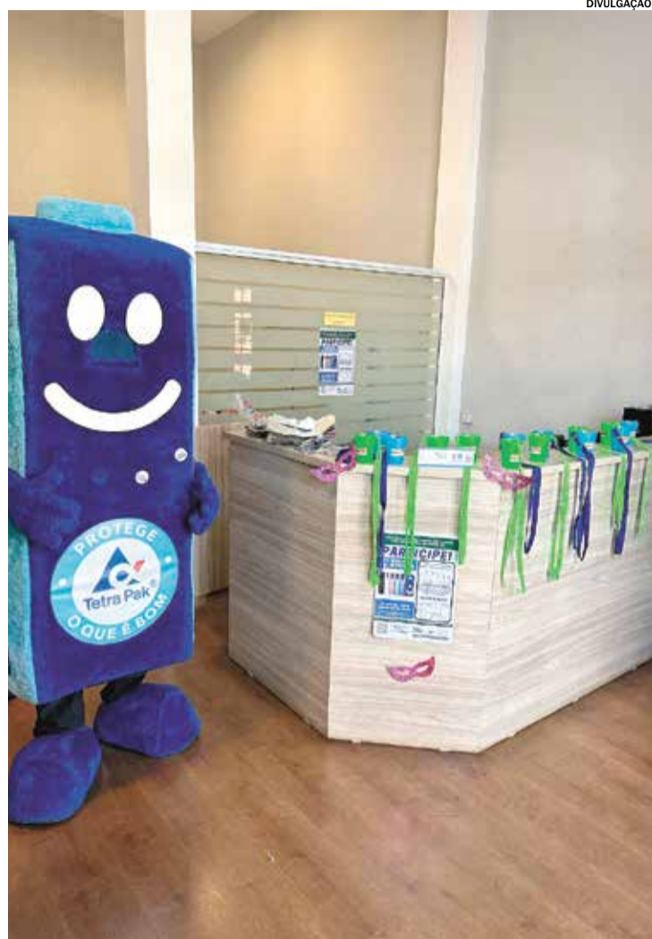
A ação busca conscientizar a população sobre a importância da coleta seletiva

A intenção é garantir a folia e ainda cuidar do meio ambiente evitando descartes desnecessários