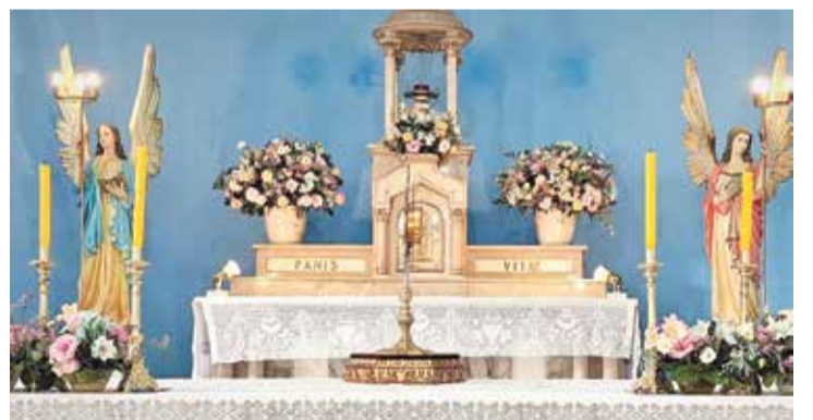
Desde o dia 22, a Capela Santo Antônio está aberta de segunda a sexta

A comunidade é incentivada a acompanhar as celebrações e continuar suas práticas religiosas enquanto a reforma está em andamento.