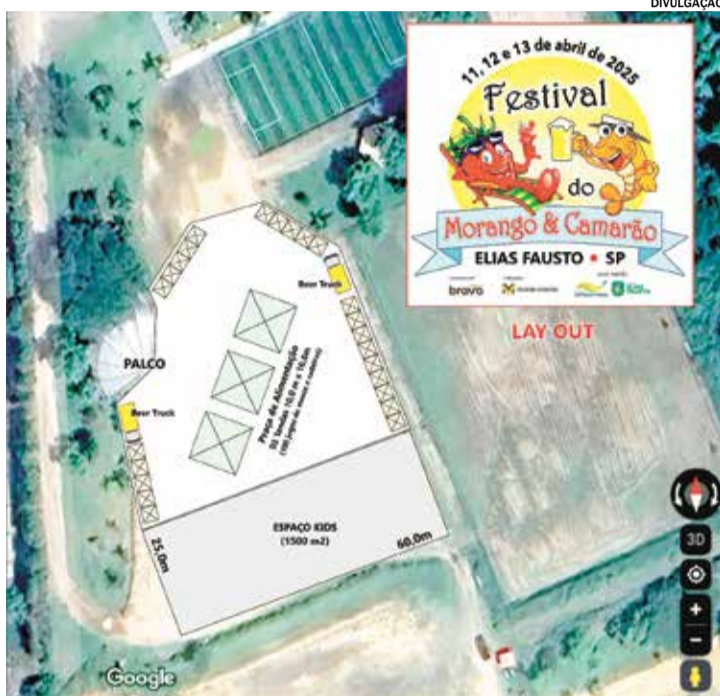
O Festival do Morango e Camarão promete ser um marco na cidade

O evento, que acontecerá no município, será