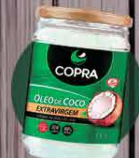
Óleo de Coco COPRA Extra virgem R$32,00 - 500ml