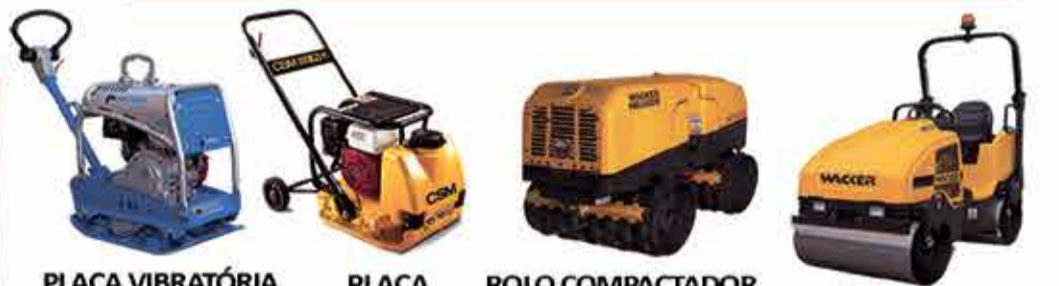
PLACA VIBRATÓRIA REVERSÍVEL