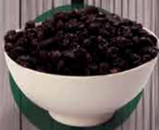
Uva passa preta Argentina (Safrá nova) R$1,99 - 100g