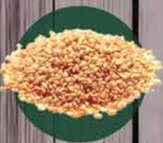
Gergelim com casca natural R$1,80/100gr