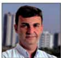
Nilson Alcides Gaspar Prefeito