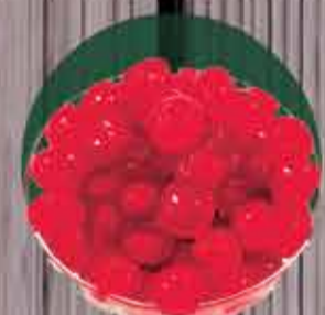
Cereja sem talo R$ 6,62/100gr