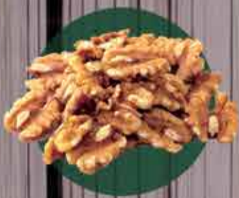
Nozes quebrada R$5,70 - 100g