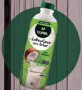
Leite de Coco para beber Copra R$ 15,00 - 900ml