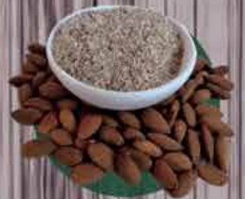
Farinha de Amendôas R$ 7,50 - 100g

*Promoção válida de 5 a 9/2 ou enquanto durar o estoque