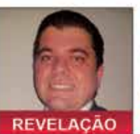
Murilo Cantarelli Seguro de Vida