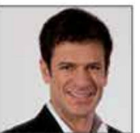
Rogério Nogueira Deputado Estadual