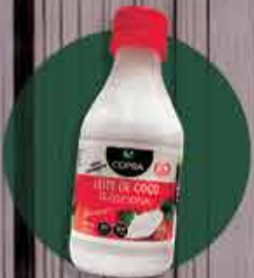
Leite de Coco Copra R$4,00 - 200ml