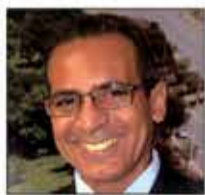
Hélio Ribeiro Político