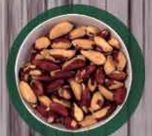
Castanha do pará média inteira R$6,50 - 100g