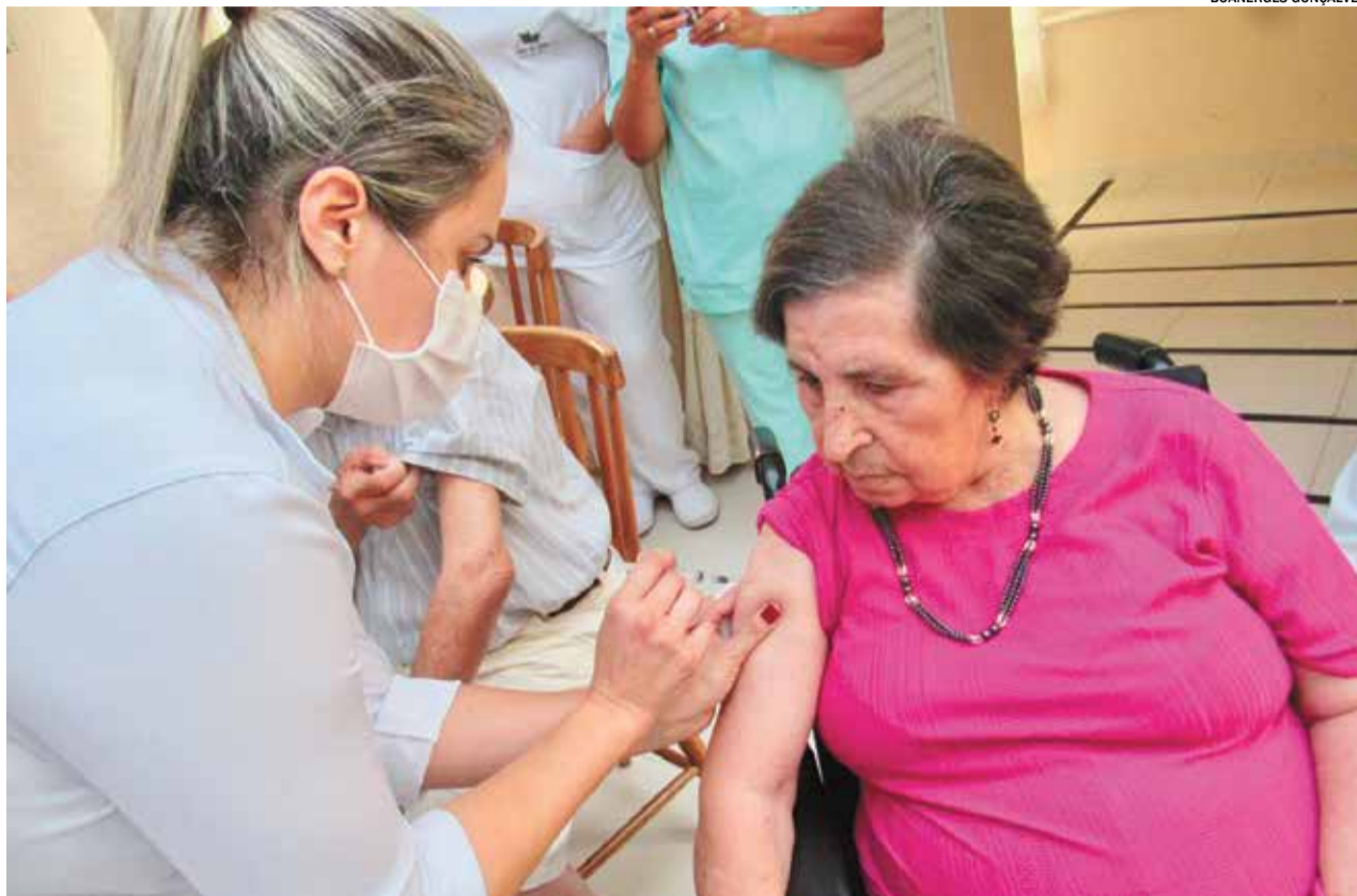
Idosos do Terça da Serra, Residencial Sênior foram imunizados nesta semana

Nesta sexta-feira (05) a imunização ocorre no estacionamento do Parque da Criança, localizado no Parque Ecológico, das 17h às 20h. Já no sábado (06) esse público poderá se imunizar no Derefim (Av. Eng. Fábio Roberto Barnabé, 6271) e Espaço Bem Viver (Av. Engenheiro Fábio Roberto Barnabé, nº 3969, Vila todos os Santos) das 8h