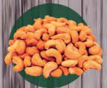
Castanha do caju quebrada R$6,90 - 100g