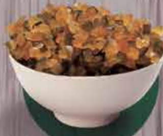
Frutas cristalizadas R$ 1,50/100gr