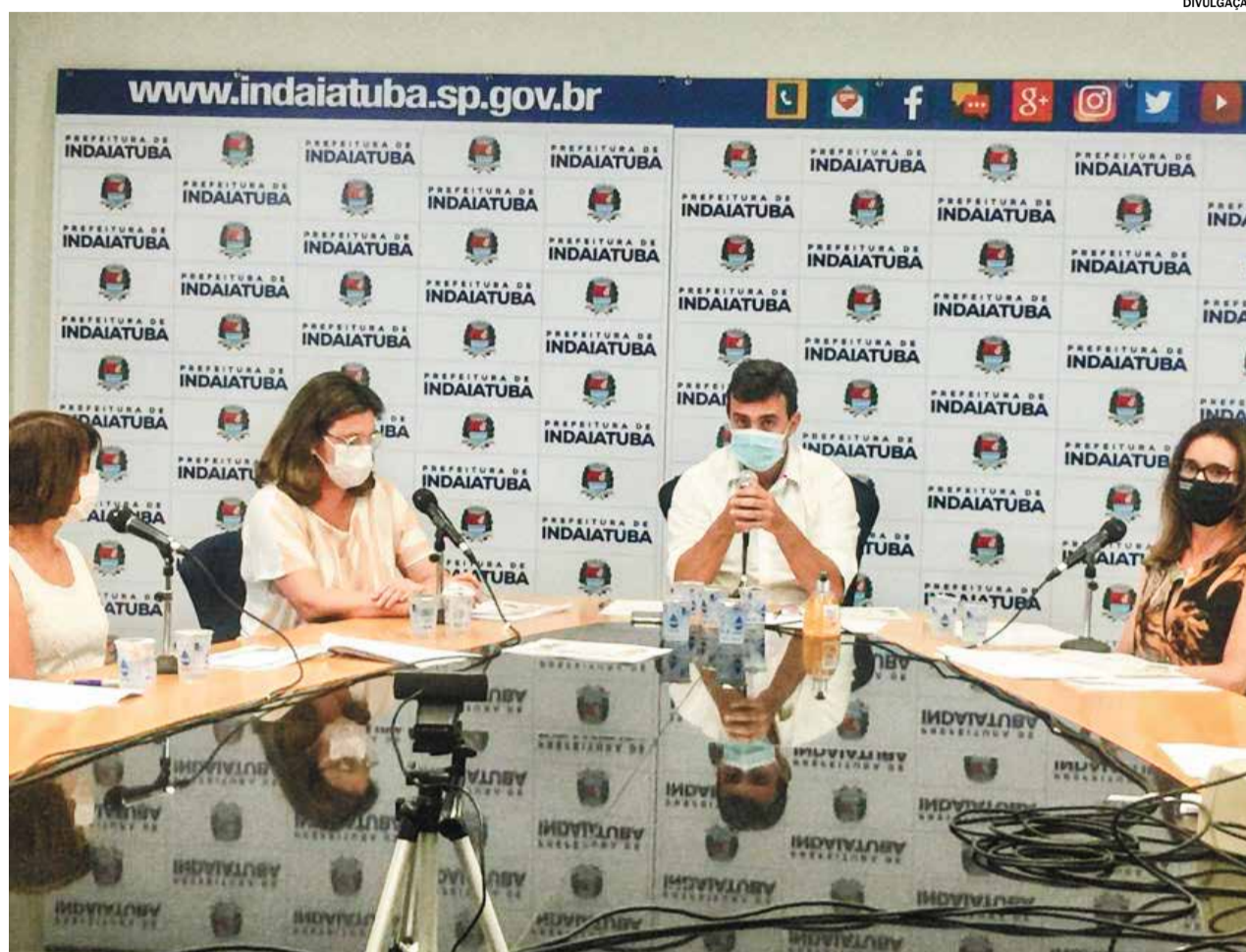
O retorno às aulas presenciais foi anunciado em live realizada nesta quarta-feira (08) pela Prefeitura de Indaiatuba

De acordo com a Secretaria Estadual de Educação, enquanto a cidade estiver na fase vermelha ou laranja do Plano SP, o retorno às aulas presenciais fica a