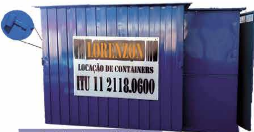
Container desmontável c/ ou s/ banheiro