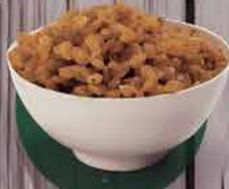
Uva passa branca Importada R$3,00 - 100g