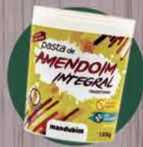
Pasta de Amendoim integral Mandubim R$17,50 - 1Kg