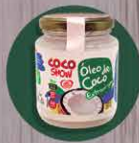
Óleo de Coco Coco Show Extra virgem R$14,80 - 200ml