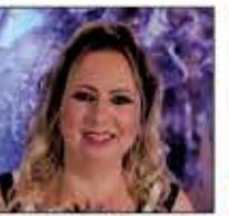
Alessandra Barbieri Fotógrafa New Born