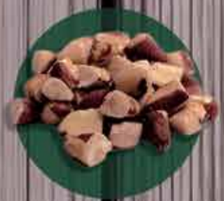
Castanha do pará quebrada R$5,10 - 100g