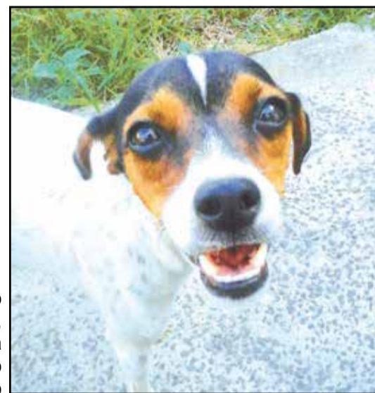
O lindo Antônio, mascote da Clínica Bicho Amigo

A La Mer Blanc está fazendo o maior sucesso com sua roupa fashion para todas as idades, inclusive plus size. Conheça a coleção no www.lamerblanc.com.br , Facebook/lamerblanc, no Instagram: lamerblanc ou por e-mail contato@lamerblanc. WhatsApp: (19) 9.8881-1353. Roupas com perfeito acabamento e caimento impecável. Você vai adorar!