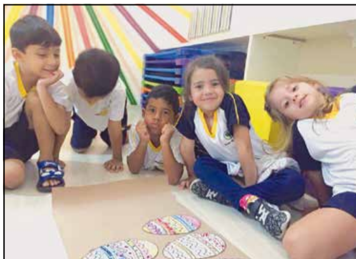
Os alunos da Escola Alves de Oliveira/Lápis na Mão se divertindo na aula de desenho