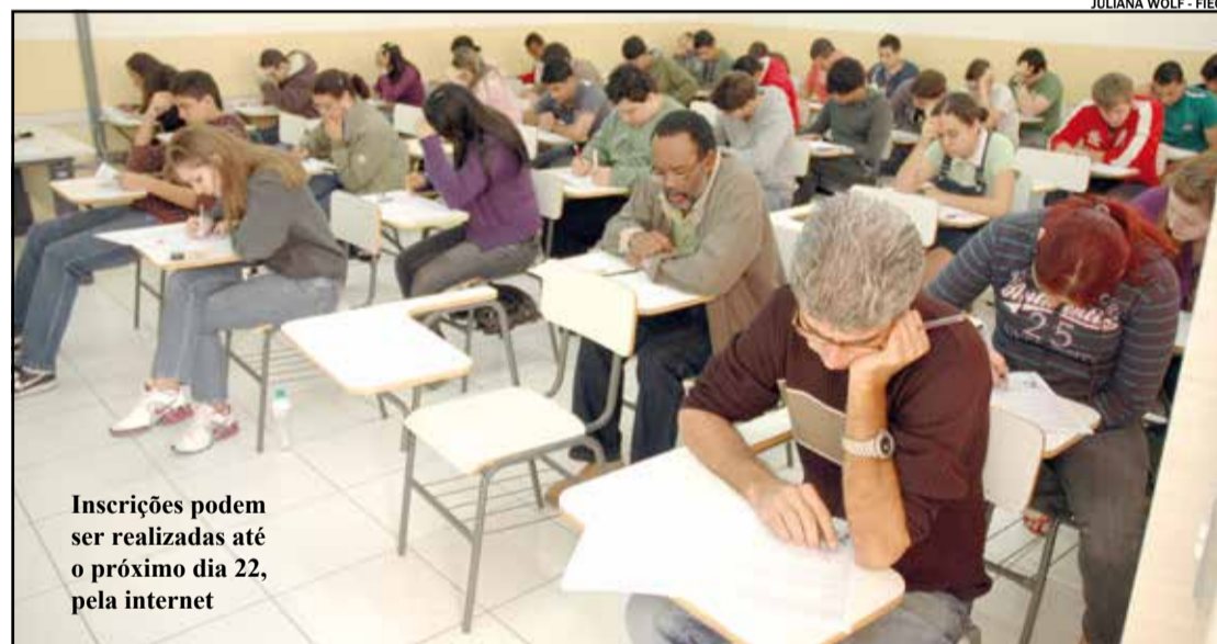
Inscrições podem ser realizadas até o próximo dia 22, pela internet

A Fundação Indaiatubana de Educação e Cultura (Fiec) abre as inscrições para o Vestibulinho do 2º Semestre para os cursos de Educação Profissional Técnica de Nível Médio.