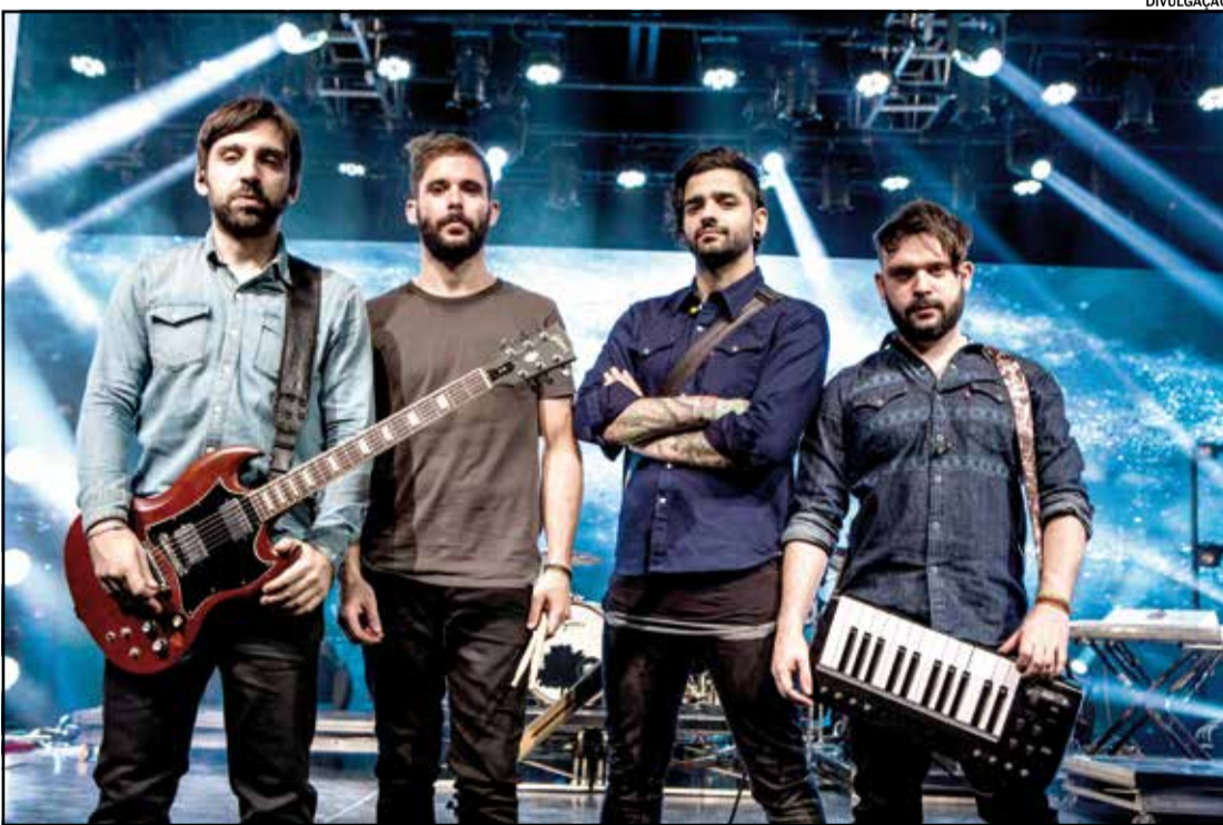
O grupo de pagode Exaltasamba e a banda de rock Fresno têm shows confirmados em Indaiatuba, durante a Virada Cultural Paulista 2017. Sobem ainda no palco Kleyton e Kledir e As Bahias e a Cozinha Mineira. O evento, gratuito, acontece nos próximos dias 13 e 14. Pág. 11