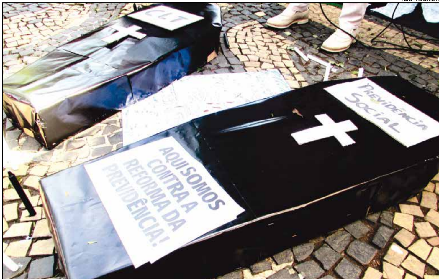
Criatividade foi o que não faltou durante o evento realizado na praça Prudente de Moraes, na sexta-feira, dia 28 de abril, durante o movimento nacional contra as reformas Trabalhista e da Previdência. A manifestação contou com a presença de alunos, professores e de outras frentes sindicais.