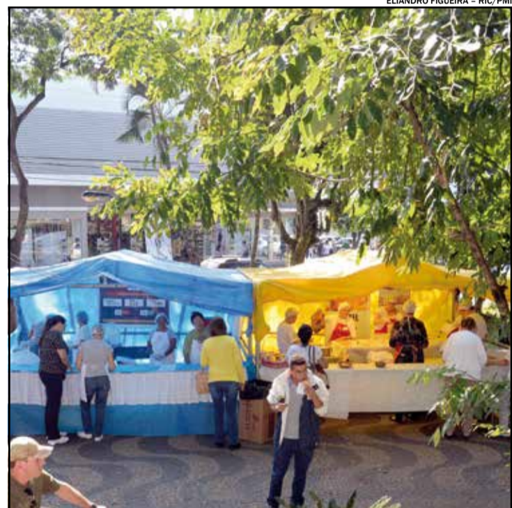
Ação Solidária acontece no próximo dia 12 de maio na praça Prudente

Os serviços municipais participantes são Funssol, os Centros de Referência a Assistência (Cras), Social dos bairros Parque Corolla, Jardim Oliveira Camargo, Jardim São Conrado e Jardim Brasil; Projeto Gente Eficiente e Orquestra Viola Caipira.