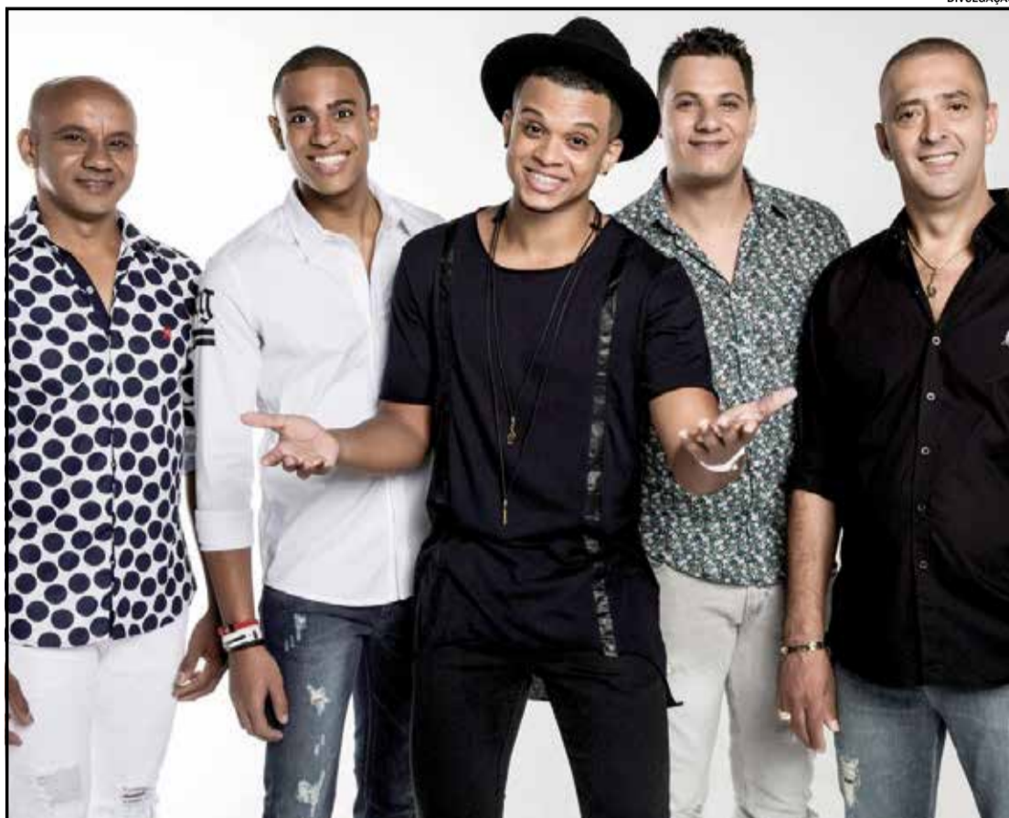
Exaltasamba será uma das atrações confirmadas na Virada Cultural Paulista no palco em Indaiatuba

Mogi das Cruzes conta com a animação de Filipe Ret, Daniela Mercury, Xaxado Novo e Arnaldo Antunes. Santa Bárbara D'Oeste recebe Rael, Lenine, A Banda Mais Bonita da Cidade e Marina Lima. No mesmo final de semana São