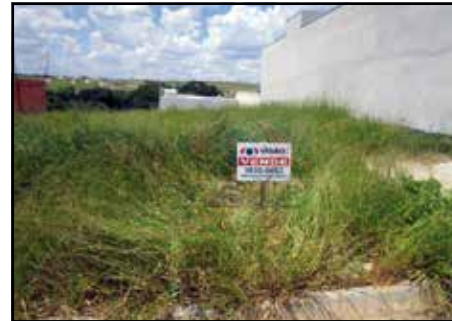
ref. site 035591 Terreno com 150 m 2 sendo 7.5 m de testada R$115.000,00