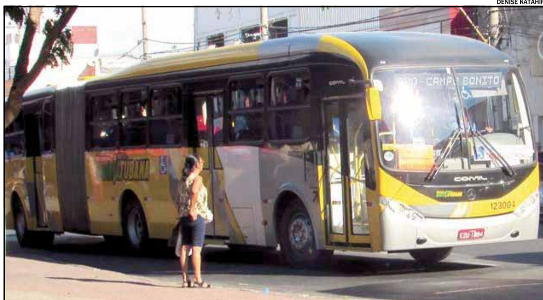
VB Transportes confirma investimento na cidade e garante ônibus novos ainda este mês

Os 20 veículos serão equipados com chassis Mercedes-Benz, todos terão elevadores e são adaptados para transporte de pessoas com necessidades especiais. Dotados de motores eletrônicos de acordo com a legislação ambiental Euro 5, emitirão baixíssimos níveis de gases e particulados na atmosfera.