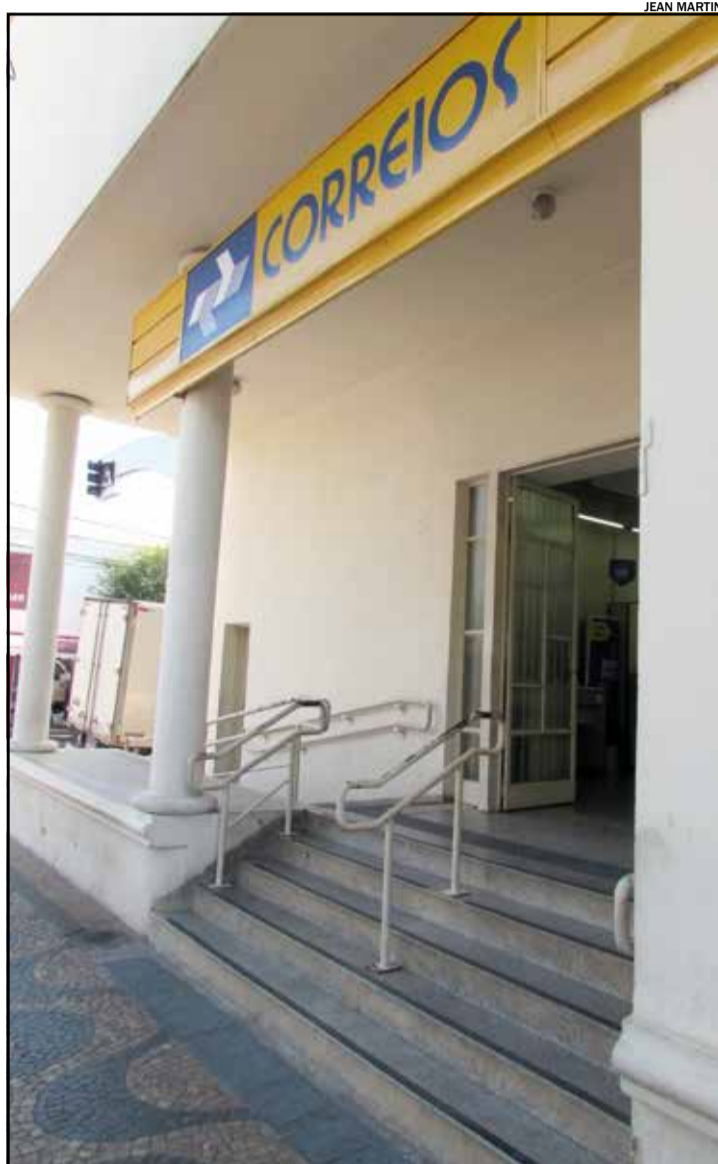
Serviços com hora marcada estão indisponíveis nas agências dos Correios

“A empresa continua irredutível em suas ações, que tem como intuito desmantelar a empresa através de um discurso contestável de crise financeira, baseada em números manipulados”, explica. “Querem jogar o peso desse déficit em cima dos trabalhadores através de programa de demissão voluntária, falta de concurso público para a contratação de mão de obra efetiva, falta de investimento na infraestrutura operacional da empresa, suspensão das férias, a partir de maio até