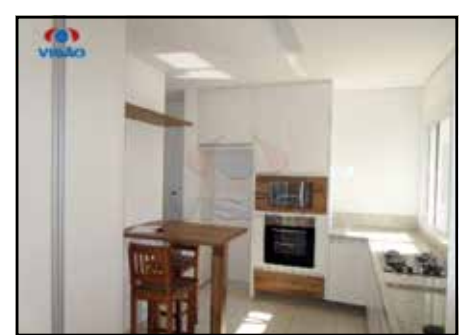
ref. site 868091 Jardim dos aromas 4 dormt / 1 suíte / 2 wc / coz / 3 salas / churras / R$640.000,00

Compre-se carteira de imóveis. Mais informações F. (19)9.8408-0002