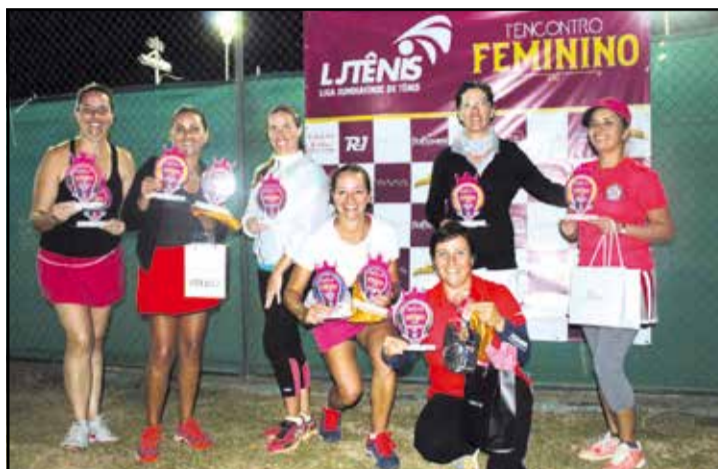
Equipes campeãs do 1º Torneio Feminino da Liga Jundiaense de Tênis que aconteceu no Clube 9 de Julho