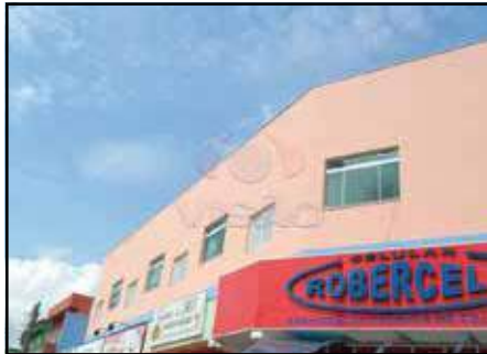
ref. site 1247 Jd. Morada do Sol - 1 dorm / sala / coz / wc / as. R$ 680,00 + IPTU + R$ 30,00 ( taxa de limpeza)