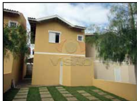
ref. site 514691 Residencial Flamboyant 3 dorm/1 suíte/sala/ lav/ coz /lavad/ jardim/2 vagas de garagens R$360.000,00