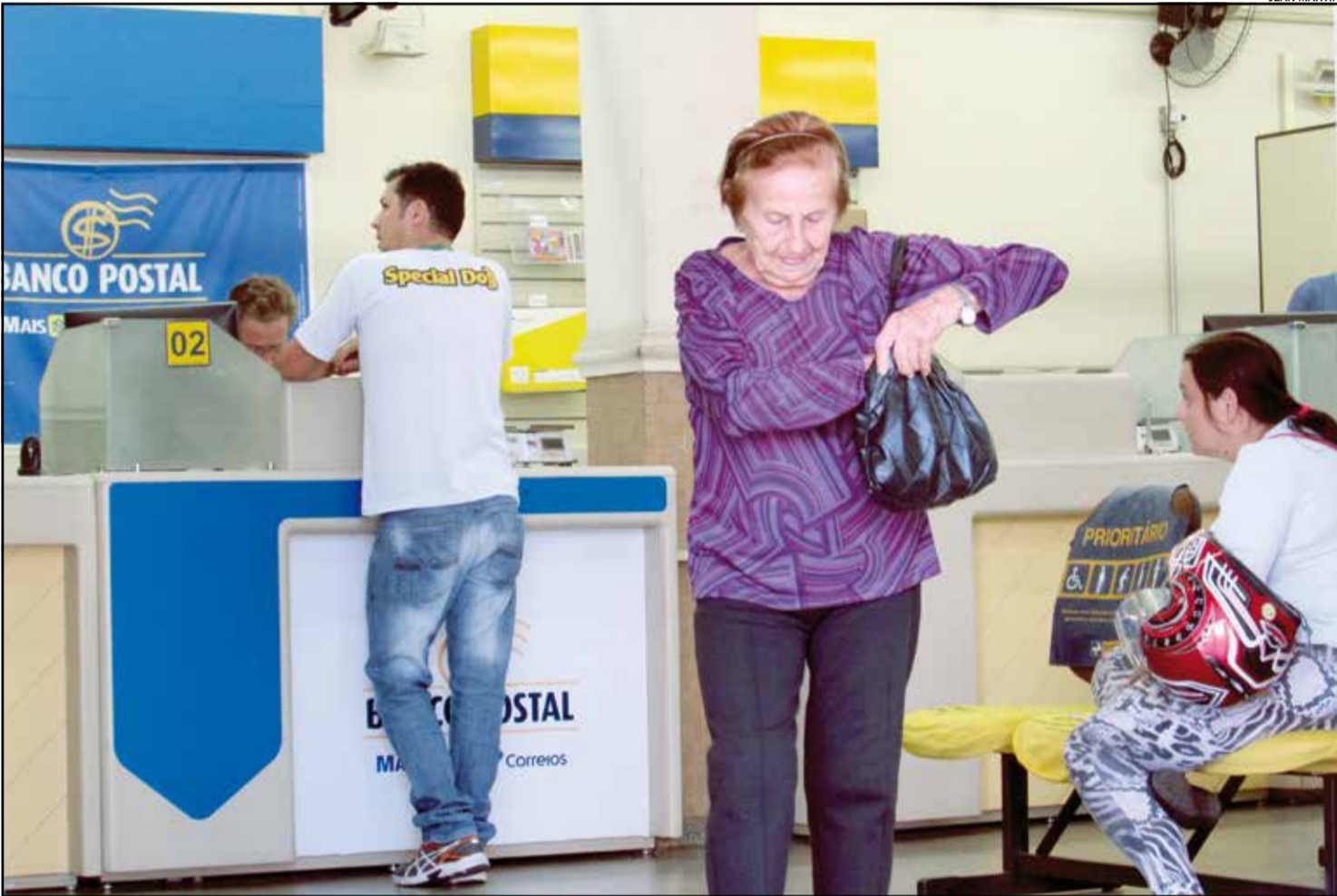
A greve dos funcionários dos Correios, inclusive das agências de Indaiatuba, completa uma semana. Segundo o Sindicato dos Trabalhadores dos Correios de Campinas (Sintect-CAS), a paralisação é por tempo indeterminado. Pág. 03A