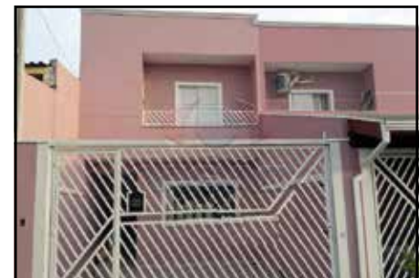
ref. site 706361 Jd.alice 3 dorm.(suíte) / sala / lavabo / coz. / copa / wc / as / portão elet. / gar.2 vagas R$410.000,00