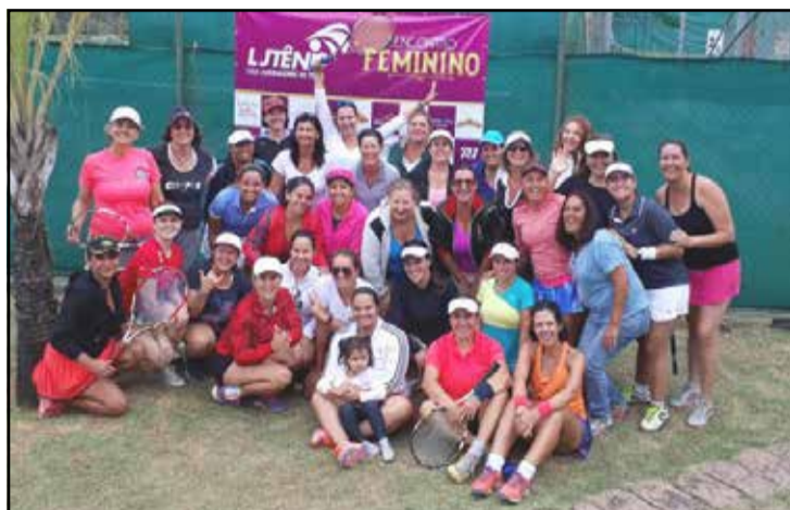
1º Torneio Feminino da Liga Jundiaense de Tênis reúne 32 tenistas no Clube 9 de Julho