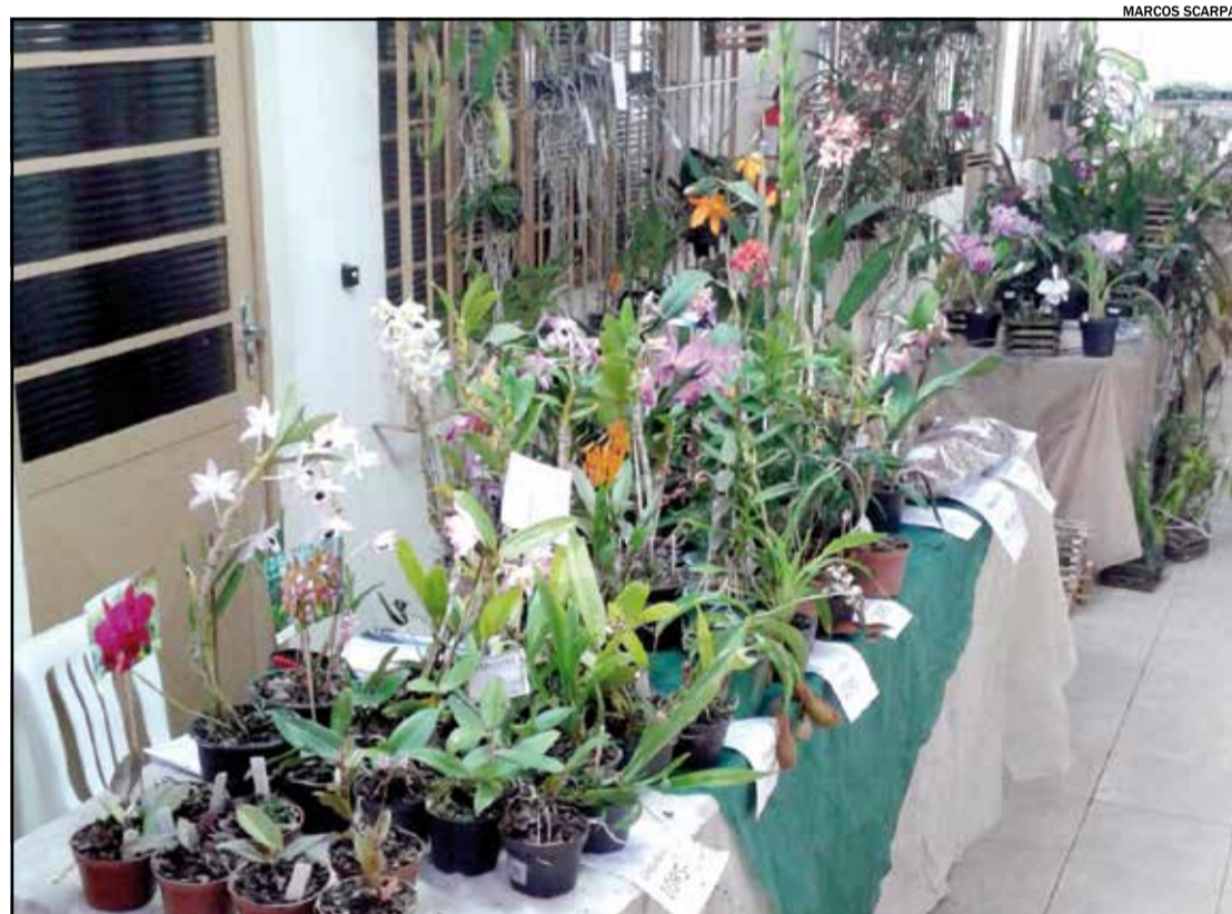
Feira de Orquídeas conta com mais de 400 tipos de plantas e estará disponível até 14 de maio

O Orquidário Fral realiza no Shopping Jaraguá a Feira de Orquídeas do Dia das Mães. O evento acontece até o dia 14 de maio, das 10h às 22 horas, com entrada gratuita.