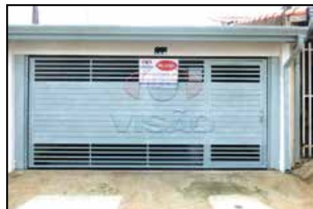
ref. site 772691 - 3 dormitórios / 1 suíte / sala / cozinha / wc / lavanderia / 2 gar R$1.350,00 +IPTU.