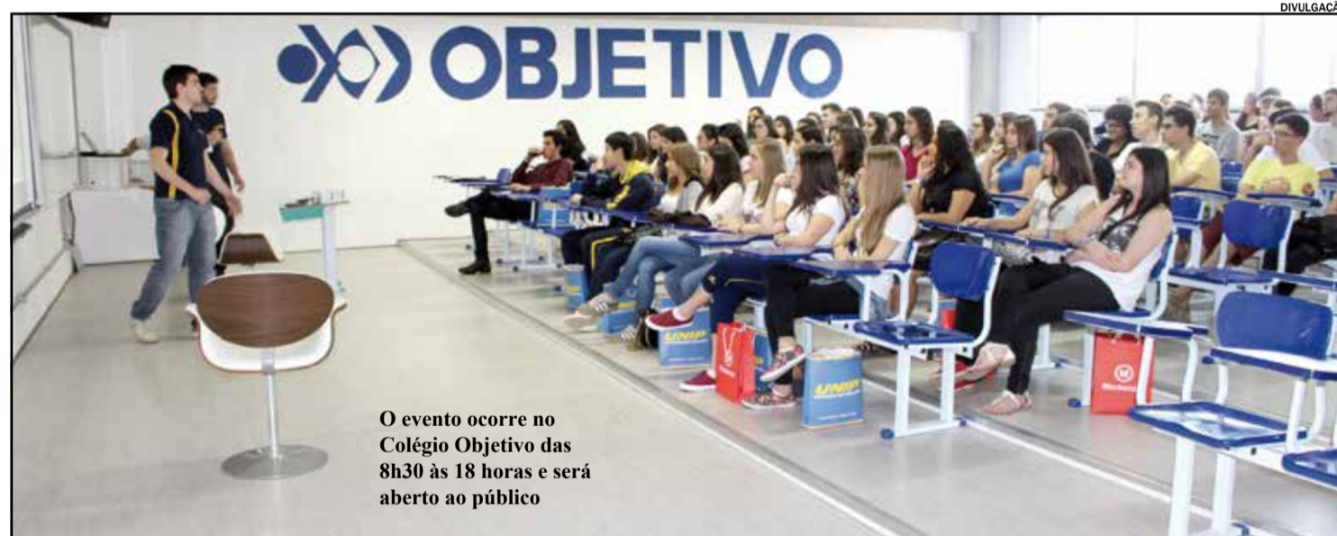
O evento ocorre no Colégio Objetivo das 8h30 às 18 horas e será aberto ao público

O Colégio Objetivo em parceria com a Congesa e a Fiec realizam no próximo dia 13, o 2º Fórum e Feira de Profissões. O evento será no Colégio Objetivo das 8h30 às 18 horas e será aberto ao público.