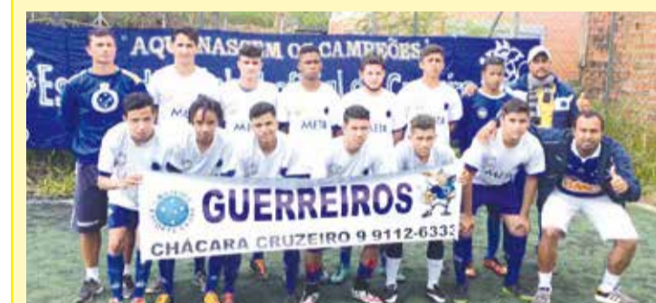
Equipe Sub-17, da Escola de Futebol Oficial do Cruzeiro, em recente Copa da Amizade