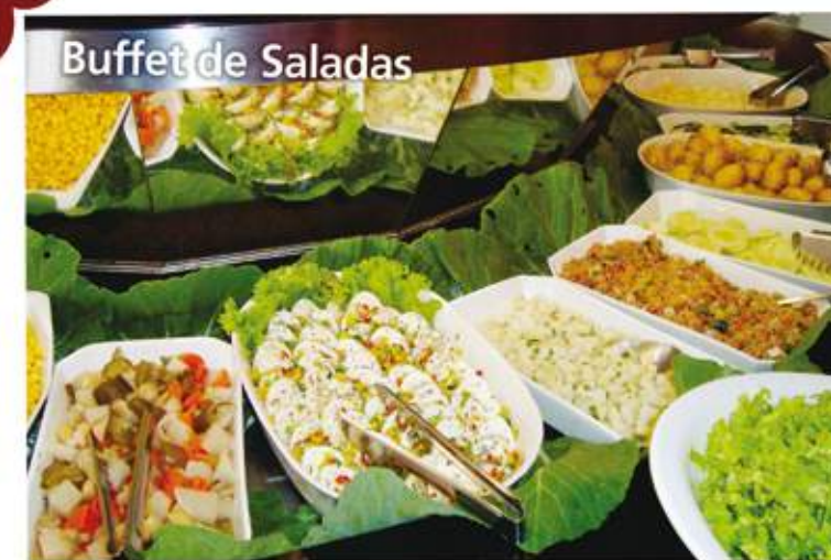
Buffet de Saladas