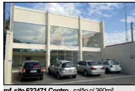
ref. site 632471 Centro - salão c/ 360m 2 (12x30) mezanino de 12m 2 + 2wc / 2wc duplos terreo (masc./fem.) / wc p/ deficiente / coz. / area ext.fdos. / recuo 4 vagas. R$ 6.500,00 + IPTU