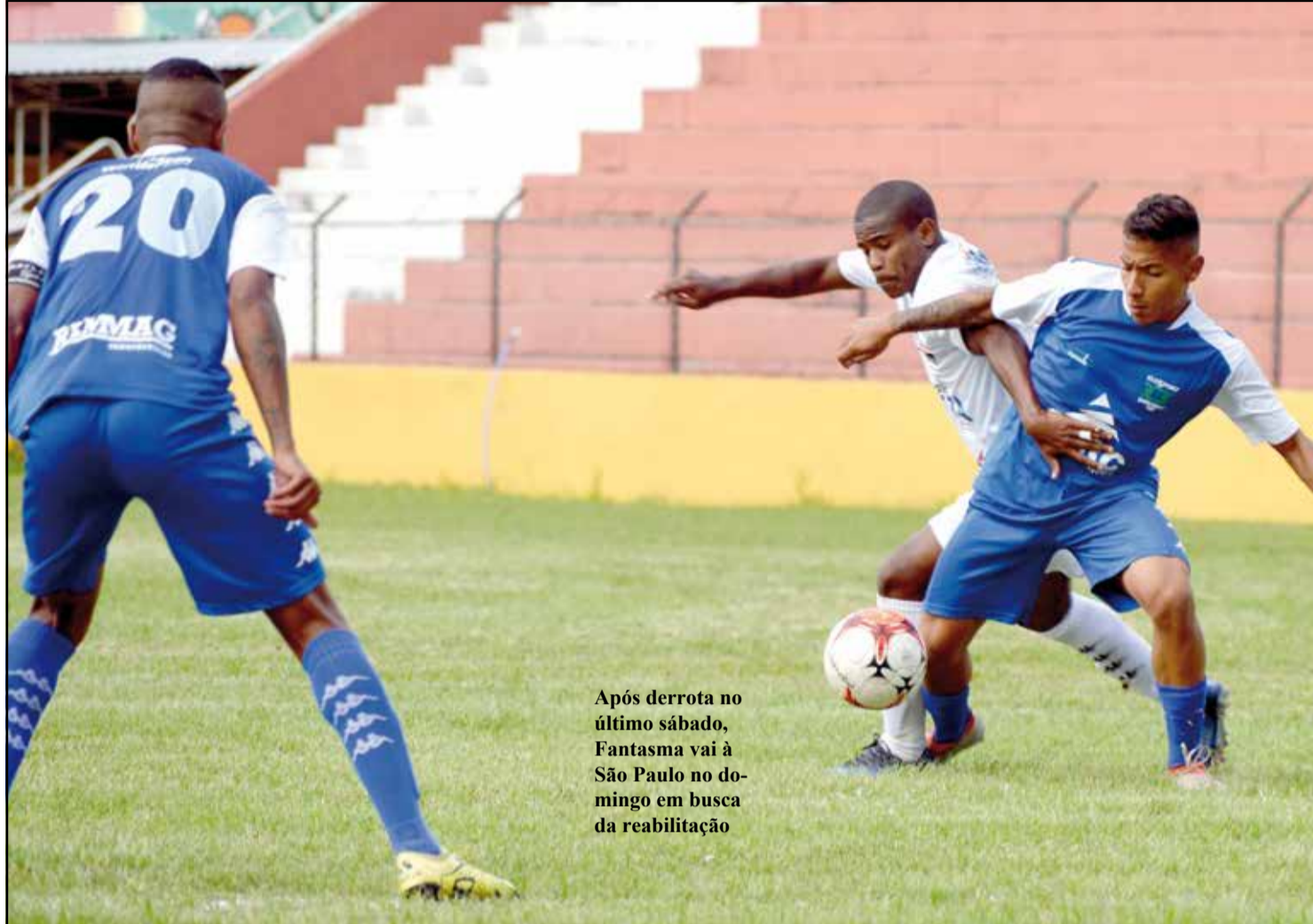
Após derrota no último sábado, Fantasma vai à São Paulo no domingo em busca da reabilitação

JEAN MARTINS maisexpressao@maisexpressao.com.br