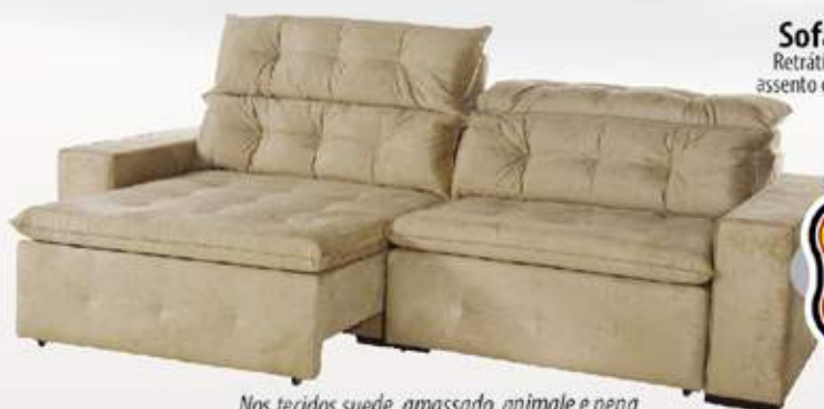
Nos tecidos suede, amassado, animale e pena.

Sofá CREMONA Retrátil e Reclinável - 2,50 assento com pillow top e mola