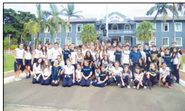
Alunos dos 7ºs anos do Objetivo durante visita ao 28º Batalhão de Infantaria Leve do Exército em Campinas