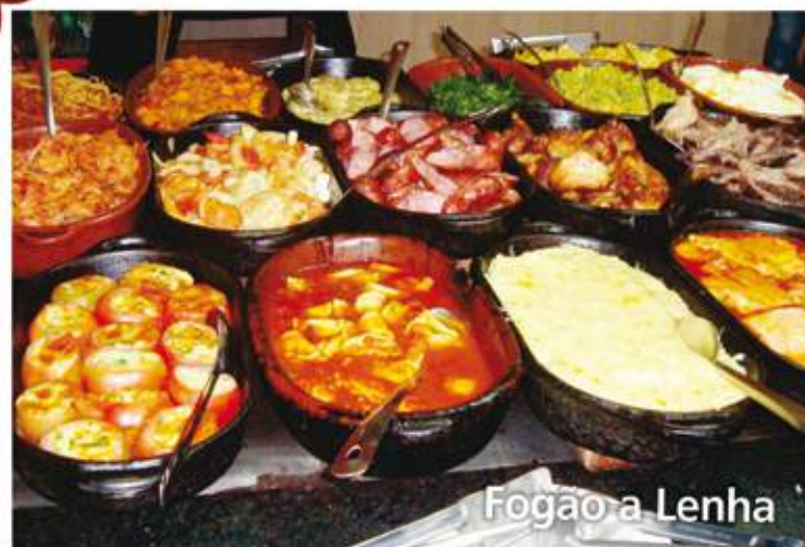
Fogão a Lenha