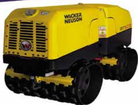
ROLO COMPACTADOR TELEGUIADO RT 82 SC2