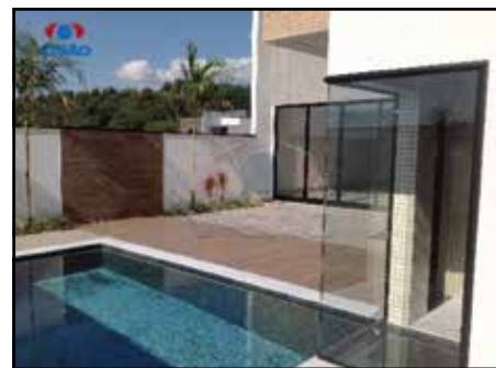
ref. site 786191 Res. duas Marias 5 dormt / 4 suítes / 2 salas / 7 wc / 3 gar coberta / 2 descoberta / churras / piscina R$1.700.000,00