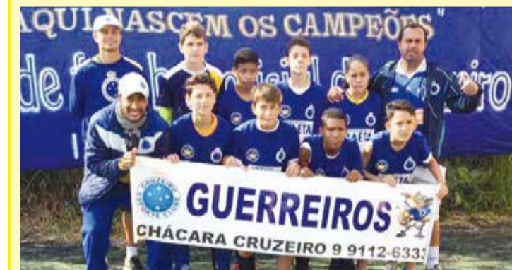
Time Sub-13, da Escola de Futebol Oficial do Cruzeiro, durante a disputa da Copa da Amizade