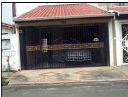
ref. site 747671 3 Dorm.(Suíte) / Sala / Coz. / Wc / As / Chur. / Portão Elet. / Gar.2 Vagas. R$ 320.000,00