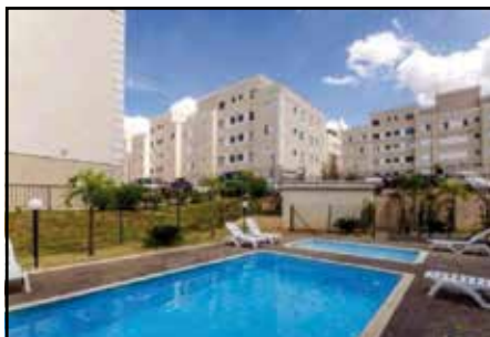
ref. site 493691 Spazio Illuminare - 2 dormt/sala 2 amb/ coz/ wc social/ lavan/ 1 gar R$950,00 IPTU e Cond incluso.