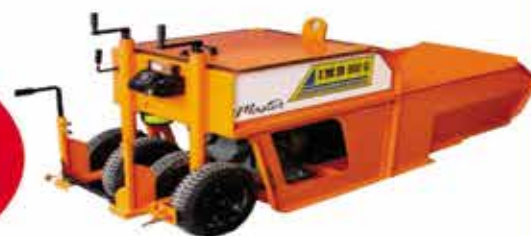
MÁQUINA PARA FAZER GUIAS E SARJETAS