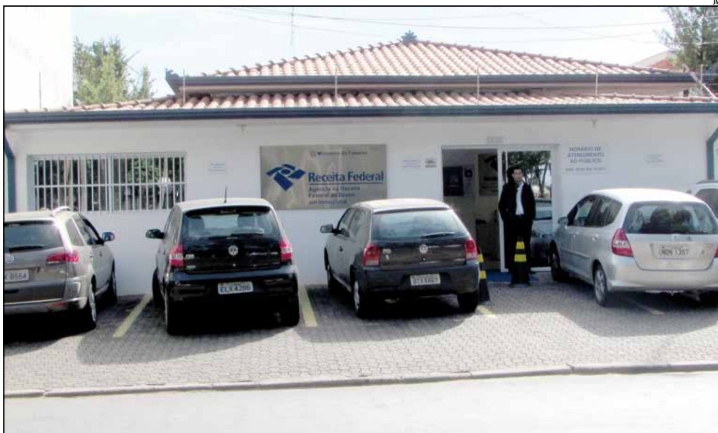
Número de declarações em Indaiatuba superou expectativa da Receita Federal; prazo para envio sem multa terminou na última sexta-feira

Mais de 54 mil declarações, de contribuintes locais, foram enviadas à Receita Federal