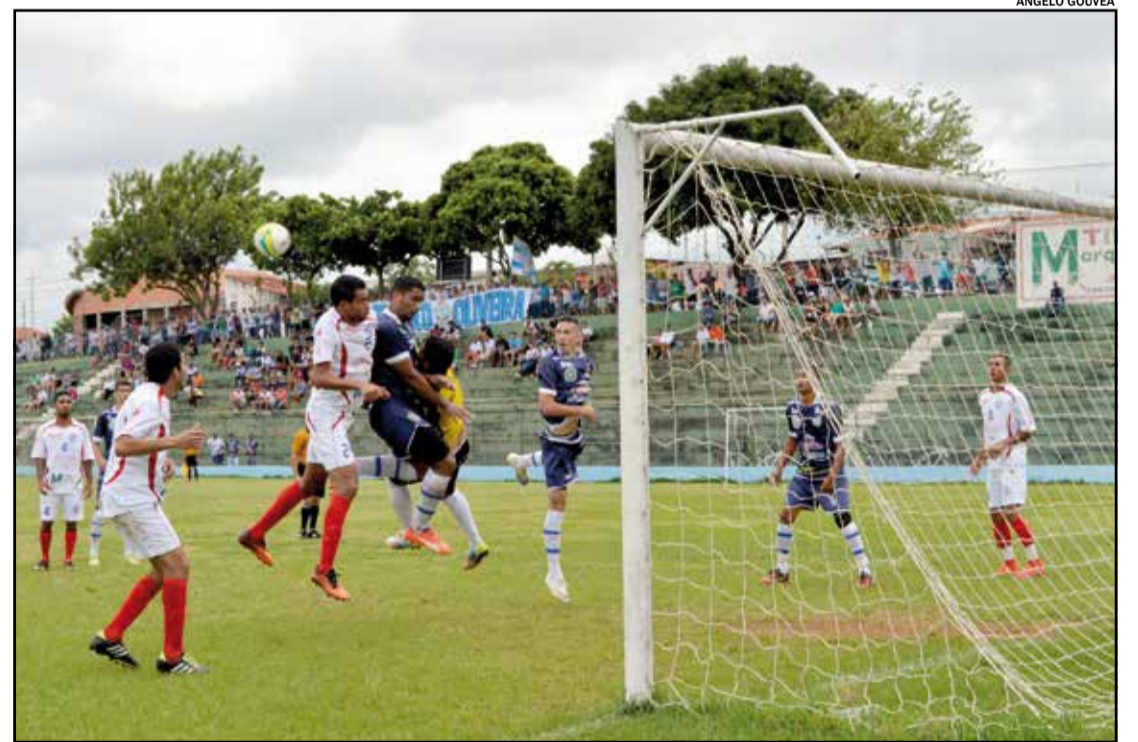
Já estão definidos os confrontos das nove rodadas da primeira fase da 1ª Copa Integração de Futebol Amador. O campeonato, que começa no próximo dia 21, reunirá times da Aifa e Lidi após mais de dez anos de "separação". Pág. 09