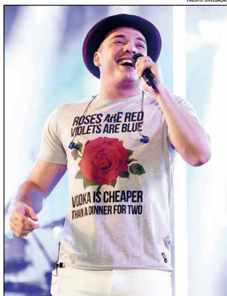
Wesley Safadão subirá ao palco da Faici em agosto

Segundo organizadores, festa contará com dois camarotes e uma Pista Vip