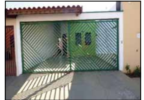
ref. site 62141 Vila Pires da Cunha - 3 dorm / sala / coz / wc / lav / 2 gar - R$ 1.200,00 + IPTU