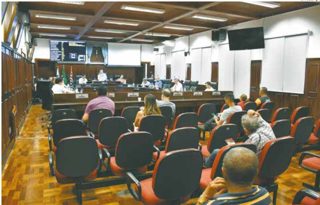
Segundo o PL, foram mais de 27% de faltas em consultas pediátricas e mais de 26% em ginecológicas

O vereador justificou seu projeto com base em dados alarmantes de ausências em consultas médicas na região. Segundo informações da Secretaria Municipal de Saúde, foram registradas 2.722 fal-