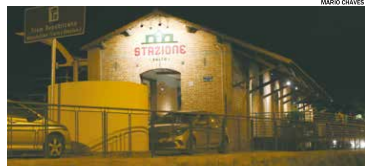
A programação está prevista para começar às 18h30 e terminar às 23h

• 29/05 - Dia da Energia | Subestação do Museu Classificação das atrações: livre Informações: Telefone: (11) 2429-3530, WhatsApp (11) 94805-4429 ou e-mail itu@museuda-energia.org.br