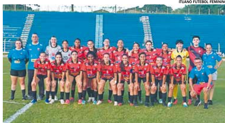
As rubro-negras avançam para a Fase Final Estadual da competição

Já a equipe sub-15 disputou, no último domingo, dia 5, campo pela terceira rodada do Campeonato Paulista Sub-15. Na ocasião, as rubro-negras conquistaram sua primeira vitória da competição. A equipe entra em campo novamente, no dia 19 de maio, no Tatizão.