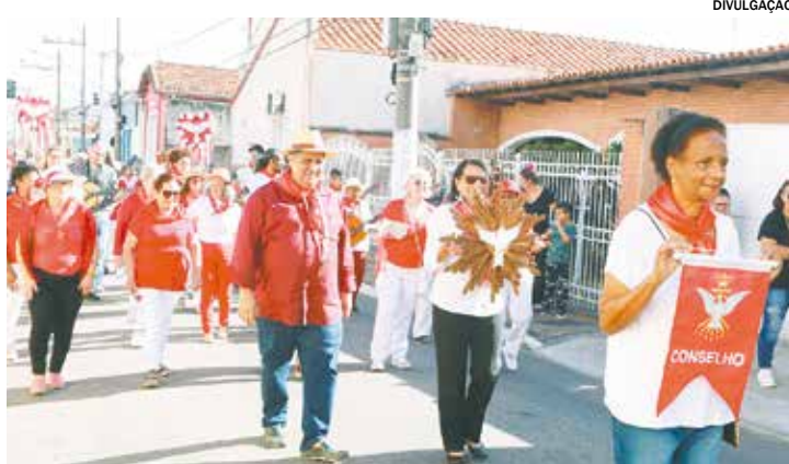
O Desfile ocorre sempre sete semanas após o domingo de Páscoa

Esta é uma tradição com mais de sete séculos de existência e, neste ano, tem como tema: Fraternidade e Amizade Social, “Vós sois todos ir-