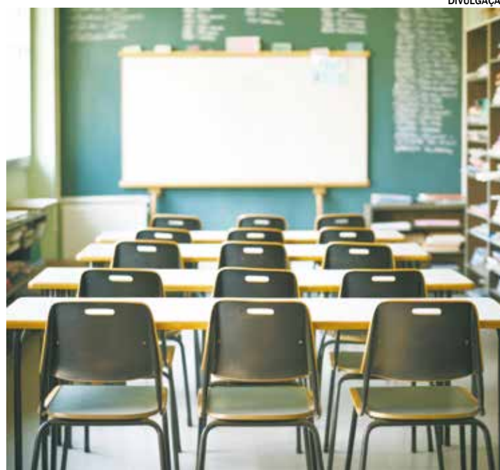
Baixa remuneração e violência em sala de aula são os principais obstáculos

Apesar dos desafios, a pesquisa indica que a maioria