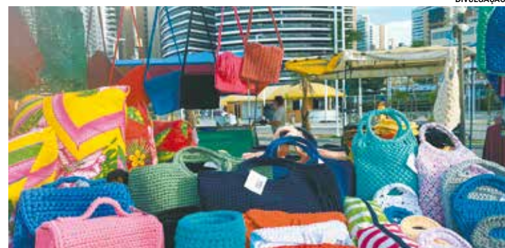
O evento, que é gratuito, ocorre das 10h às 21h, no Mercado Municipal

Local: Mercado Municipal - Praça da Bandeira, 104, Centro Data: Sexta e Sábado das 10h às 21h Evento gratuito