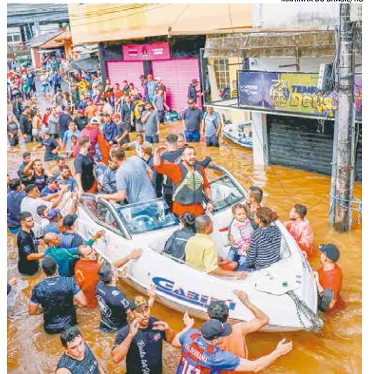
Chuvas devastam o Estado, provocando mais de 100 mortes

Endereço: R. Arquiteto Márcio João de Arruda, 350 - Jardim Rosinha, Itu. Tele-