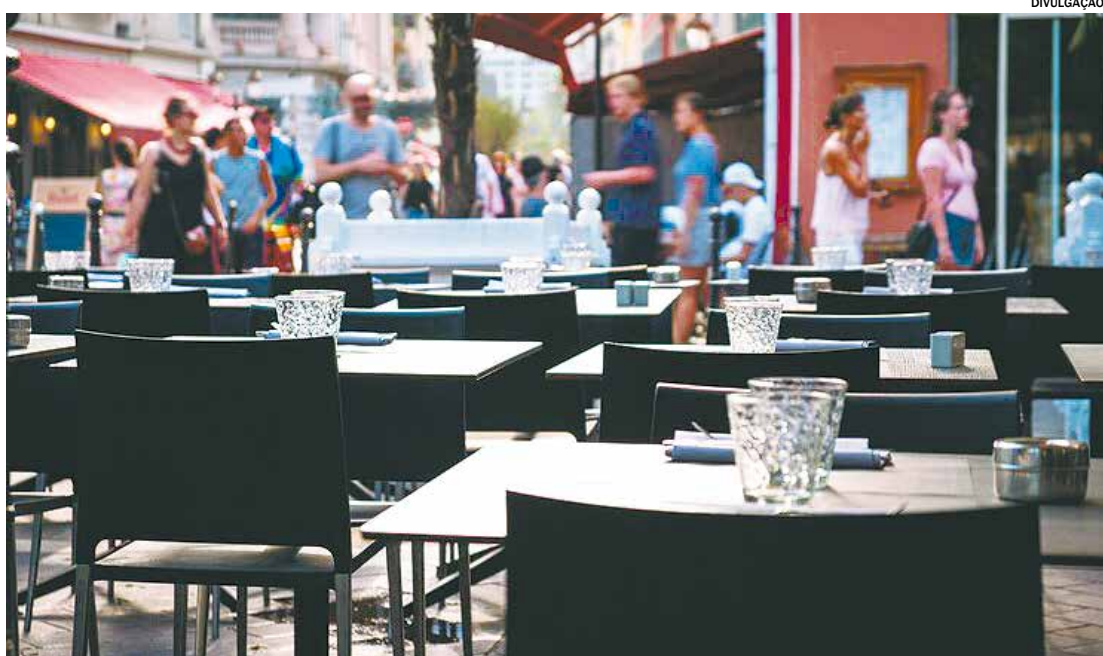
Segundo pesquisa, 77% dos estabelecimentos planejam abrir as portas no segundo domingo de maio

Esses números refletem uma recuperação gradual do setor, com uma diminuição nos prejuízos e uma melhoria nas vendas, especialmente em março. O percentual de empresas operando no vermelho caiu de 31% em fevereiro para 25% em março. Além disso, houve uma