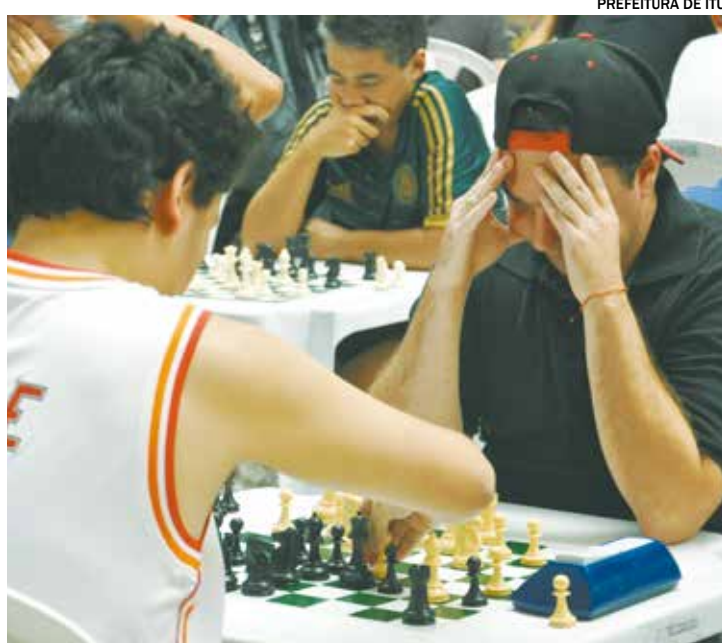
II Festival Ituano de Xadrez será realizado no dia 26 de maio a partir das 9h

O II Festival Ituano de Xadrez será realizado no próximo dia 26 de maio, a partir das 9h, no Plaza Sho-