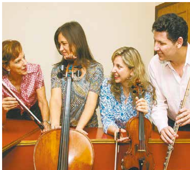
La Follia encerra o evento logo mais às 20h no Espaço Cultural Almeida Júnior

A 3ª Semana da Conscientização Turística em Itu chega ao seu último dia nesta sexta-feira (10), trazendo uma série de eventos especiais para celebrar o turismo e a cultura local.