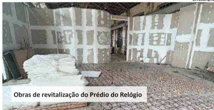
Obras de revitalização do Prédio do Relógio