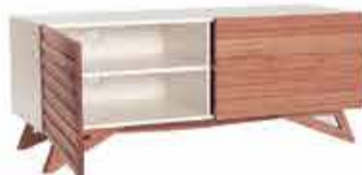
Rack Freddie várias medidas a partir de R$ 669,59 no PIX