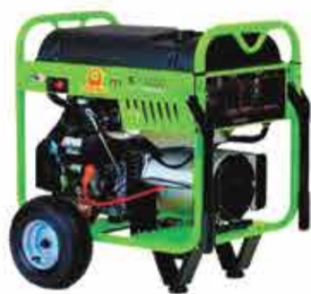
Gerador de energia