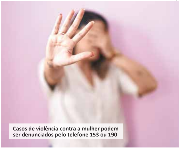
Casos de violência contra a mulher podem ser denunciados pelo telefone 153 ou 190

O crime de violência doméstica é uma ocorrência difícil de lidar, principalmente pelo fato do constrangimento da vítima, que muitas vezes tem dificuldades em pedir ajuda. Pensando em facilitar o atendimento destas pessoas, a Secretaria de Segurança Pública de Indaiatuba desenvolveu o aplicativo SOS Caminho das Rosas, com atendimento instantâneo, 24 horas, em qualquer dia da semana, como um botão de pânico.