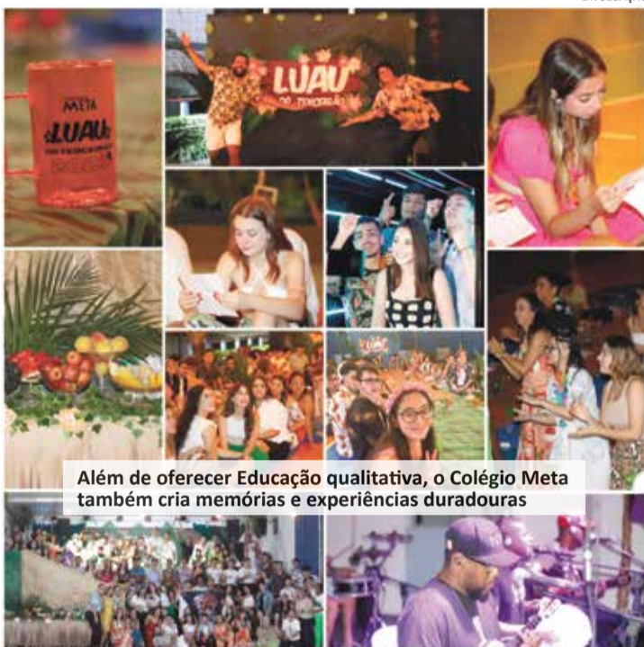
Além de oferecer Educação qualitativa, o Colégio Meta também cria memórias e experiências duradouras

A equipe do Colégio Meta não poupou esforços na organização. A decoração foi planejada com carinho, criando um ambiente acolhedor e encantador. A mesa de frutas e salgados deliciosos proporcionou um colorido especial à festa. Para tornar