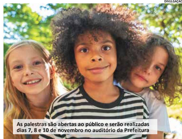
As palestras são abertas ao público e serão realizadas dias 7, 8 e 10 de novembro no auditório da Prefeitura

Os interessados devem se inscrever pelo site www.indaiatuba.sp.gov.br/assistencia-social/conselhos/cmdca/inscricoes-eventos/