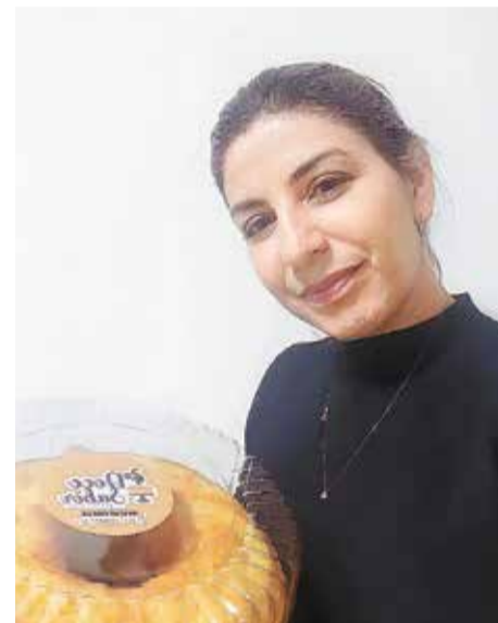
Priscila da PR Assessoria Codominal recebeu um bolo da Doce Sabor de boas-vindas!!