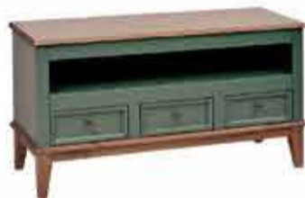
Rack Verde e Amendoa 1,14m de largura a partir de R$ 1.222,01 no PIX

Fotos meramente ilustrativas, produtos sujeitos a disponibilidade de estoque. Promoção válida para compras acima de R$ 99,99. Preços anunciados já com o desconto promocional, sujeitos a alteração sem aviso prévio.