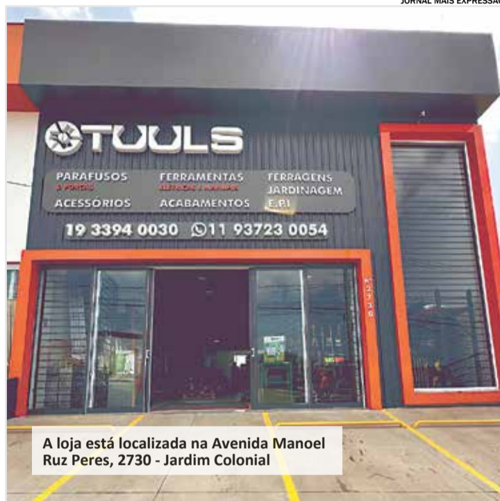
A loja está localizada na Avenida Manoel Ruz Peres, 2730 - Jardim Colonial

A Tuuls tem como bagagem a experiência no mercado Parafusos, Porcas, Arruelas, Fixadores em geral, EPI's, máquinas, produtos para Jardinagem, acessórios em geral, além de Ferramen-