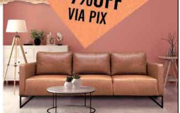
Sofá Petra 100% Couro - 2,2m de largura a partir de R$ 4.352,39 no PIX