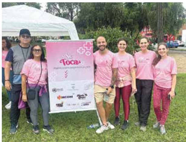
A HCON Engenharia apoia essa causa. Caminhada de Conscientização ao Câncer de Mama. Todo o valor arrecadado com a venda das camisetas será doado para o Volacc Indaiatuba. Realização: Felipe Ibiapina | Iza Iglesias | Thaisa Scheider Apoio: HCON Engenharia | Família Bonfini | FWA Academia | Cresci Perdi | Galocheme!!