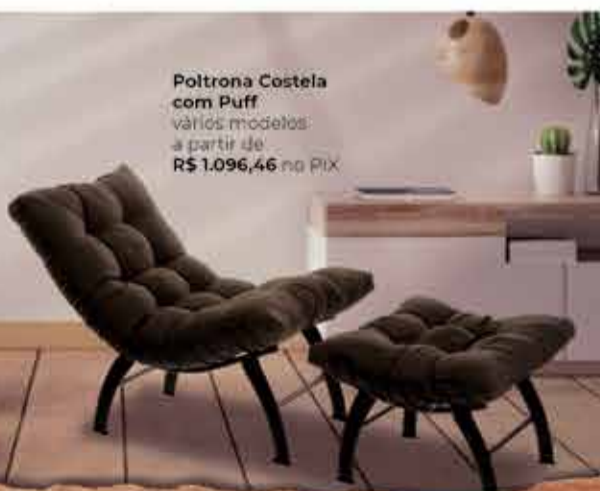
Poltrona Costela com Puff vários modelos a partir de R$ 1.096,46 no PIX

Fotos meramente ilustrativas, produtos sujeitos a disponibilidade de estoque. Promoção válida para compras acima de R$ 99,99. Preços anunciados já com o desconto promocional, sujeitos a alteração sem aviso prévio.