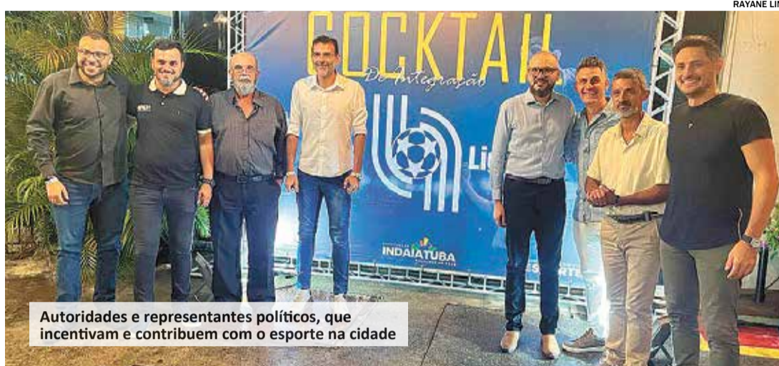
Autoridades e representantes políticos, que incentivam e contribuem com o esporte na cidade

Na Liga, existem mais de 170 times de futebol (campo e futsal) espalhados por Indaiatuba, atingindo um público de mais de 50 mil pessoas, que assistem