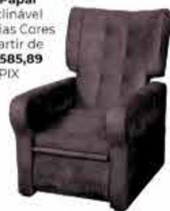
Poltrona do Papai Reclinável Várias Cores a partir de R$ 585,89 no PIX