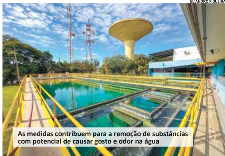
As medidas contribuem para a remoção de substâncias com potencial de causar gosto e odor na água

O Serviço Autônomo de Água e Esgoto (Saae) adotou medidas para aprimorar o processo de tratamento da água, entre elas: a implantação de dióxido de cloro nas Estações de Tratamento de Água I e III (Vila Avai e Pimenta) e a contratação de uma empresa especializada na implantação de sistemas de alta capacidade de dosagem de carvão ativado.