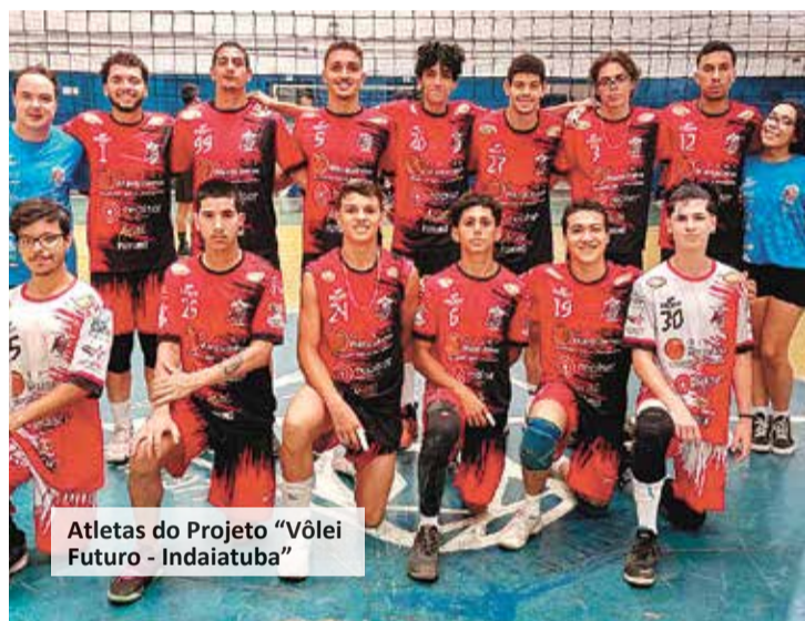
Atletas do Projeto “Vôlei Futuro - Indaiatuba”