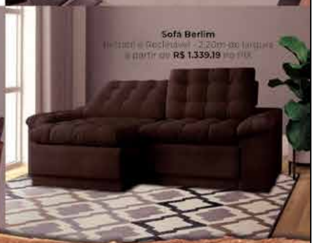
Sofá Berlim Retrátil e Reclinável - 2,20m de largura a partir de R$ 1.339,19 no PIX

openbox2oficial openbox2_oficial www.openbox2.com.br