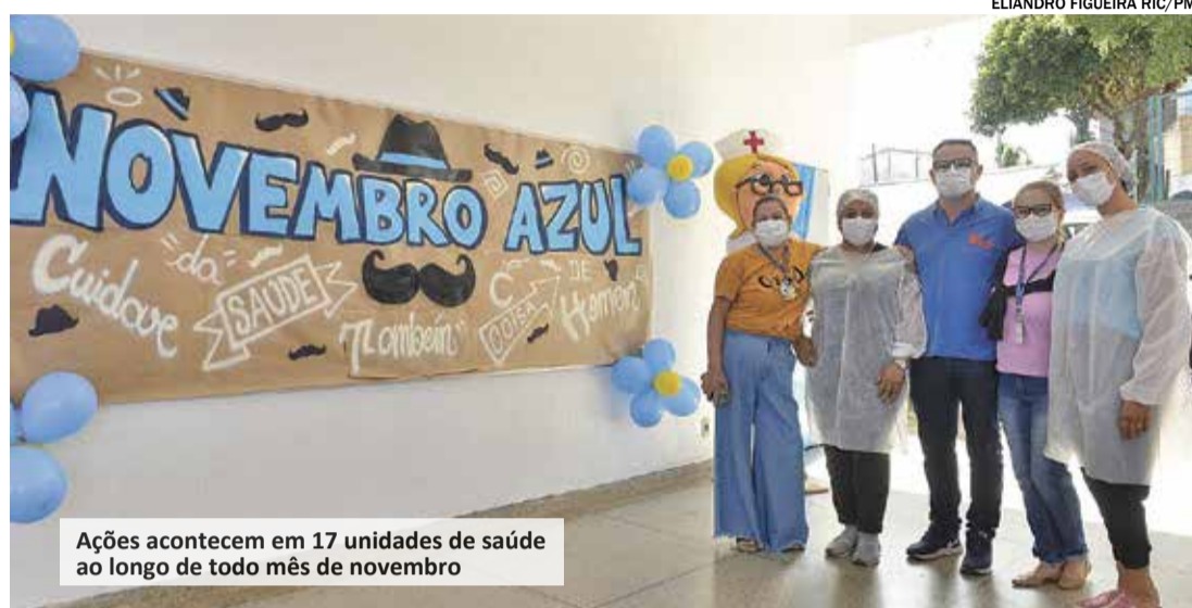
Ações acontecem em 17 unidades de saúde ao longo de todo mês de novembro