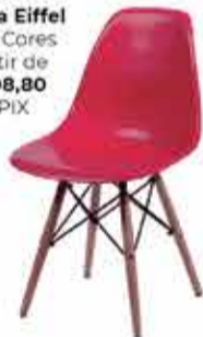
Cadeira Eiffel Várias Cores a partir de R$ 108,80 no PIX