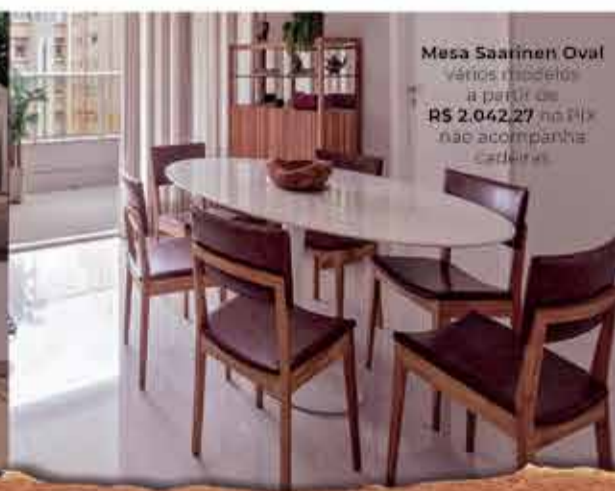
Mesa Saarinen Oval vários modelos a partir de R$ 2.042,27 no PIX não acompanha cadeiras