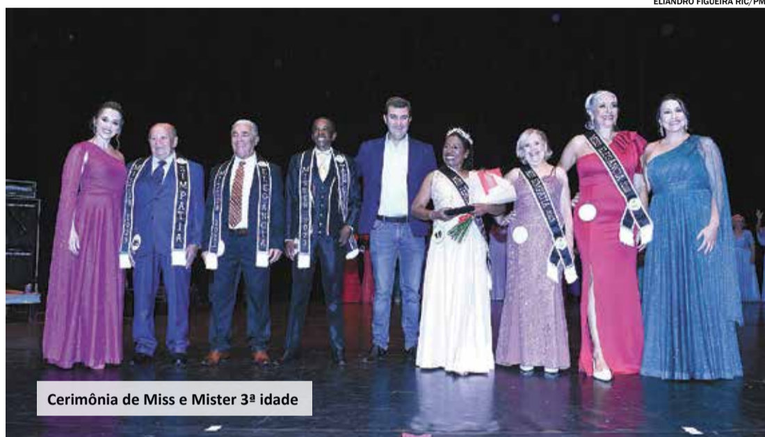
Cerimônia de Miss e Mister 3ª idade

Cerimônia de Miss e Mister 3ª idade aconteceu no sábado