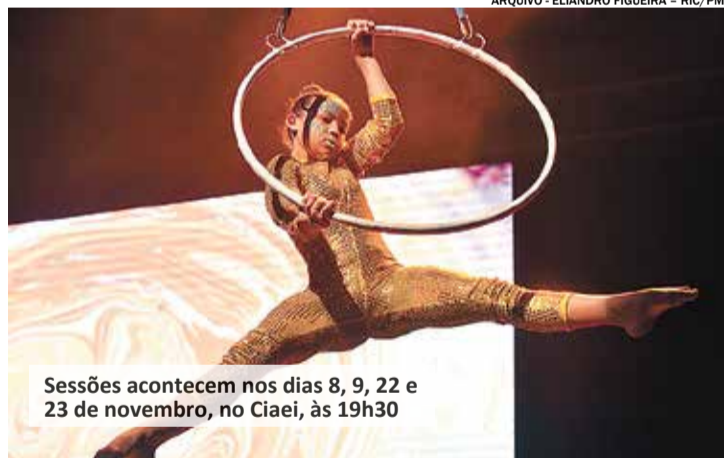
Sessões acontecem nos dias 8, 9, 22 e 23 de novembro, no Ciaei, às 19h30