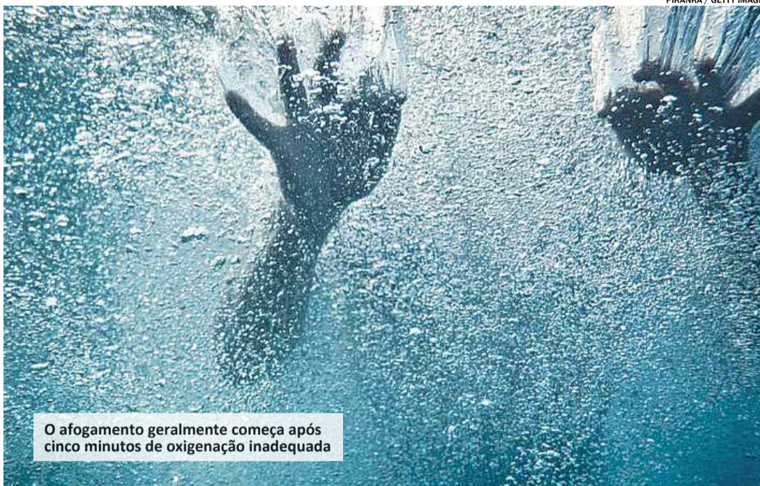
O afogamento geralmente começa após cinco minutos de oxigenação inadequada

No Brasil, o afogamento é a segunda maior causa de morte acidental de crianças e adolescentes, segundo dados do Ministério da Saúde. A Sociedade Brasileira de Salvamento Aquático (Sobrasa) alerta para o perigo de deixar crianças na faixa etária de 1 a 4 anos sem a supervisão de um adulto. Isso porque, de acordo com as estatísticas, 3% de todos os afogamentos ocorrem em piscinas e no entorno do lar. Crianças na faixa etária de 4 a 12 anos e que sabem nadar se afogam mais pela sucção da bomba em piscinas.