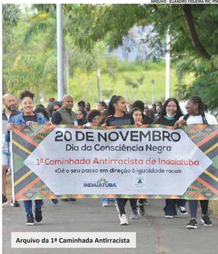
Arquivo da 1ª Caminhada Antirracista