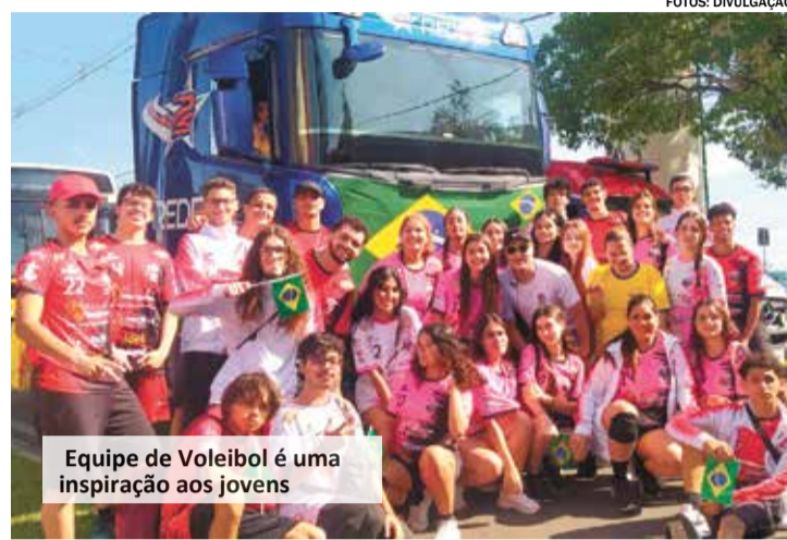
Equipe de Voleibol é uma inspiração aos jovens

Mais informações sobre o projeto pelo Instagram @voleifuturoindaiatuba ou pelo WhatsApp (19) 99209-3920