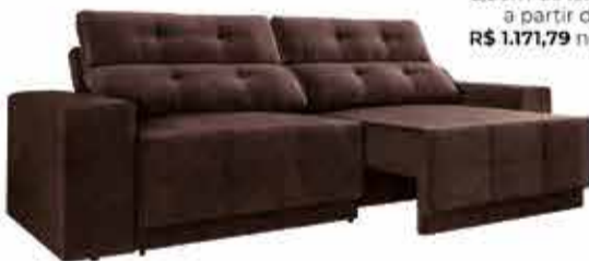
Sofá Puma Retrátil e Reclinável 2,30m de largura a partir de R$ 1.171,79 no PIX