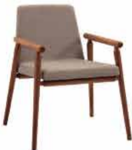
Poltrona Rodrigues Várias Cores a partir de R$ 920,69 no PIX