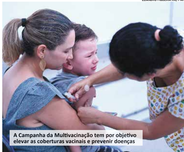
A Campanha da Multivacinação tem por objetivo elevar as coberturas vacinais e prevenir doenças