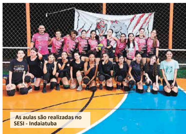
As aulas são realizadas no SESI - Indaiatuba