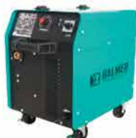
Máquina de solda