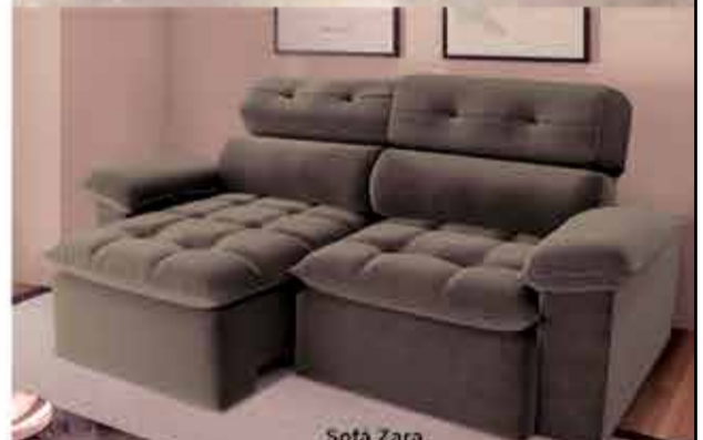
Sofá Zara Várias Cores e tamanhos a partir de R$ 2.343,59 no PIX