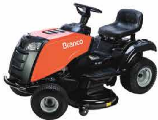
Trator cortador de grama