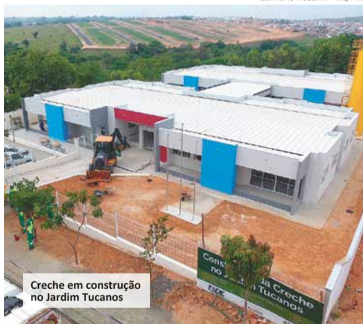
Creche em construção no Jardim Tucanos

O Jardim Residencial Veneza também vai ganhar uma creche com capacidade de atendimento de até 76 crianças de 0 a 3 anos e 11 meses de idade e pré-escola para crianças de 4 a 6 anos de idade. O prédio terá seis salas de creche e quatro salas de pré-escola; A obra tem previsão de entrega no primeiro semestre de 2024.