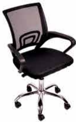
Cadeira Office Tokio a partir de R$ 225,98 no PIX