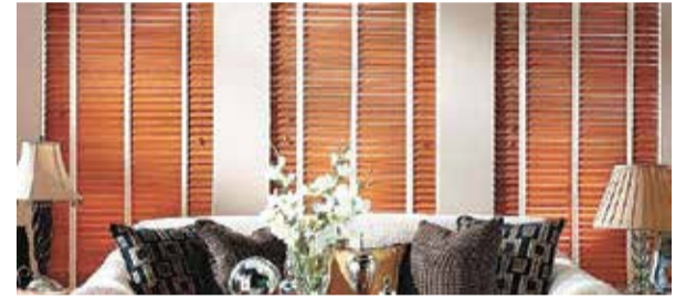
Precisando de cortinas, persianas, papel de parede, colchas sob medida, almofadas, tapetes e carpetes, lembre-se sempre da Adelaide Decorações. Ligue já e agende seu horário (19) 3894-4638 / (19) 99763-2829. Você vai adorar!