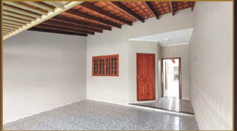
CASA JARDIM DO VALLE II - Terreno 125 m 2 - Construção 107 m 2 - 2 Dormitórios, sendo 01 Suíte/ Escritório/ Banheiro social/ Cozinha / Sala / Lavandaria Fechada / 2 Vagas de garagem cobertas. / Valor R$ 480.000,00.