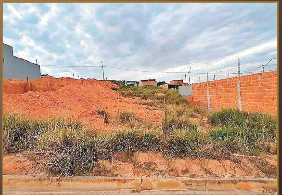
SMART CITY - 150 M 2 - R$150.000,00