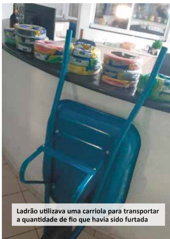
Ladrão utilizava uma carruola para transportar a quantidade de fio que havia sido furtada

Ao chegar no estabelecimento, a equipe da Guarda Civil constatou o arrombamento. A ocorrência foi encaminhada ao 1º Distrito Policial, onde foram tomadas as medidas cabíveis.