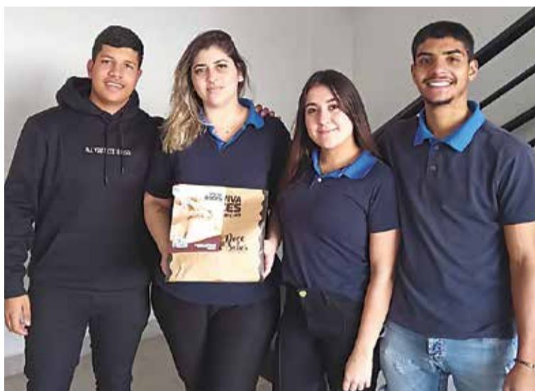
E tem mais cliente recebendo mimo do Mais Expressão, o delicioso bolo da Doce Sabor para um cafezinho da tarde, para essa equipe top do Departamento Pessoal e Financeiro da Outlet das Telas!!