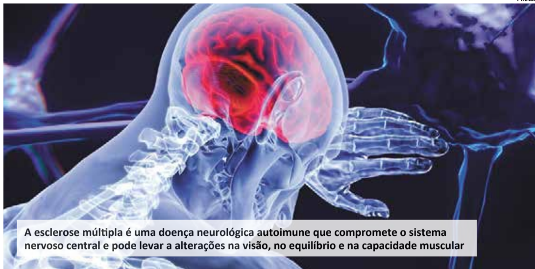
A esclerose múltipla é uma doença neurológica autoimune que compromete o sistema nervoso central e pode levar a alterações na visão, no equilíbrio e na capacidade muscular

A esclerose múltipla é uma doença neurológica autoimune que compromete o sistema nervoso central e pode levar a alterações na visão, no equilíbrio e na capacidade muscular. Por motivos genéticos ou ambientais o sistema imunológico começa a agredir a bainha de mielina (camada de gordura que envolve as fibras nervosas na substância branca do cérebro e na medula espinhal), comprometendo a função do sistema nervoso (cérebro e medula) ao atingir diversas funções ligadas ao trânsito de informações dos neurônios para o resto do corpo. Quando esse caminho é