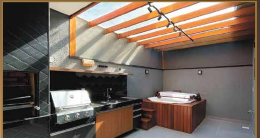
SOBRADO JARDINS DOS IMPÉRIOS - A/C 180 m 2 A/T 150,00 m 2 - 4 dormitórios, sendo 2 suítes/ lavanderia/ sala de TV/ sala de estar, sala de jantar/ cozinha planejada/ área gourmet com churrasqueira e jacuzzi/ garagem para 2 carros - R$1.150.000,00.