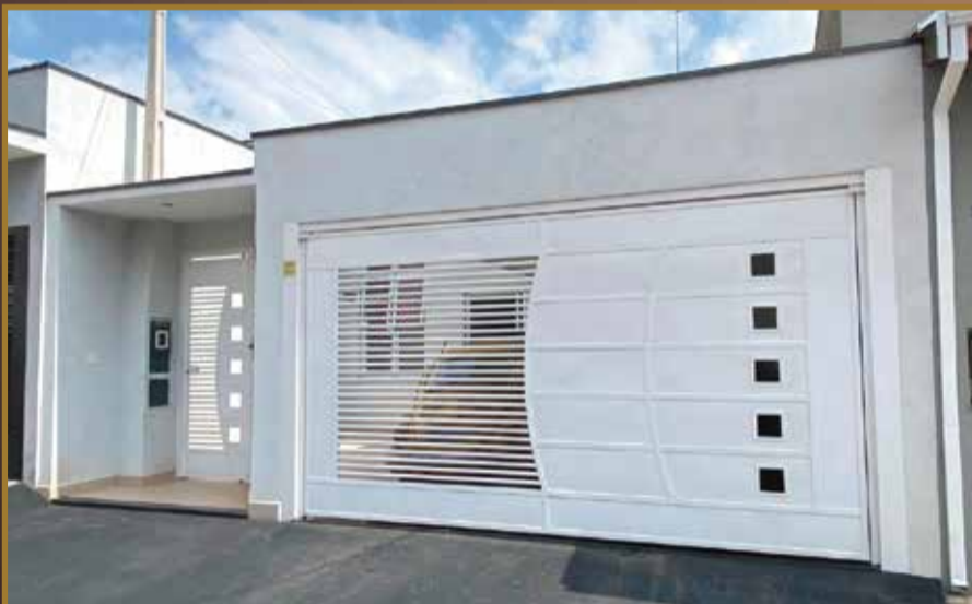
JARDIM MONTE CARLO - Terreno 150 m 2 -Construção 115m 2 - 3 dormitórios, sendo 1 suíte/ sala com pé direito alto/ Garagem cobertas 2 carros/ área de luz / área para lazer gourmet - R$630.000,00 por R$570 mil.