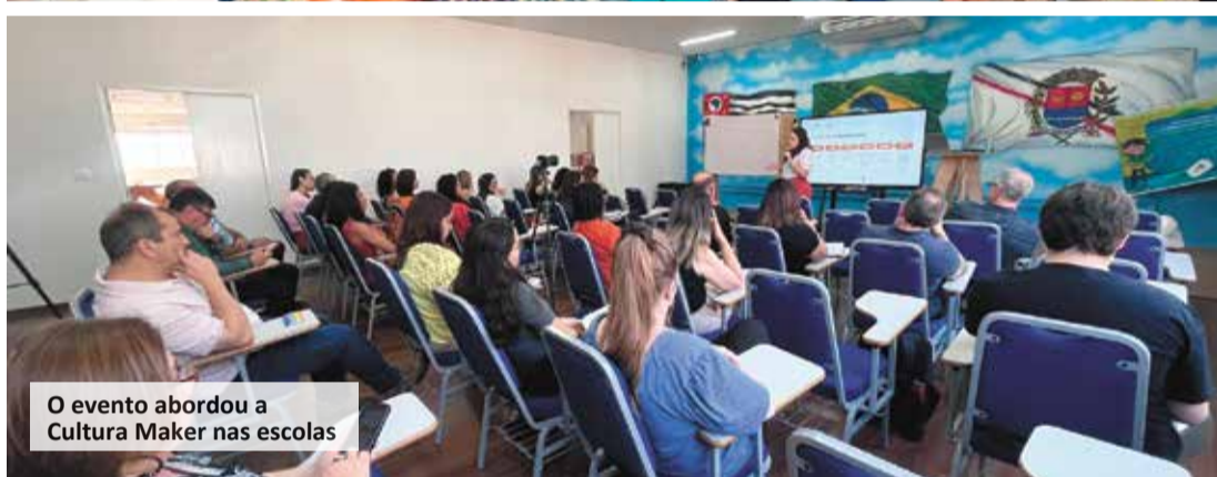
O evento abordou a Cultura Maker nas escolas

biente diferente da sala de aula, que permite que os estudantes aprendam os métodos que vão além