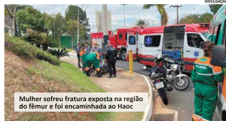
Mulher sofreu fratura exposta na região do fêmur e foi encaminhada ao Haoc

Uma ambulância do Serviço de Emergência (192) esteve no local, realizando os primeiros socorros. A vítima sofreu uma fratura exposta na região do fêmur, sendo encaminhada à emergência do Hospital Augusto de Oliveira Camargo (Haoc), para receber atendimento médico especializado. (Rayane Lins).