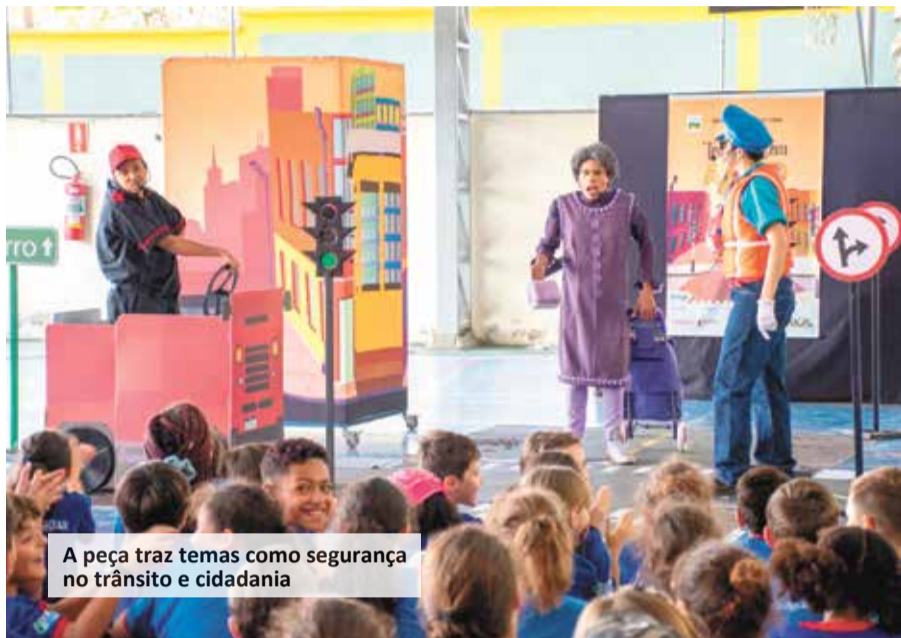
A peça traz temas como segurança no trânsito e cidadania