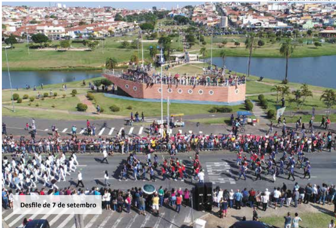
Desfile de 7 de setembro

O desfile terá início com a Corporação Vila Lobos em formato de fanfarra, seguido pela Banda Jovem