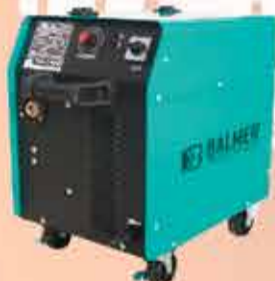
Máquina de solda