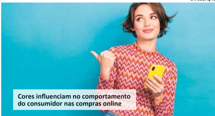
Cores influenciam no comportamento do consumidor nas compras online

Uma pesquisa do Centro Universitário de Brasília (CEUB), sugere que as cores desempenham um papel significativo no ato de comprar. O estudo intitulado "Variáveis de Atmosfera: Efeito da Cor do Ambiente em Padrões de Comportamento do Consumidor na Avaliação de Produtos", se