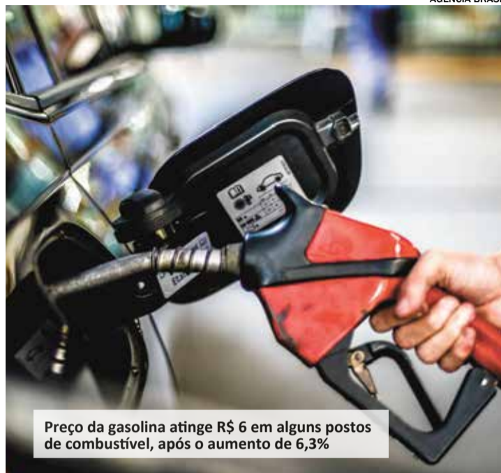
Preço da gasolina atinge R$ 6 em alguns postos de combustível, após o aumento de 6,3%

O professor ainda enfatiza que além do funcionamento do motor, o sistema de injeção eletrônica pode ser corroído pelos solventes e peças podem ficar ressecadas. "Se o automóvel apresentar falhas ao longo do tempo, dificuldades para ligar ou ficar 'engasgando', podem ser sinais de que o combustível utilizado estava adulterado. A gasolina adulterada também deixa o motor