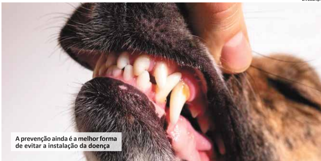
A prevenção ainda é a melhor forma de evitar a instalação da doença

A doença periodontal é a moléstia mais comum da cavidade oral de cães e gatos. Inicia-se por acúmulo de bactérias na superfície dos dentes e progride até gengiva, ossos, cemento e ligamento periodontal. Dentre os fatores que predispõe a doença, destacam-se raça, idade, dieta, mastigação e a saúde do animal. Entretanto, o acúmulo de placa bacteriana na superfície dos dentes é o fator primordial para a causa desse problema. A doença periodontal é responsável por diversos graus de inflamação e de infecção dos tecidos da boca, causando dor, com eventual perda do dente e até fraturas de mandíbula ou maxila. Além disso, pode acarretar distúrbios sistêmicos, comprometendo órgãos vitais, como coração, fígado e rins, e também articulações.