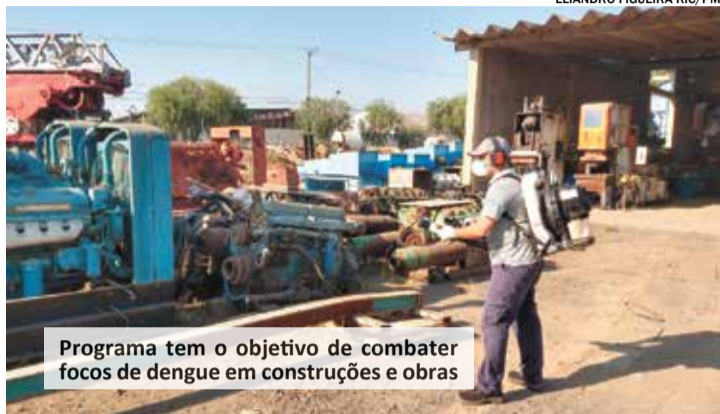
Programa tem o objetivo de combater focos de dengue em construções e obras

DA REDAÇÃO redacao@maiseexpressao.com.br