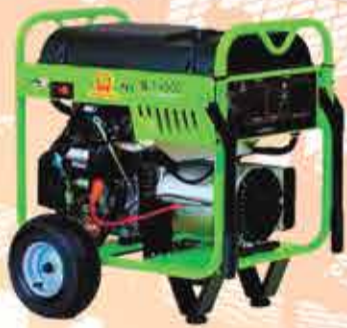
Gerador de energia