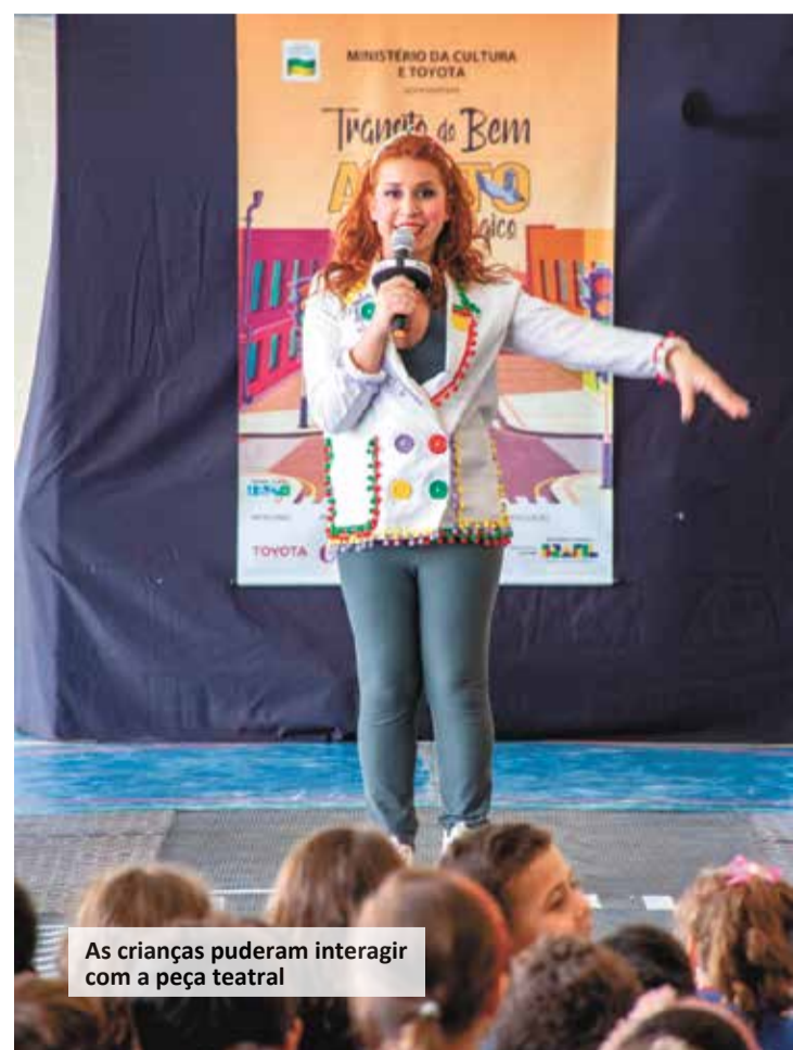
As crianças puderam interagir com a peça teatral

Sophia Castro – sophia.castro@viracomunicacao.com.br (19) 99186-4616