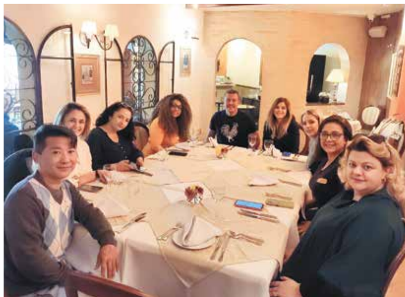
Esta semana teve almoço de comemoração ao dia dos Corretores da Equipe da Z10 Imóveis. Parabéns a todos pelo seu dia!!