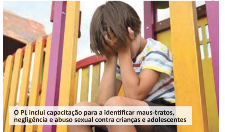
O PL inclui capacitação para a identificar maus-tratos, negligência e abuso sexual contra crianças e adolescentes

O Senado aprovou projeto de lei que inclui na formação de profissionais da educação a proteção dos direitos de crianças e adolescentes. O texto também insere a identificação de maus-tratos, de negligência e de violência sexual praticados contra menores de 18 anos entre os princípios de atendimento do Sistema Único de Saúde (SUS). O projeto altera a Lei de Diretrizes e Bases da Educação Nacional (LDB — Lei 9.394, de 1996) e a Lei Orgânica da Saúde