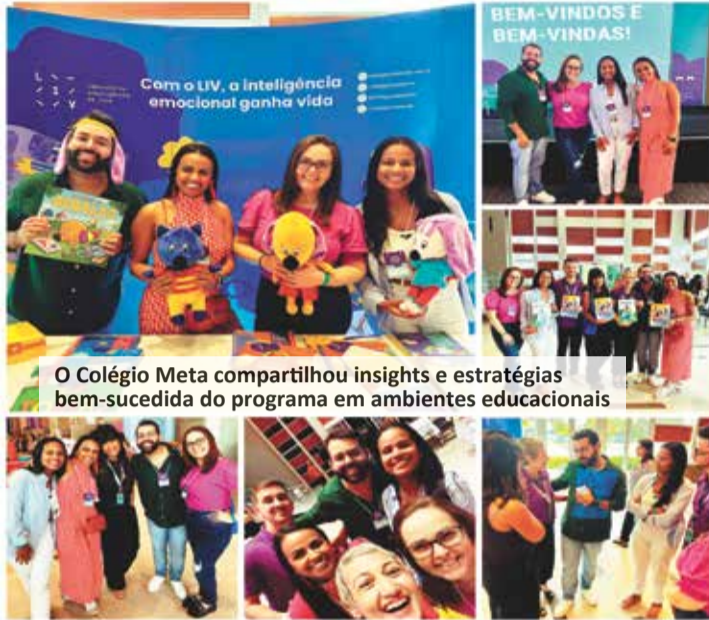
O Colégio Meta compartilhou insights e estratégias bem-sucedidas do programa em ambientes educacionais

Com o cenário de Salvador como pano de fundo, o LIV Conecta 2023 trouxe uma atmosfera de inovação e inspiração para os profissionais da educação, reunidos para refletir sobre a importância