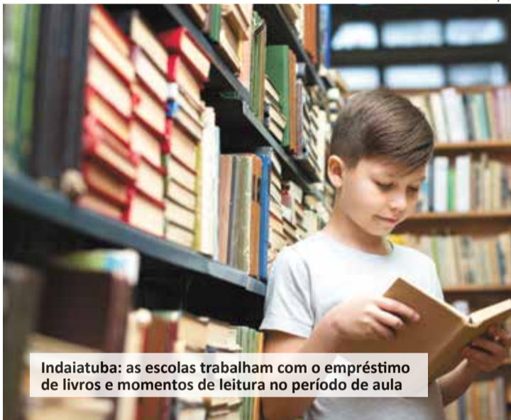
Indaiatuba: as escolas trabalham com o empréstimo de livros e momentos de leitura no período de aula