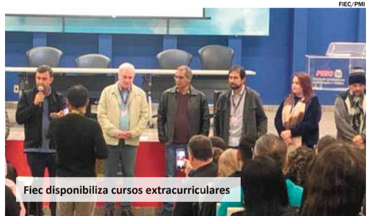
Fiec disponibiliza cursos extracurriculares

Mais informações no site da prefeitura www.indaiatuba.sp.gov.br