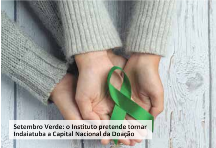
Setembro Verde: o Instituto pretende tornar Indaiatuba a Capital Nacional da Doação

Durante todo Setembro Verde, o Instituto Gabriel promove palestras gratuitas sobre o tema