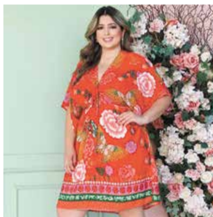
Coleção Verão que vai chegar na nossa parceira By Faby Modas, esse vestido lindo moda Plus Size, tecido em crepe, com uma pequena % de elastano, tecido inteligente, essa coleção tropical vai ser um arraso, já encomende o seu. A loja fica na Av.ÁRIO Barnabé, 1389 - Morada do Sol 19 993405844!!!