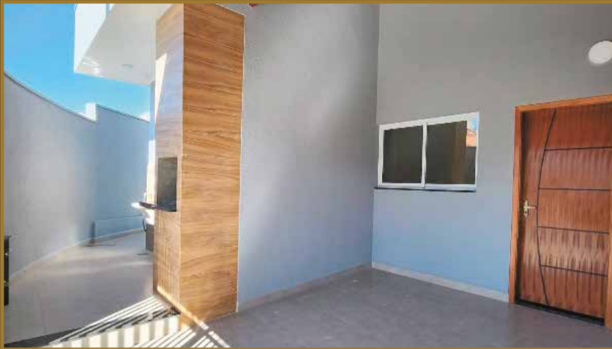
JARDIM DOS SABIÁS - Terreno 100 m 2 - Construção 80 m 2 - 2 dormitórios/ 1 suíte/ sala / cozinha / banheiro social / lavanderia / garagem coberta pra dois carros / churrasqueira - R$390.000,00.