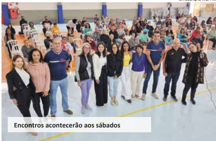
Encontros acontecerão aos sábados

A Secretaria de Saúde de Indaiatuba anunciou novos encontros do projeto DignaMente em setembro. Os atendimentos psicológicos coletivos acontecerão aos sábados no Centro de Convenções Aydil Bonachella a partir de 2 de setembro.