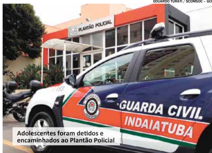
Adolescentes foram detidos e encaminhados ao Plantão Policial

Quatro adolescentes foram detidos pela equipe da Guarda Municipal, após furtarem um aparelho celular de dentro de um veículo. O caso aconteceu na tarde de segunda-feira (28), no Centro.