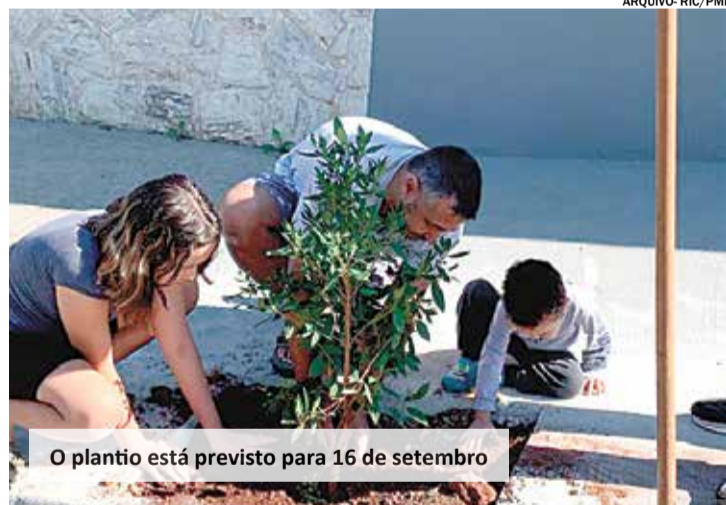
O plantio está previsto para 16 de setembro