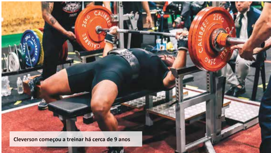
Cleverson começou a treinar há cerca de 9 anos

to internacional sempre foi meu sonho como atleta e treinador.