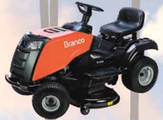
Trator cortador de grama