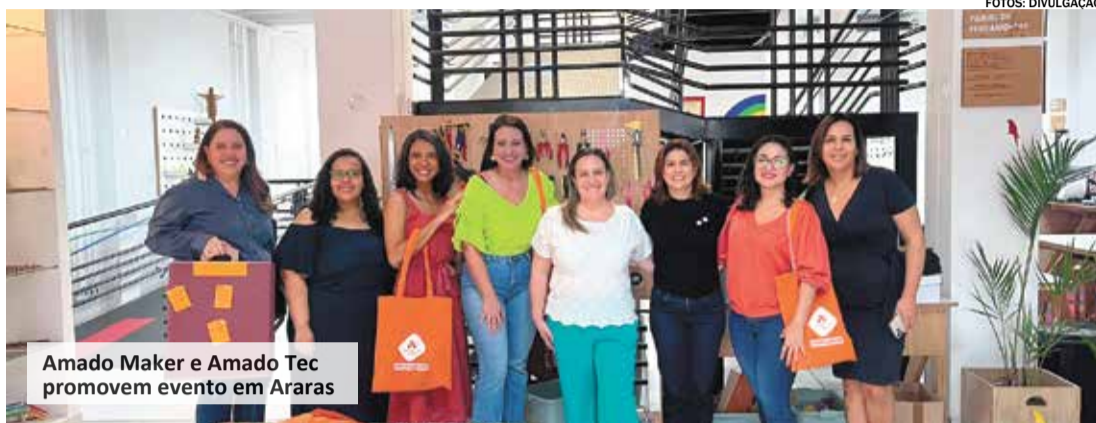
Amado Maker e Amado Tec promovem evento em Araras

E é a exploração desse espaço criativo e am-