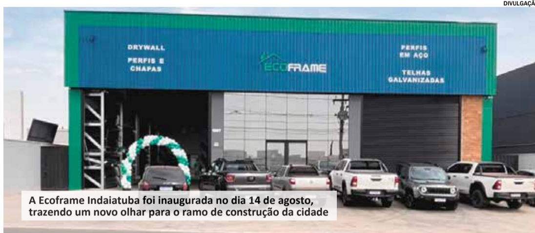
A Ecoframe Indaiatuba foi inaugurada no dia 14 de agosto, trazendo um novo olhar para o ramo de construção da cidade

A Ecoframe chegou na cidade de Indaiatuba, neste ano, sendo inaugurada no dia 14 de agosto, com o intuito de trazer uma empresa diferenciada, responsável e que se tornasse referência no ramo, na cidade.