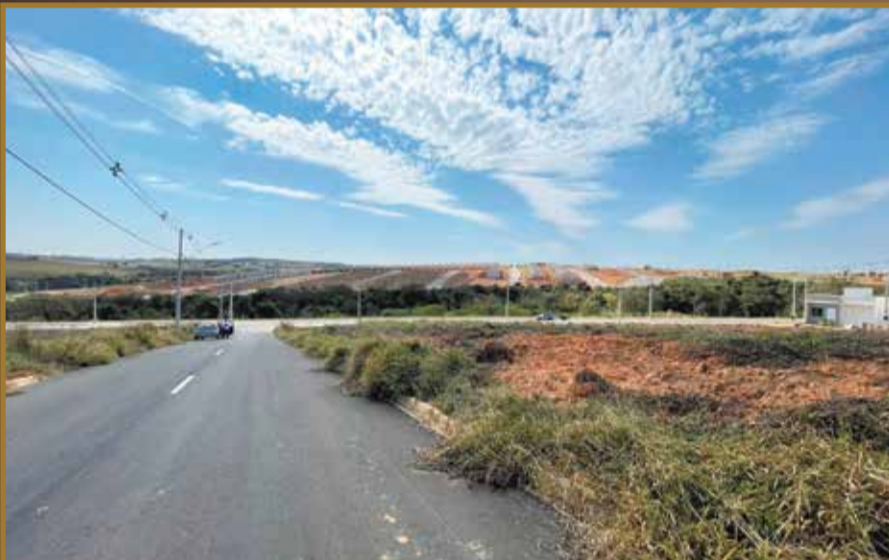
OPORTUNIDADE!!! Terreno Loteamento Araras Em Indaiatuba – Terreno Residencial 150m 2 R$125.000.