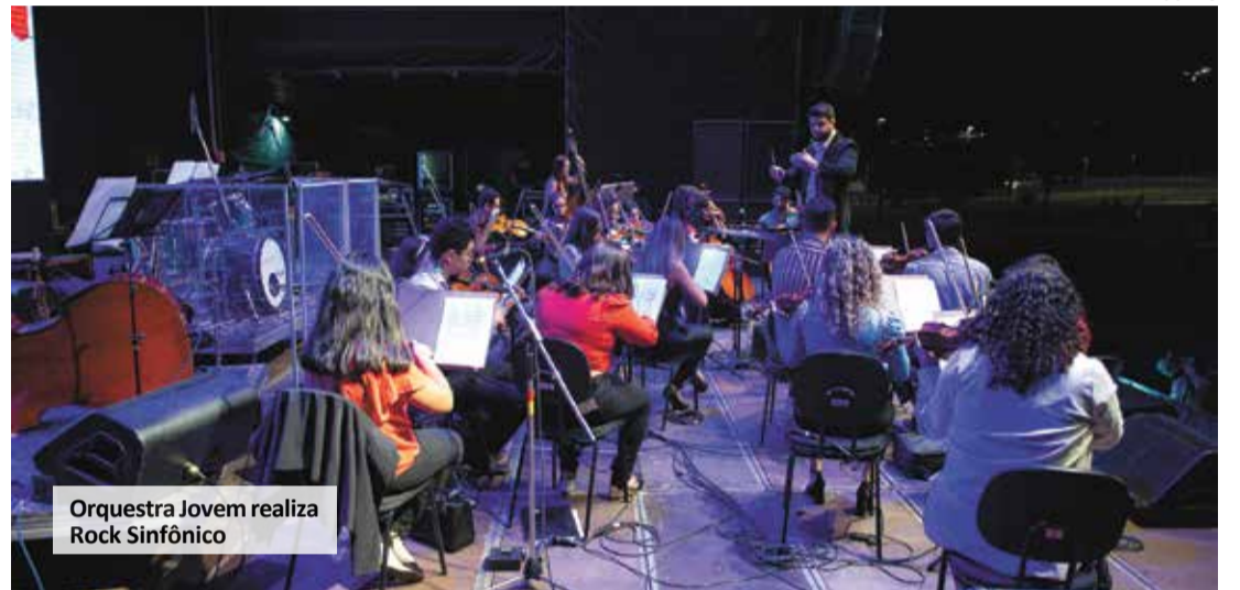
Orquestra Jovem realiza Rock Sinfônico

DA REDAÇÃO redacao@maiseexpressao.com.br