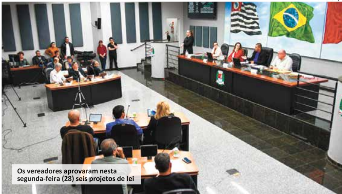
Os vereadores aprovaram nesta segunda-feira (28) seis projetos de lei

Anualmente, a campanha sensibiliza cidadãos sobre a necessidade de prevenir doenças e realizar exames periódicos, como o de detecção do câncer de próstata, que mata mais de 40 homens todos os dias no Brasil.