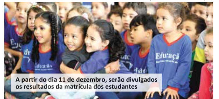
A partir do dia 11 de dezembro, serão divulgados os resultados da matrícula dos estudantes