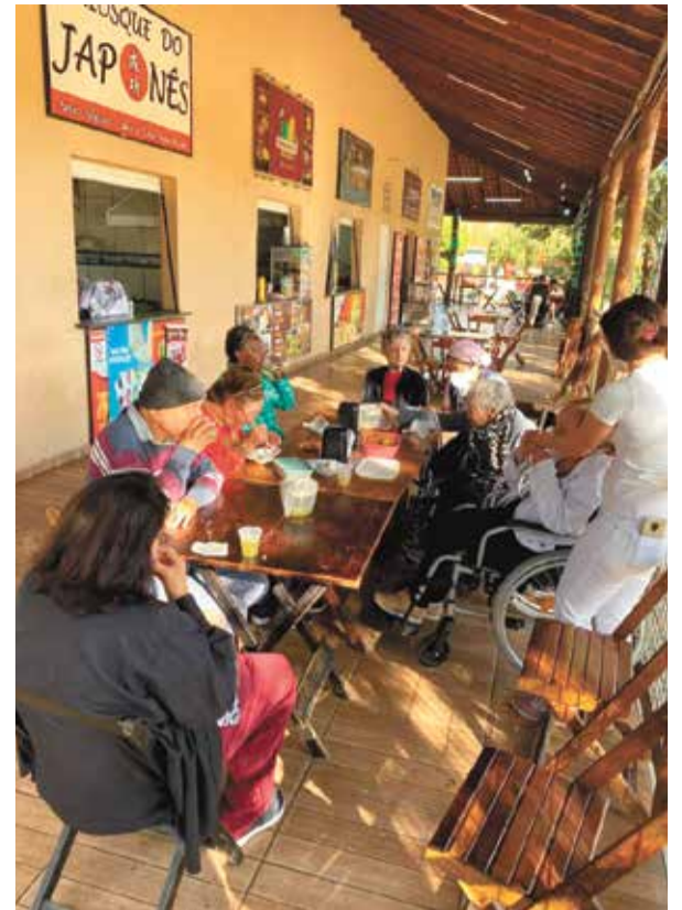
Fênix Pensionato passeando numa deliciosa tarde no Parque Ecológico. Vale ressaltar como é bom dividir momentos de união e carinho entre os hóspedes. Parabéns!