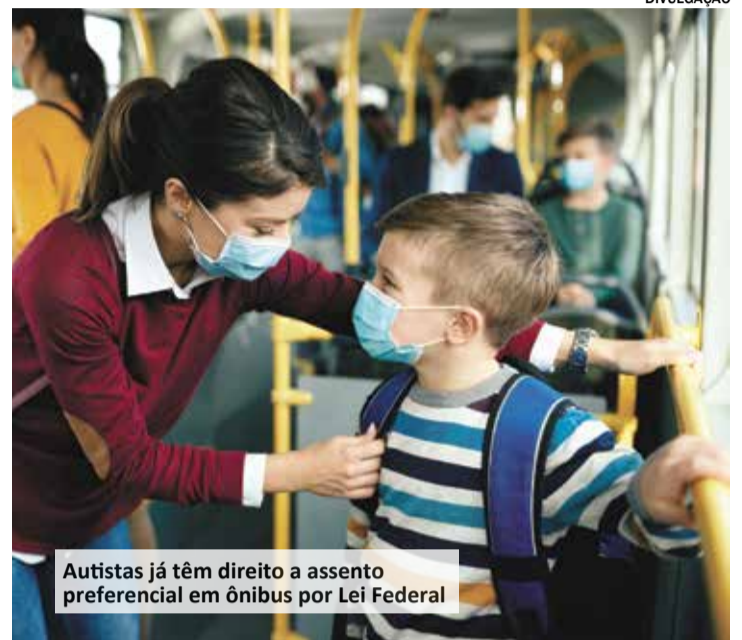
Autistas já têm direito a assento preferencial em ônibus por Lei Federal