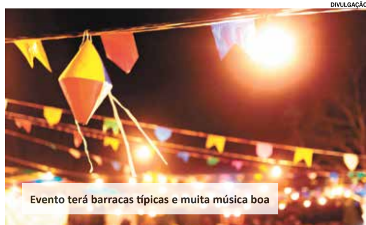
Evento terá barracas típicas e muita música boa

A Comunidade Sagrado Coração de Jesus promove no próximo sábado (8) a Festa Julina, a partir das 16h. A festa beneficente é aberta ao público e parte da renda será revertida para a própria comunidade.