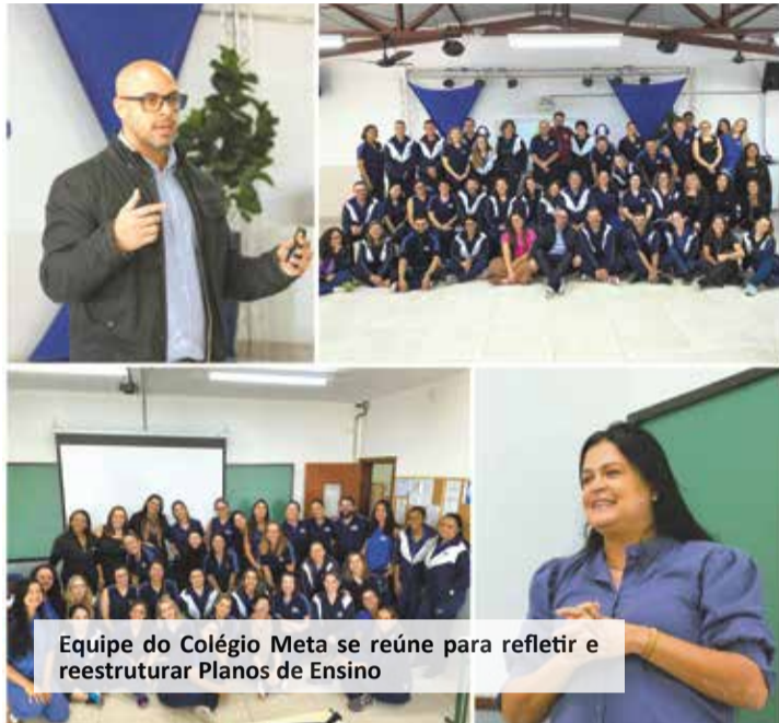
Equipe do Colégio Meta se reúne para refletir e reestruturar Planos de Ensino

Em 30 de junho, conforme o previsto no Calendário Escolar, chega o momento de