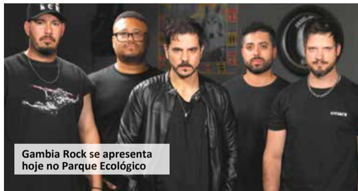
Gambia Rock se apresenta hoje no Parque Ecológico

O concerto tem realização da Associação Mantenedora da Orquestra Jovem de Indaiatuba em parceria com a Prefeitura Municipal, por meio da Secretaria de Cultura.