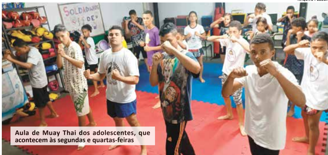
Aula de Muay Thai dos adolescentes, que acontecem às segundas e quartas-feiras