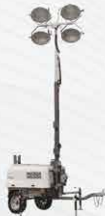
TORRE DE ILUMINAÇÃO