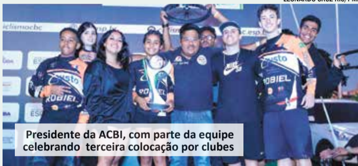
Presidente da ACBI, com parte da equipe celebrando terceira colocação por clubes