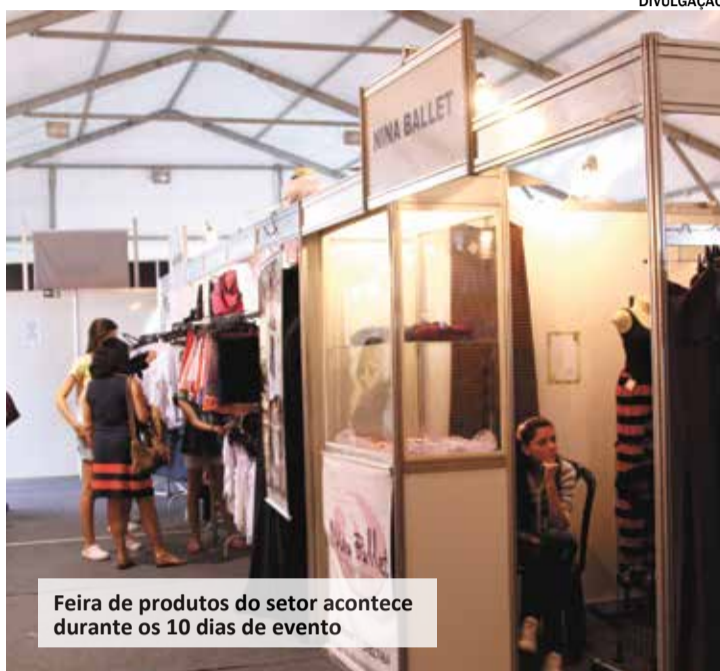
Feira de produtos do setor acontece durante os 10 dias de evento

Ao sediar o evento, a cidade recebe um aumento significativo de turistas e visitantes pontuais que impulsionam o comércio local, uma vez que demandam grandes estruturas de hospedagem, mão de obra, alimentação e transporte. “Em 2022, a produção do Passo de Arte envolveu mais de 50 pessoas trabalhando diretamente, três mil bailarinos e seus acompanhantes. Em termos de gastos com refeições e hospedagens, calculamos uma arrecadação média de R$900 mil para o setor. Fora isso,