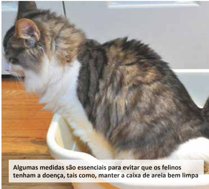
Algumas medidas são essenciais para evitar que os felinos tenham a doença, tais como, manter a caixa de areia bem limpa

Pode ocorrer em felinos de qualquer idade ou sexo, porém acomete principalmente gatos machos, castrados, sedentários, obesos,