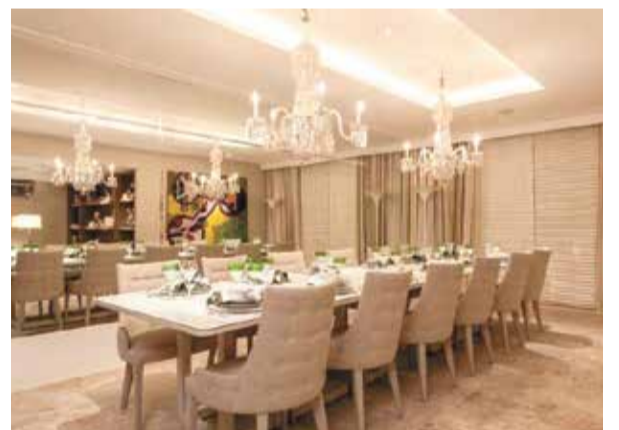
Precisando de cortinas, persianas, papel de parede, colchas sob medida, almofadas, tapetes e carpetes, lembre-se sempre da Adelaide Decorações. Ligue já e agende seu horário (19) 3894-4638 / (19) 99763-2829. Você vai adorar!