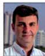
Nilson Alcides Gaspar Prefeito