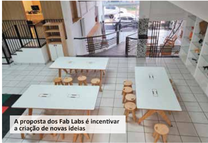
A proposta dos Fab Labs é incentivar a criação de novas ideias