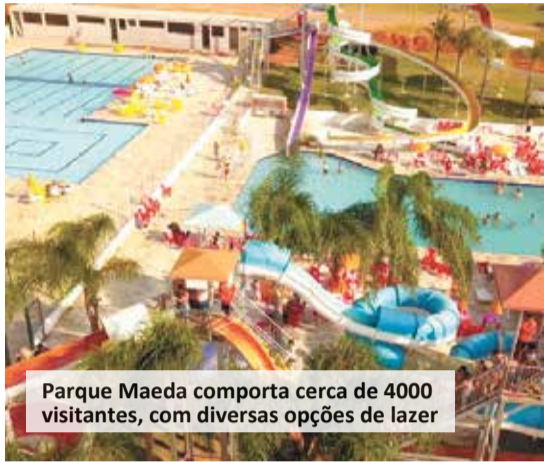
Parque Maeda comporta cerca de 4000 visitantes, com diversas opções de lazer

Julho, férias escolares e o que fazer com as crianças? Muitos pais aproveitam esse período para conciliar as férias com a dos filhos, mas muitos trabalham e a dica para ambos os casos é aproveitar para passear na região. Por isso, separamos alguns destinos perto de você, confira: