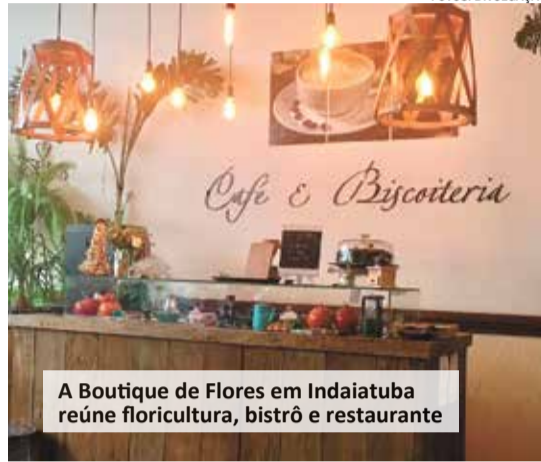
A Boutique de Flores em Indaiatuba reúne floricultura, bistrô e restaurante

para todos os gostos. Os espaços foram projetados para receber desde grandes grupos formados por estudantes, até famílias em férias ou mesmo casais que desejam passar alguns dias em um chalé aconchegante.