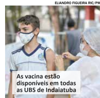
As vacinas estão disponíveis em todas as UBS de Indaiatuba

A vacina meningocócica ACWY para adolescentes de 13 e 14 anos de idade segue até o dia 31 de dezembro. A vacina está indicada para adolescentes no calendário de rotina. A imunização está disponível em todas as UBS de Indaiatuba de segunda a sexta-feira, das 7h30 às 16h30.