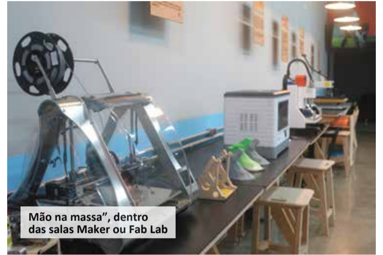
"Mão na massa", dentro das salas Maker ou Fab Lab