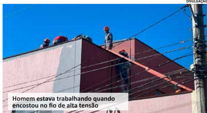
Homem estava trabalhando quando encostou no fio de alta tensão

Um homem, que trabalhava como pintor, sofreu uma descarga elétrica enquanto realizava reparos na pintura de um estabelecimento, no bairro Jardim Morada do Sol, na terça-feira (04). A vítima foi encaminhada ao Haoc, pelo helicóptero Águia.