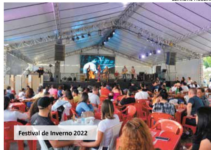
Festival de Inverno 2022

O Festival de Inverno contará com diversas operações gastronômicas distribuídas em alamedas salgadas, doce e de produtores. Além de ratificar seu compromisso com as tradições “da roça” e a culinária