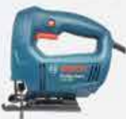
SERRA TICO TICO