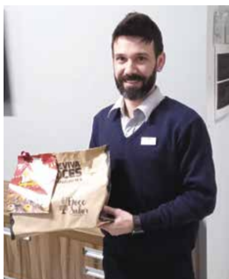
Adriano da Stalden Contabilidade recebeu um delicioso bolo da Doce Sabor, um carinho do Mais Expressão pra toda equipe!!