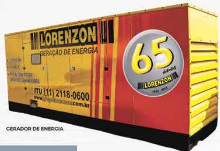
GERADOR DE ENERGIA

IMAGENS HIDRAMENTE ILUSTRATIVAS - VEICULAÇÃO 30.140.0003