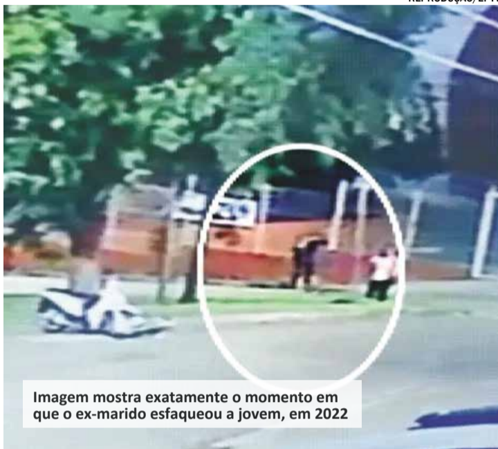
Imagem mostra exatamente o momento em que o ex-marido esfaqueou a jovem, em 2022

A jovem, de 21 anos, foi golpeada pelo menos quatro vezes pelo agressor e precisou retirar um rim após o ataque. Imagens registradas por um circuito de câmeras mostraram o