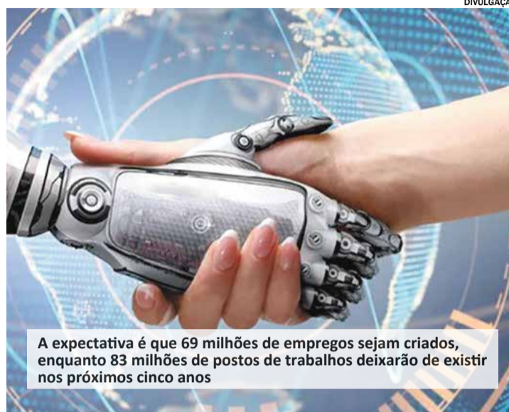
A expectativa é que 69 milhões de empregos sejam criados, enquanto 83 milhões de postos de trabalhos deixarão de existir nos próximos cinco anos

O Relatório sobre o Futuro do Trabalho 2023 foi realizado no final de 2022 e início de 2023, reunindo a perspectiva de 803 empresas, que empregam coletivamente mais de 11,3 milhões de trabalhadores em todo o mundo. O relatório foi divulgado pelo Fórum Econômico Mundial nesta semana. Com o fechamento de tantos postos de trabalho,