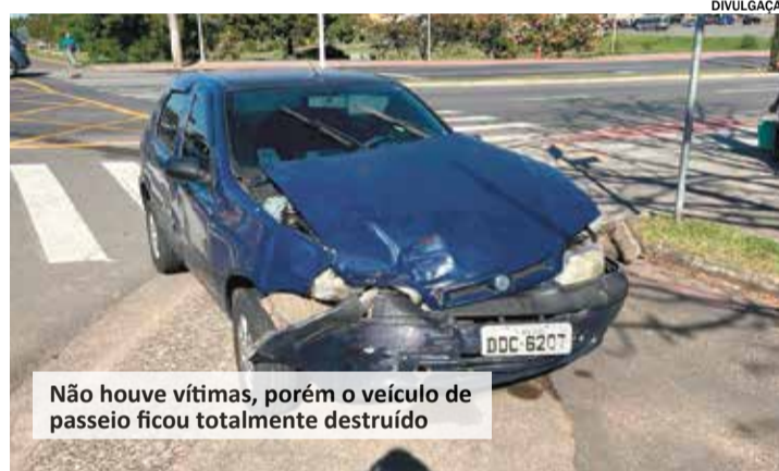
Não houve vítimas, porém o veículo de passeio ficou totalmente destruído

(UPA), com todas as luzes e sinais sonoros ligados, e o motorista do veículo, descia a Avenida Ário Barnabé, porém, ao escutar o barulho, acabou olhando para o lado contrário do veículo do serviço de emergência, colidindo com a ambulância. Devido aos danos, outra viatura de resgate foi solicitada para prosseguir com o atendimento da vítima. Ninguém se feriu. (Rayane Lins).