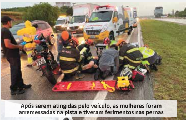
Após serem atingidas pelo veículo, as mulheres foram arremessadas na pista e tiveram ferimentos nas pernas

Dois mulheres ficaram feridas após um acidente de moto no final da tarde de segunda-feira (17), na Rodovia Santos Dumont (SP-75), altura do km 56.