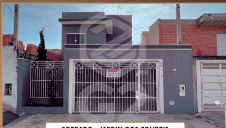
SOBRADO - JARDIM DOS COLIBRIS

Terreno: 150 m 2 - Construção: 151,21 m 2 - 3 suítes / Sala de TV e jantar amplas / Cozinha / Lavabo / lavanderia / 2 vagas de garagem cobertas.