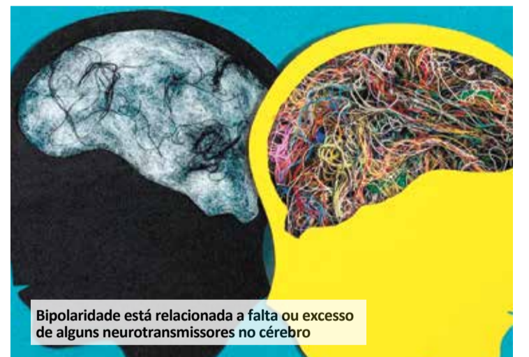
Bipolaridade está relacionada a falta ou excesso de alguns neurotransmissores no cérebro