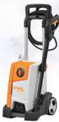
LAVADORA DE ALTA PRESSÃO