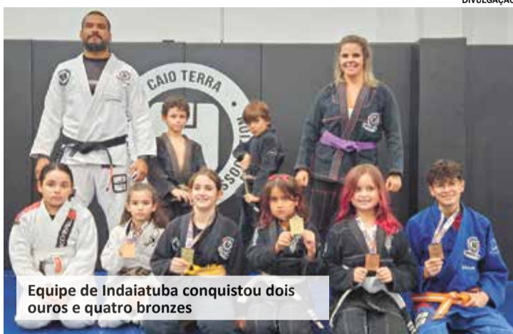
Equipe de Indaiatuba conquistou dois ouros e quatro bronzes