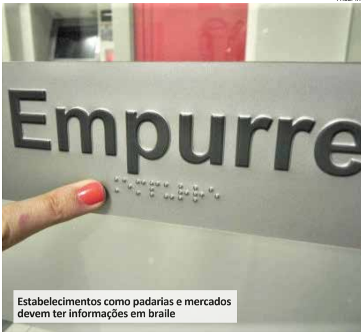
Estabelecimentos como padarias e mercados devem ter informações em braile

Leis obrigam exibição de informações em braile em comércios e facilitam renovação de vale-transporte