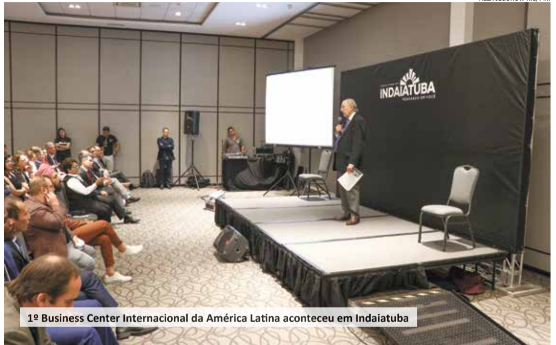
1º Business Center Internacional da América Latina aconteceu em Indaiatuba

“Nós temos encontrado nos empresários uma vontade realmente de participar e de crescer. Esse evento é importante para termos o conhecimento do cenário econômico sobre a perspectiva de profissionais que falam com propriedade, a