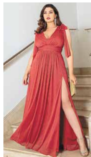
Dando boas-vindas a mais um cliente do Frutos de Indaiá 2023, a MGR Boutique, e já começando com essa dica para Madrinhas e Formandas. Um Vestido lindo em lurex com detalhe nas alças com duas formas de usar (com laço ou sem laço), drapeado na cintura e fenda. Com bojo, zíper invisível!! A MGR fica na Avenida 24 de maio, 1130, no Centro!!!