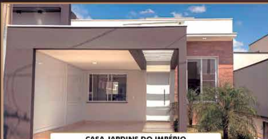
CASA JARDINS DO IMPÉRIO

Área do Terreno 150,00 m 2 - Área Construída 104,38 m 2 - 3 Dormitórios / 1 suíte / sala de jantar, sala de jantar / cozinha planejada / área gourmet / churrasqueira / 1 Vaga de garagem coberta e 1 descoberta.