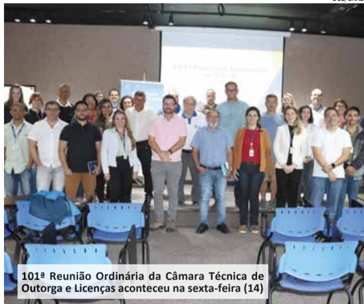
101ª Reunião Ordinária da Câmara Técnica de Outorga e Licenças aconteceu na sexta-feira (14)

O Serviço Autônomo de Água e Esgotos (Saae), participou da 101ª Reunião Ordinária da Câmara Técnica de Outorga e Licenças, da ARES-PCJ (Agência Reguladora dos Serviços de Saneamento das Bacias dos Rios Piracicaba, Capivari e Jundiá), na sexta-feira (14), no Museu da Água.