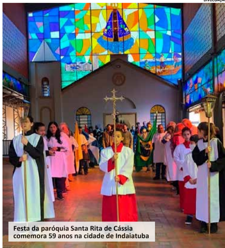
Festa da paróquia Santa Rita de Cássia comemora 59 anos na cidade de Indaiatuba

A programação completa da parte religiosa e festiva pode ser conferida no Instagram da paróquia (@santaritaindaia).