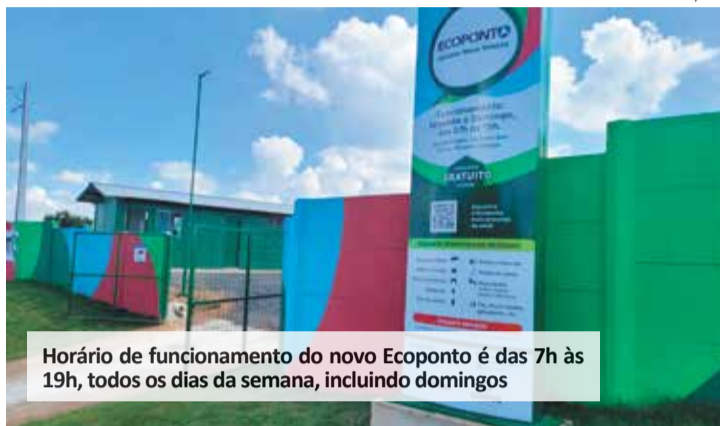
Horário de funcionamento do novo Eco ponto é das 7h às 19h, todos os dias da semana, incluindo domingos