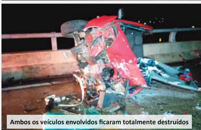
Ambos os veículos envolvidos ficaram totalmente destruídos

Um homem morreu após colidir seu carro frontalmente contra outro, no quilômetro 70 da Rodovia Santos Dumont (SP-075), na noite de sábado (15). Conforme o registro da Polícia Rodoviária Estadual, o homem estava em um Renault/Clio, não tinha habilitação e dirigia na contramão no momento do acidente.