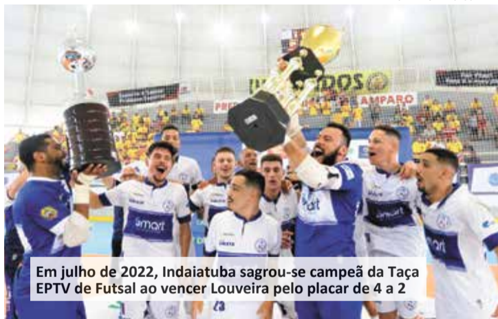
Em julho de 2022, Indaiatuba sagrou-se campeã da Taça EPTV de Futsal ao vencer Louveira pelo placar de 4 a 2

Em busca do tricampeonato, Indaiatuba faz sua estreia na 9ª Taça EPTV de Futsal – Campinas na segunda-feira (24), às 20h45,