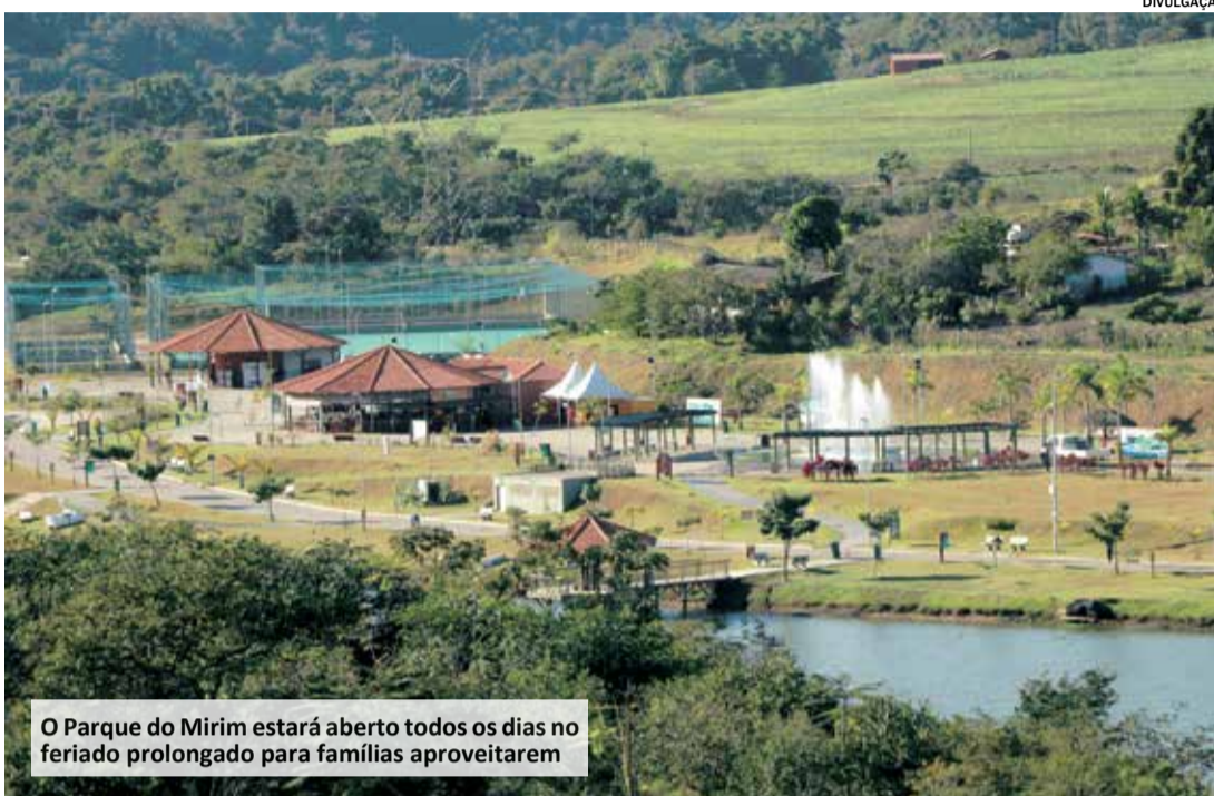
O Parque do Mirim estará aberto todos os dias no feriado prolongado para famílias aproveitarem

Os Ecopontos do Jardim João Pioli, Jardim Eldorado, Jardim Olinda e do Jardim Nova Veneza funcionarão normalmente, das 7h às 19h. O Ponto Verde - Feira