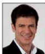
Rogério Nogueira Deputado Estadual