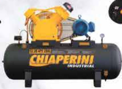
COMPRESSOR DE AR