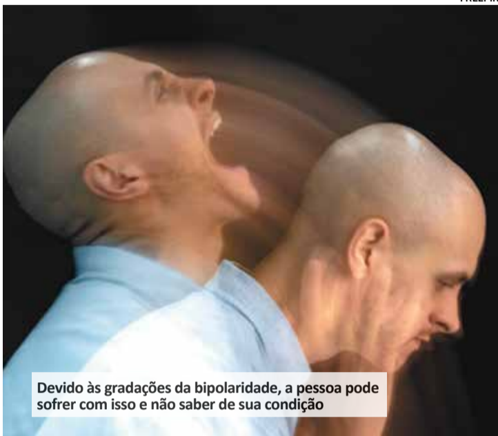
Devido às gradações da bipolaridade, a pessoa pode sofrer com isso e não saber de sua condição

O transtorno atinge cerca de 6 milhões de brasileiros e pode ser mais complexo do que se pensa