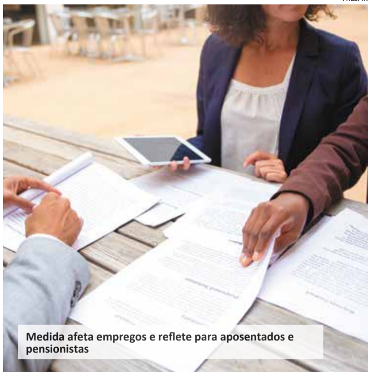
Medida afeta empregos e reflete para aposentados e pensionistas