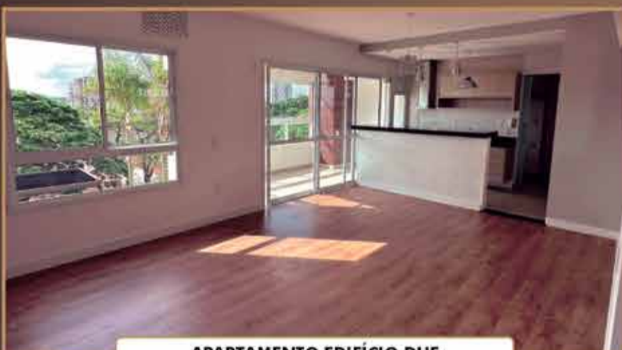
APARTAMENTO EDIFÍCIO DUE

96,20 m 2 - 3 quartos sendo 1 suíte / 3 banheiros / varanda gourmet / sala / cozinha / lavanderia / 2 vagas cobertas no subsolo + 1 box