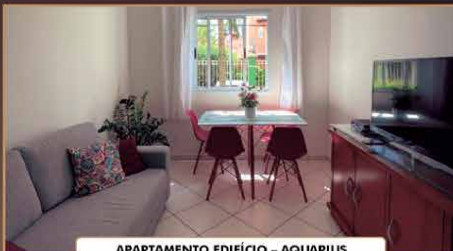
APARTAMENTO EDIFÍCIO - AQUARIUS

Metragem: 65(m 2 ) 2 Dormitórios / uma suíte / WC social / Sala / Cozinha / Lavanderia / 2 Vagas de garagem descobertas