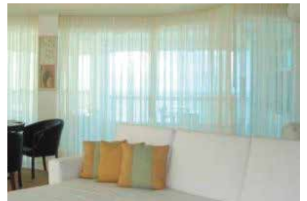
Precisando de cortinas, persianas, papel de parede, colchas sob medida, almofadas, tapetes e carpetes, lembre-se sempre da Adelaide Decorações. Ligue já e agende seu horário (19) 3894-4638 / (19) 99763-2829. Você vai adorar!