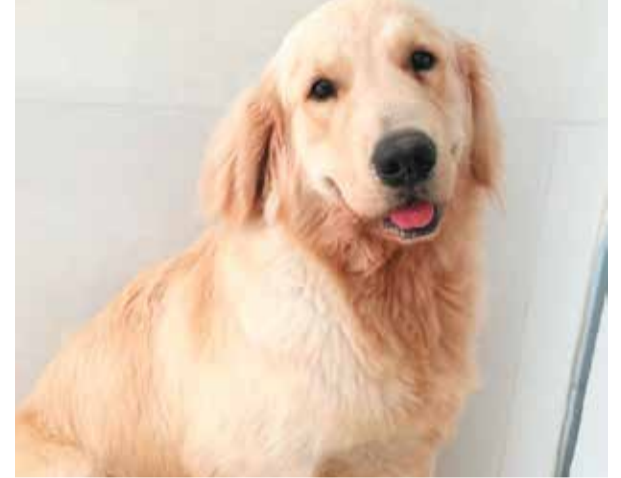
A linda mascote Aya da Clínica Bicho Amigo, posando para uma foto, para o social do Jornal Mais Expressão. Rua Quinze de Novembro, 1050 – Centro. Fone: (19) 3875-2715.