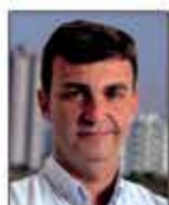
Nilson Alcides Gaspar Prefeito