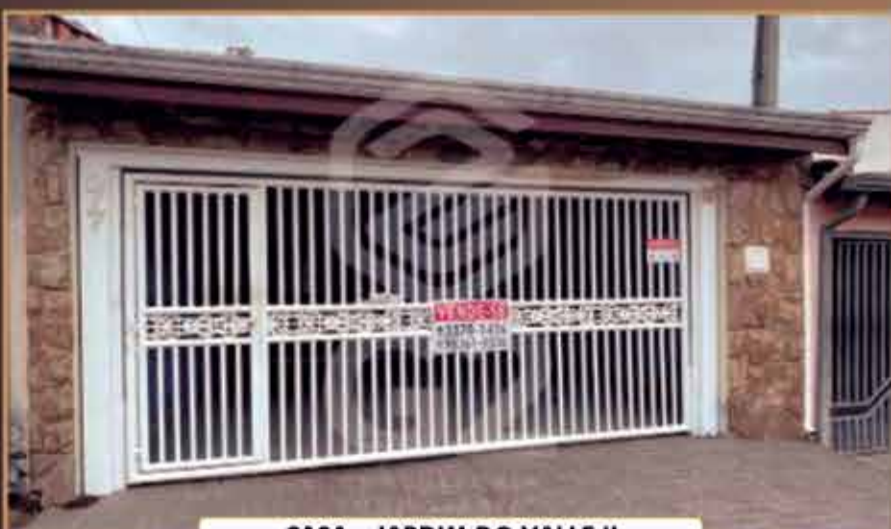
CASA - JARDIM DO VALLE II

Terreno: 125 m 2 - Construção: 115 m 2 - 2 Dormitórios / WC. Extra / Sala de TV / Cozinha ampla / Lavanderia / Espaço gourmet / 2 Vagas de garagem cobertas.