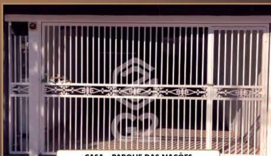
CASA - PARQUE DAS NAÇÕES

AT: 125 m 2 - AC: 100 m 2 - 3 Dormitórios sendo 1 suíte / Sala de estar / Cozinha com armários planejados / Banheiro social / Área de serviço / Área gourmet com churrasqueira / 2 vagas de garagem coberta