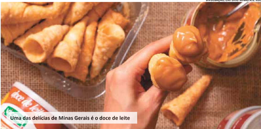
Uma das delícias de Minas Gerais é o doce de leite

Atualmente, o Empório Minas Até Você comercializa um total de 300 itens entre bebidas, cafés, biscoitos, doces e geleias, além dos famosos queijos, requeijões e manteigas. A variedade e qualidade fizeram do Empório uma referência na cidade “Proporcionar um sentimento de bem-estar, prazer e nostalgia, desfrutando dos