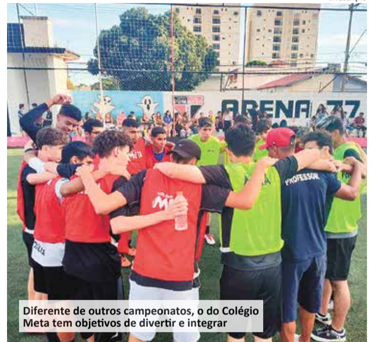
Diferente de outros campeonatos, o do Colégio Meta tem objetivos de divertir e integrar

Ganhar, ou perder, é consequência do fazer, participar e de motivar crianças e jovens em formação para desenvolverem a prática esportiva. O futebol foi escolhido por ser ainda o esporte mais popular entre os brasileiros. No olhar e comportamento dos pais presentes, nota-se, mais uma vez, sucesso absoluto na compreensão da proposta que, além de mobilizar para prática esportiva, mobilizou a comunidade escolar para ações solidárias e empáticas.