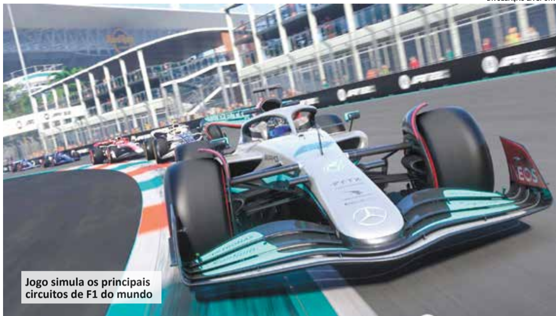
Jogo simula os principais circuitos de F1 do mundo