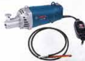
VIBRADOR DE CONCRETO