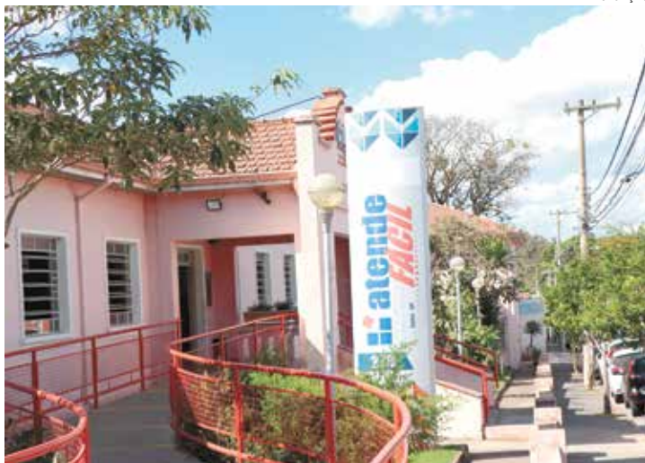
Salto fechou mês de março com o saldo positivo de 127 vagas formais

A Prefeitura de Salto, por meio da Secretaria de Desenvolvimento Econômico,