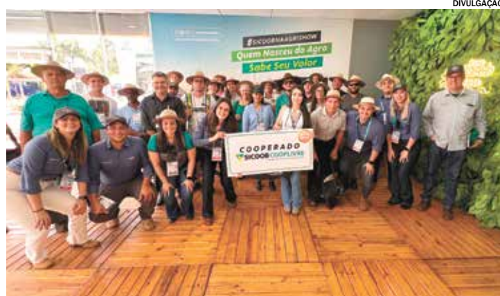
Agrishow é vitrine de tecnologias, expansão de negócios e recursos para agro