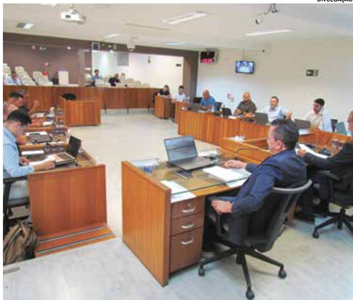
Vereadores conheceram o plano turístico para os próximos três anos