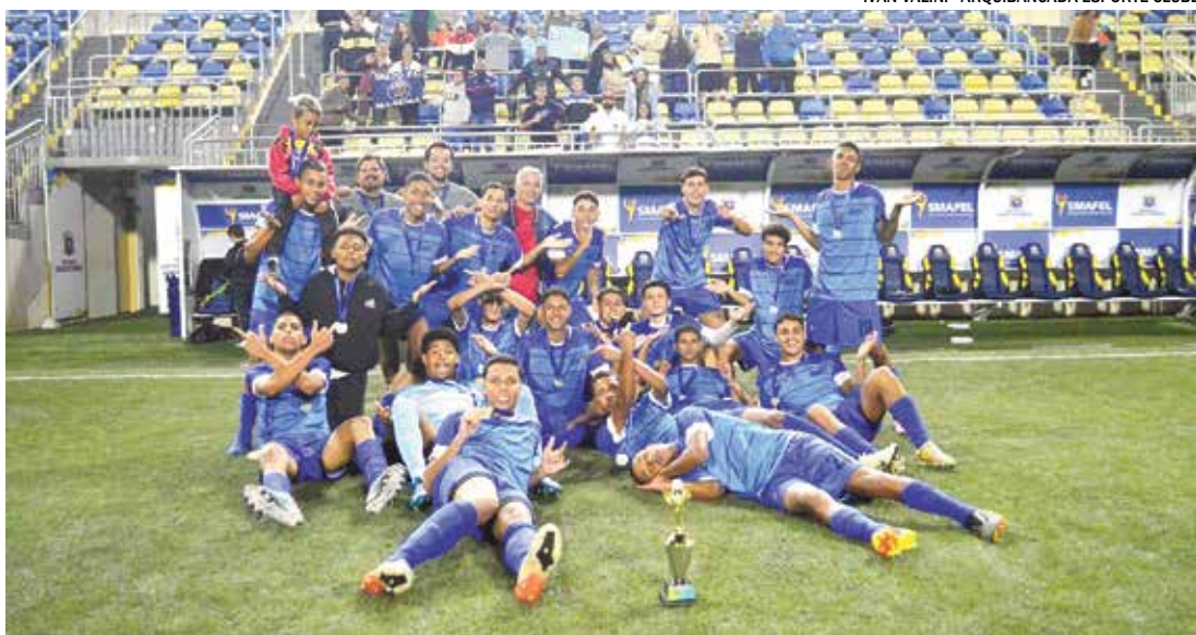
Buscando vaga na Fase Estadual, equipe local enfrenta Tatuí em partida que acontece em Itapeva neste sábado