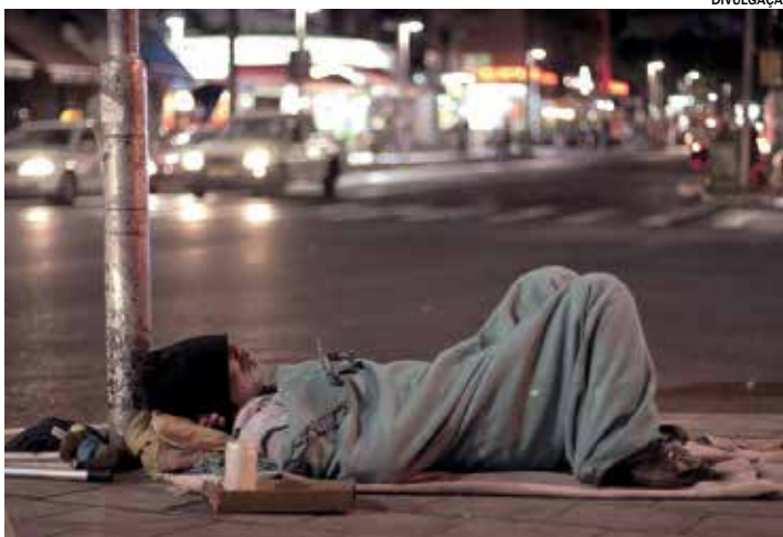
Vereador de Salto fez uma denúncia no Ministério Público para que a ação contra os vulneráveis seja investigada.