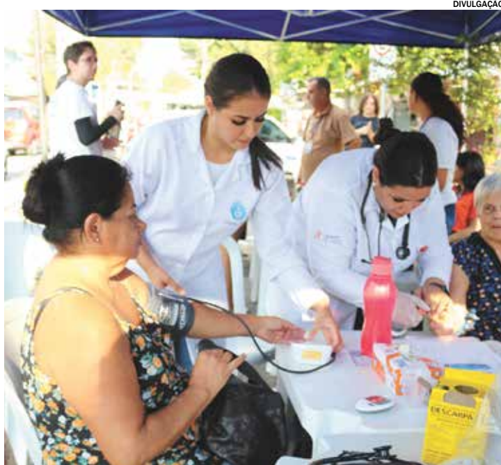
Hipertensão Arterial é uma doença que afeta mais de 30% da população

O objetivo da ação foi sensibilizar toda a população sobre a importância do diagnóstico e do tratamento da hipertensão arterial, também conhecida como pressão alta. Os estudantes de Enfermagem do Ceunsp estiveram presentes realizando aferição de pressão arterial, glicemia capilar e orientações diversas sobre os cuidados e prevenção destas doenças. Ao todo, mais de 230 pessoas receberam o